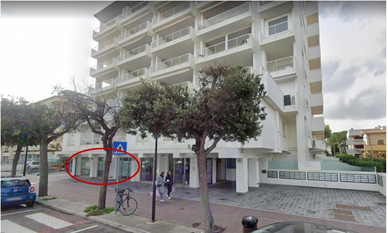
Inquadramento esterno individuazione/collocazione unità immobiliare commerciale