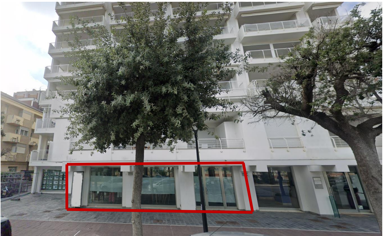
Vista esterna frontale