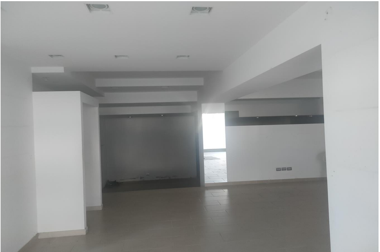
Zona commerciale e servizi