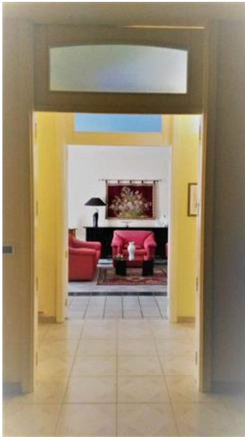
Foto del salotto visto dall'ingresso