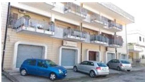
Foto prospetto su via Cupa

I beni sono ubicati in zona semicentrale in un'area residenziale, le zone limitrofe si trovano in un'area residenziale (i più importanti centri limitrofi sono Lecce). Il traffico nella zona è locale, i parcheggi sono sufficienti. Sono inoltre presenti i servizi di urbanizzazione primaria.