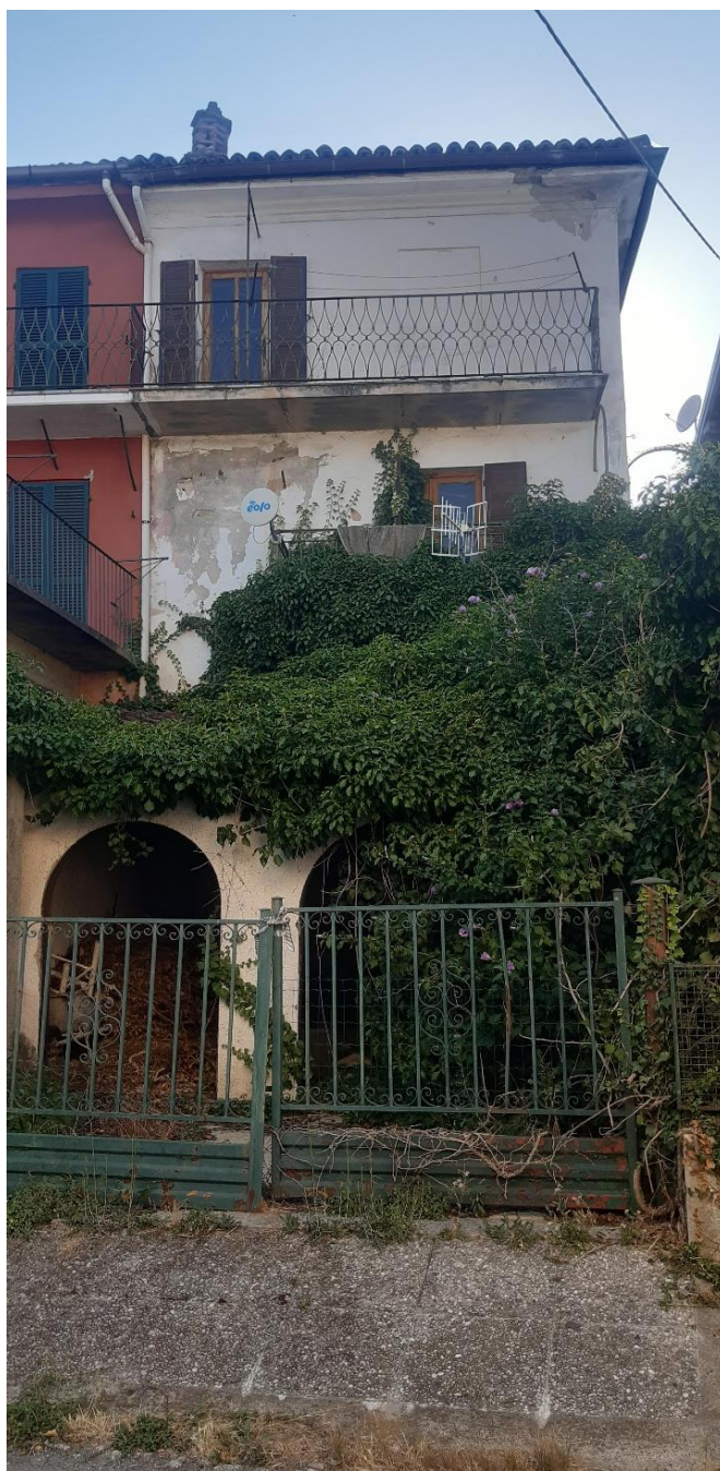
Vista generale dell'abitazione dal fronte strada Affaccio a valle