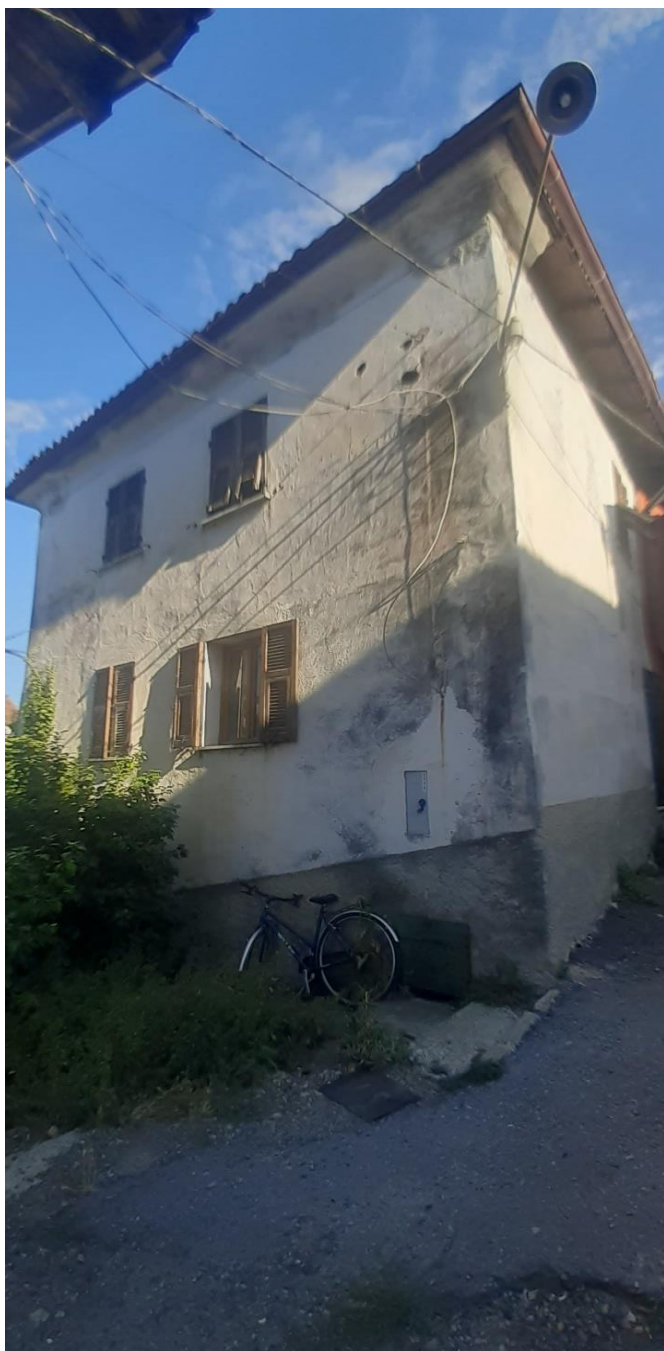
Vista generale dell'abitazione dal fronte strada Affaccio a monte