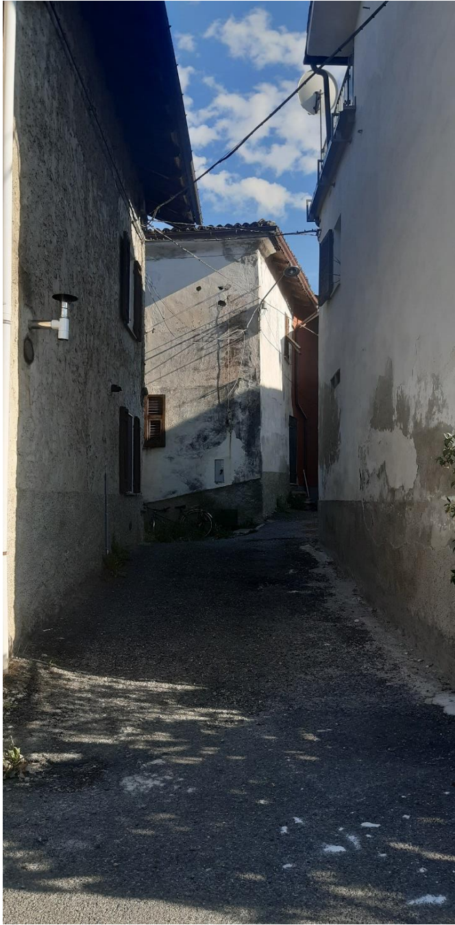
Inserimento nel contesto urbano della Frazione