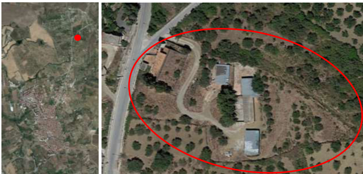
Coord. Geografiche del sito: Lat. 37.917269° Long. 13.819583°

L'immobile pignorato in oggetto, individuato dallo scrivente come Lotto 3, trovasi ubicato, come detto, nel territorio del Comune di Cerda (Pa), nella Contrada denominata "Serra Calcara - San Nicola". Posto nella zona Nord-Nord/Est del territorio, a circa 1,5 Km dal centro urbano, trattasi di un appezzamento di terreno di modeste dimensioni, con ivi insistenti tutta una serie di manufatti originariamente destinati a canile (come appresso dettagliatamente riportato e descritto). Vi si accede da una stradella che si dirama dalla sottostante e limitrofa Via Papa Giovanni XXIII e confina perimetralmente con altri terreni di proprietà aliena (meglio individuati nell'allegato stralcio catastale).