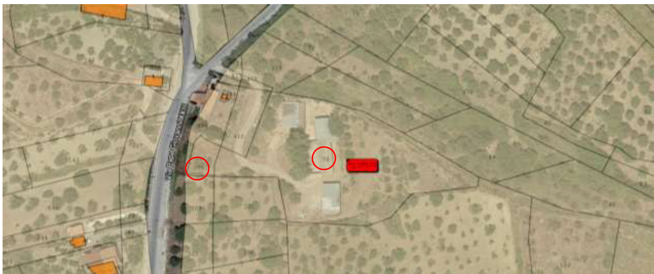
Sovrapposizione fg. di mappa catastale e Foto Google Earth

N.B: Si precisa che i manufatti A-B-C-D riscontrati in situ non risultano identificati catastalmente né riportati in mappa. Al riguardo si evidenzia che l’annotazione inserita nella visura storica della part.lla 70 (alla presente allegata) riporta l’indicazione di “ particella interessata da immobile urbano non ancora regolarizzato ” con l’indicazione della part.lla 499 (mappali fabbricati correlati). Infine, per completezza espositiva, si evidenzia che la part.lla 206 risulta ancora intestata ai Sigg. OMISSIS e OMISSIS (danti causa) e per la stessa bisognerà procedere alla relativa voltura per inserire gli effettivi intestatari.