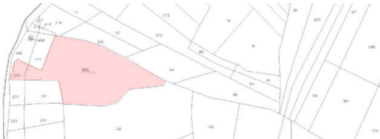
Stralcio foglio di mappa catastale (Fig. 3 - Part.lle 70-206)

N.B: Si precisa che il compendio pignorato de quo (part.lle 70 e 206) confina perimetralmente con le part.lle 209, 101, 102, 84, 319, 320, 410 e 459 (di proprietà aliena).