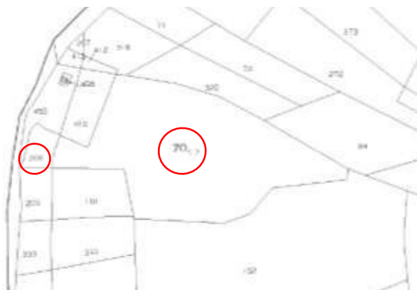
Stralcio foglio di mappa catastale