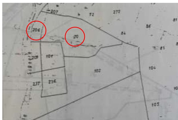
Stralcio fg. di mappa storico