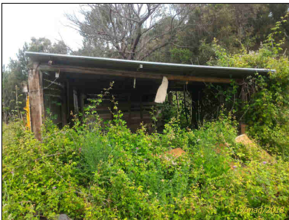
Foto n. 4 –Manufatto instabile/pericolante instabile presente sul fondo