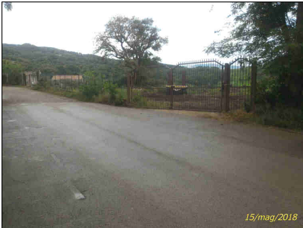
Foto n. 1 – Ingressi carrabile e pedonale al fondo oggetto del presente lotto