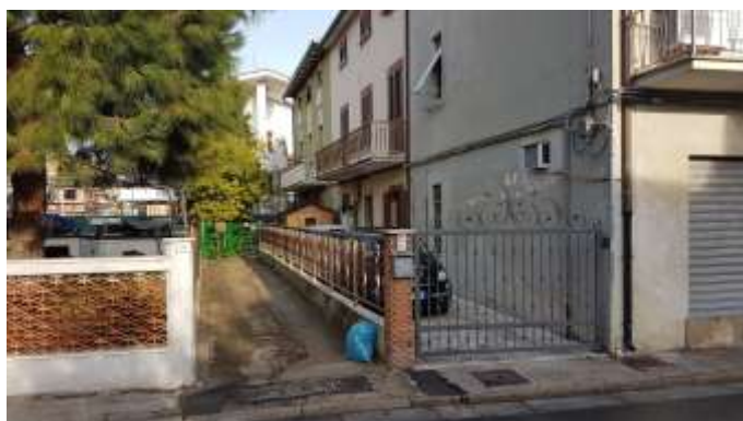
Corte di accesso alla proprietà

Le finiture del piano terra, quali pavimenti, rivestimenti e porte sono state recentemente sostituite. Completa la proprietà una corte esterna esclusiva di circa 112mq; tale corte in parte rappresenta la strada di accesso alla proprietà ed in parte è recintata ed utilizzata come spazio esterno esclusivo.