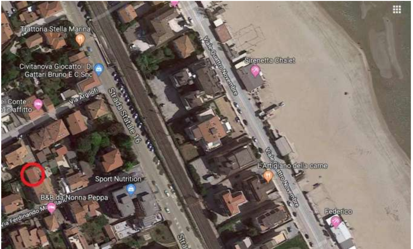
Inquadramento territoriale dell'immobile