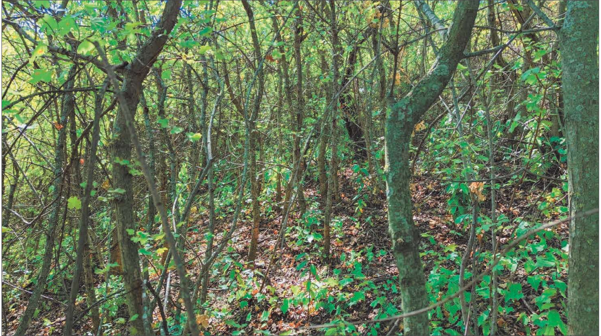
Figura 5: Bosco