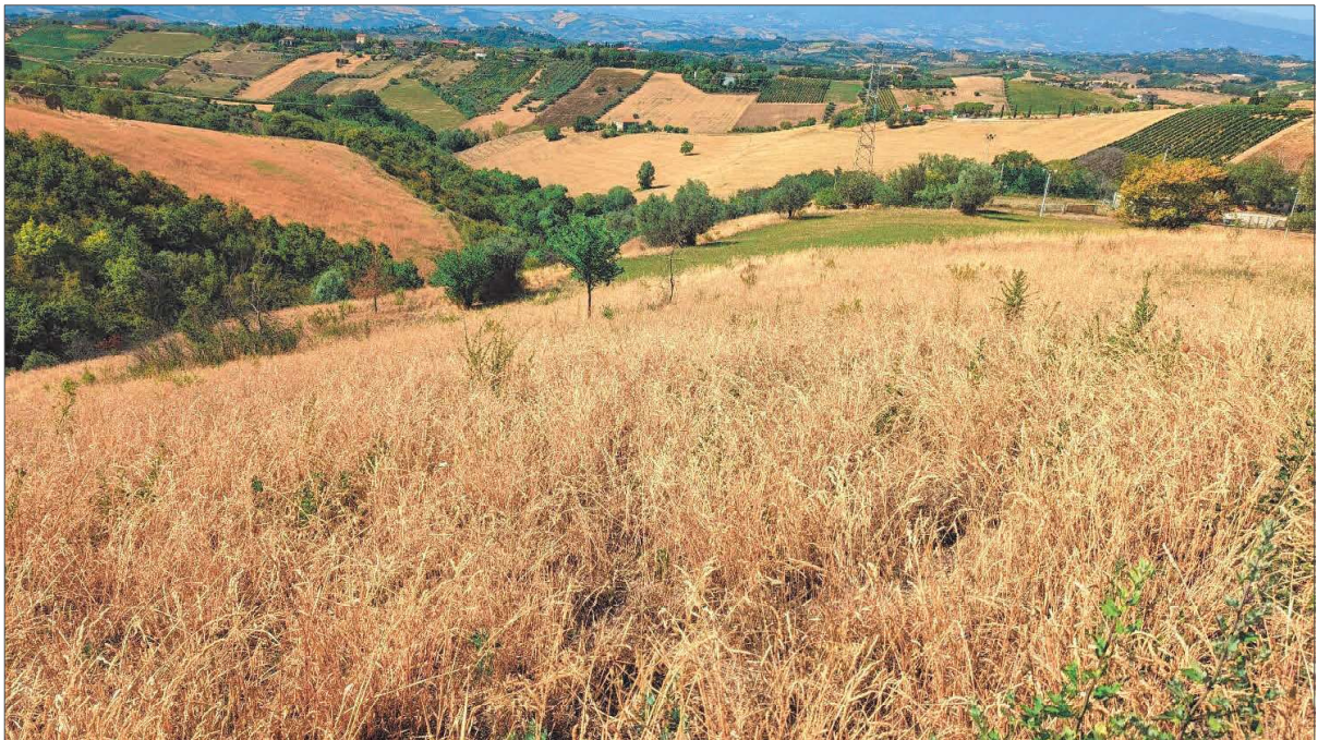
Figura 2: Seminativo confine sud-ovest