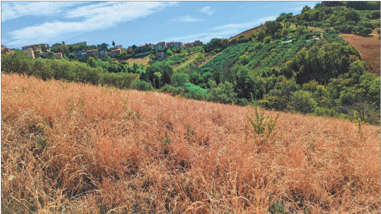
Figura 3: Seminatoio confine sud - est