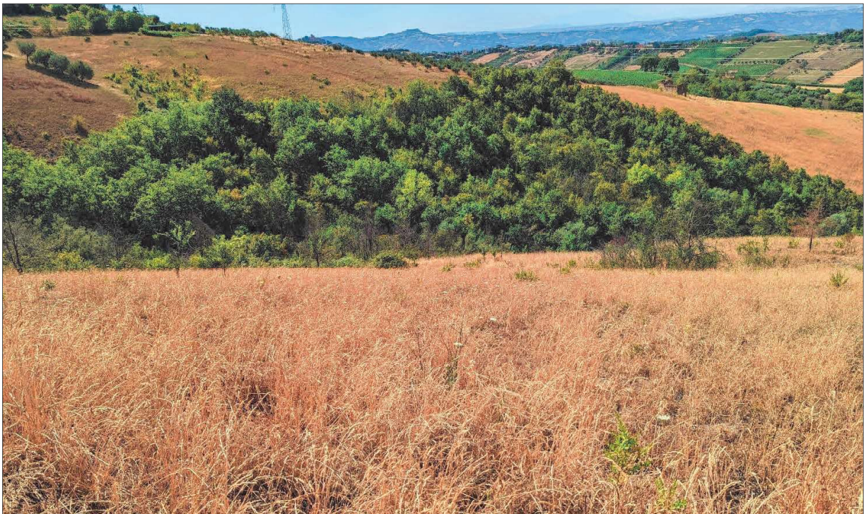
Figura 4: Seminatoio con invasione della vegetazione arborea e arbustiva