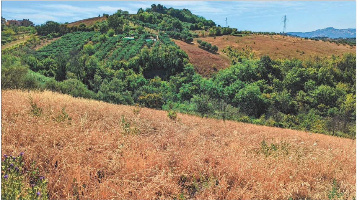
Figura 1: seminativo Fg 11 part. 781

Terreni sito in località Santa Caterina e Forola (Acquaviva Picena) identificati al fg.8 part.IIe 467-469-471 e fg.11 part.IIe 781-783