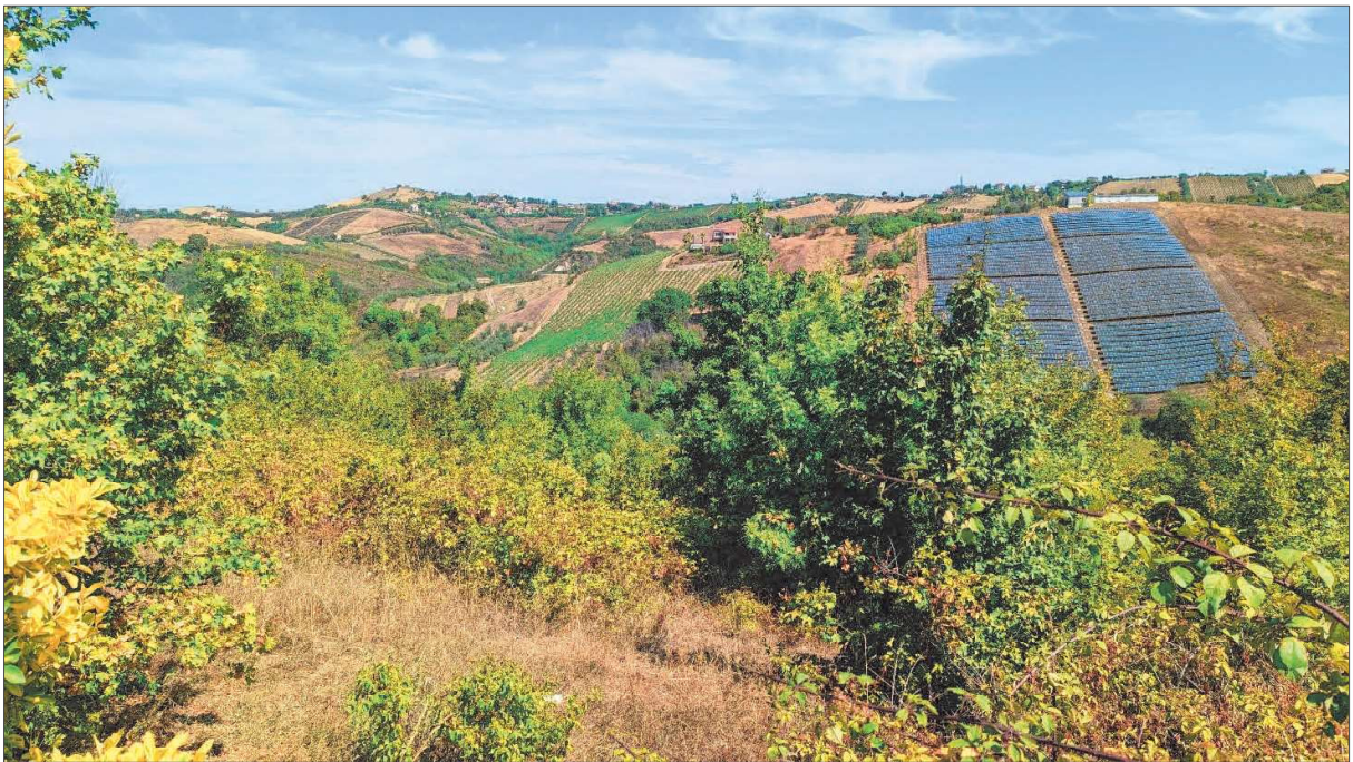
Figura 6: Bosco