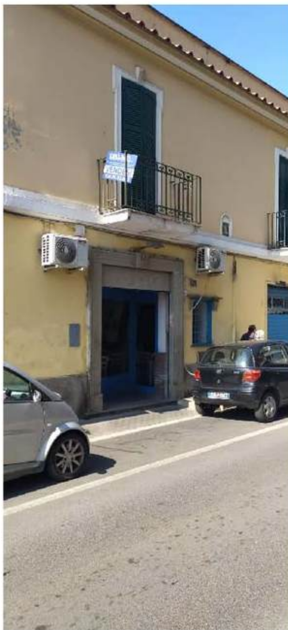
FOTO 9. Vista dell'entrata al negozio oggetto di perizia