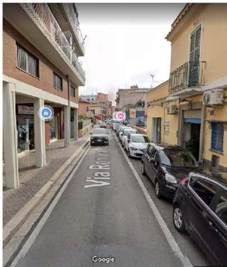
FOTO 6. Vista di via Romana verso Sud