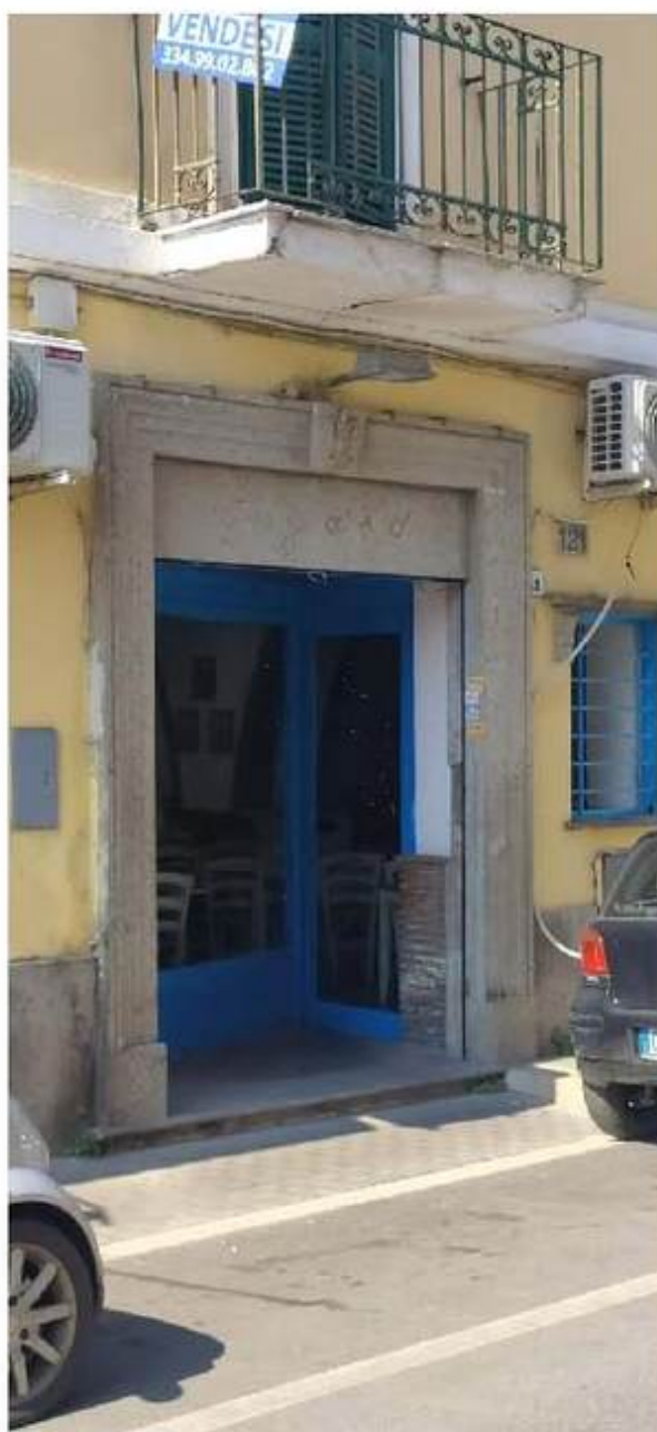
FOTO 8. Vista dell'entrata al negozio oggetto di perizia