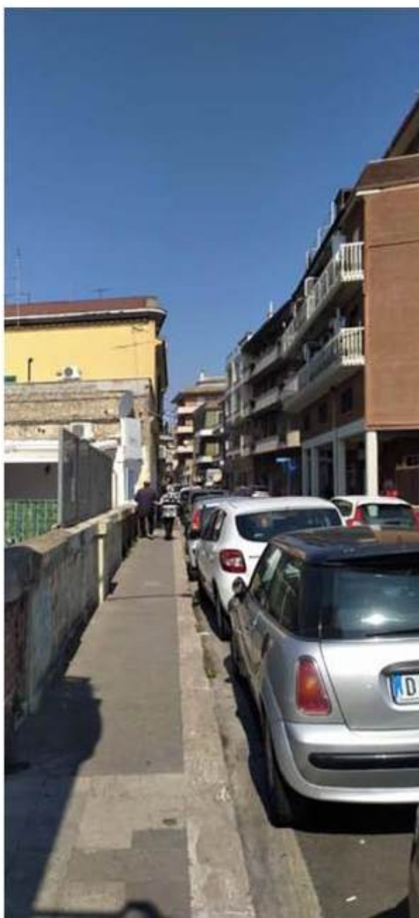
FOTO 5. Vista di via Romana verso Nord