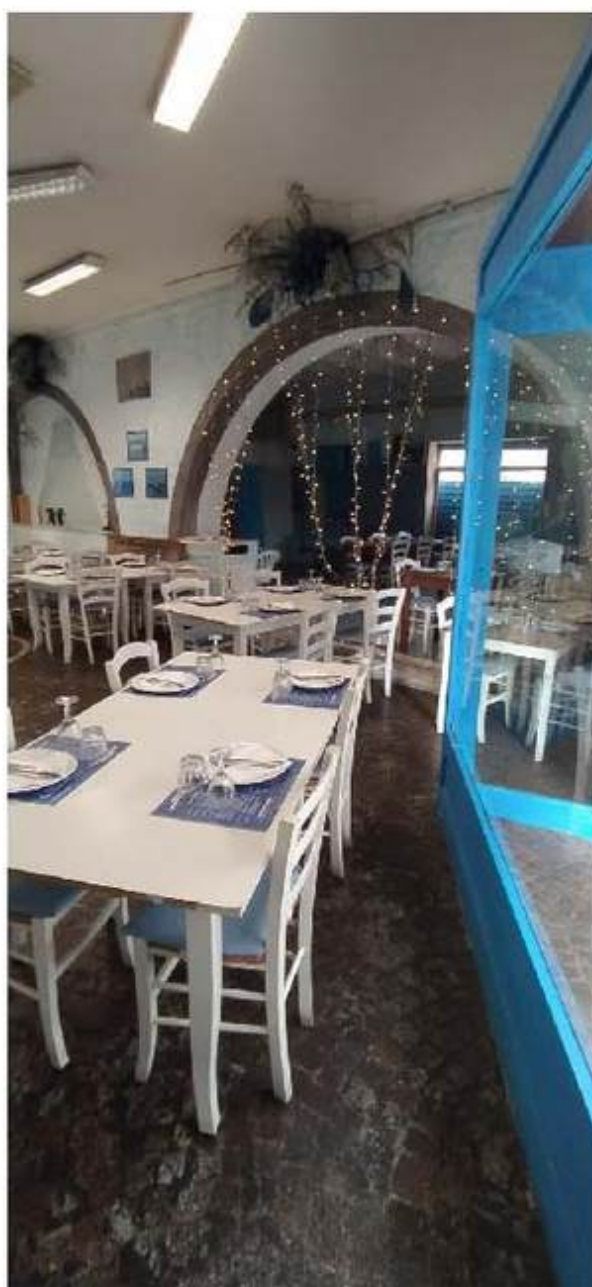
FOTO 12. Vista interna al negozio verso altra unità immobiliare