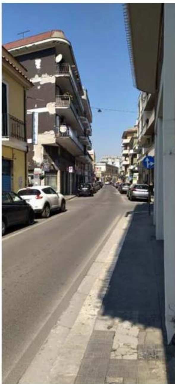
FOTO 4. Vista di via Romana verso Nord