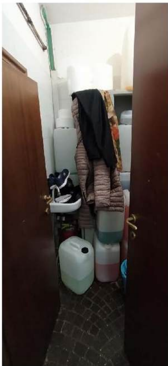
FOTO 14. Vista dell'antibagno