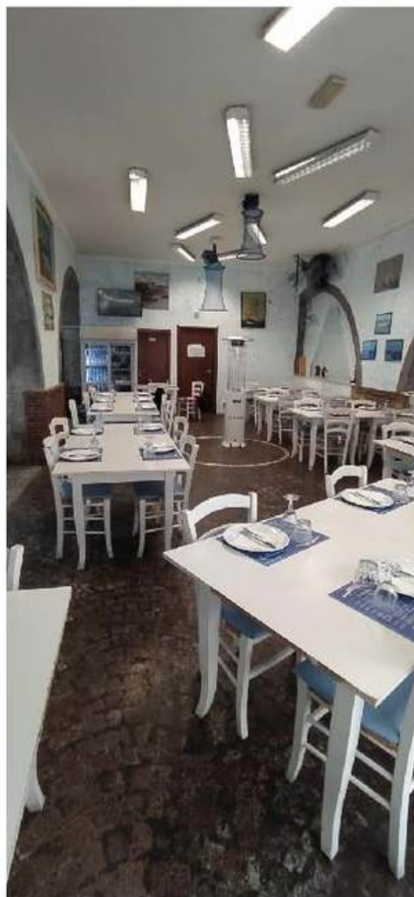
FOTO 13. Vista interna al negozio verso interno del locale