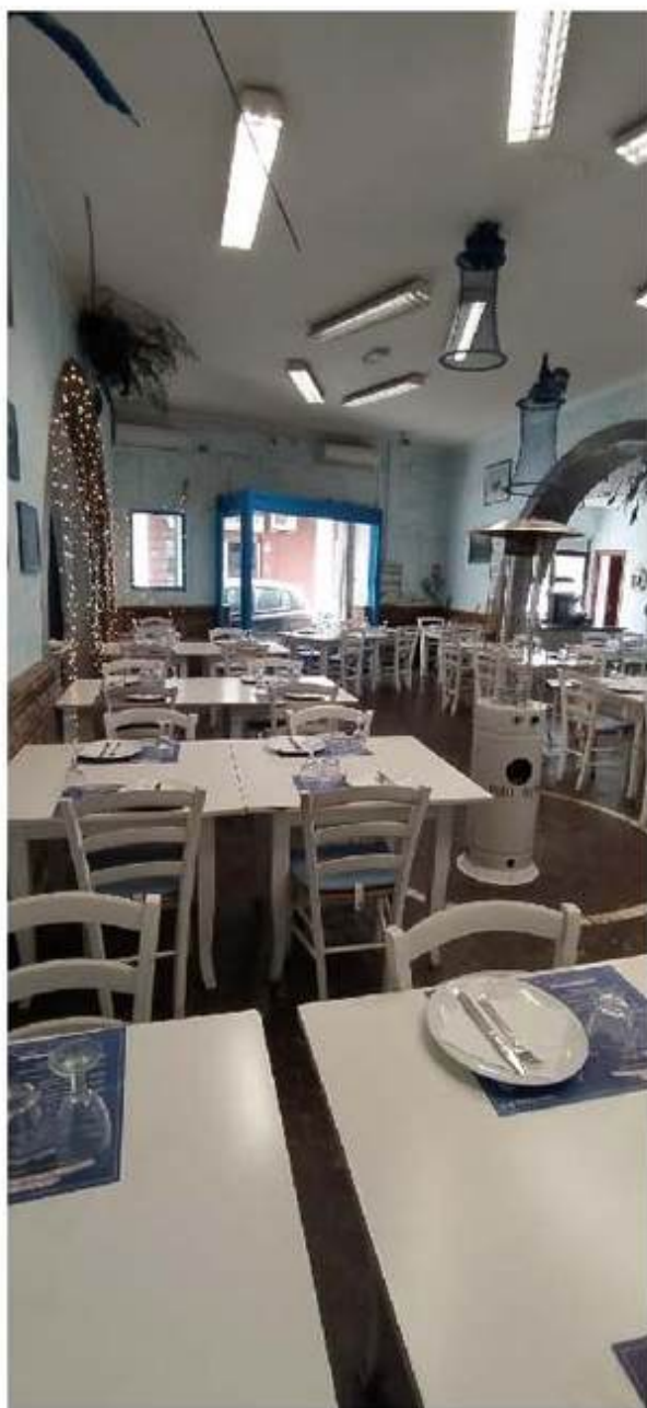
FOTO 10. Vista interna al negozio verso porta d'ingresso