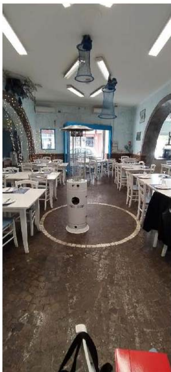
FOTO 11. Vista interna al negozio verso porta d'ingresso