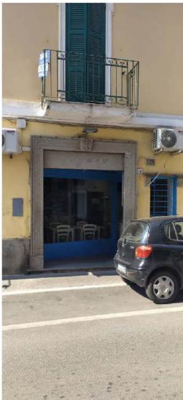
FOTO 7. Vista dell'entrata al negozio oggetto di perizia