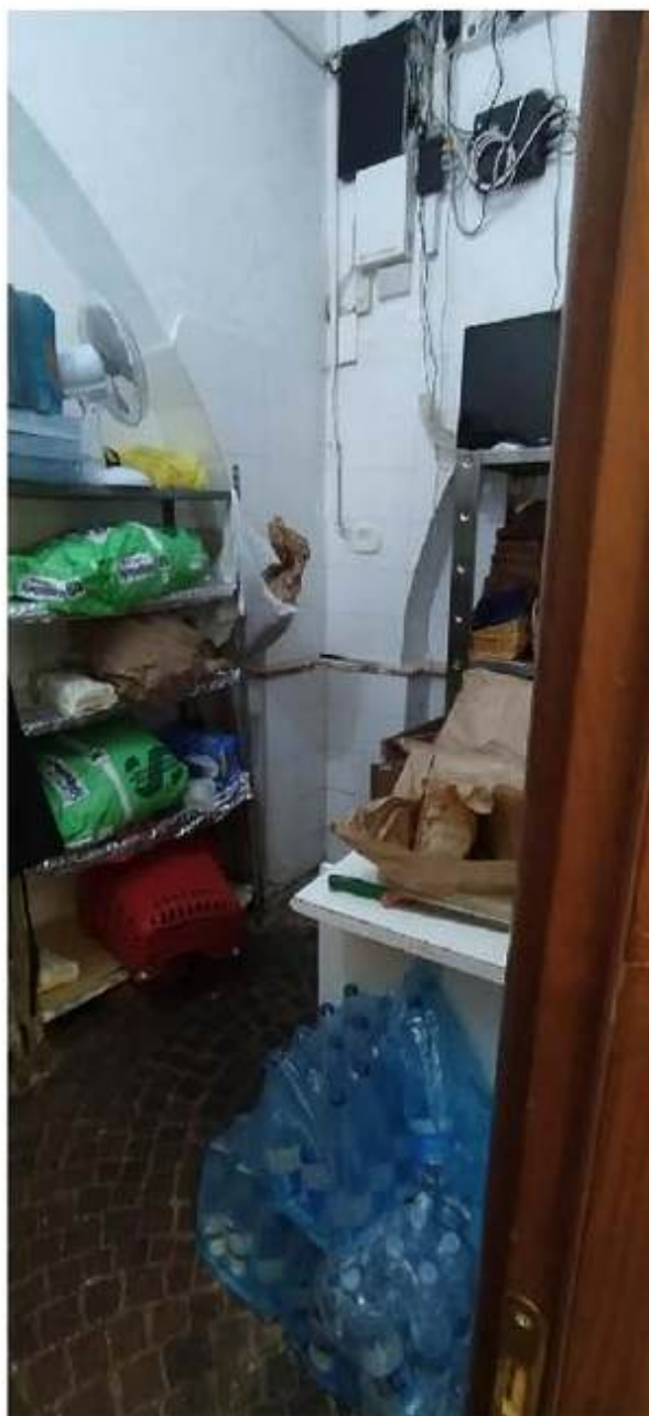
FOTO 15. Vista del ripostiglio