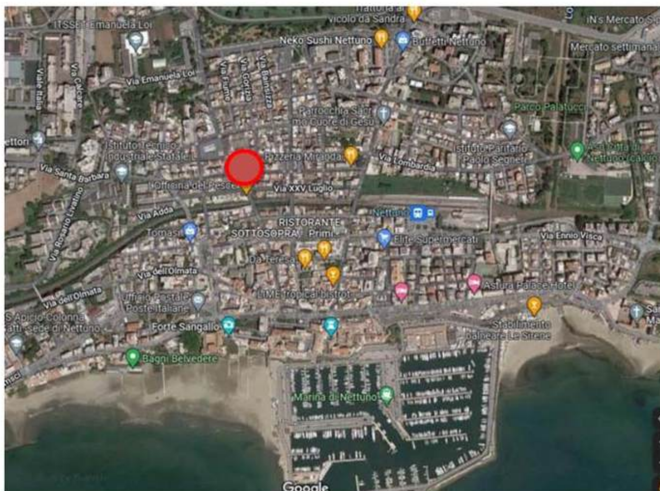
FOTO 1. Planimetria d'ubicazione