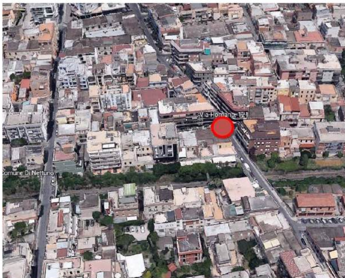
FOTO 3. Vista d'insieme del fabbricato verso Nord