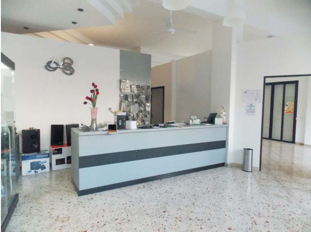
Foto A.4 Reception locale artigianale