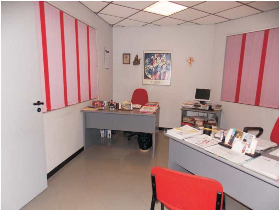
Foto A.17 Ufficio