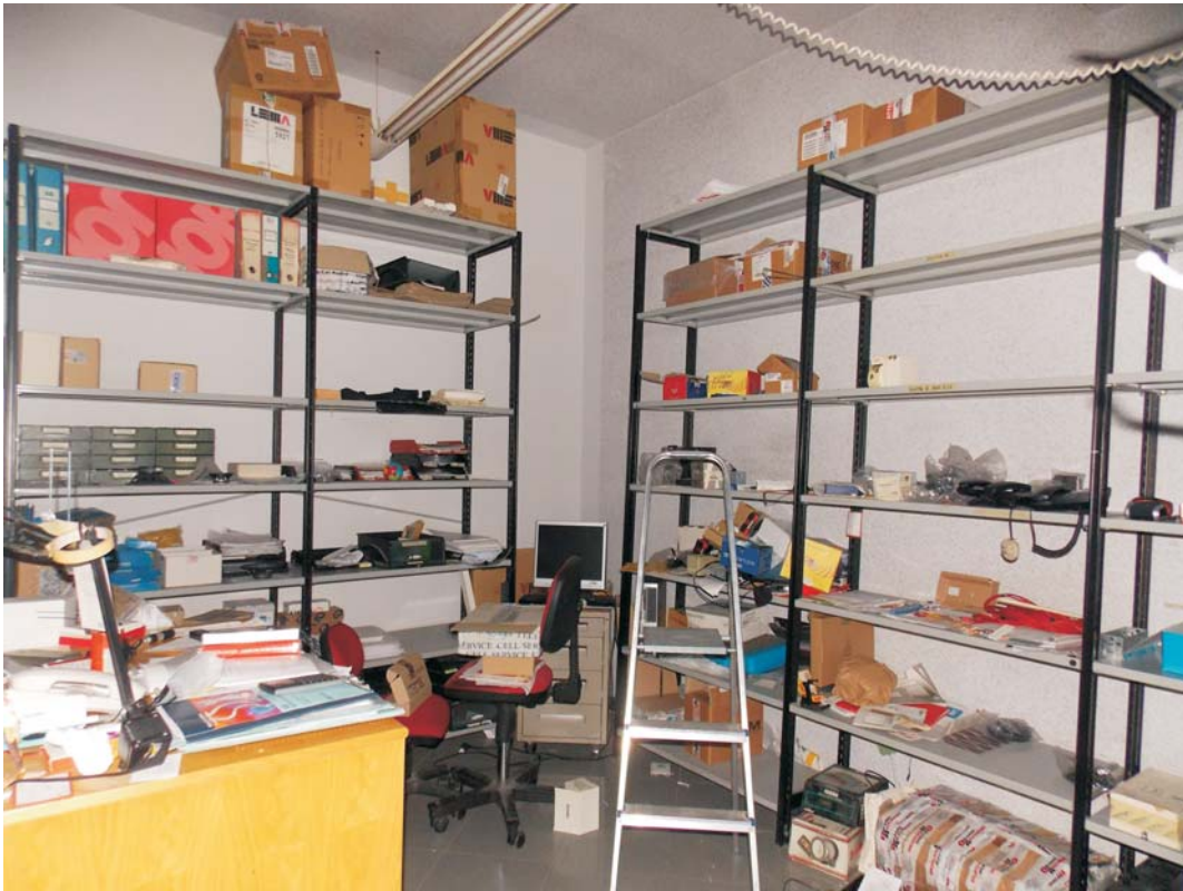
Foto A.15 Deposito