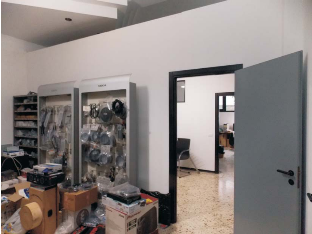
Foto A.5 Ufficio