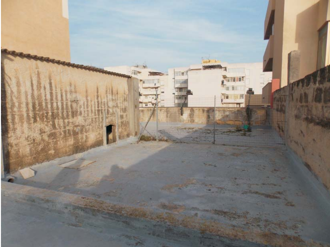
Foto A.22 Terrazzo