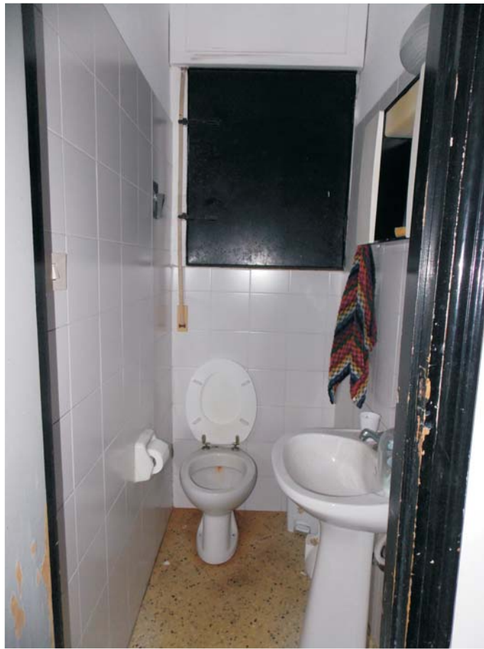
Foto A.9 Wc