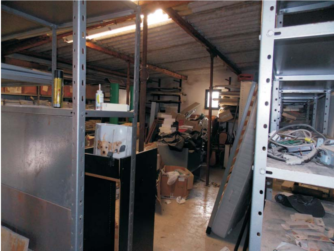
Foto A.21 Deposito