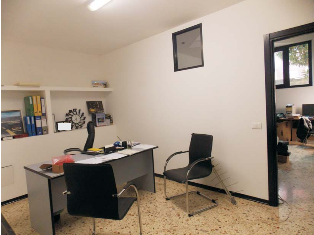
Foto A.6 Ufficio