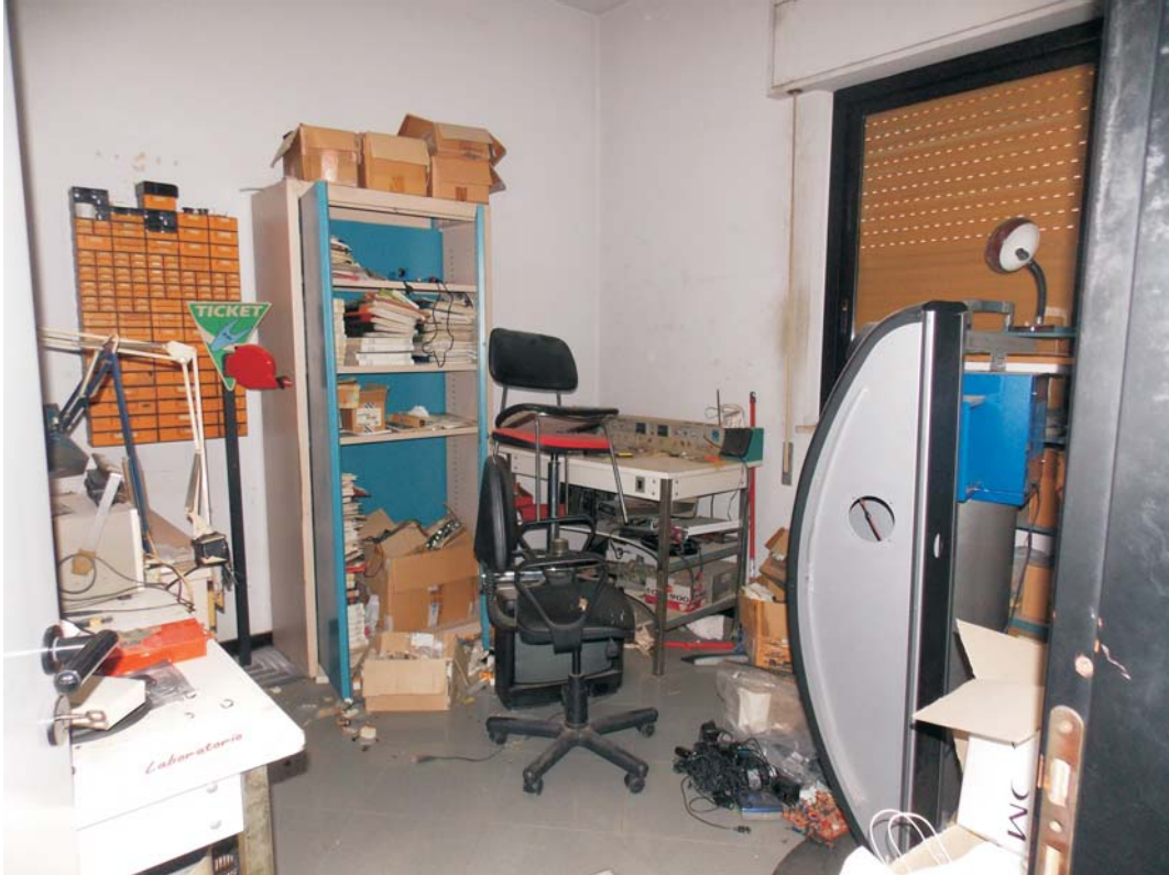
Foto A.20 Deposito