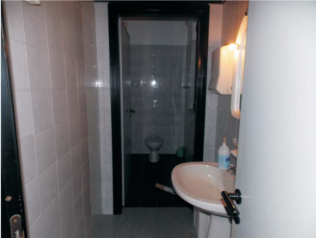
Foto A.19 Wc