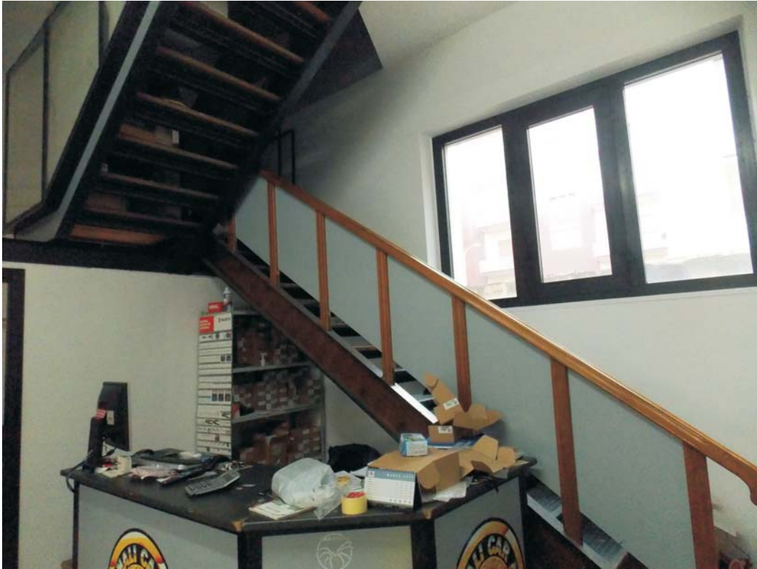
Foto A.3 Scala di collegamento interna