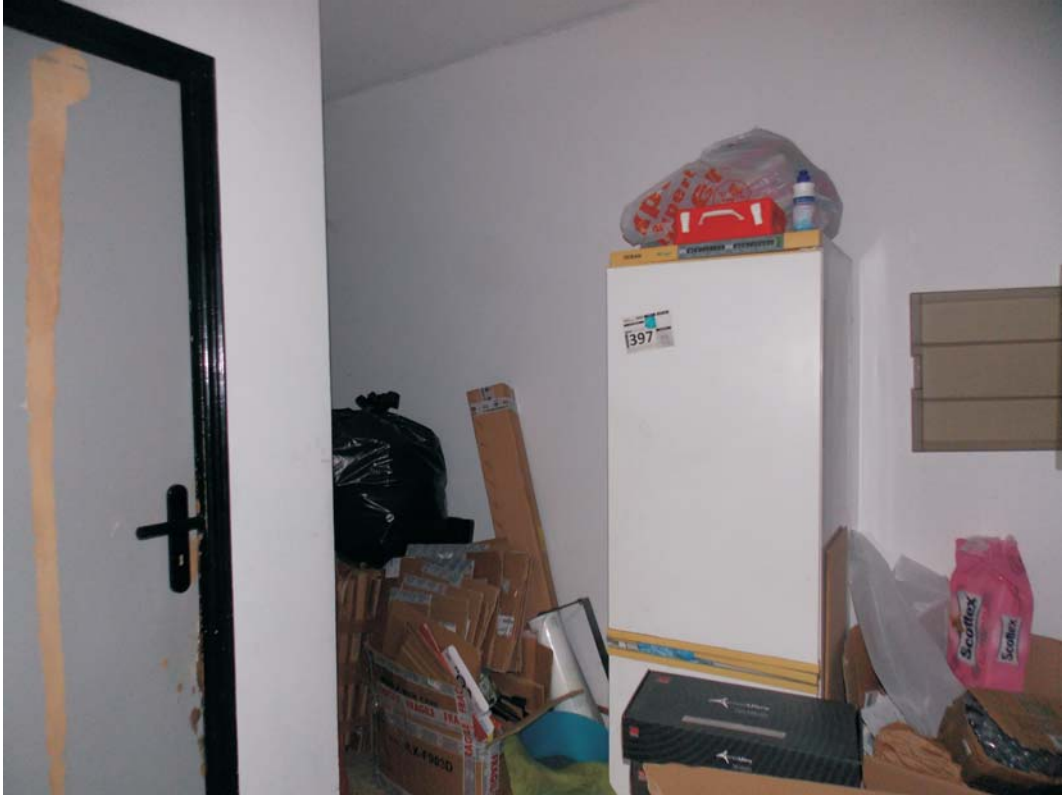
Foto A.8 Antibagno