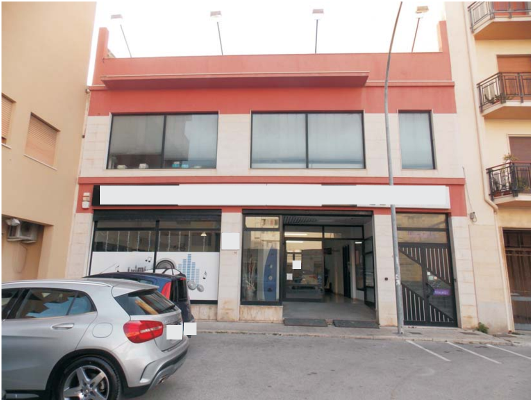
Foto A.1 Prospetto su piazza Aurelio Nicolodi