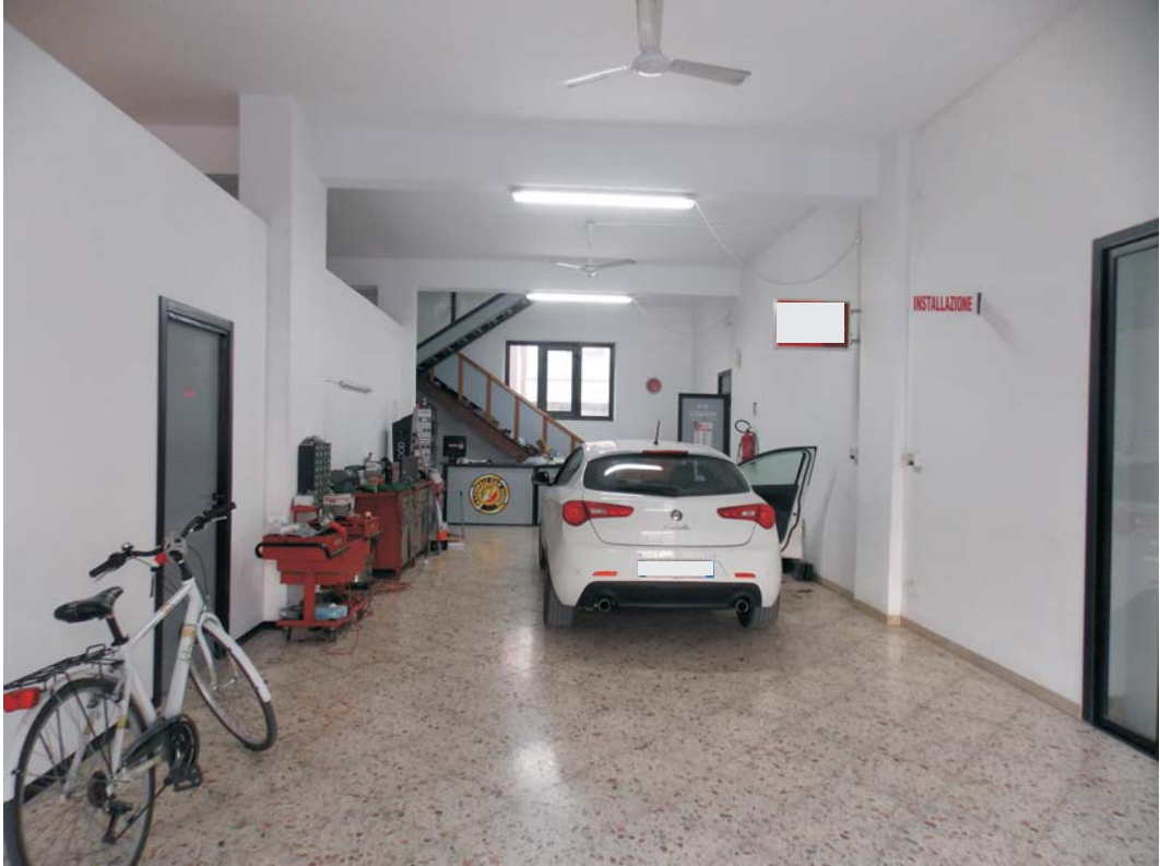
Foto A.2 Locale artigianale