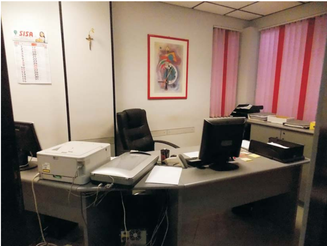
Foto A.18 Ufficio