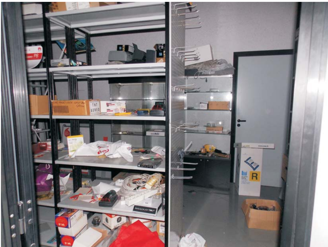
Foto A.16 Deposito