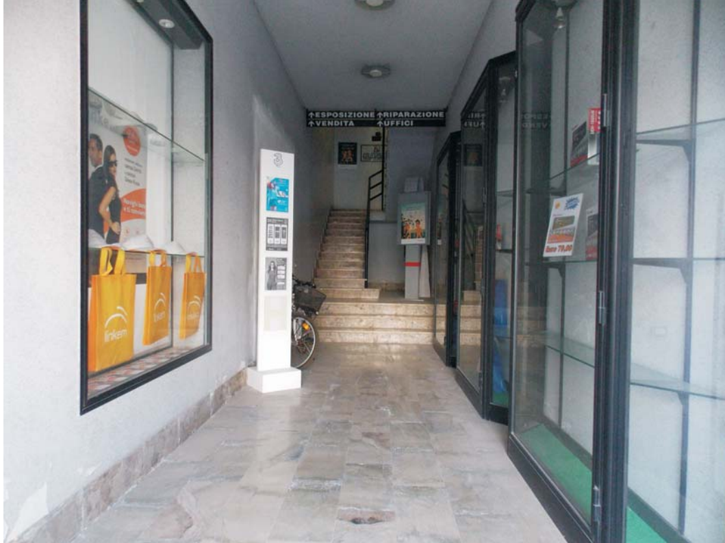
Foto A.10 Scala di collegamento con il piano superiore