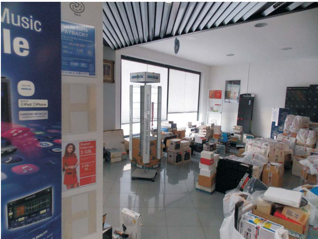
Foto A.12 Sala espositiva