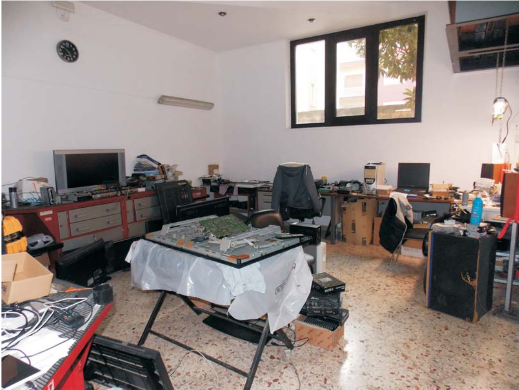
Foto A.7 Deposito