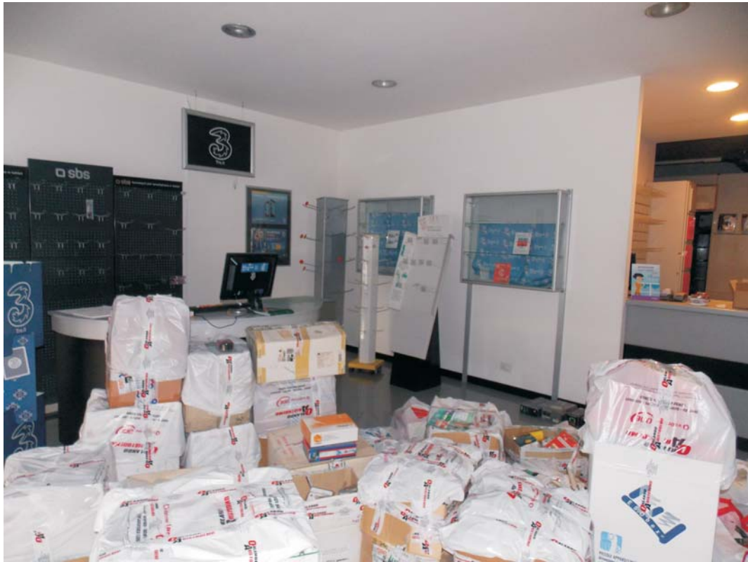
Foto A.13 Sala espositiva