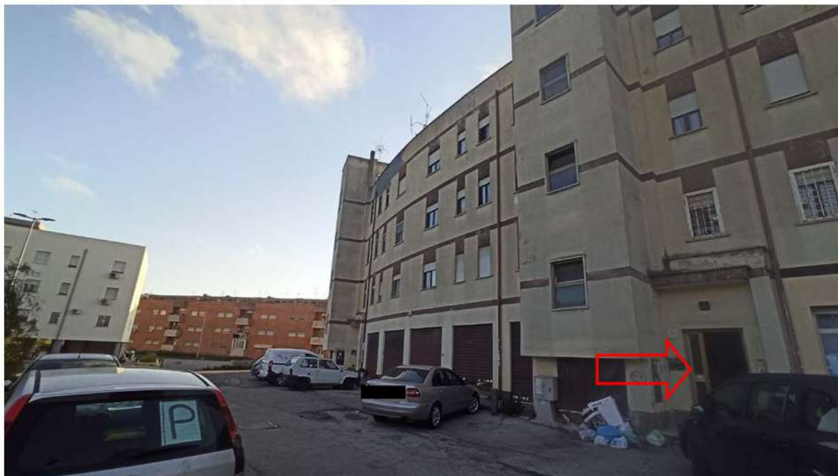
FOTO 1- ACCESSO CONDOMINIALE ALLA SCALA F