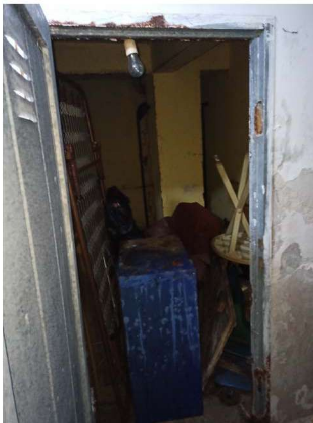
FOTO25 – CANTINA