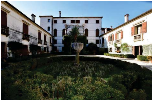
1. Prospetto interno palazzo con barchesse.