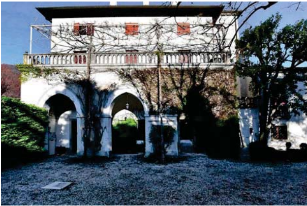
1. Prospetto interno sud.

LOTTO UNICO – Palazzo Lucheschi, prospetti interni a sud. VITTORIO VENETO (TV) Via Cavour, 111.