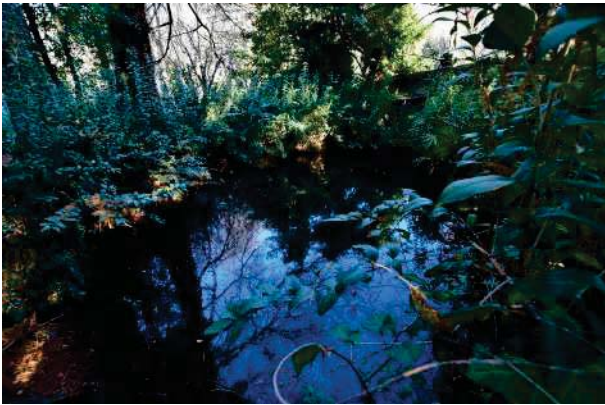
7.Parco del palazzo, parte est (7 di 34).