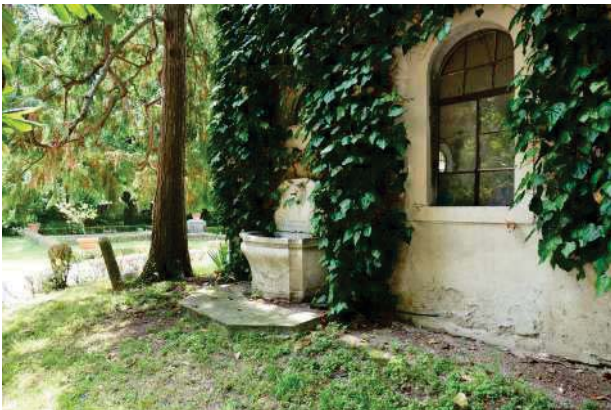
15.Parco del palazzo, parte est (15 di 34).