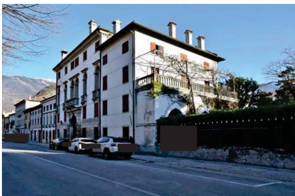
4. Prospettiva verso nord.