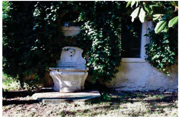
14.Parco del palazzo, parte est (14 di 34).