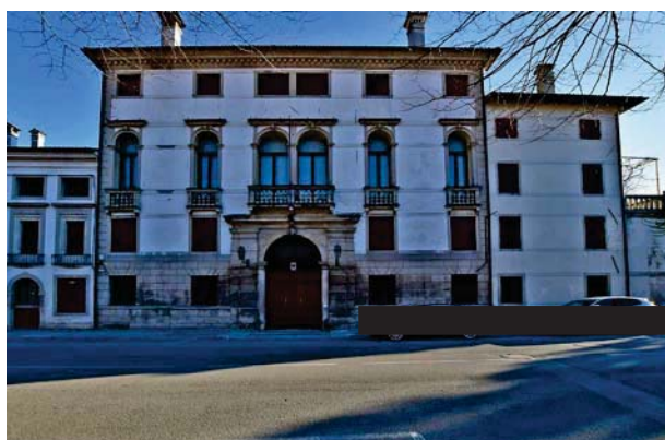
5. Prospetto principale (1 di 3).