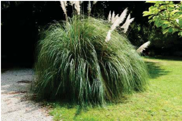
19. Parco del palazzo, parte est (19 di 34).