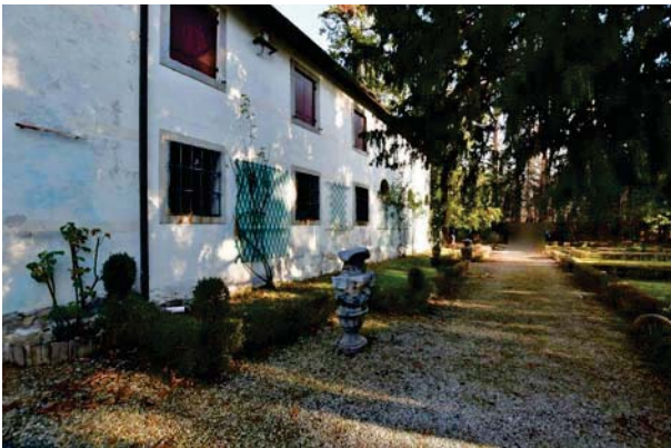
3. Prospettiva verso est.