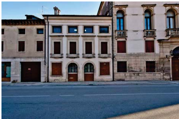
7. Prospetto principale (3 di 3).