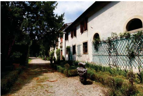
5. Prospettiva verso ovest (2 di 2).