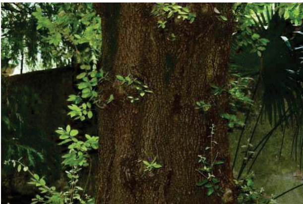
21. Parco del palazzo, parte est (21 di 34).