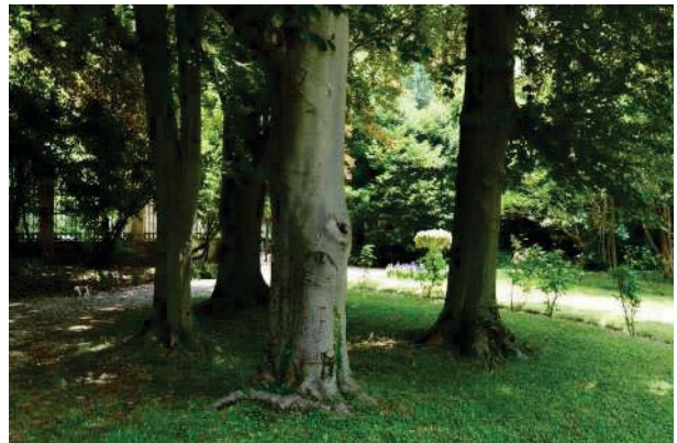
20. Parco del palazzo, parte est (20 di 34).