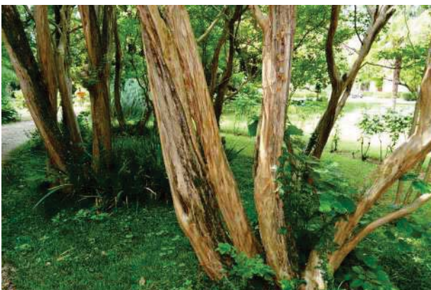
23. Parco del palazzo, parte est (23 di 34).