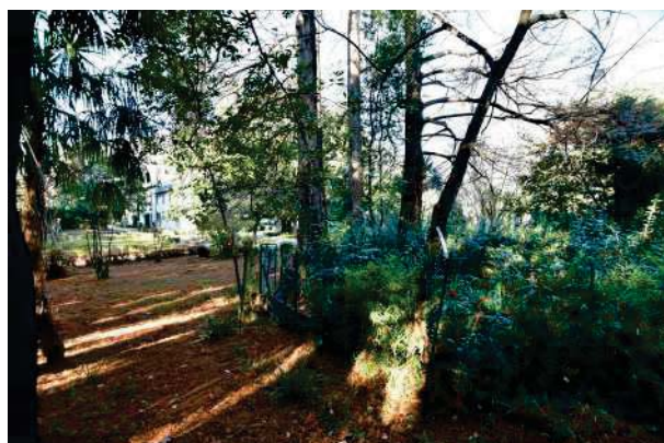
6. Parco del palazzo, parte est (6 di 34).