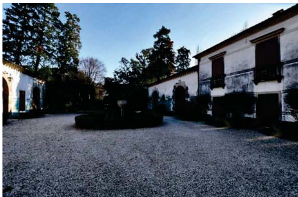
8. Prospettiva interna barchessa a sud.