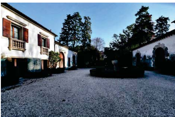
6. Prospettiva interna barchessa nord (1 di 2).