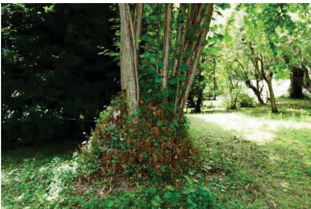
17.Parco del palazzo, parte est (17 di 34).