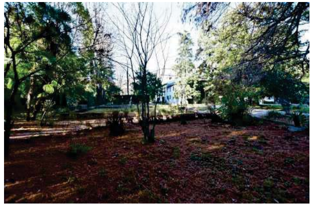
8.Parco del palazzo, parte est (8 di 34).