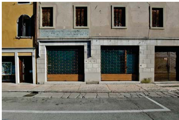
8. Prospetto negozi.