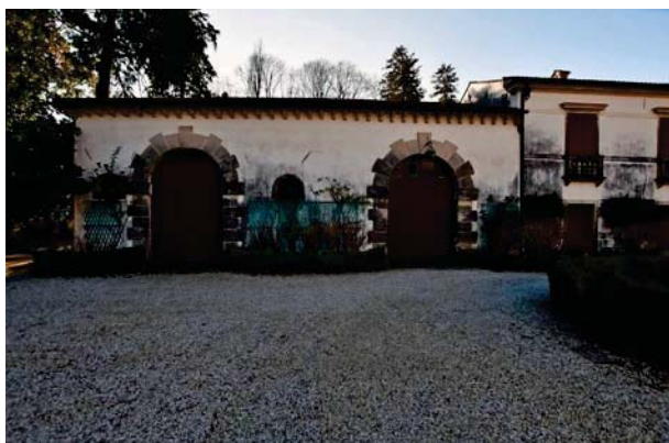
9. Prospetto interno barchessa sud scuderia e autorimessa (1 di 2).