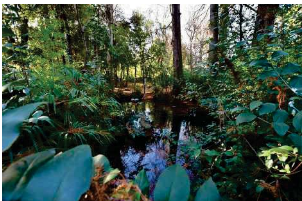
3. Parco del palazzo, parte est (3 di 34).