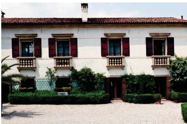
4. Prospetto interno barchessa nord.