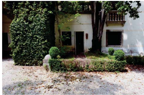
2. Ingresso caldaia a sud.