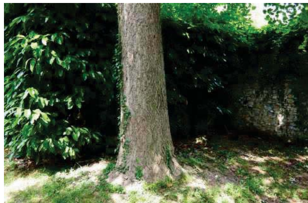
18.Parco del palazzo, parte est (18 di 34).