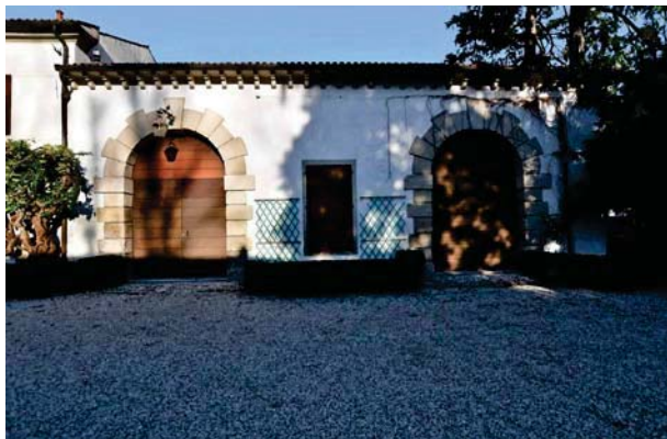
7. Prospetto interno barchessa nord (sala da ballo).