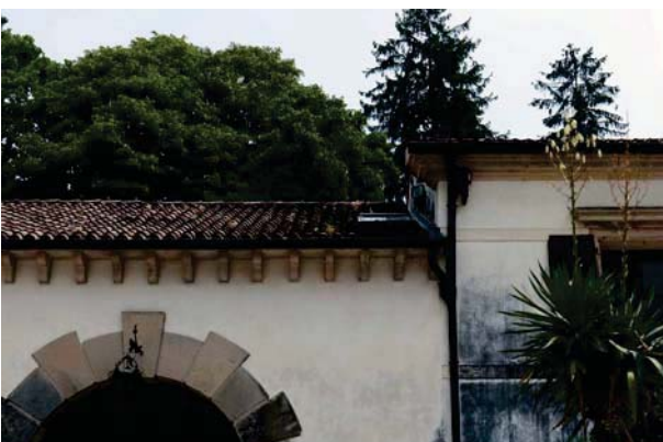
12. Prospetto interno barchessa sud, dettaglio.