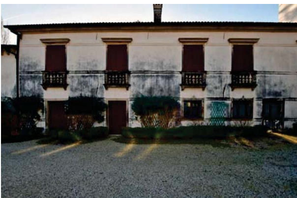
10. Prospetto interno barchessa sud (2 di 2).