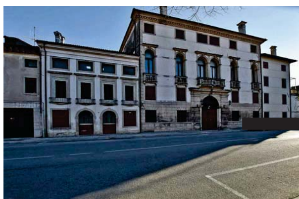
6. Prospetto principale (2 di 3).