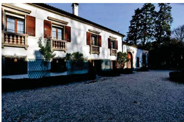
5. Prospettiva interna barchessa nord (1 di 2).