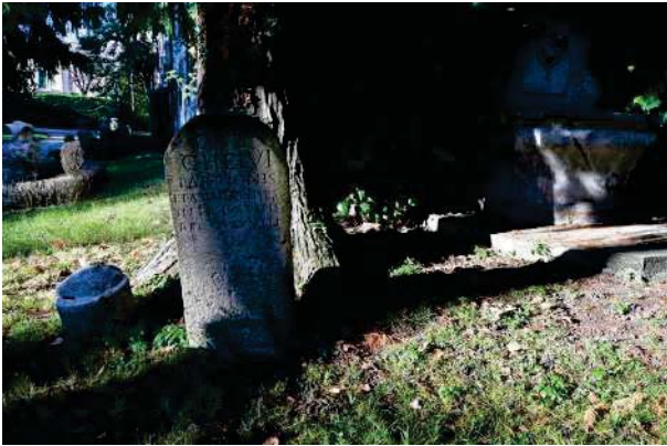
13.Parco del palazzo, parte est (13 di 34).

LOTTO UNICO – Parco del Palazzo Lucheschi, parte est. VITTORIO VENETO (TV) Via Cavour, 111.