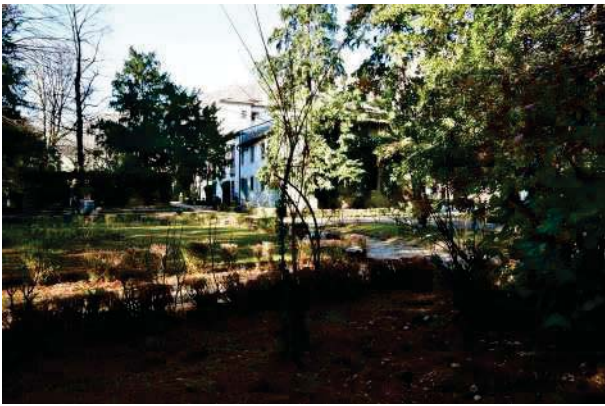
9.Parco del palazzo, parte est (9 di 34).