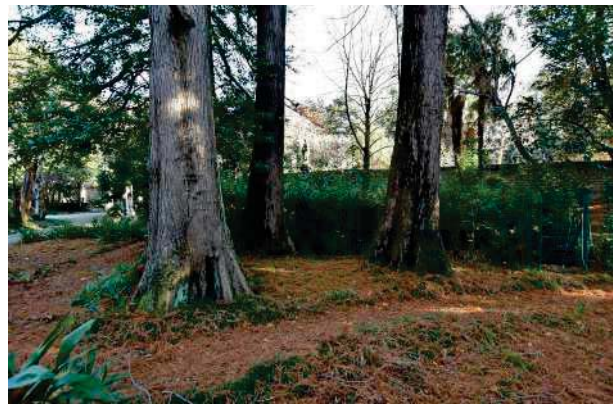
10.Parco del palazzo, parte est (10 di 34).