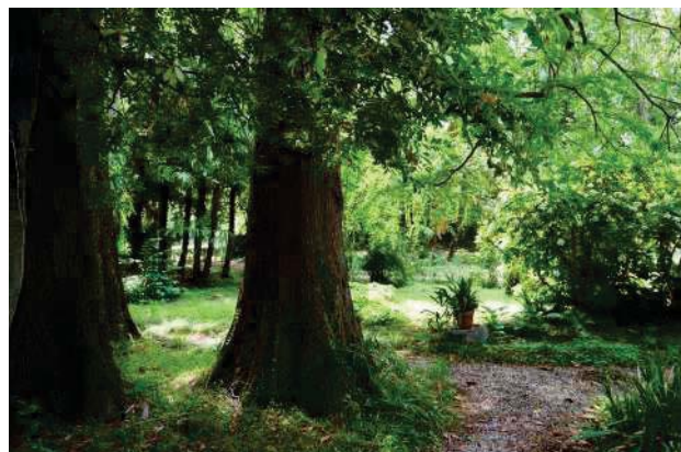
24. Parco del palazzo, parte est (24 di 34).