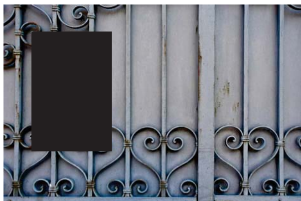
2. Via Cavour, ingresso carrabile autorizzato.