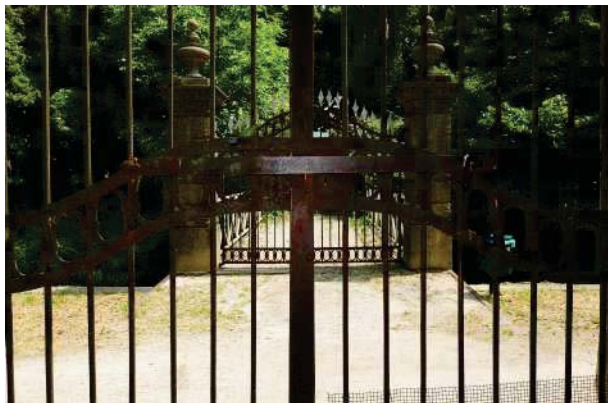
1. Parco del palazzo, parte est (1 di 34).