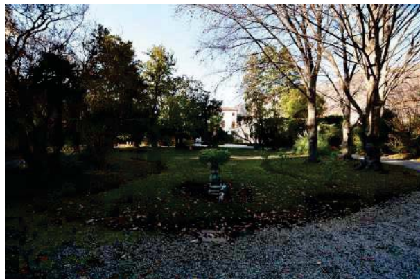
2. Parco del palazzo, parte est (2 di 34).