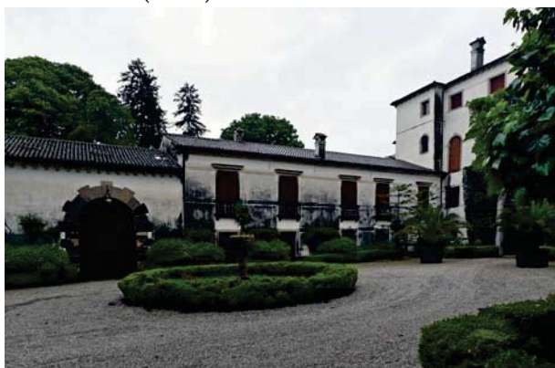
11. Prospettiva interna barchessa sud.