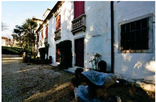
4. Prospettiva verso ovest (1 di 2).