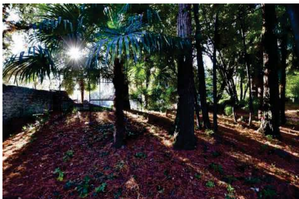
5. Parco del palazzo, parte est (5 di 34).