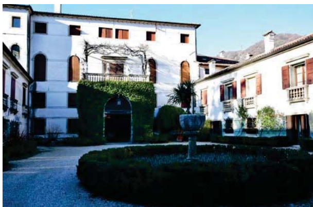
3. Prospetto interno palazzo e barchessa nord.