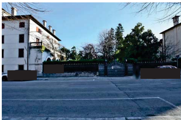
3. Prospetto giardino a sud ed ingresso carrabile.