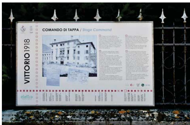
1. Via Cavour, pannello illustrativo.