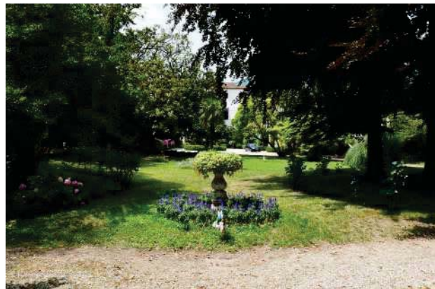
22. Parco del palazzo, parte est (22 di 34).