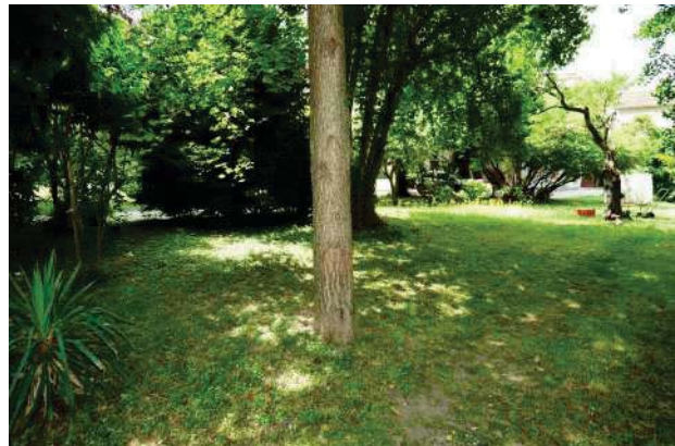
16.Parco del palazzo, parte est (16 di 34).