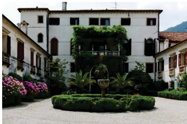
2. Prospetto interno palazzo.