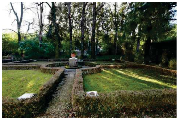
12.Parco del palazzo, parte est (12 di 34).