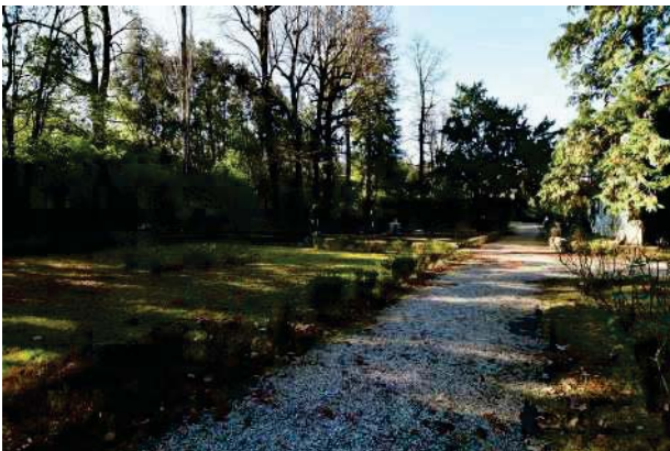
11.Parco del palazzo, parte est (11 di 34).