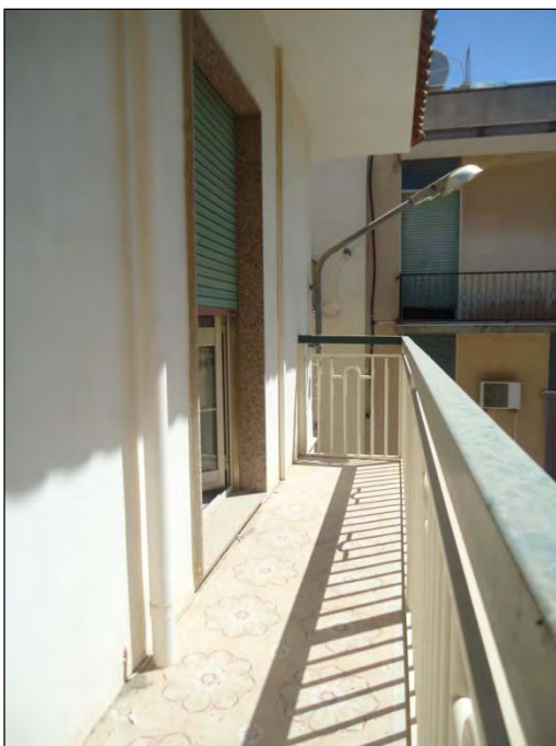
Foto n. 18 - Balcone 2 ad est