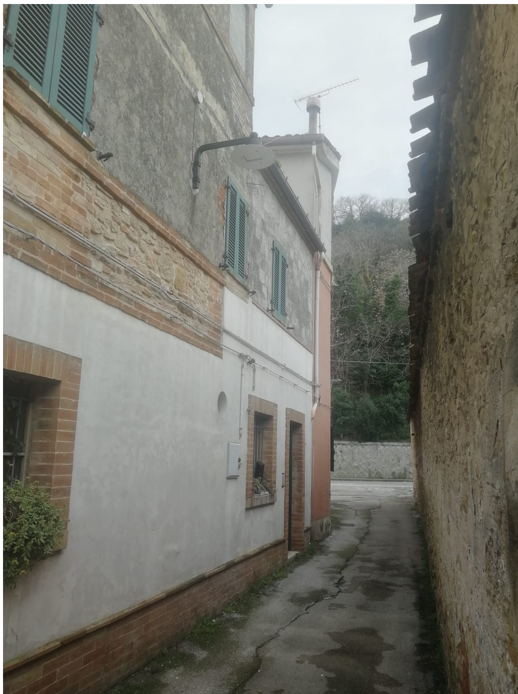
vista 1 su via della Fornace (verso ovest)