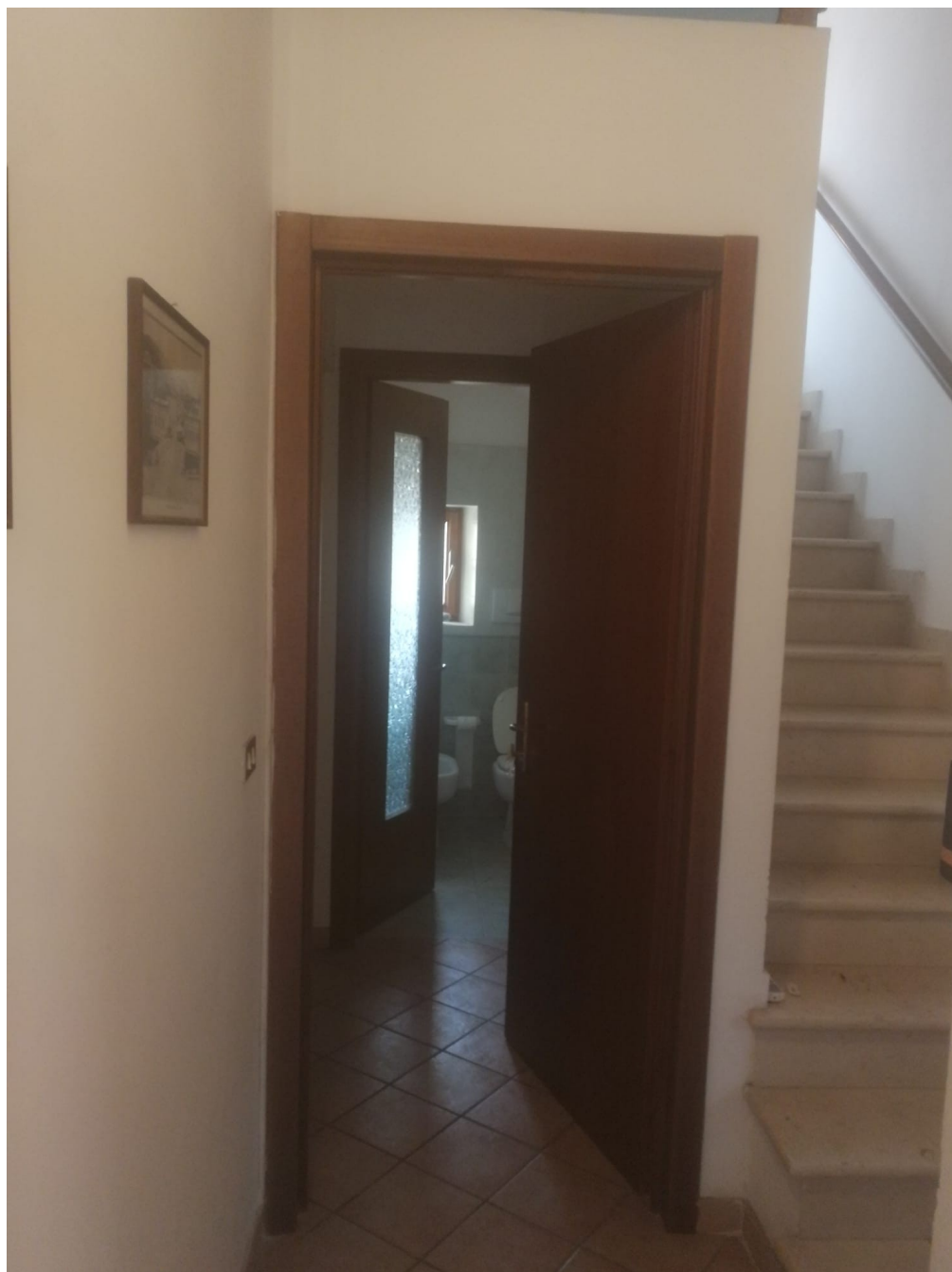
vista 3 – ingresso al piano primo