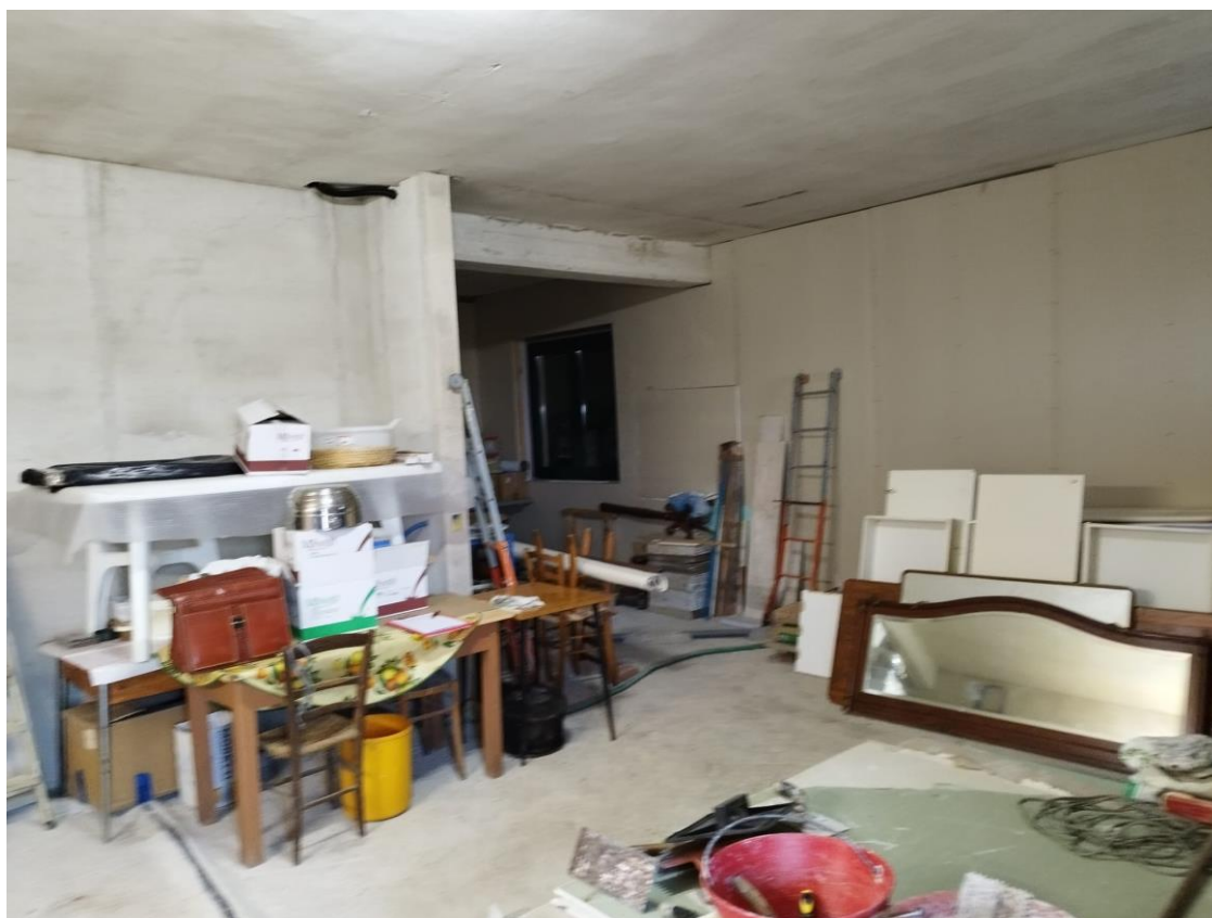
VISTA N.2 F.124 p.lla 94 sub 3 (cucina w.c e ripostiglio al piano terra ancora in corso di completamento)

STUDIO TECNICO ING. FRANCESCO CICCALÈ VIALE DELLA REPUBBLICA 18 - 63814 TORRE S. PATRIZIO (FM) Tel e fax: +390734510184 CELL. +393332523636, C.F.: CCCFNC63L06L279Q P.I.: 01516120449 E-MAIL: francescobiccale1@gmail.com