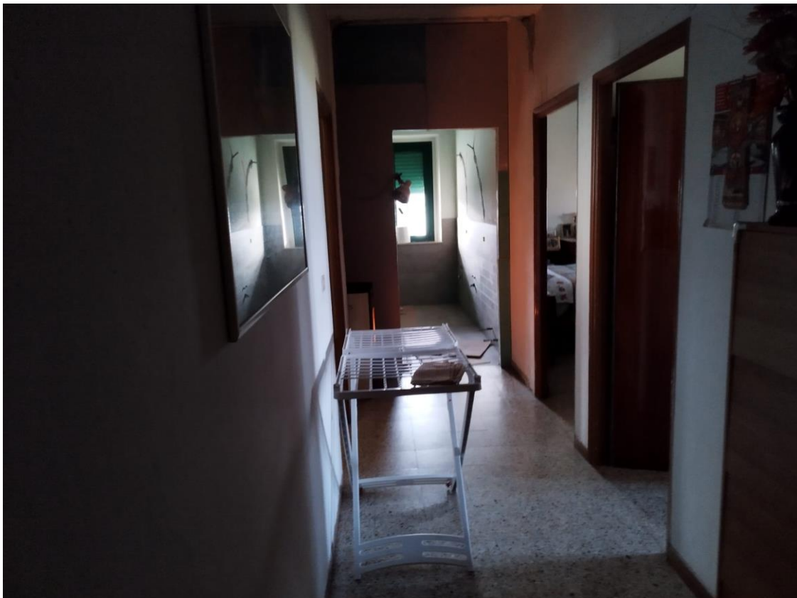
VISTA N.4 F.124 p.lla 94 sub 3 (piano primo corridoio attualmente esistente)