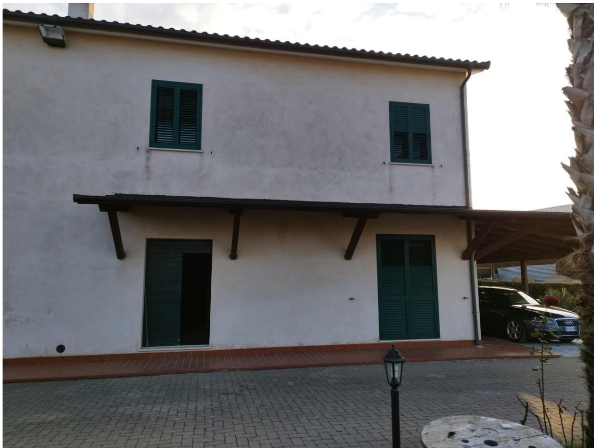
VISTA N.1 Vista esterna fabbricato F.124 PLLA 94 sub. 3 con pensilina, pergola e ingresso;