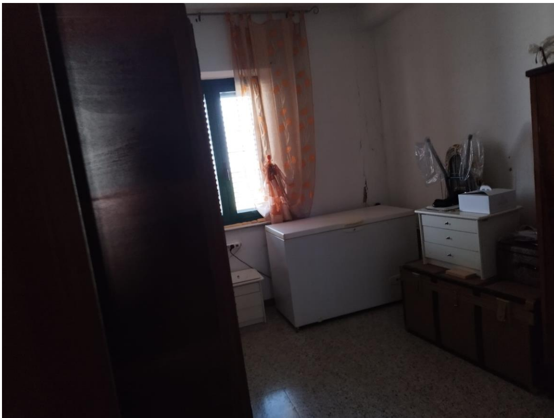
VISTA N.5 Ripostiglio al piano primo;