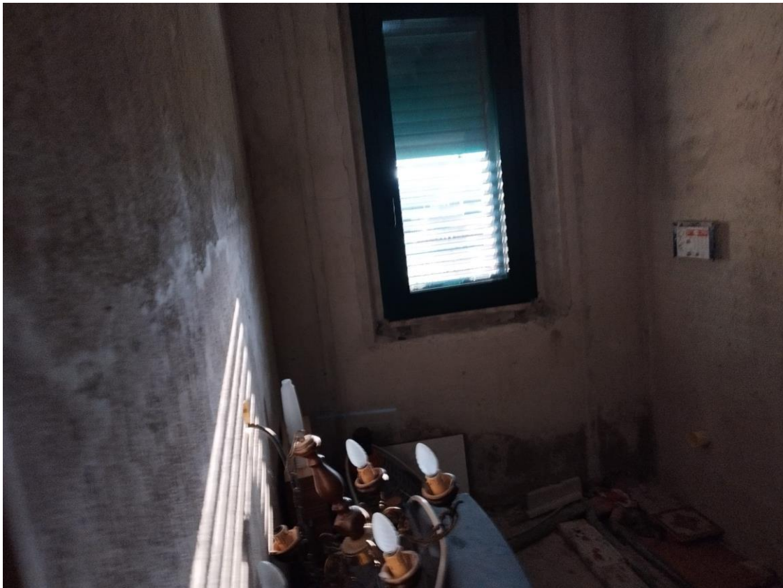
VISTA N.3 F.124 p.lla 94 sub 3 (stanza al piano primo in corso di sistemazione)