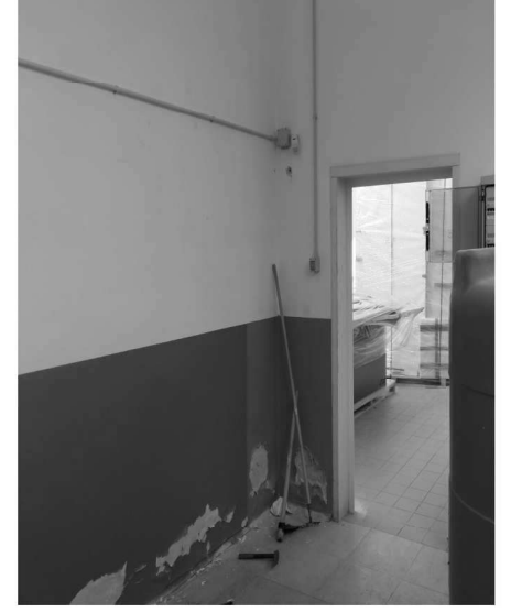
Figura 27 – Ripresa 25: Ex Ufficio - autoclave