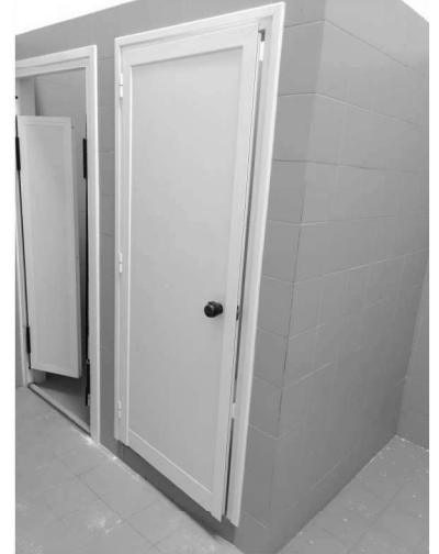
Figura 21 – Ripresa 19: Vista Wc e doccia