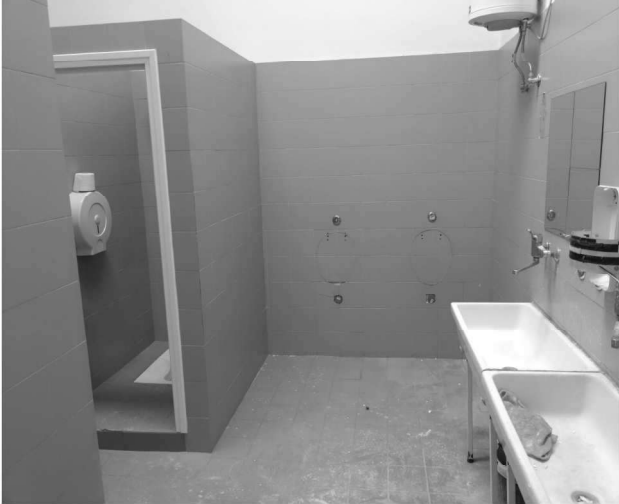
Figura 19 – Ripresa 17: Scorcio vista lavelli – prese orinatoio – wc