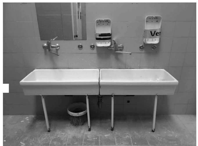
Figura 18 – Ripresa 16: Vista lavelli