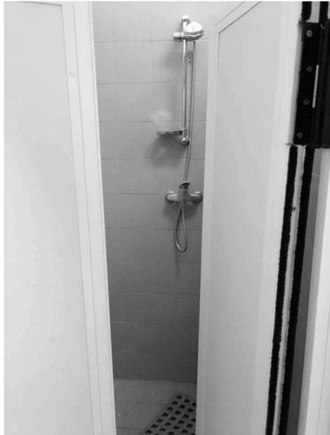
Figura 22 – Ripresa 20: Vista doccia