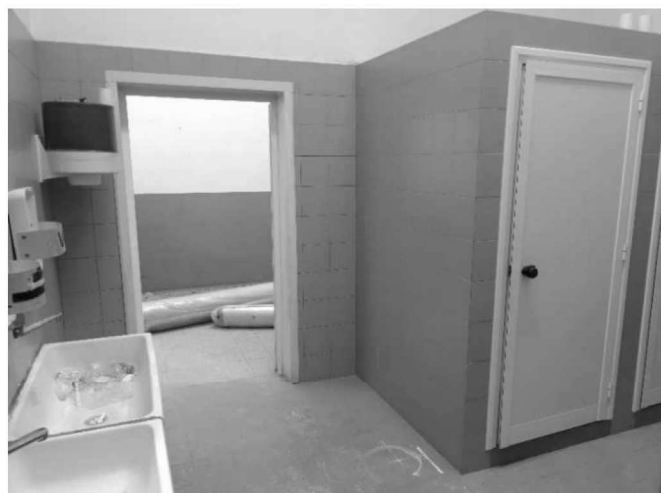
Figura 17 – Ripresa 15: Vista scorcio antibagno – lavelli - vano wc