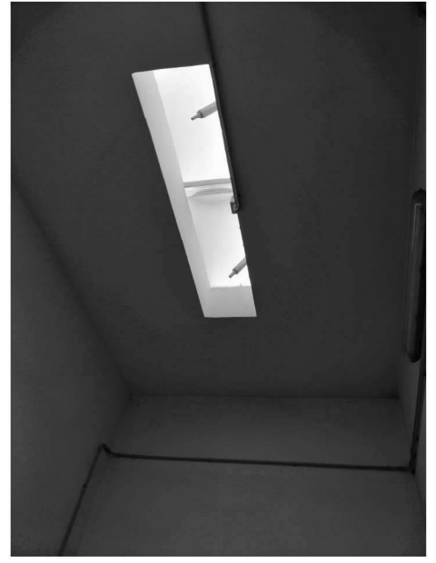
Figura 24 – Ripresa 22: Cupolini a vasistas