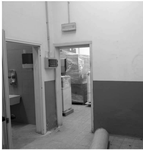
Figura 15 – Ripresa 13: Vista da ex spogliatoio a servizi