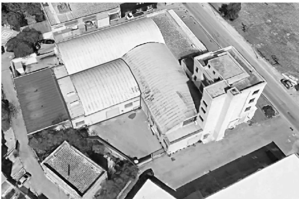
Figura 2 - Foto d'insieme scorcio isolato ed individuazione Unità Fg.49 - P.Ila 85 Sub 28 e porzione sub 15