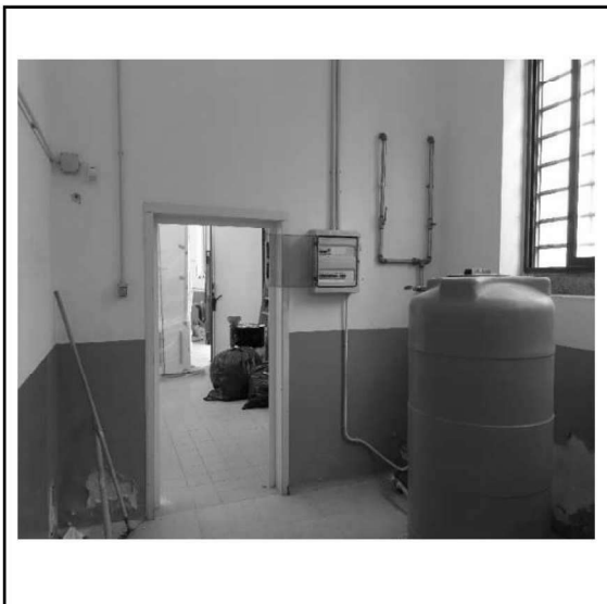
Figura 25 – Ripresa 23: Ex Ufficio - Vano autoclave