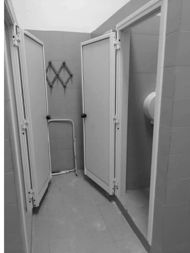
Figura 20 – Ripresa 18: Vista wc e doccia