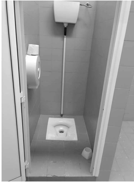
Figura 23 – Ripresa 21: Vista Wc alla turca