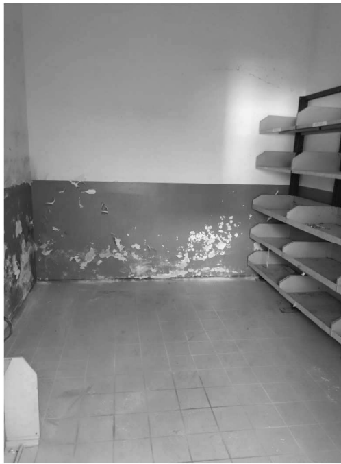
Figura 12 – Ripresa 10: Vista ex archivio-deposito