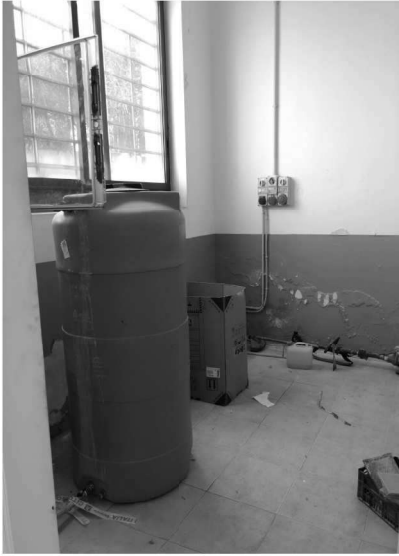
Figura 26 – Ripresa 24: Ex Ufficio - Vano autoclave