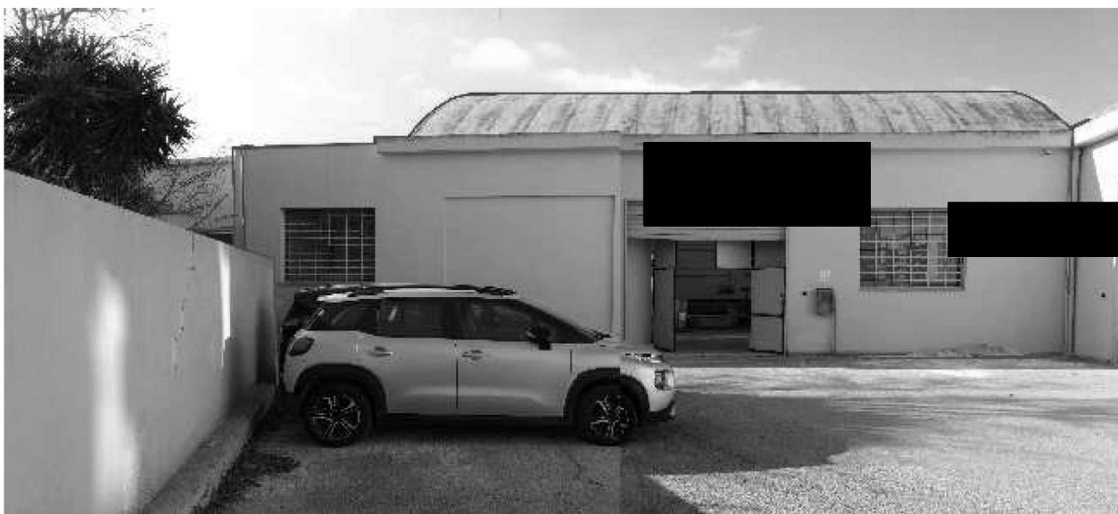
Figura 4 – Ripresa 2: Foto d'insieme ed individuazione unità immobiliare Sub 28 dal piazzale Sub 15