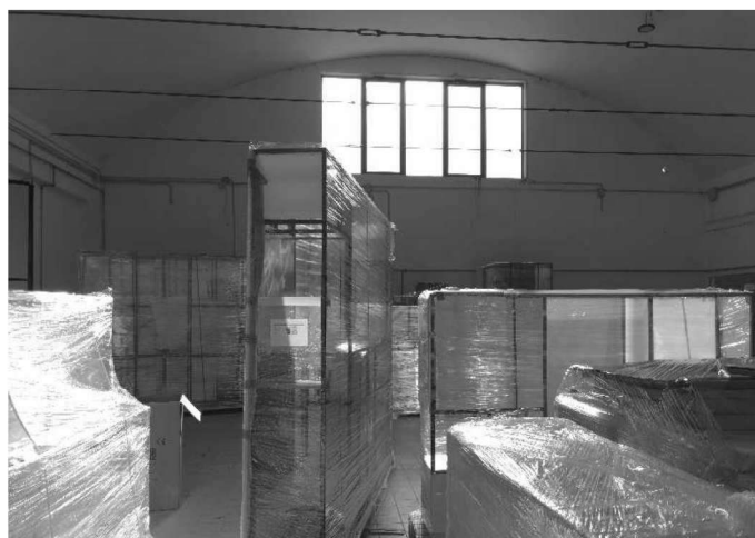
Figura 7 – Ripresa 5: Vista parete Sud