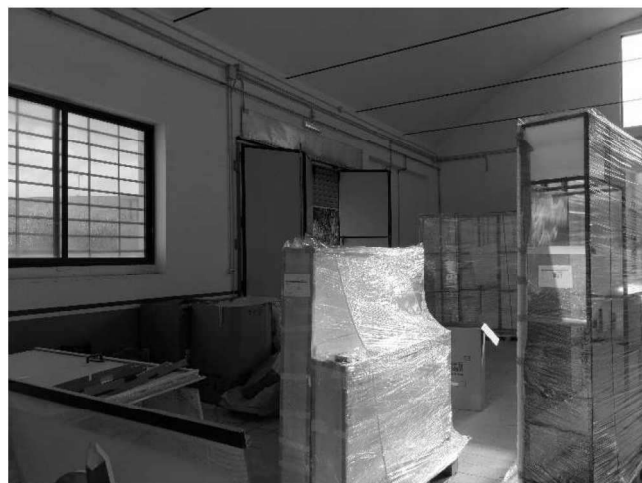
Figura 6 – Ripresa 4: Vista parete Est d'ingresso con porta a