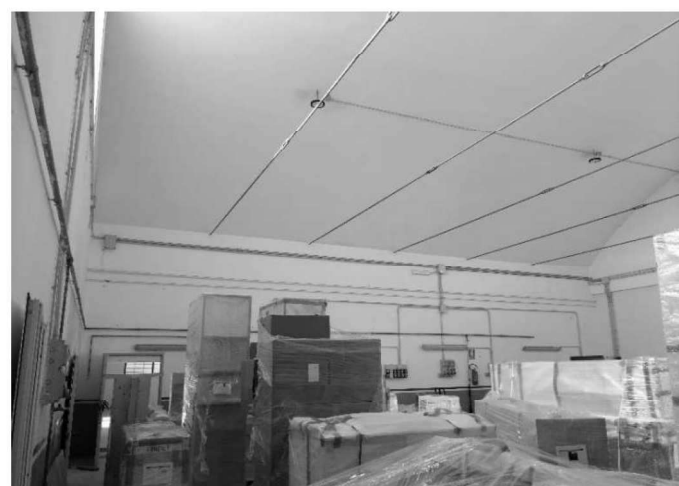
Figura 9 – Ripresa 7: Vista parete Ovest comune al Sub 31