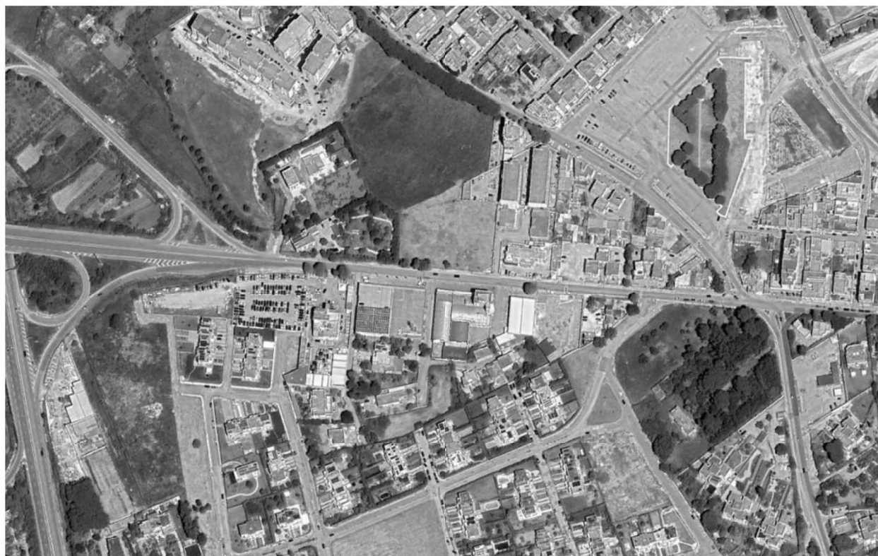
Figura 1 - Ortofoto circondario ed individuazione fabbricato ed evidenziazione Sub 28