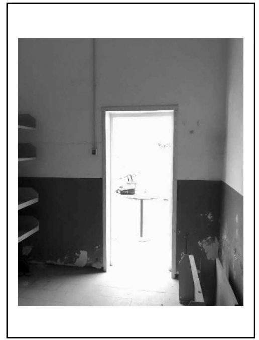
Figura 13 – Ripresa 11: Vista ex archivio-deposito