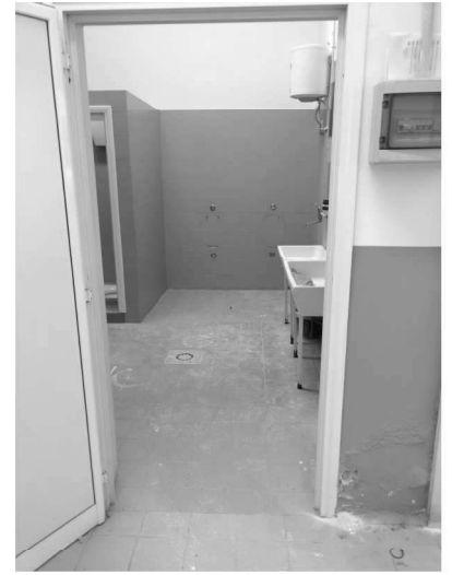
Figura 16 – Ripresa 14: Vista antibagno