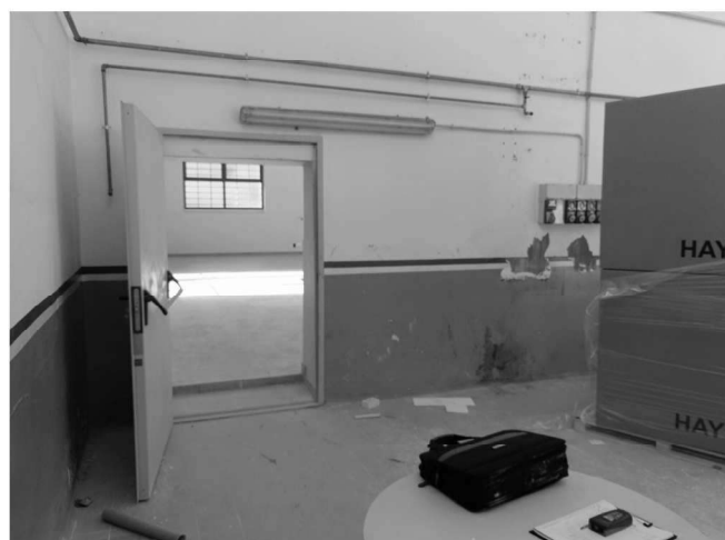
Figura 10 – Ripresa 8: Vista porta di comunicazione con Sub 31