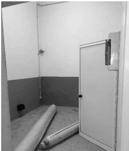
Figura 14 – Ripresa 12: Vista ex spogliatoio