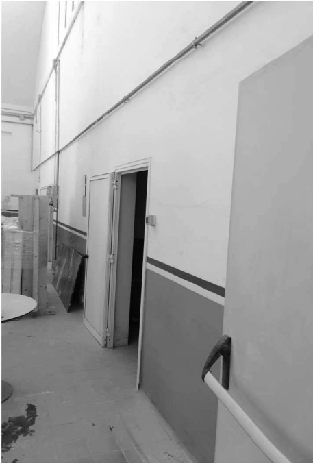
Figura 11 – Ripresa 9: Scorcio parete Sud Servizi