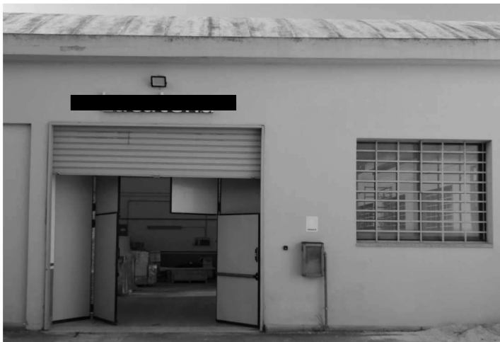
Figura 5 – Ripresa 3: Vista ingresso