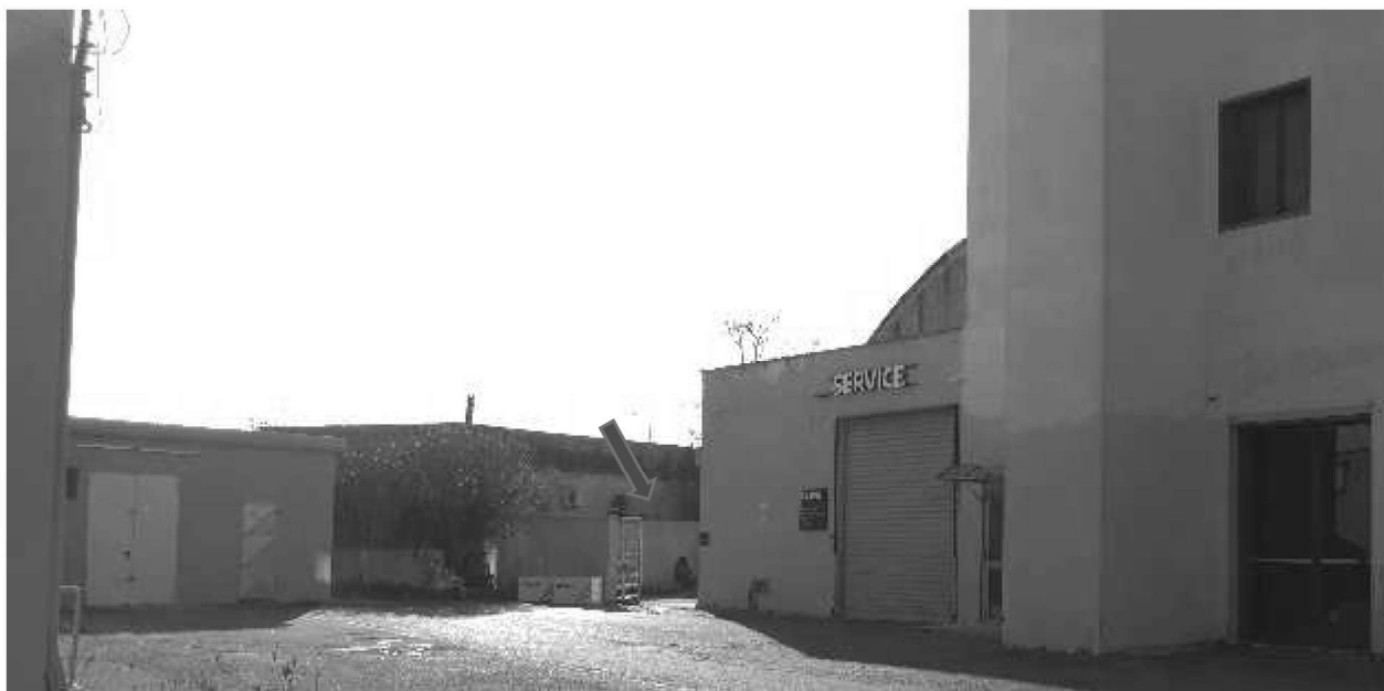
Figura 3 - Ripresa 1: Vista dal piazzale esterno sub 15 ingresso cancello area comune sub 28 e sub 13