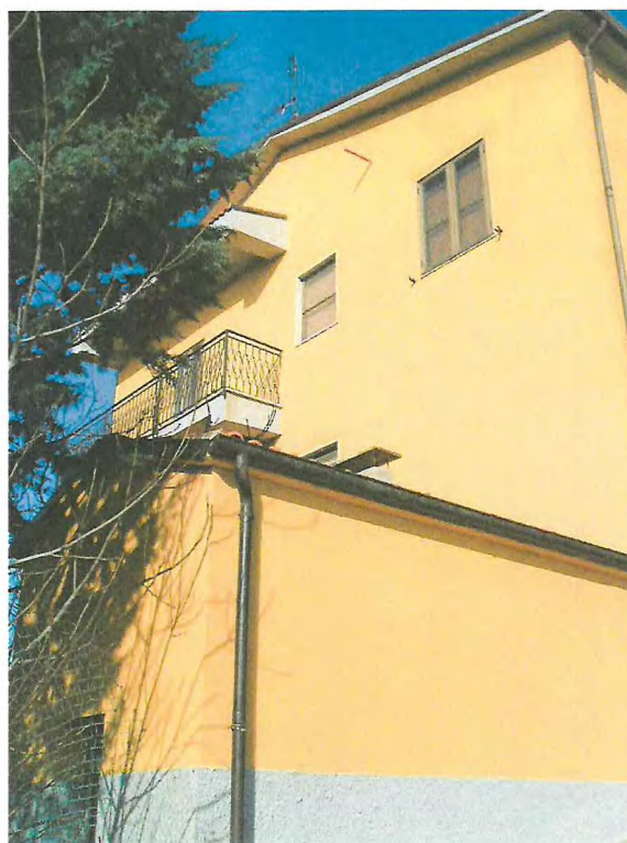
FOTO 28. Parte del fabbricato nella zonainferiore non conforme alla concessione edilizia rilasciata