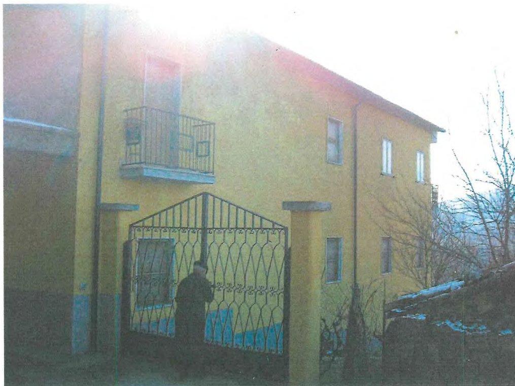
FOTO 3. Immobile lato esterno ovest