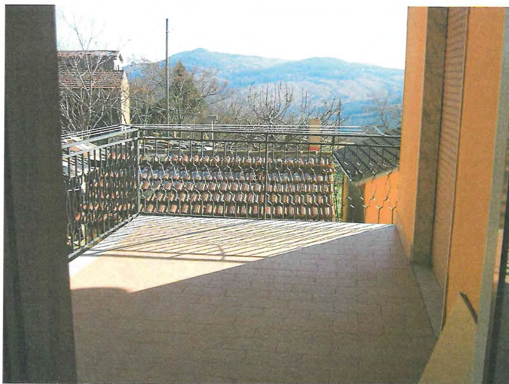
FOTO 14. Primo piano: terrazzo comunicante con cucina e camera da letto