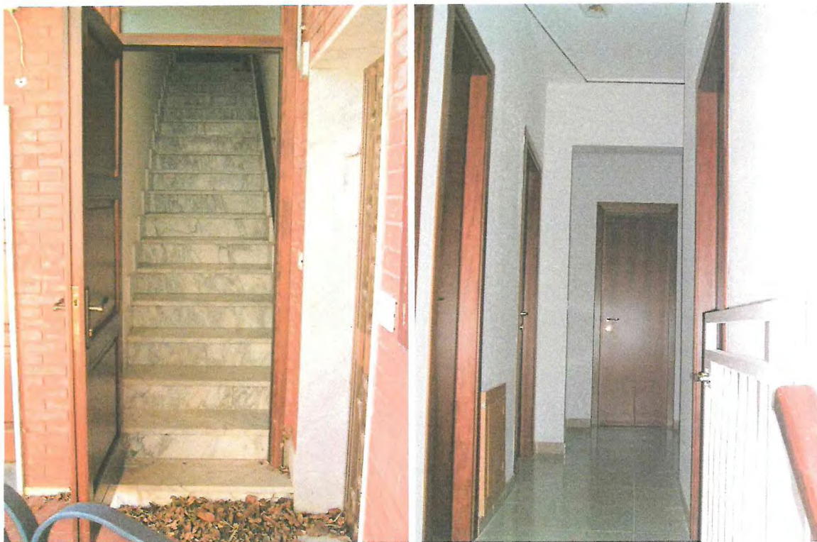
FOTO 11. Ingresso al primo piano