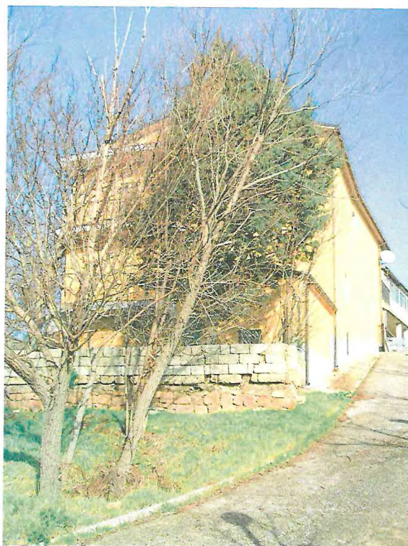
FOTO 1. Immobile lato esterno sud