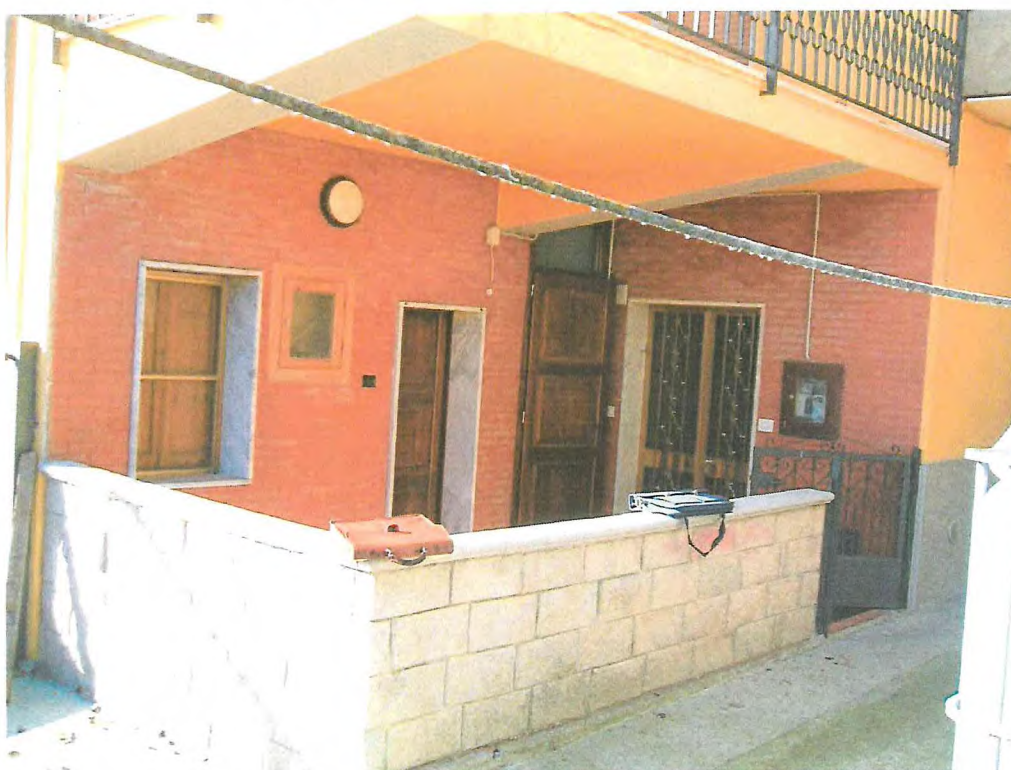
FOTO 4. Immobile lato esterno nord, ingresso piano terra e primo piano