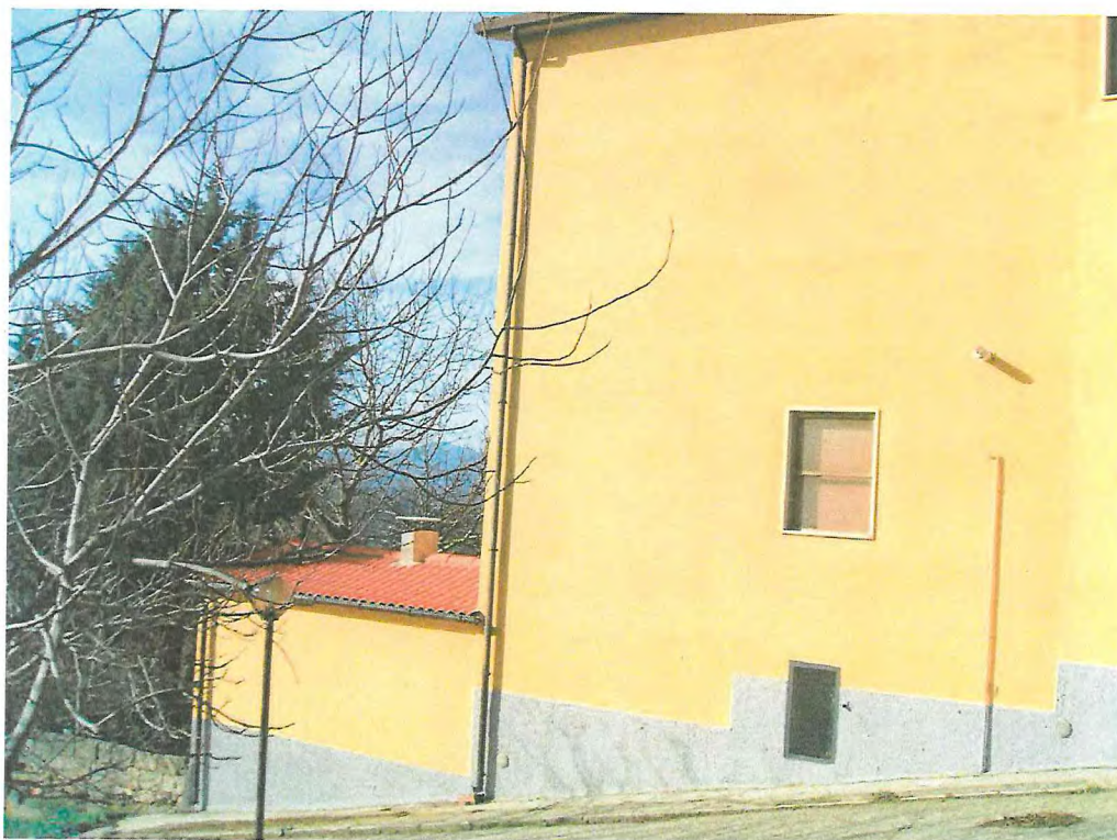
FOTO 2. Immobile lato esterno est