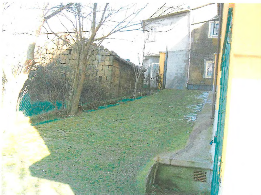
FOTO 26. Strada di accesso al primo piano sottostrada (part.1737)