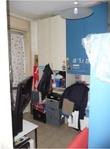
Foto n. 13 Camera