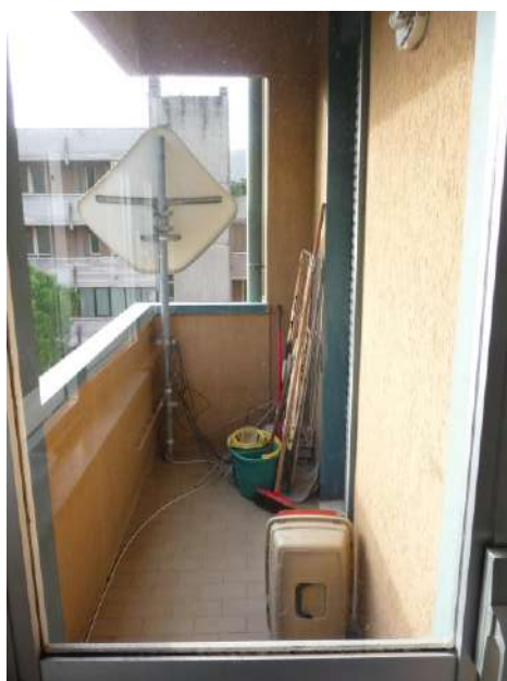
Foto n. 9 Balcone da cucinino