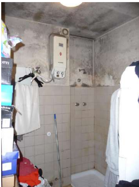
Foto n. 15 Servizio igienico