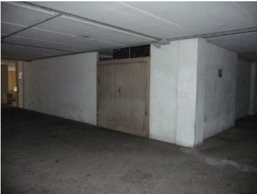
Foto n. 17 Garage