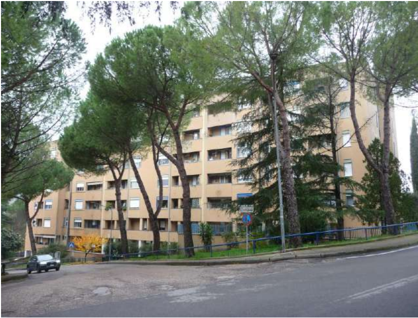
Foto n. 1 Edificio lati lato principale e fianco nord