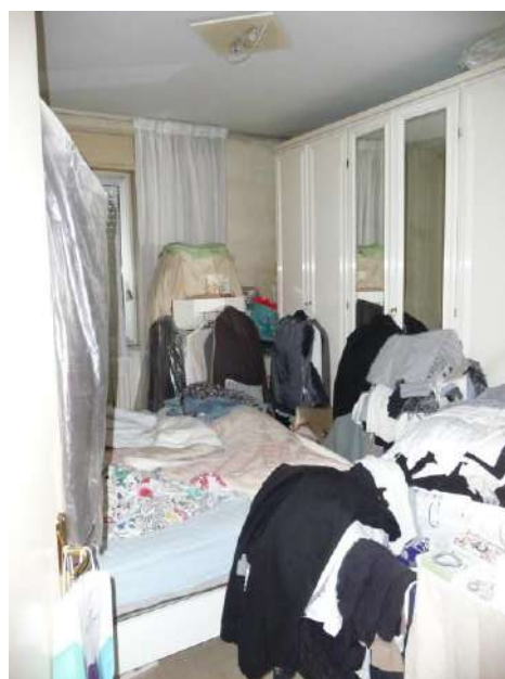
Foto n. 12 Camera