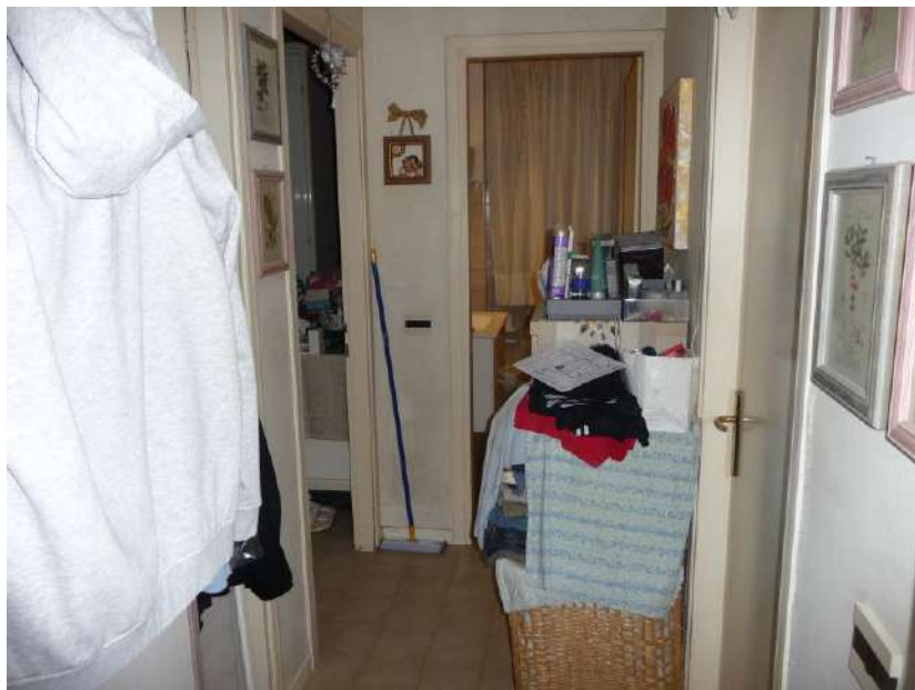
Foto n. 10 Corridoio zona notte