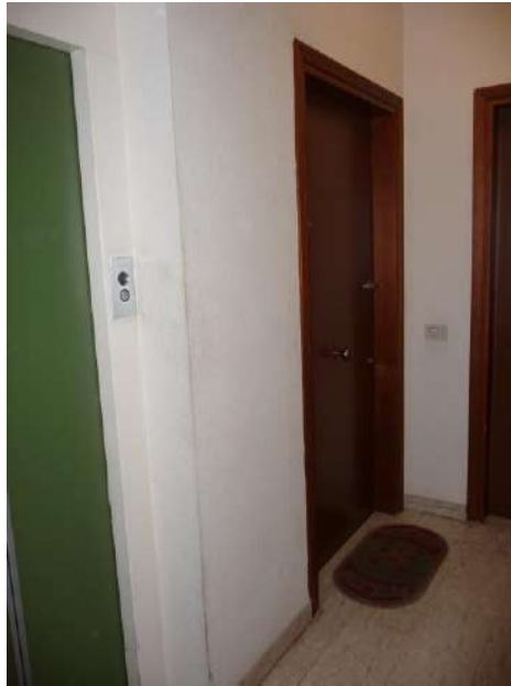
Foto n. 4 Ingresso da pianerottolo