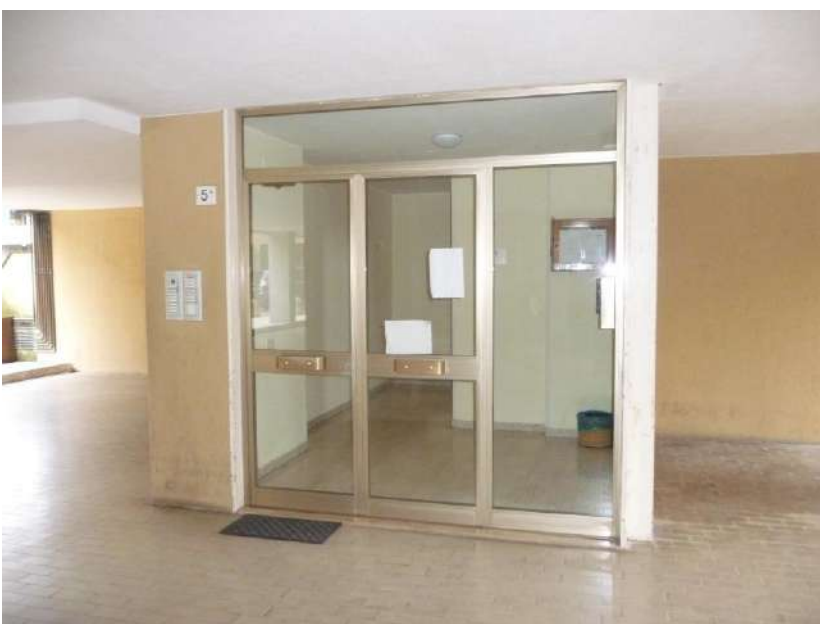
Foto n. 3 Ingresso condominiale