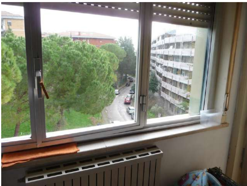
Foto n. 2 Visuale da sala