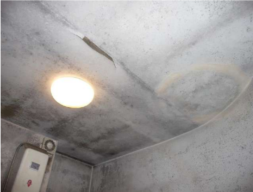
Foto n. 16 Particolare servizio igienico