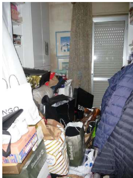
Foto n. 11 Camera