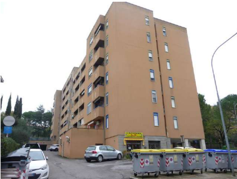
Foto n. 2 Edificio retro e fianco sud