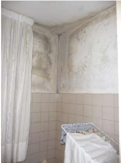
Foto n. 14 Servizio igienico