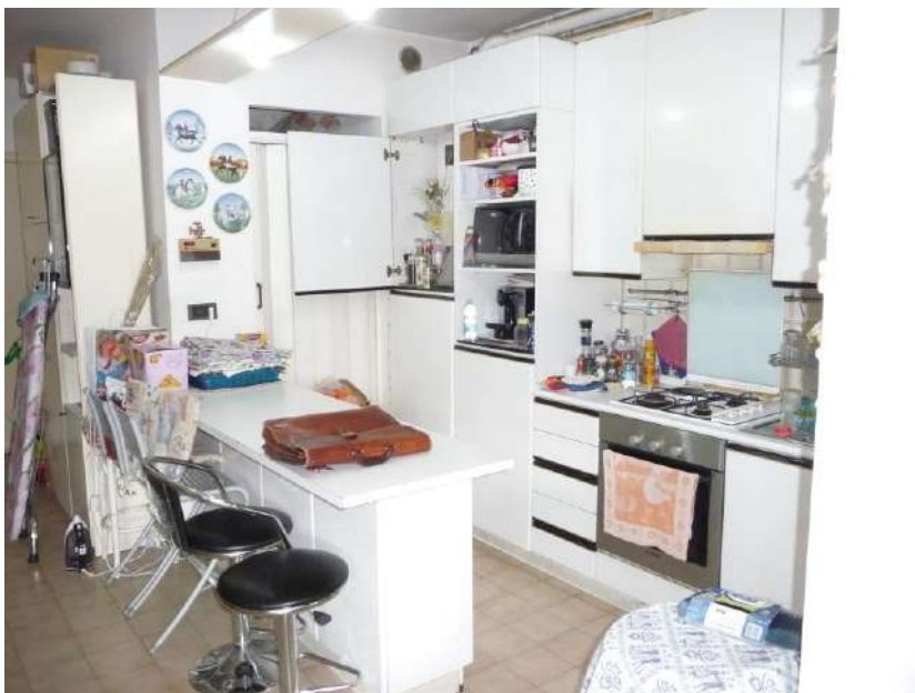
Foto n. 7 Cucinino e ripostiglio