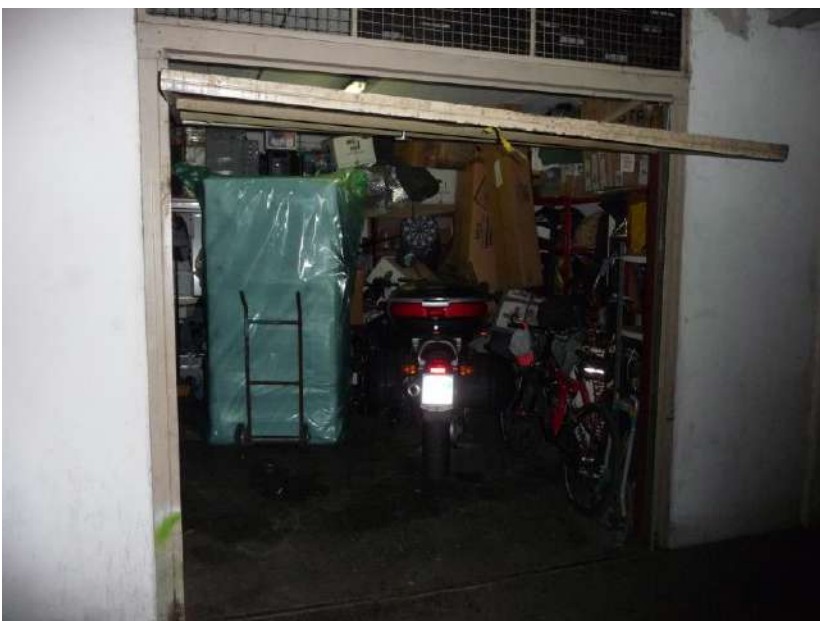
Foto n. 18 Garage