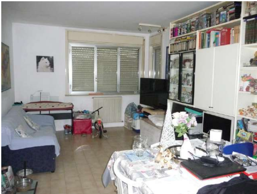
Foto n. 5 Sala