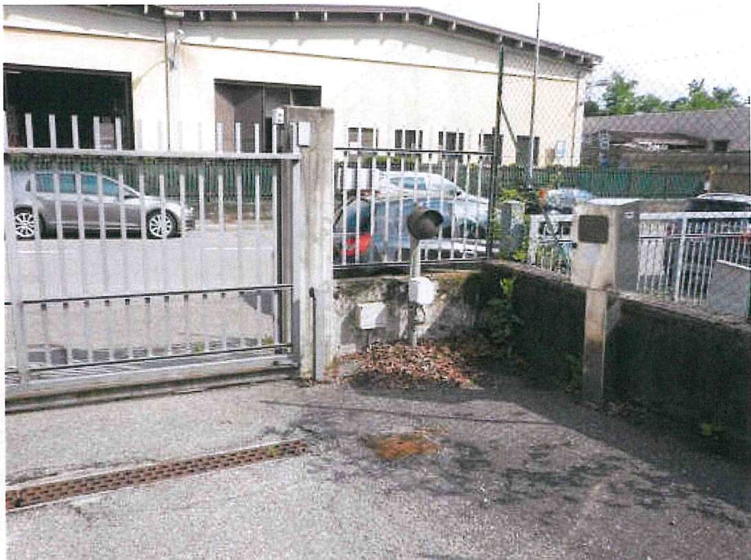
Foto 12 - Alcuni impianti agli ingressi su strada