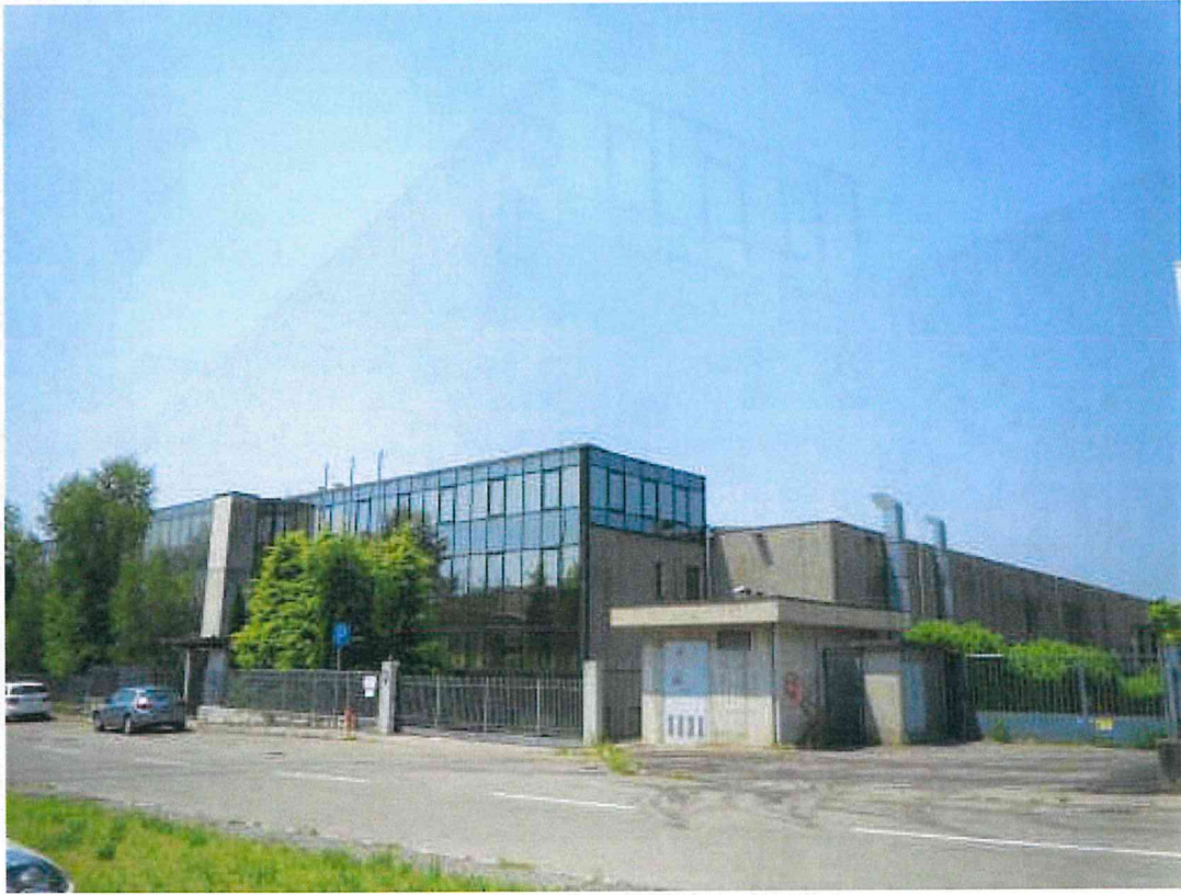
Foto 01 – L'angolo Est con il corpo uffici vetrato e la produzione