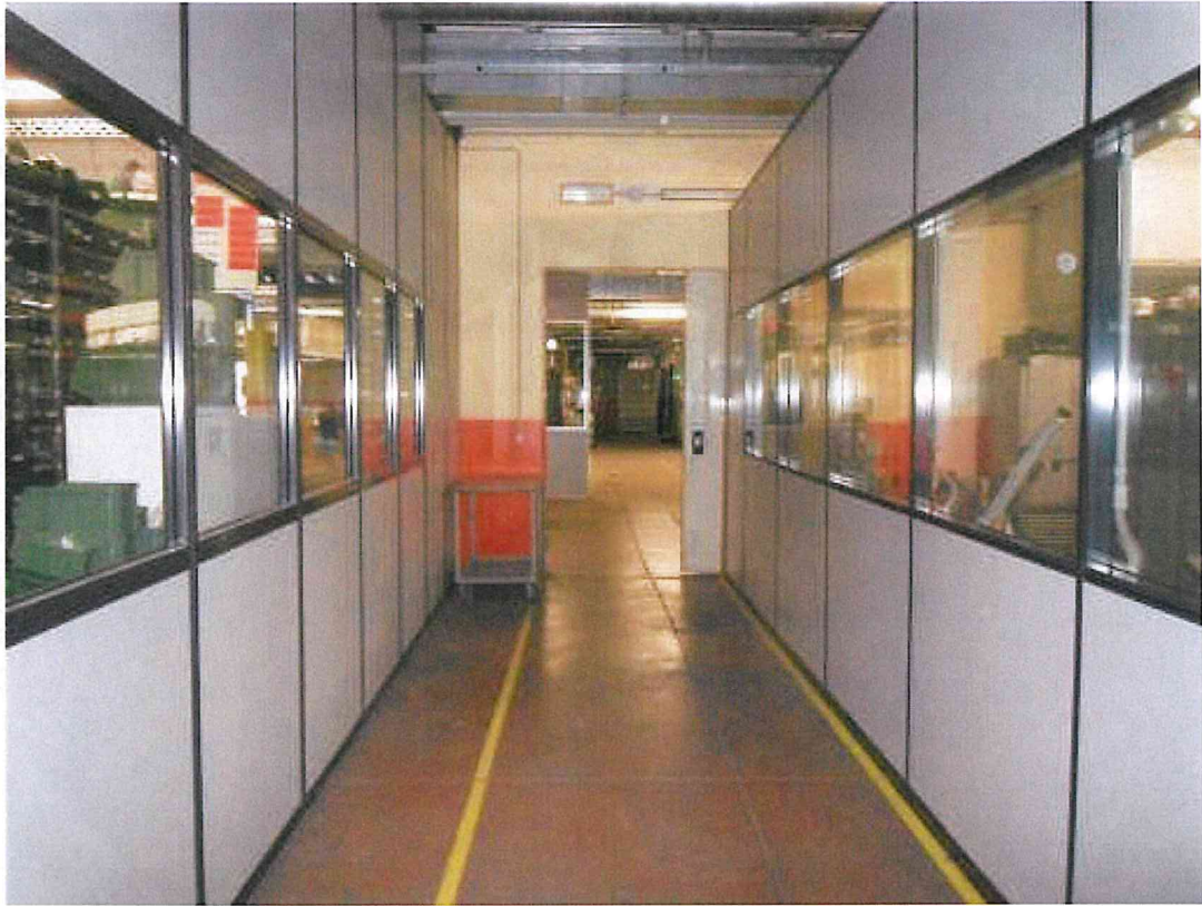
Foto 03 - Corridoi di distribuzione