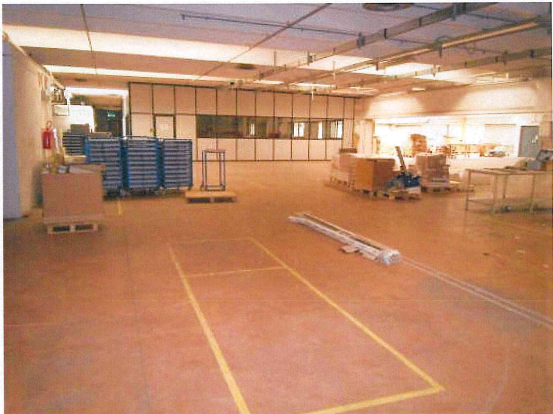
Foto 10 - I reparti ala Sud-Ovest varie viste