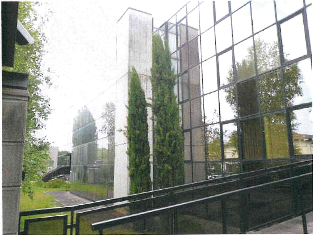
Foto 11 - Il prospetto uffici di Sud-Est verso via Olona