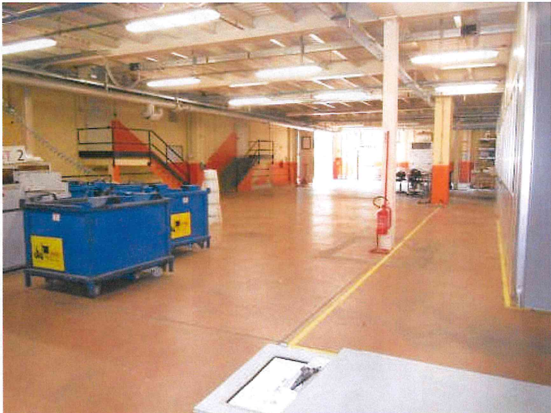
Foto 04 – Reparto trancia (da catasto) con vista sulle scale verso gli uffici