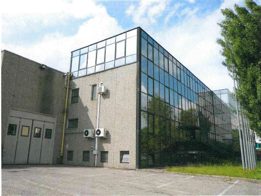
Foto 03 - L'angolo Sud verso il corpo uffici