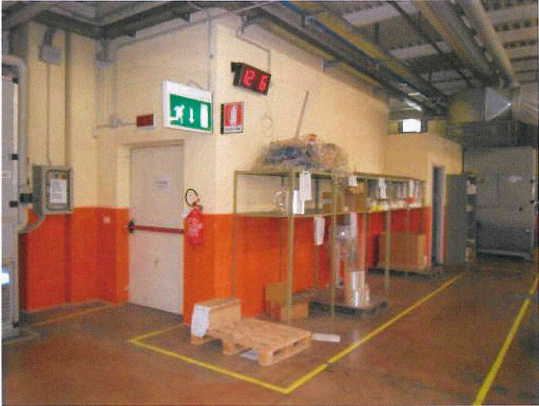
Foto 11 - Reparto packacing il corpo scala e wc