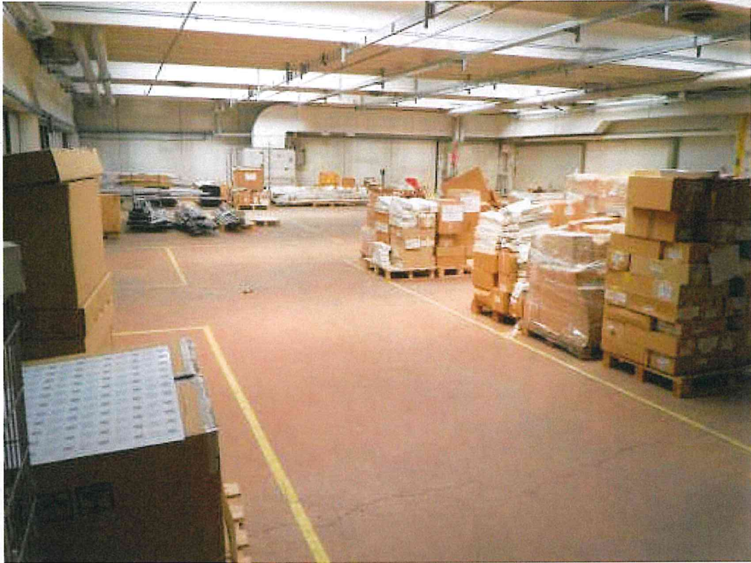
Foto 11 - I reparti ala Sud-Ovest varie viste