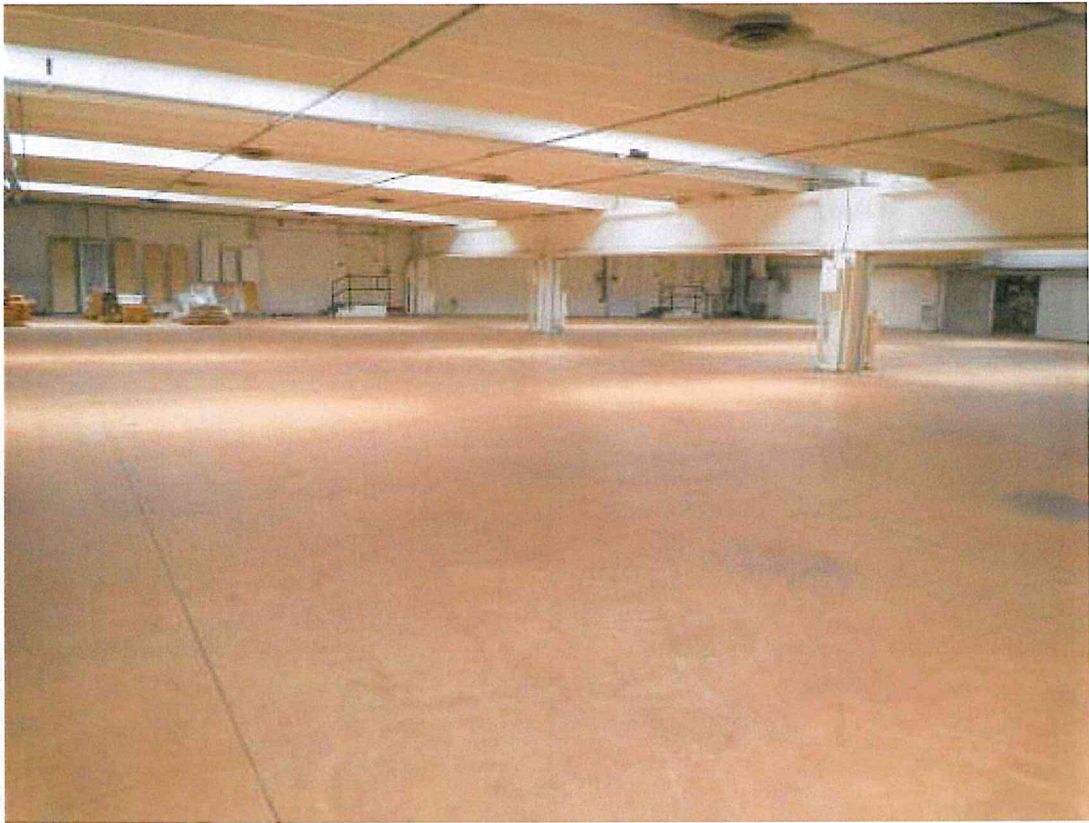
Foto 03 - Lo spazio al piano primo verso le scale di accesso agli uffici piano primo