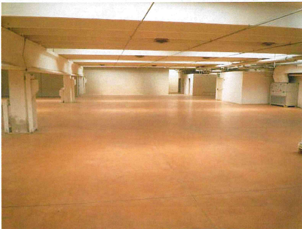
Foto 01 – Lo spazio al piano primo, sul fondo il muro confinante con lo spazio a tutta altezza