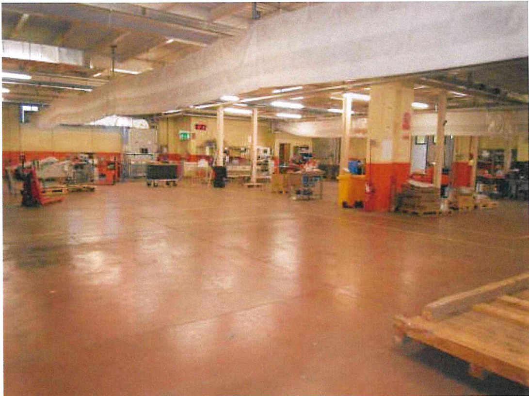
Foto 10 - Reparto packacing