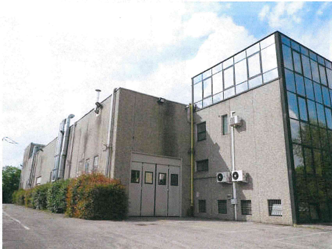
Foto 04 - L'angolo Sud verso il corpo produzione