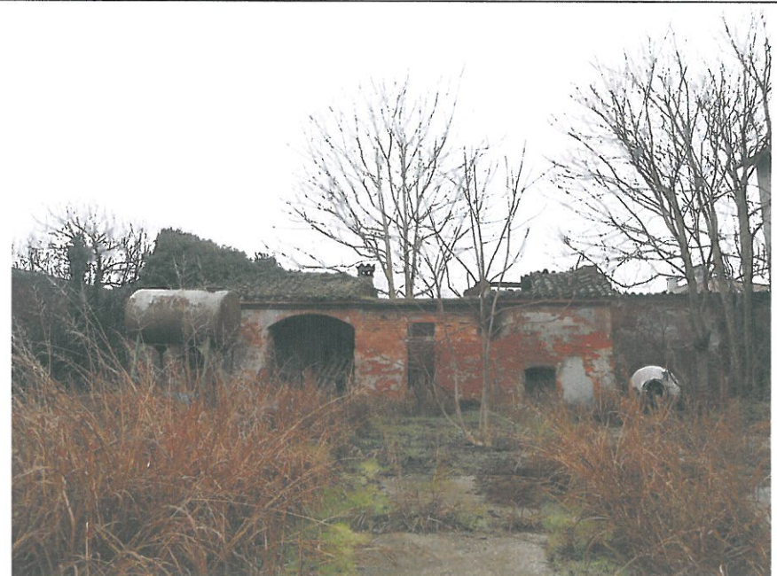
FOTO 29 - PROSPETTO FABBRICATO 5- FABBRICATO ACCESSORIO