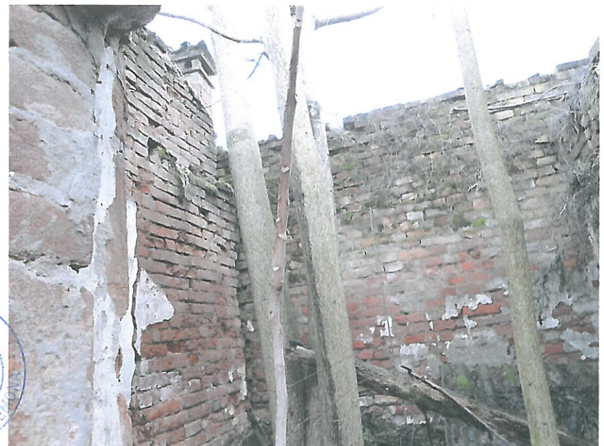
FOTO 31 - INTERNO FABBRICATO 5- FABBRICATO ACCESSORIO