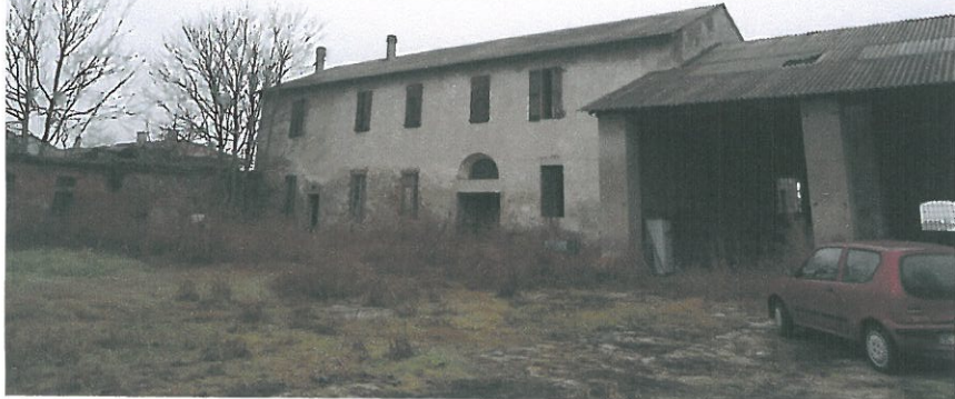
FOTO 1 – PROSPETTO SUD - CORTILE FABBRICATO 1 E BARCHESSALE FABBRICATO 2