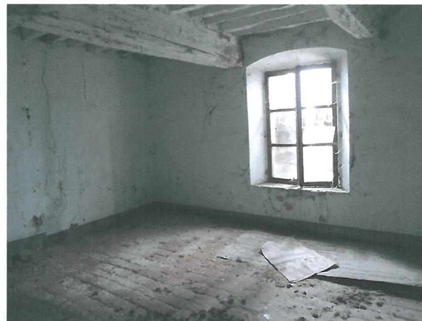
FOTO N. 24 INTERNI PIANO PRIMO FABBRICATO 3