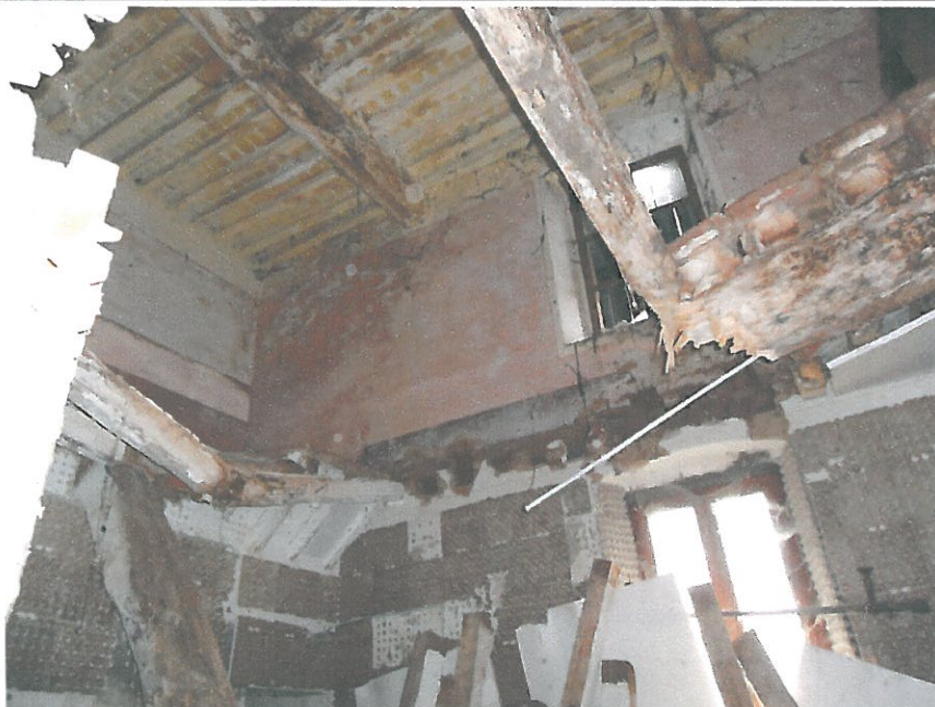
FOTO N. 21 INTERNI PIANO TERRA FABBRICATO 3 – CROLLO SOFFITTO VANO 10