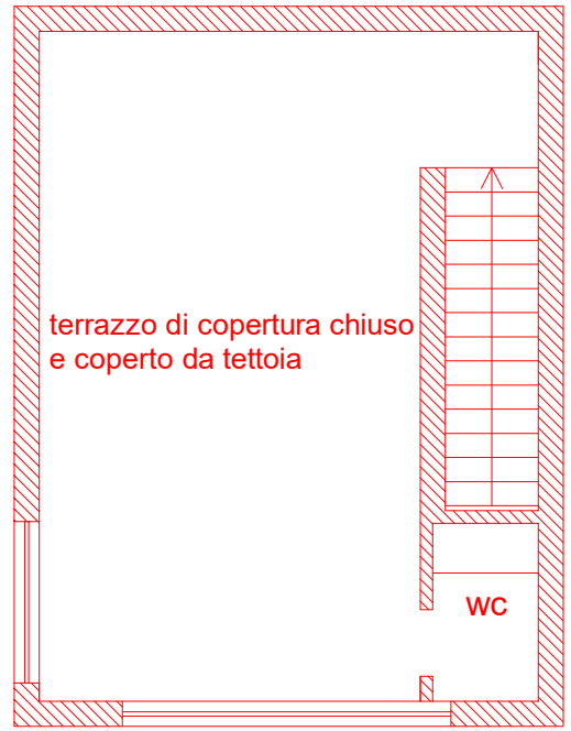
PIANO TERZO (COPERTURA)