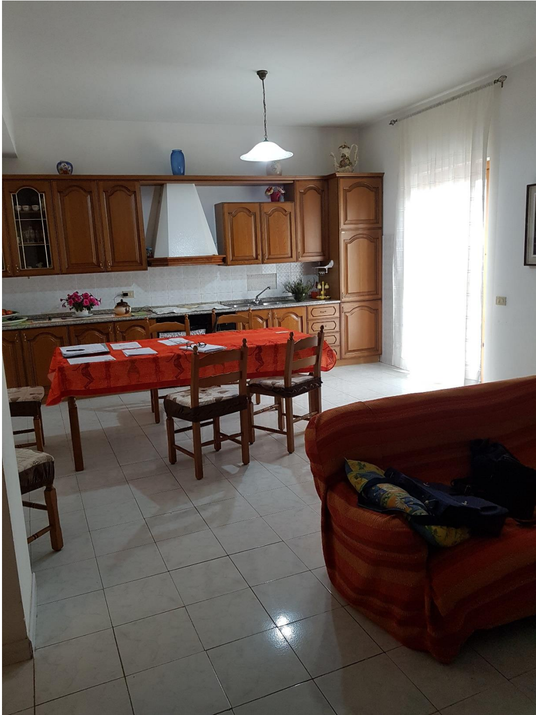
Foto n.6a: soggiorno-cucina con balcone esposto ad est (inquadramento soggiorno-cucina)