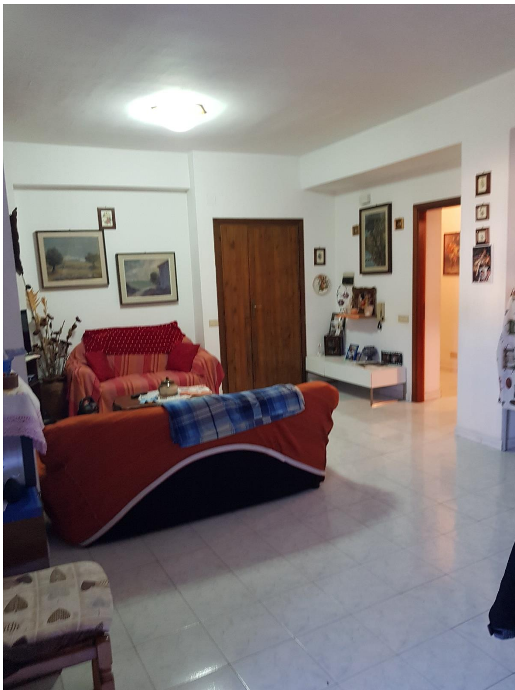
Foto n.7b: soggiorno-cucina con balcone esposto ad est (inquadramento ingresso-soggiorno ed accesso alla zona notte)