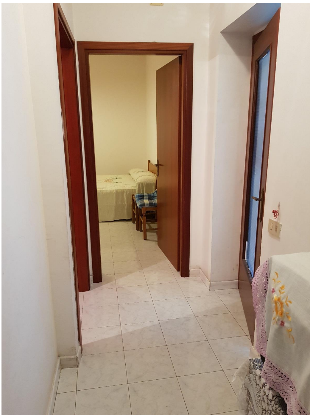
Foto n.9: corridoio con vista verso camere da letto e ingresso al soggiorno