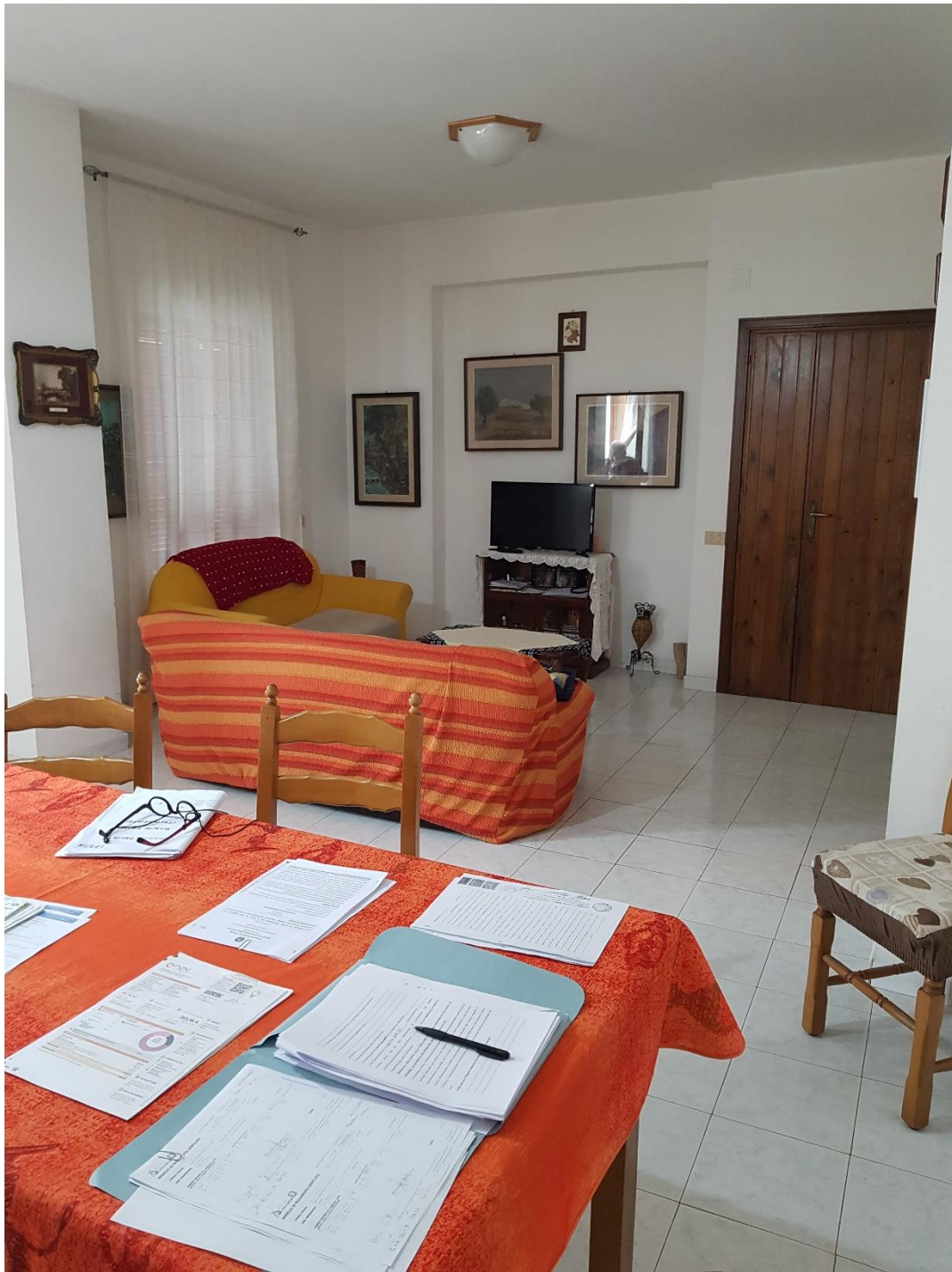
Foto n.7a: soggiorno-cucina con balcone esposto ad est (inquadramento ingresso-soggiorno)