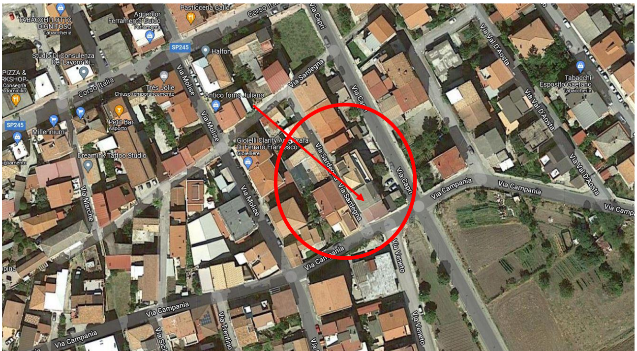
Immagine n.2: foto aerea con vista ravvicinata dell'immobile di interesse