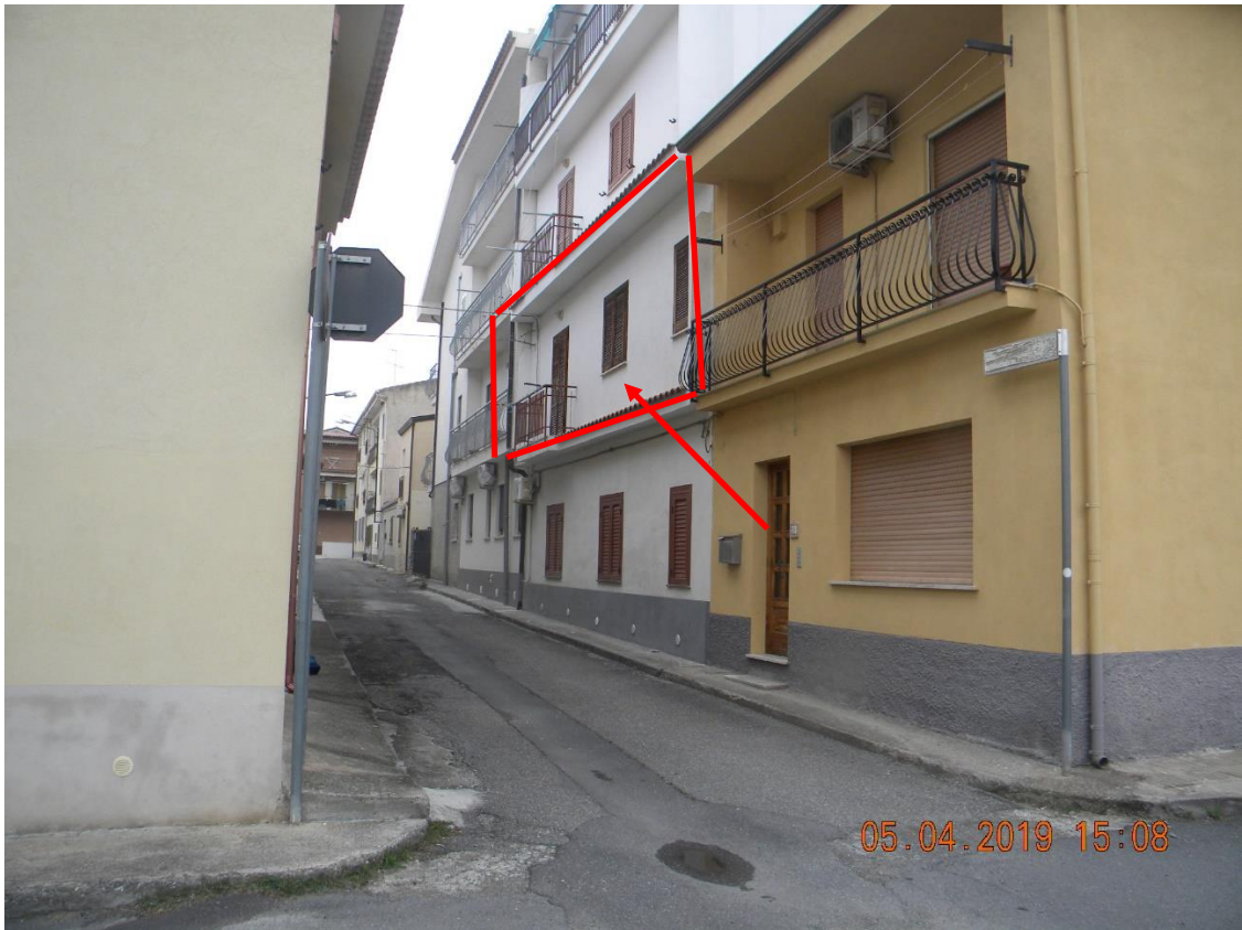
Foto n.1: vista facciata ovest con indicazione appartamento al 1° piano oggetto di esecuzione (via Sardegnia)