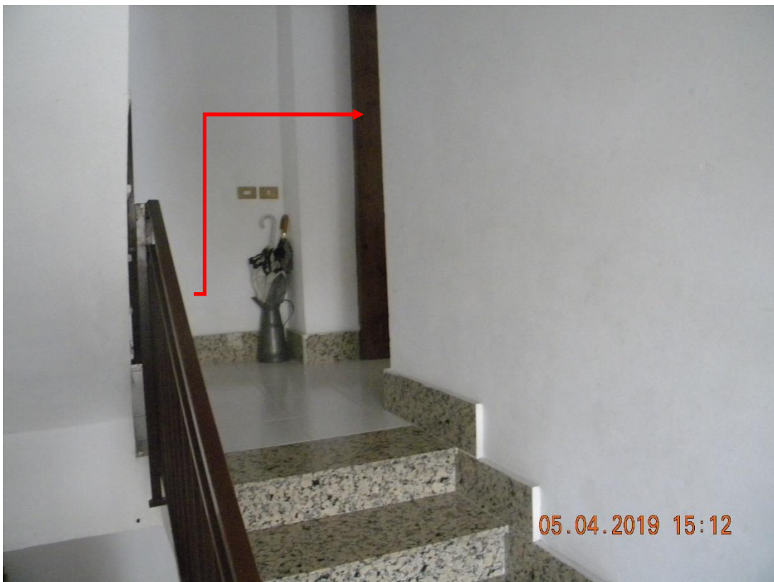
Foto n.5: particolare ingresso immobile pignorato sub 2 (vano scala)