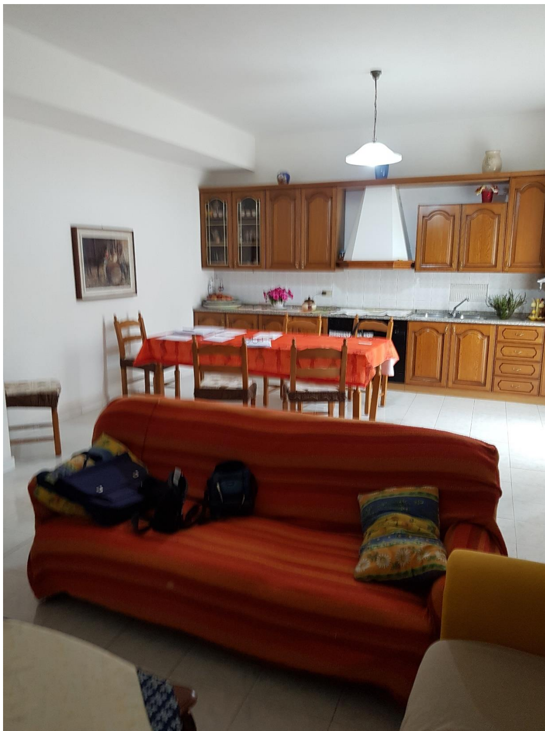
Foto n.6b: soggiorno-cucina con balcone esposto ad est (inquadramento soggiorno-cucina)