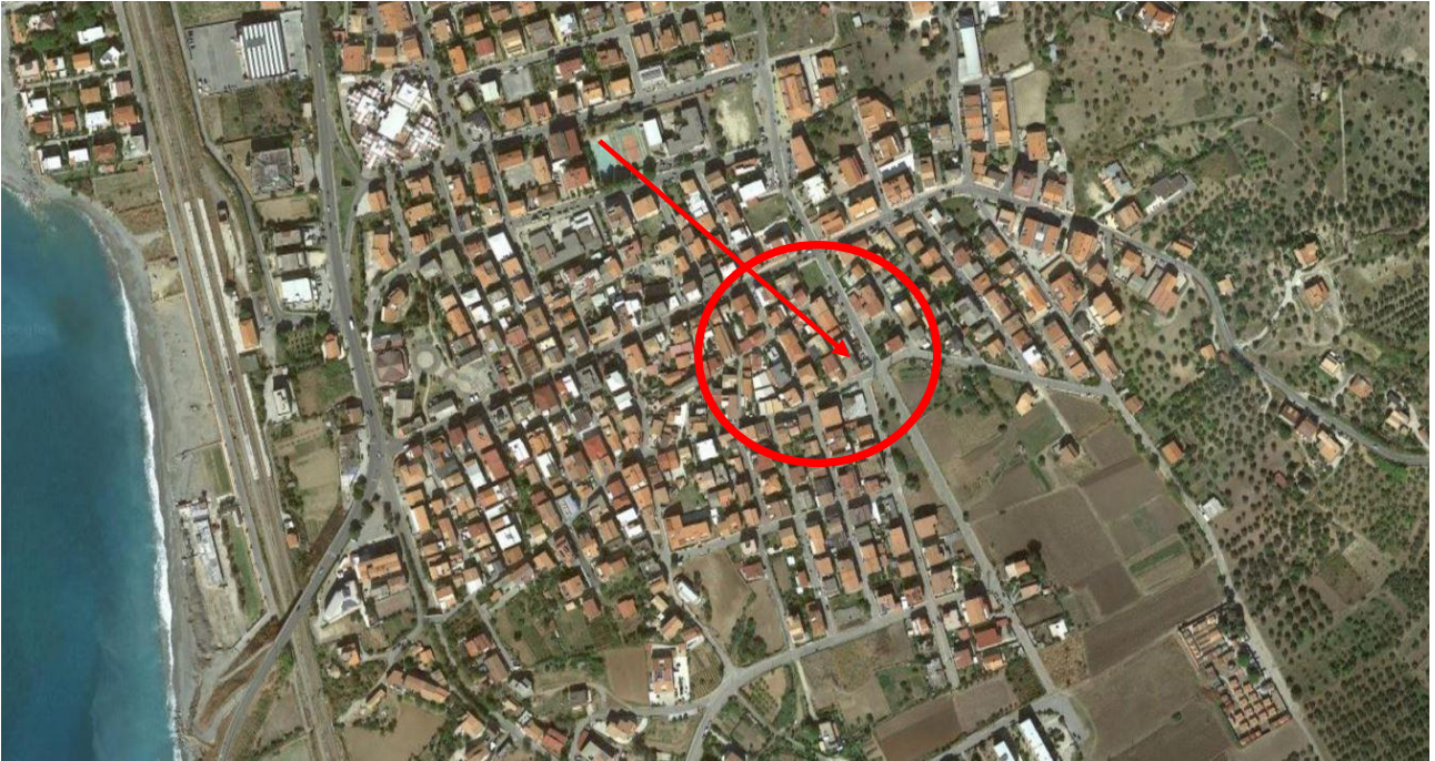
Immagine n.1: foto aerea con inquadramento dell'immobile di interesse