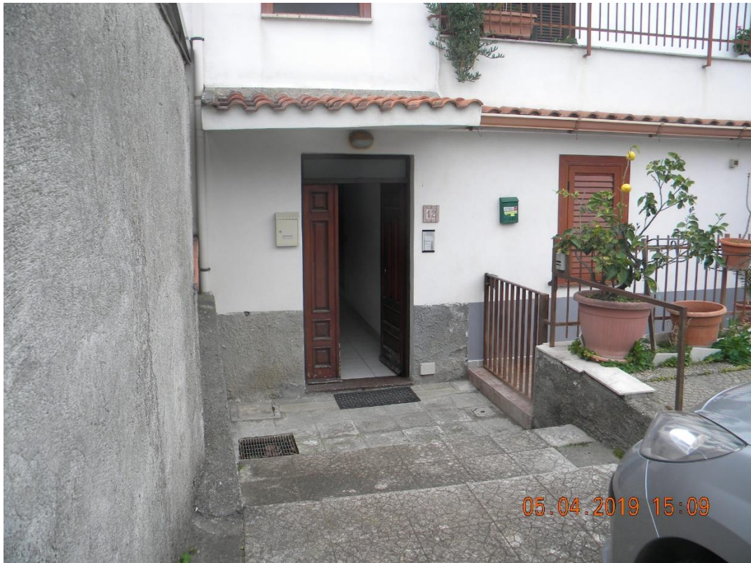
Foto n.4: particolare ingresso immobile al piano terra (Via Capri n.12)