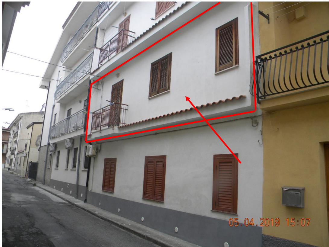
Foto n.2: vista ravvicinata facciata ovest con indicazione appartamento al 1° piano oggetto di esecuzione (via Sardegnia)