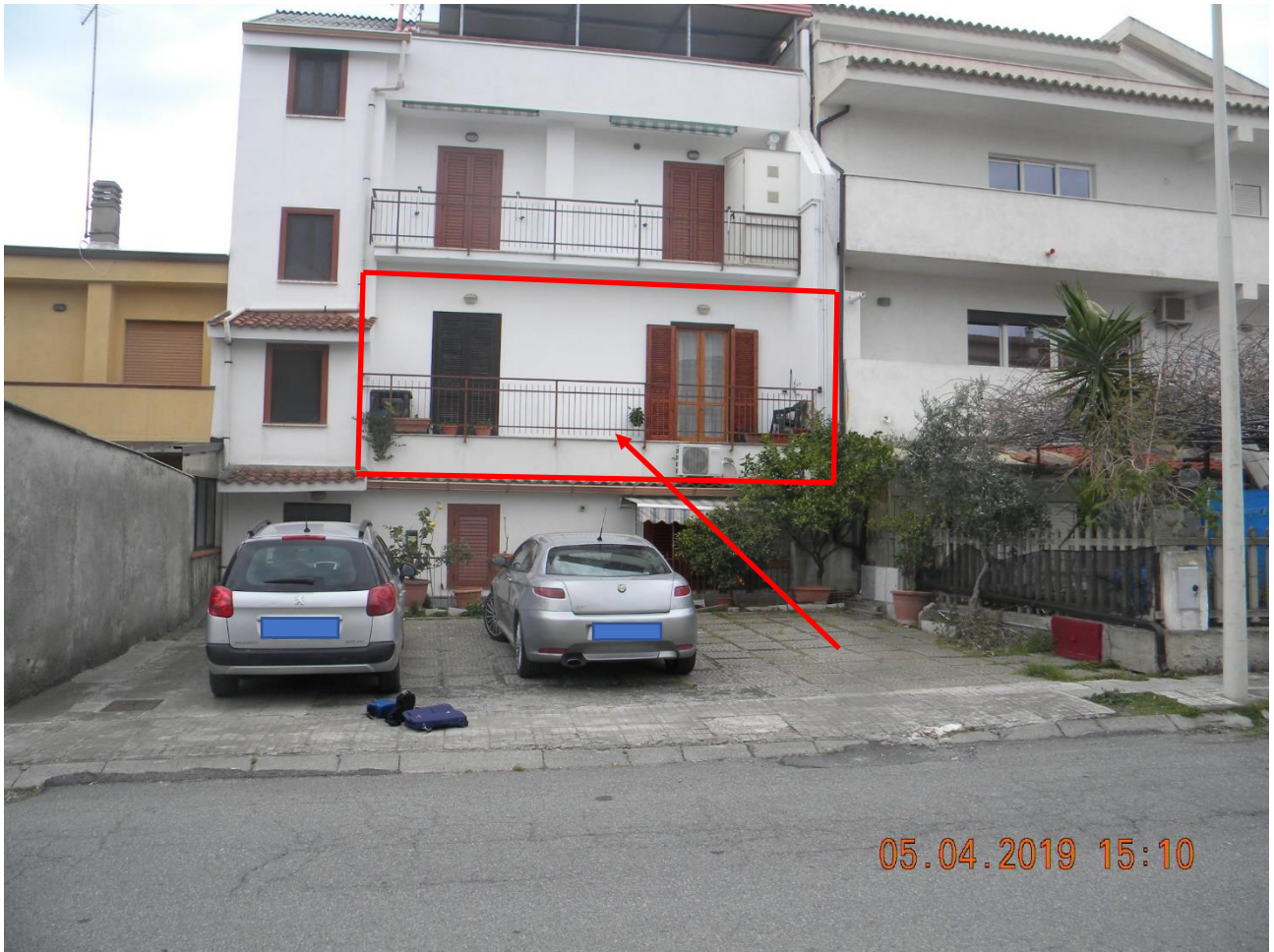
Foto n.3: vista facciata est con indicazione appartamento al 1° piano oggetto di esecuzione (via Capri)