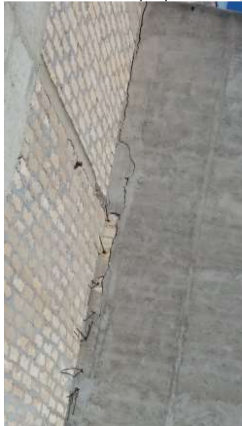
FOTO 4 - Particolare della lesione