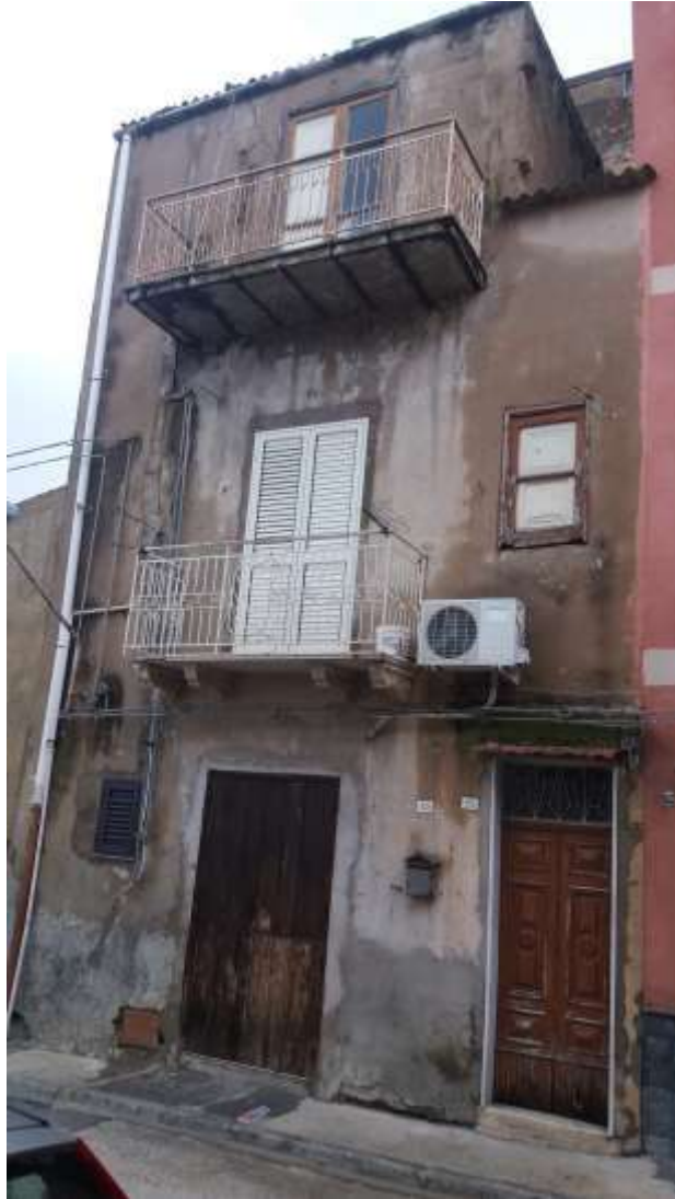
FOTO 1 - Veduta dell'unità immobiliare, sito in Via Cangiamila 53