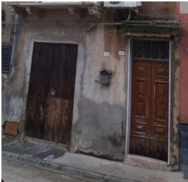
FOTO 2 - Veduta del portone d'ingresso