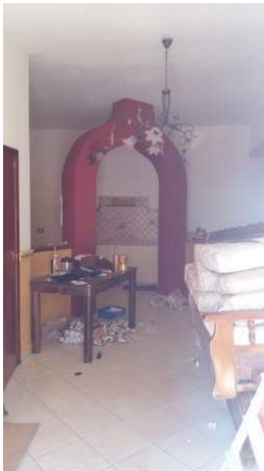
FOTO 5 - Veduta dell'ingresso a piano terra.