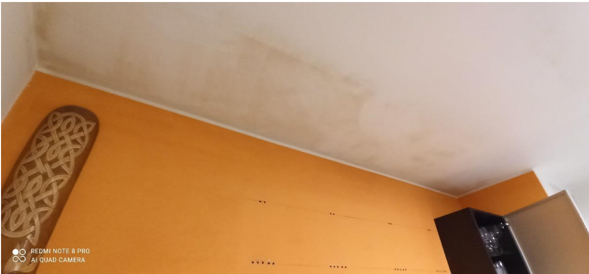
Dettaglio fenomeni di umidità intradosso solaio – locale soggiorno