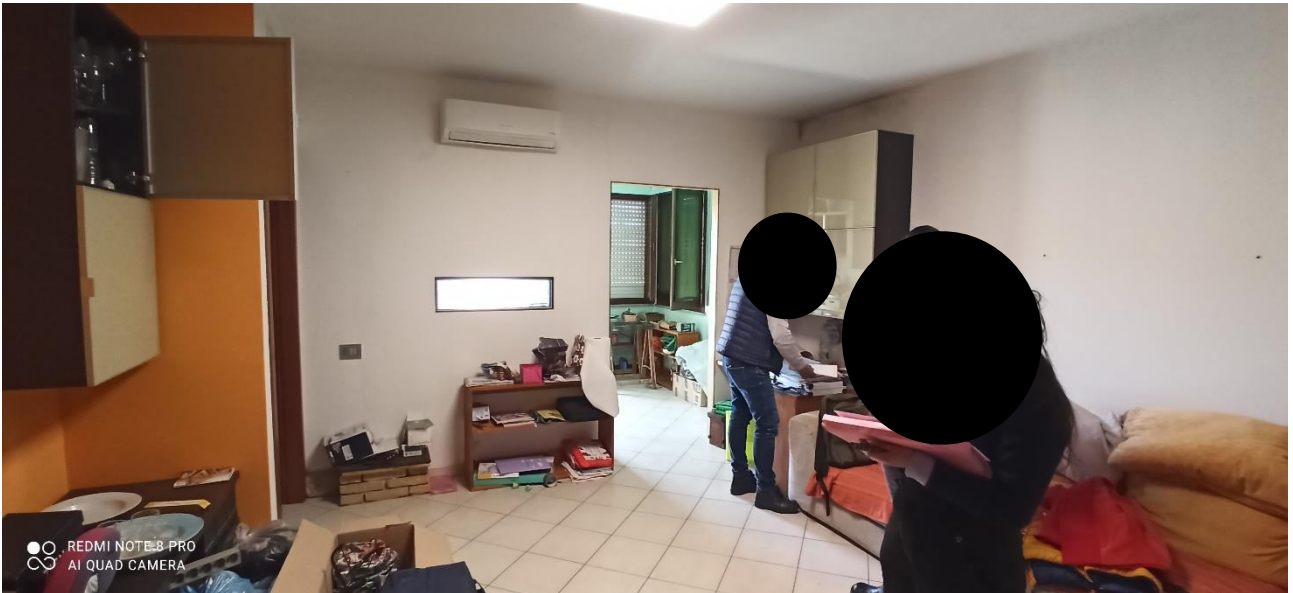
Vista del soggiorno