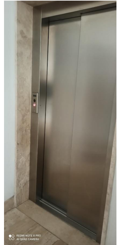
Immagine atrio: vano scala piano terra, ingresso appartamento piano 2°, vano ascensore