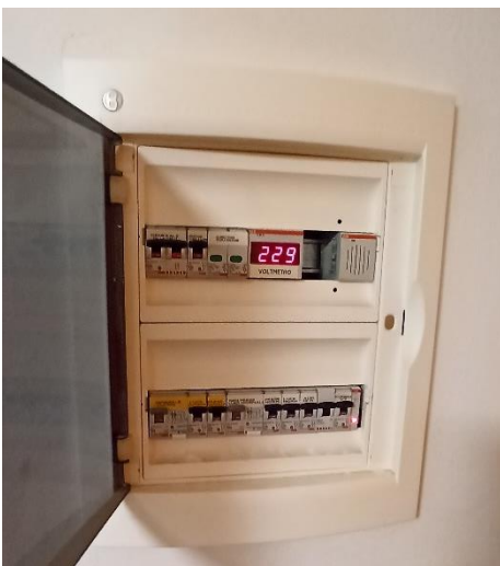
dettaglio quadro elettrico a piano