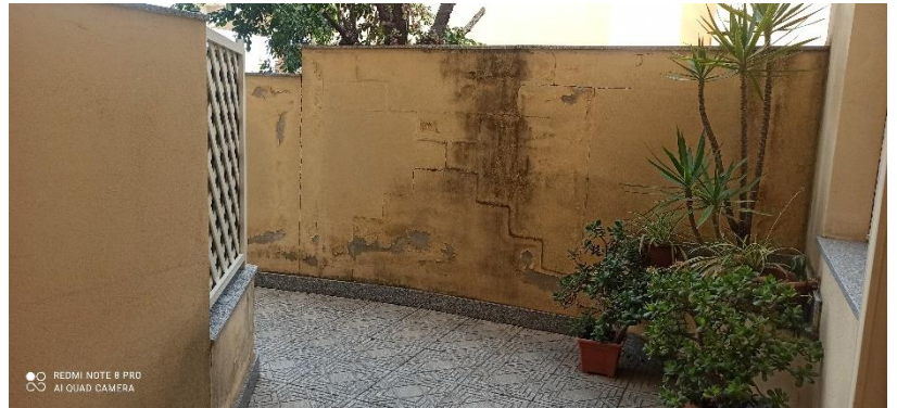
Atrio esterno piano terra, vano scala interno piano terra