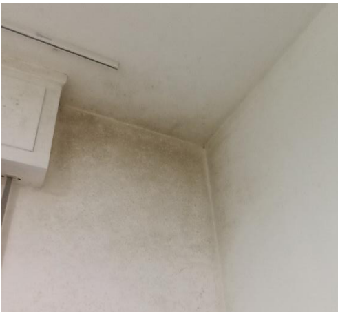
viste camera da letto, dettaglio fenomeni di umidità e presa d'aria per il ricambio.