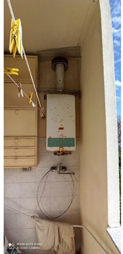
viste balcone: lato lungo, lato breve e dettaglio caldaia a muro