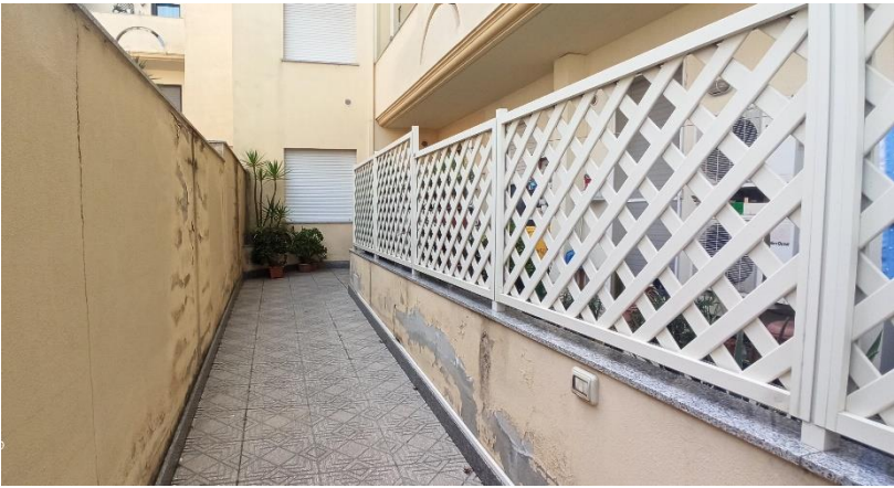
Condominio via Matteotti n.11 – viste da viabilità e ingresso su cortile