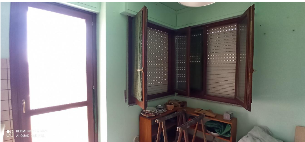
Vista infissi esterni in legno massello – locale cucina