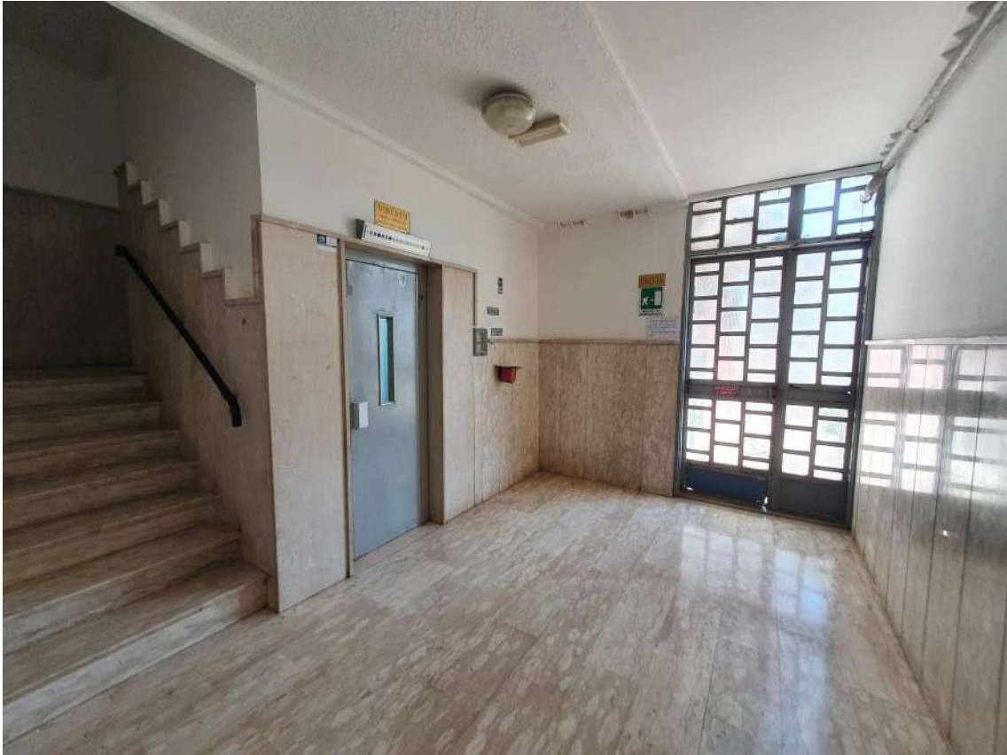
Foto 11. Androne dell'edificio