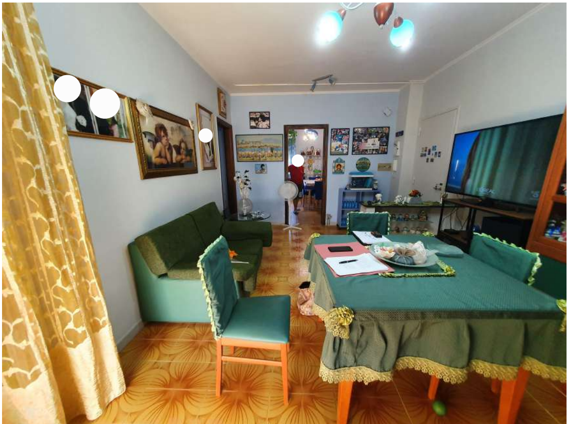
Foto 14. Ingresso-soggiorno dell'unità immobiliare