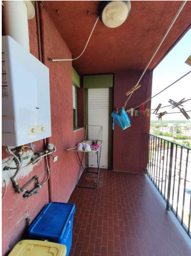
Foto 27. Balcone lato ovest