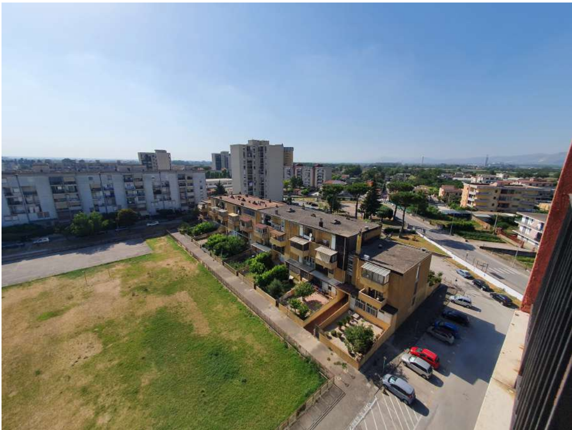
Foto 30. Vista lato nord-ovest