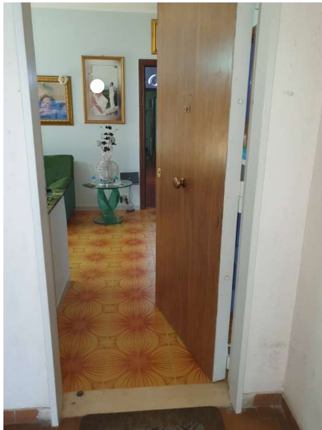
Foto 12. Ingresso all'appartamento sub 36