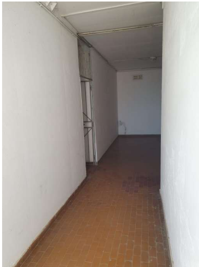
Foto 32. Corridoio di accesso al locale cantinato