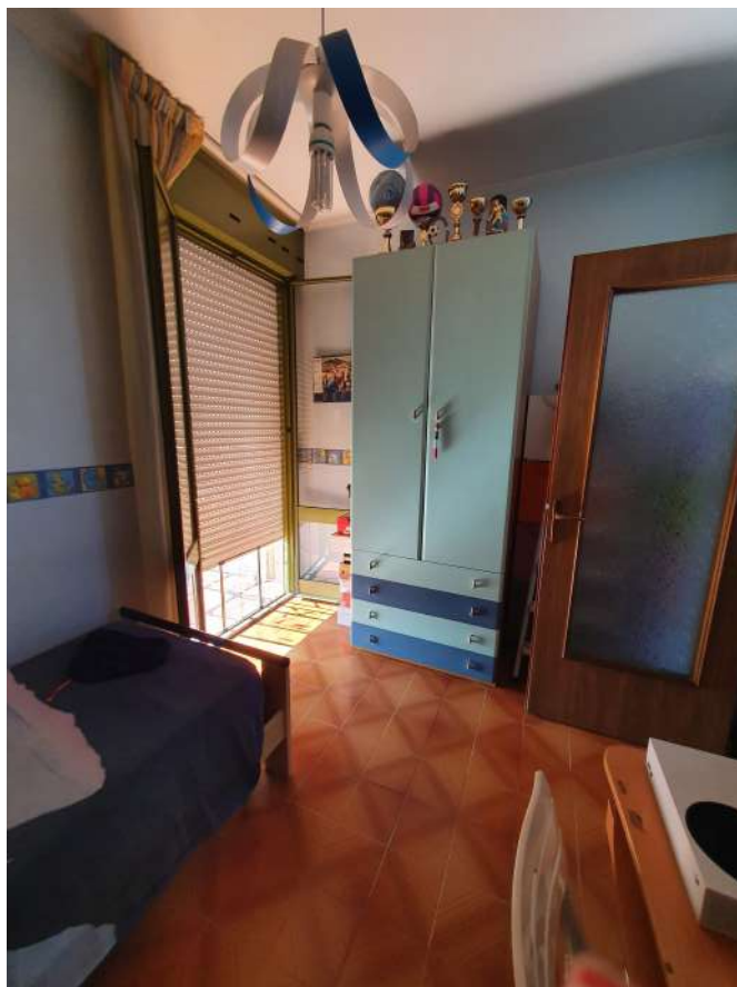
Foto 21. Camera da letto singola 1 - lato est