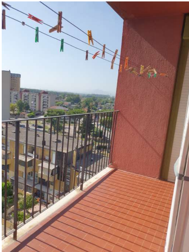
Foto 28. Balcone lato est