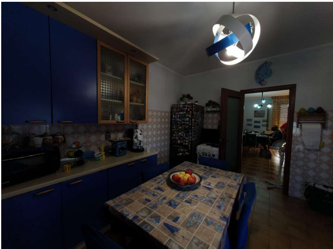
Foto 16. Cucina-pranzo