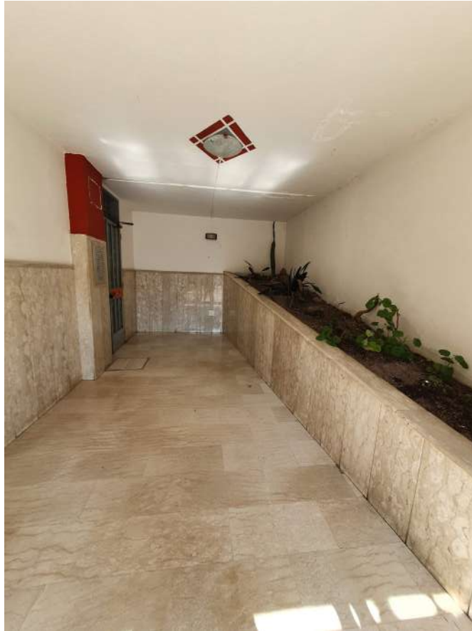
Foto 9. Androne dell'edificio