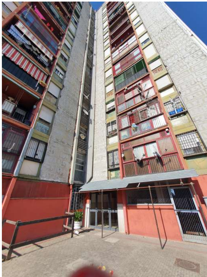
Foto 8. Ingresso all'edificio - lato sud