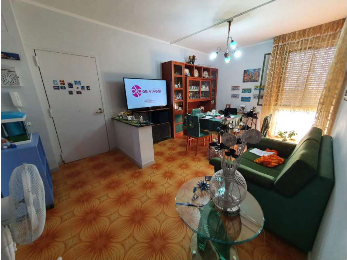
Foto 13. Ingresso-soggiorno dell'unità immobiliare