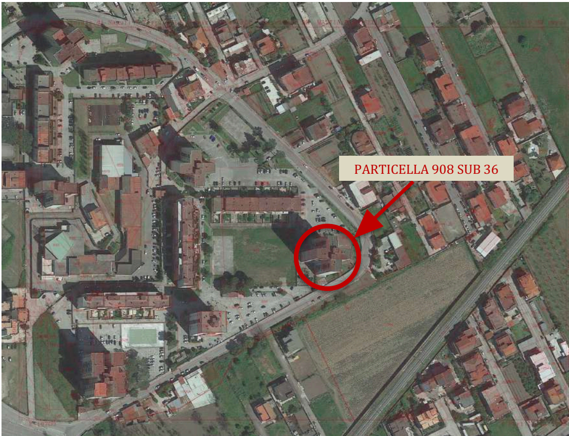
Foto 3. Individuazione dell'edificio in cui è ubicato l'immobile