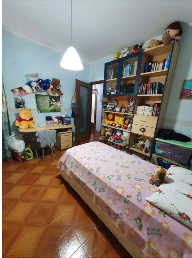
Foto 23. Camera da letto singola 2 - lato est