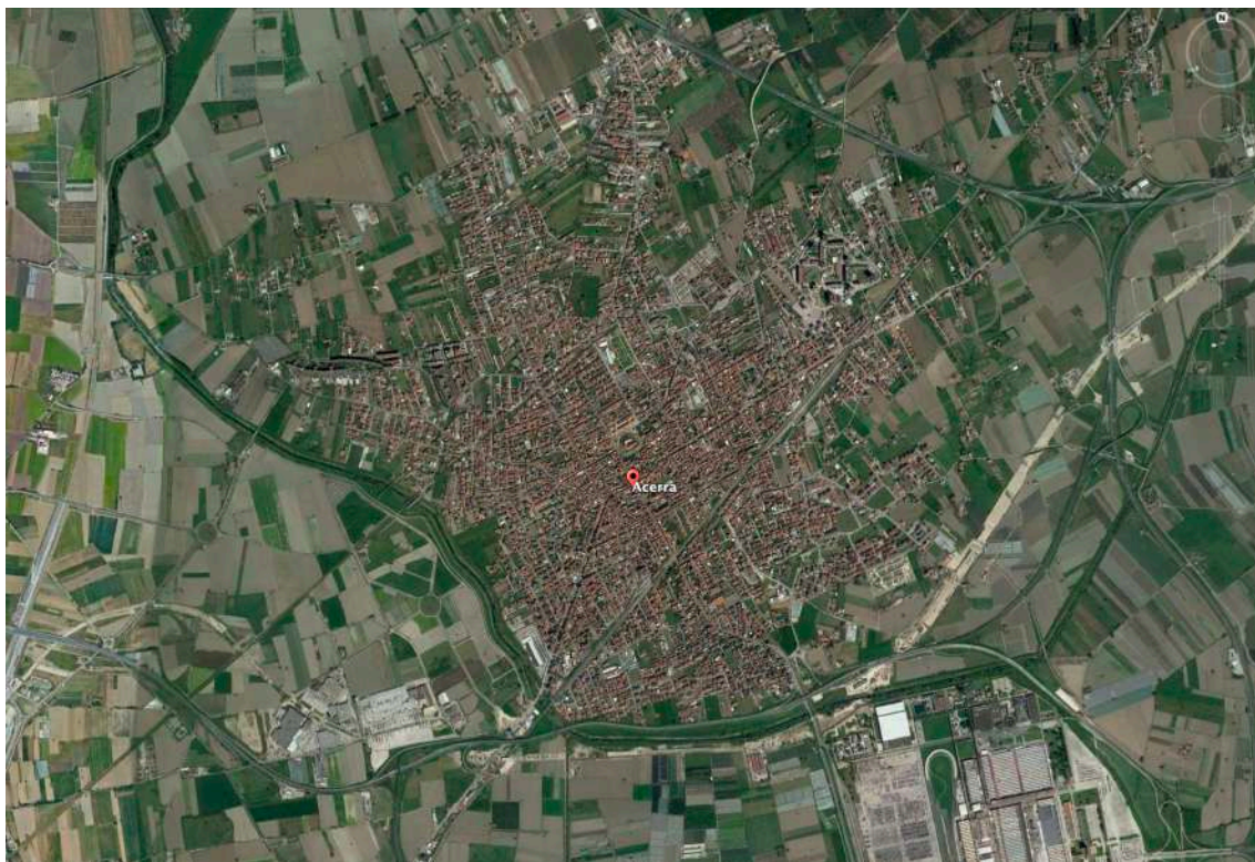
Foto 1. Inquadramento territoriale - Comune di Acerra

Via Niccolò Paganini 29 - Foglio 35, p.lla 908 sub. 36 - Scala AB Interno 32 Piano 8