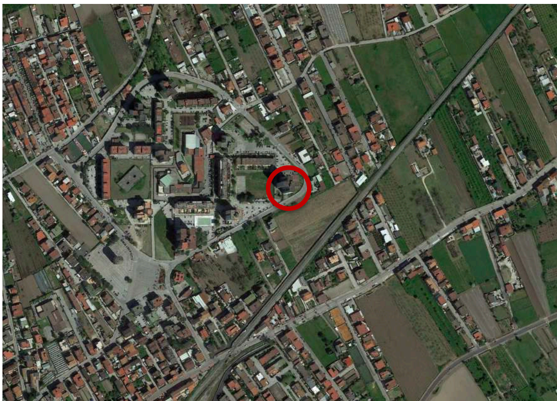
Foto 2. Inquadramento territoriale - individuazione dell'area