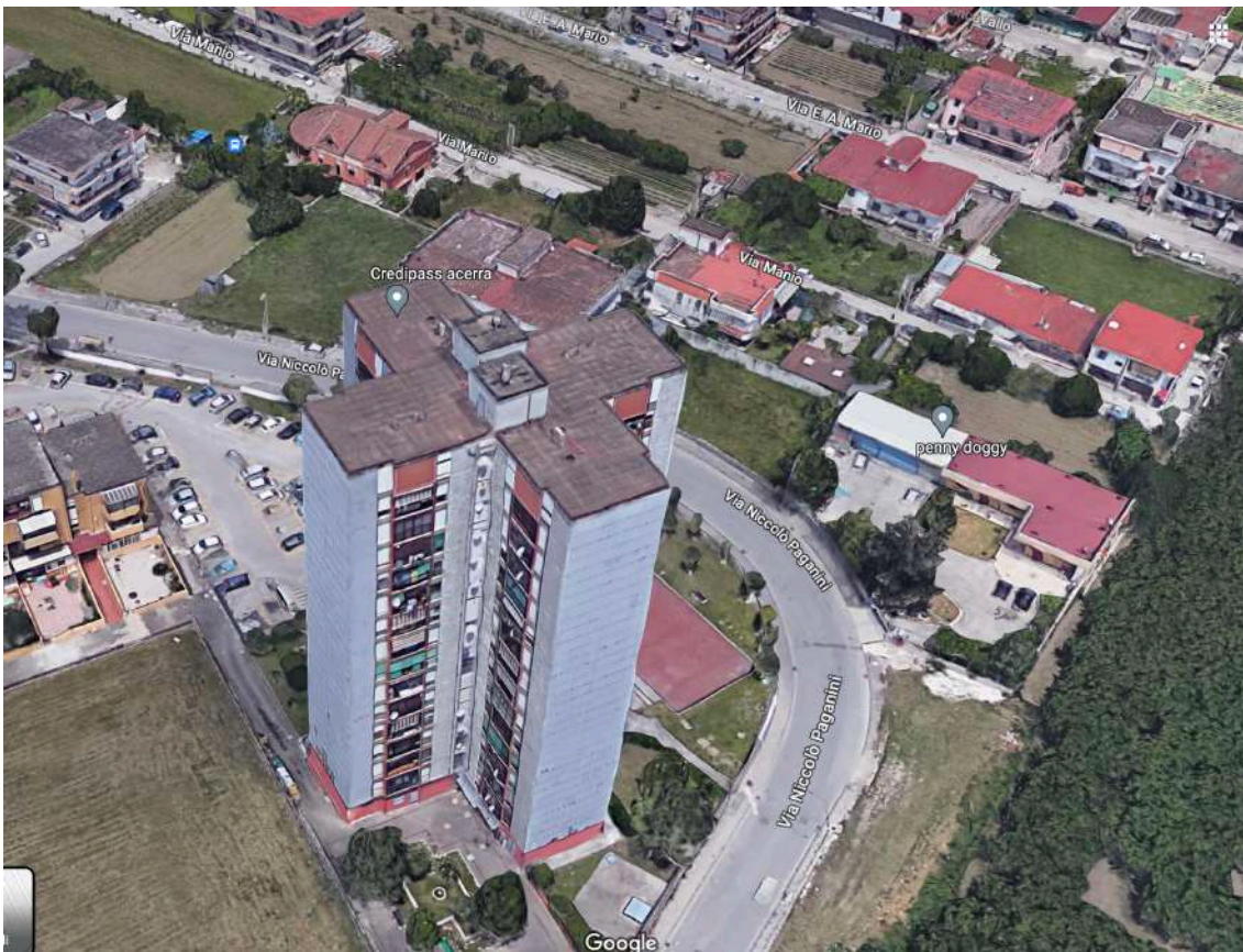
Foto 4. Vista aerea dell'edificio