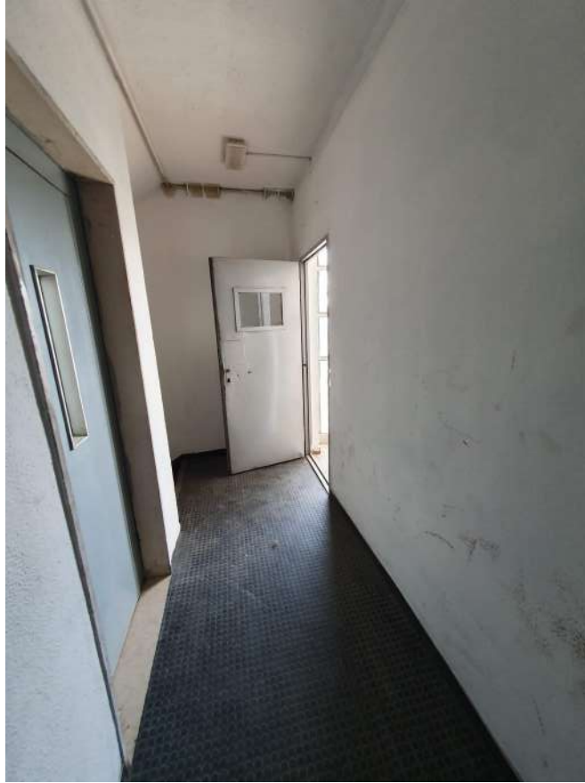
Foto 31. Corridoio di accesso al locale cantinato