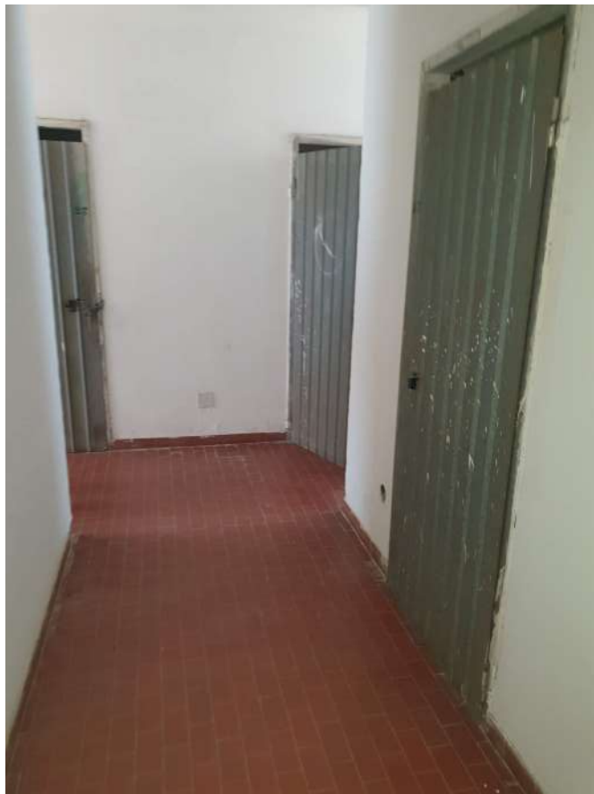
Foto 34. Corridoio di accesso al locale cantinato