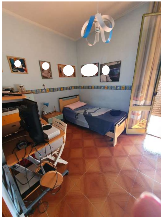
Foto 20. Camera da letto singola 1 - lato est