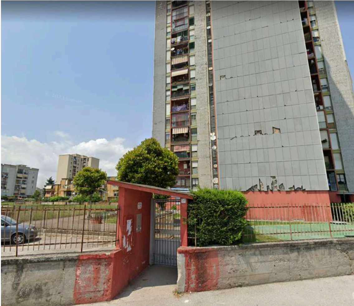
Foto 5. Prospetto sud su via Niccolò Paganini 29