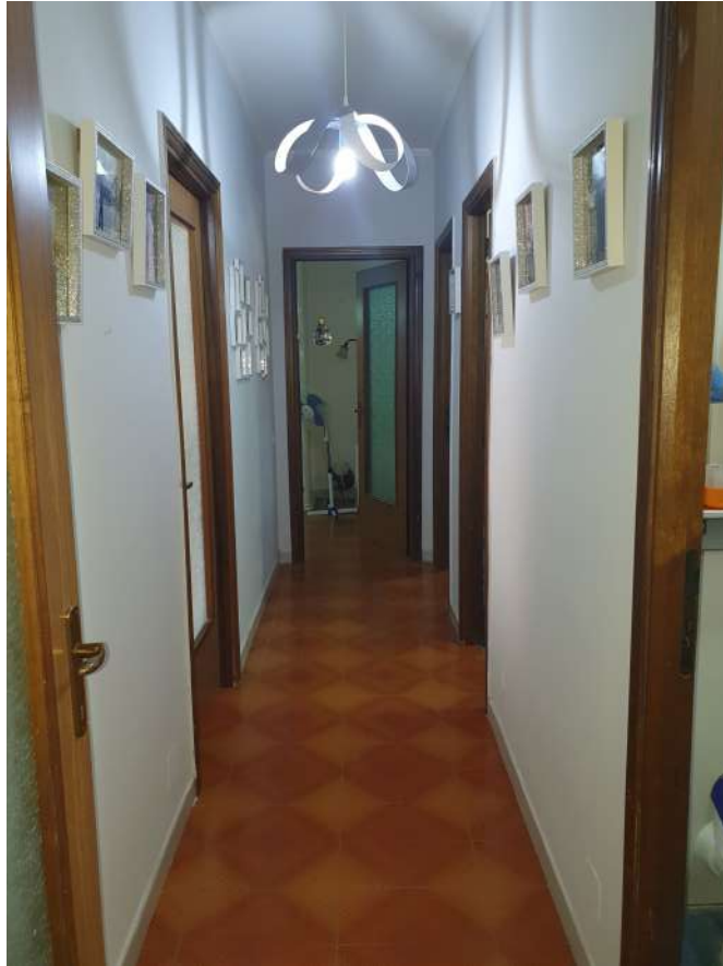
Foto 17. Disimpegno