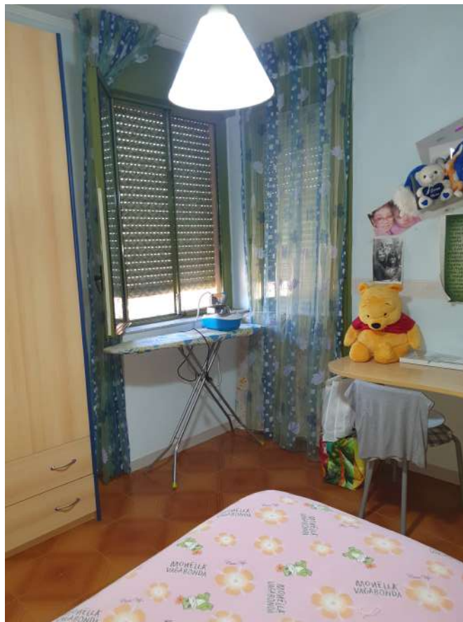
Foto 24. Camera da letto singola 2 - lato est