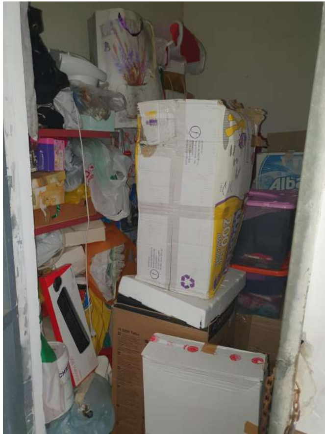
Foto 36. Locale cantinato n. 31 interno