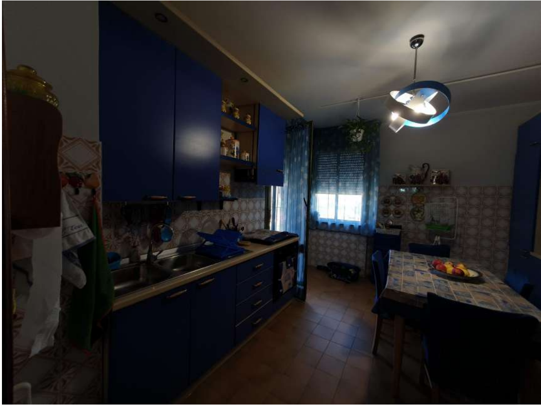
Foto 15. Cucina-pranzo