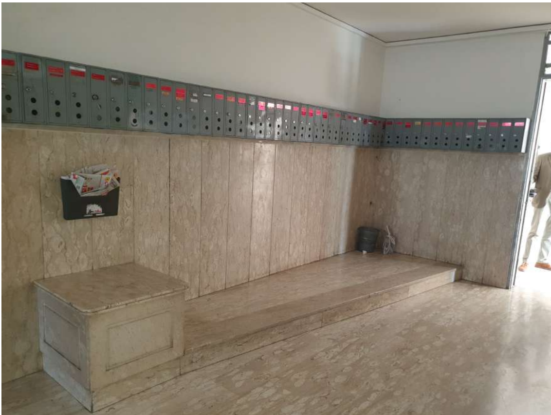
Foto 10. Androne dell'edificio