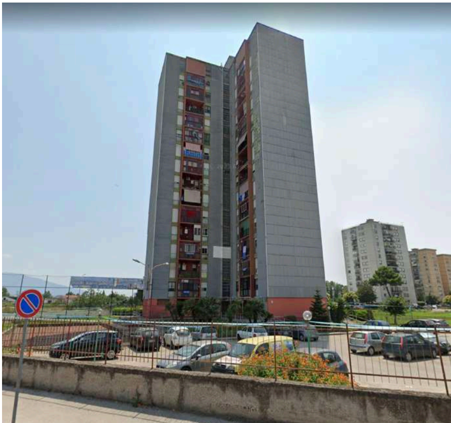
Foto 6. Prospetto nord su via Niccolò Paganini