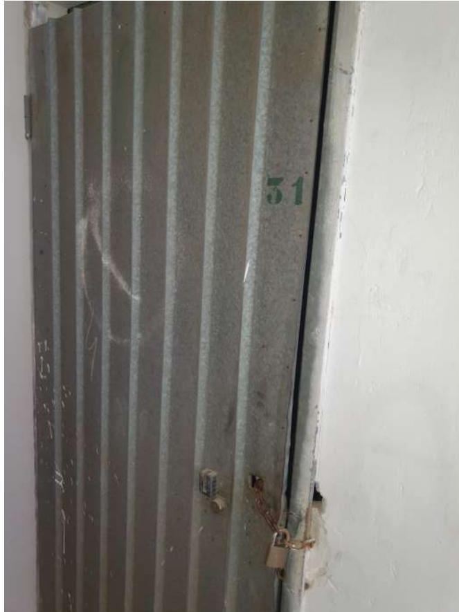
Foto 35. Locale cantinato n. 31 - esterno