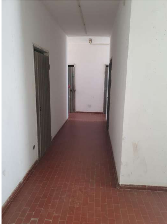
Foto 33. Corridoio di accesso al locale cantinato