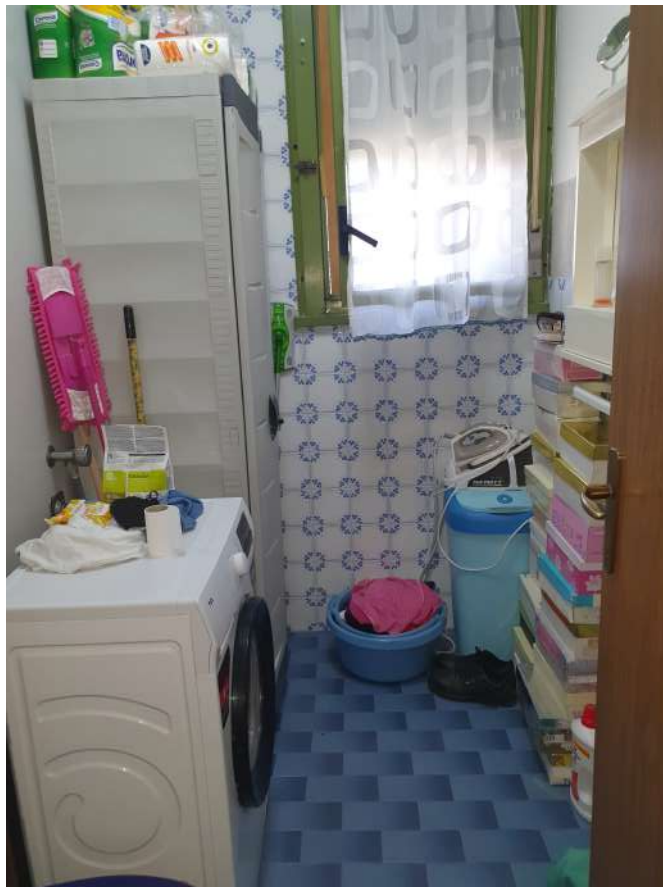
Foto 26. WC/Lavanderia