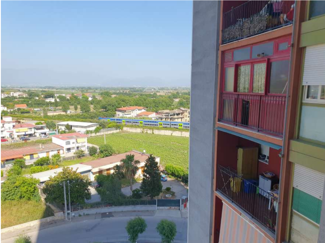
Foto 29. Vista lato nord-est