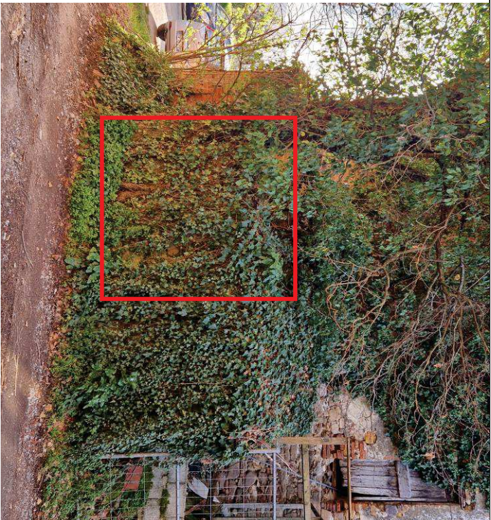
Foto n. 15: Vista su fabbricato rurale identificato al foglio 13, mapp. 53.