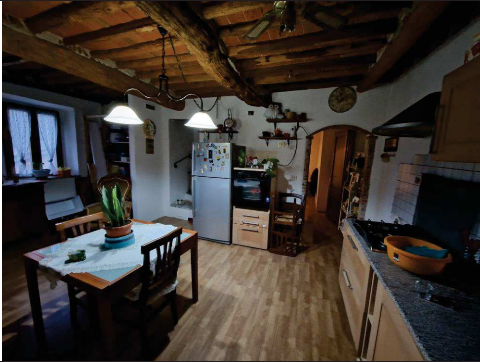
Foto n. 09: Vista su cucina al piano primo, locale appartenente al sub.2.