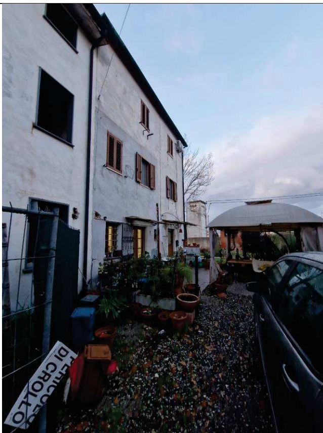
Foto n. 02: Vista prospetto lato Est dell'immobile, confinante con il mapp. 59 (corte) bene comune non censibile ed il mapp. 49.

Confinante a Nord con il mapp. 484 ed a Est con il mapp. 59 (corte) bene comune non censibile.