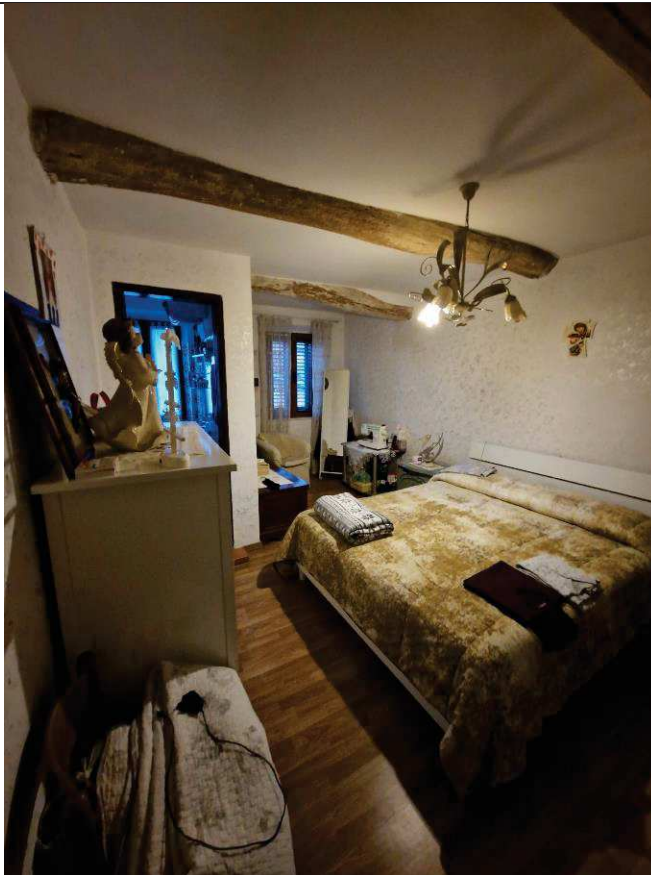
Foto n. 10: Vista su camera da letto e bagno al piano primo, locali appartententi al sub.1.