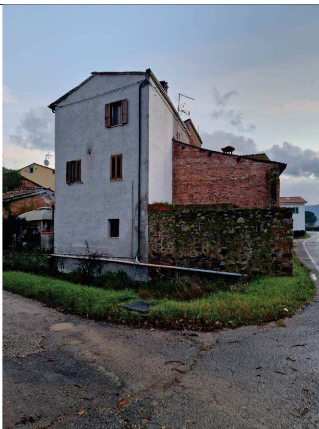
Foto n. 03: Vista prospetto lato Nord-Ovest dell'immobile, confinante a Nord con il mapp. 484 e ad Ovest con il mapp. 45.