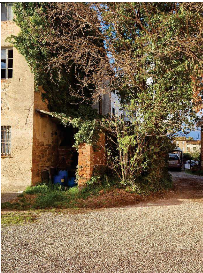
Foto n. 04: Vista sulla corte e sul manufatto ad uso comune, identificati rispettivamente al foglio 13, mapp. 59 e mapp. 51.