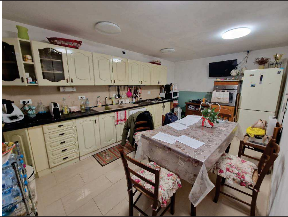
Foto n. 07: Vista su cucina a piano terra, locale appartenente al sub.1.