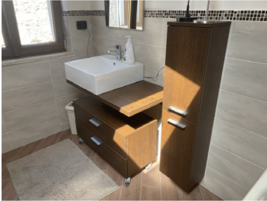
N. 11 - IMG_8738