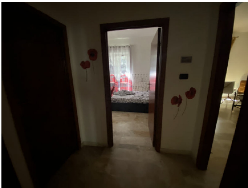
N. 15 - IMG_8745