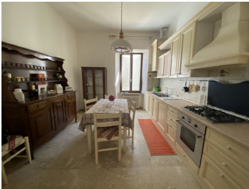
N. 13 - IMG_8741