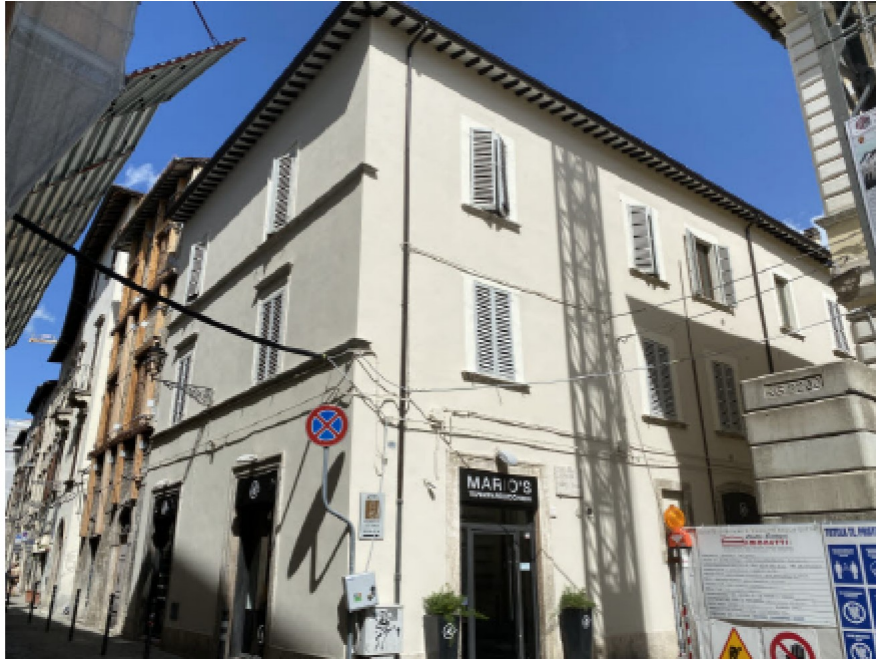
N. 7 - IMG_8385