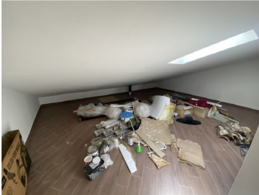
N. 9 - IMG_8735