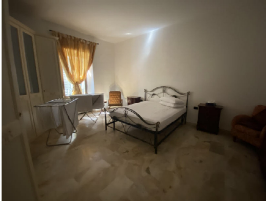
N. 17 - IMG_8748