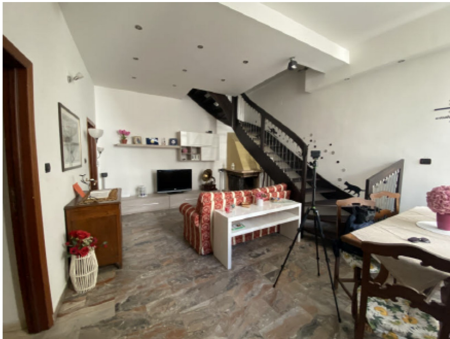
N. 12 - IMG_8739