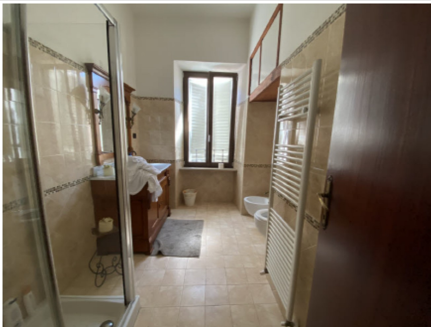
N. 14 - IMG_8743