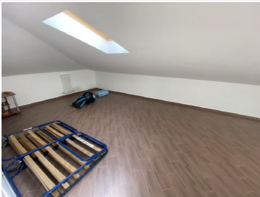
N. 10 - IMG_8736