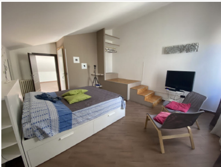
N. 8 - IMG_8733