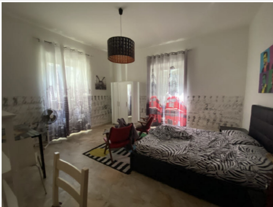
N. 16 - IMG_8746