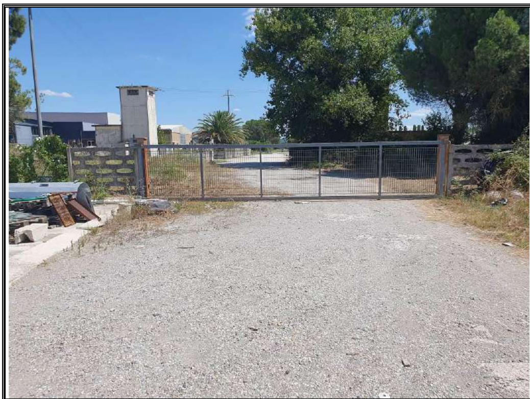
Foto n. 1 Vista del cancello di ingresso e di parte della corte.