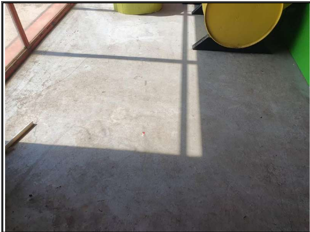
Foto n. 9 Vista interna del locale pignorato con particolare della pavimentazione.