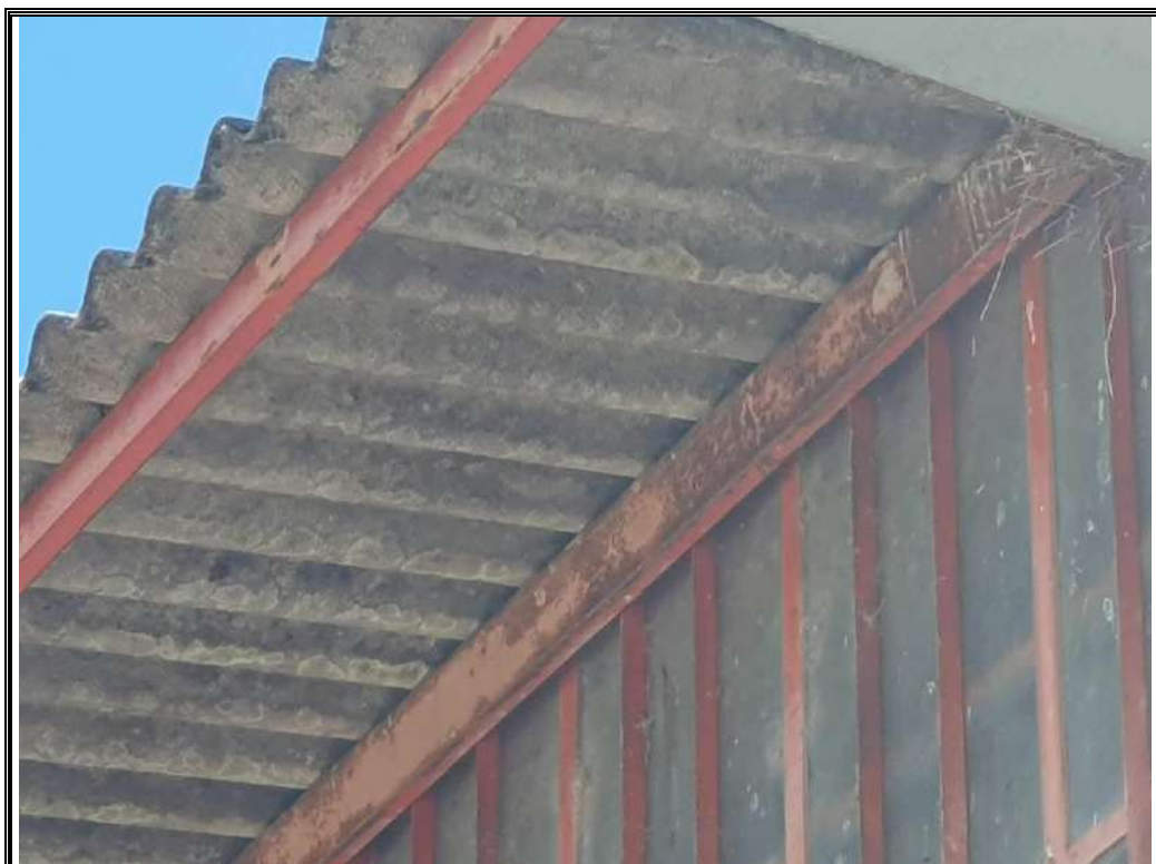
Foto n. 10 Copertura del fabbricato in ondulina di eternit.