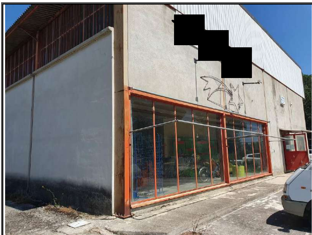
Foto n. 4 Vista esterna del fabbricato e delle vetrate del locale pignorato.