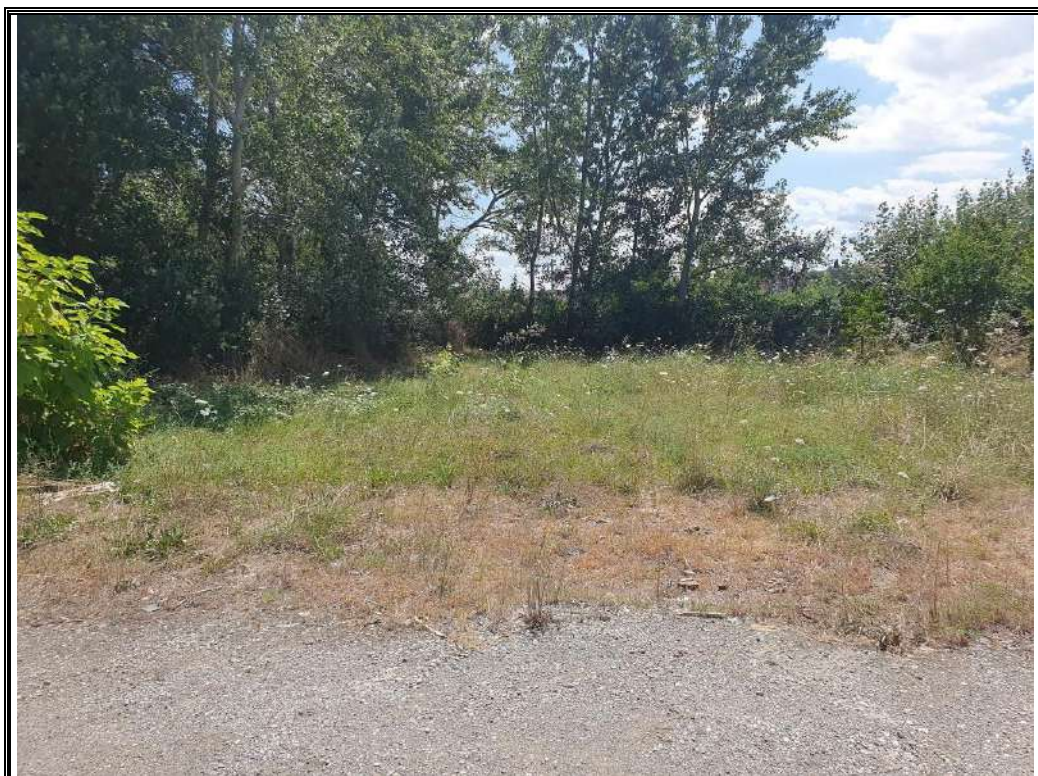
Foto n. 2 Vista di una porzione del terreno.