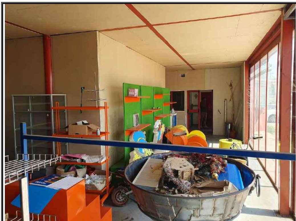
Foto n. 5 Vista interna del locale pignorato.