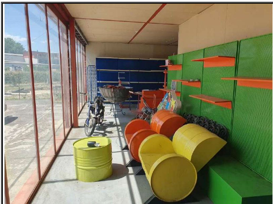
Foto n. 7 Vista interna del locale pignorato.