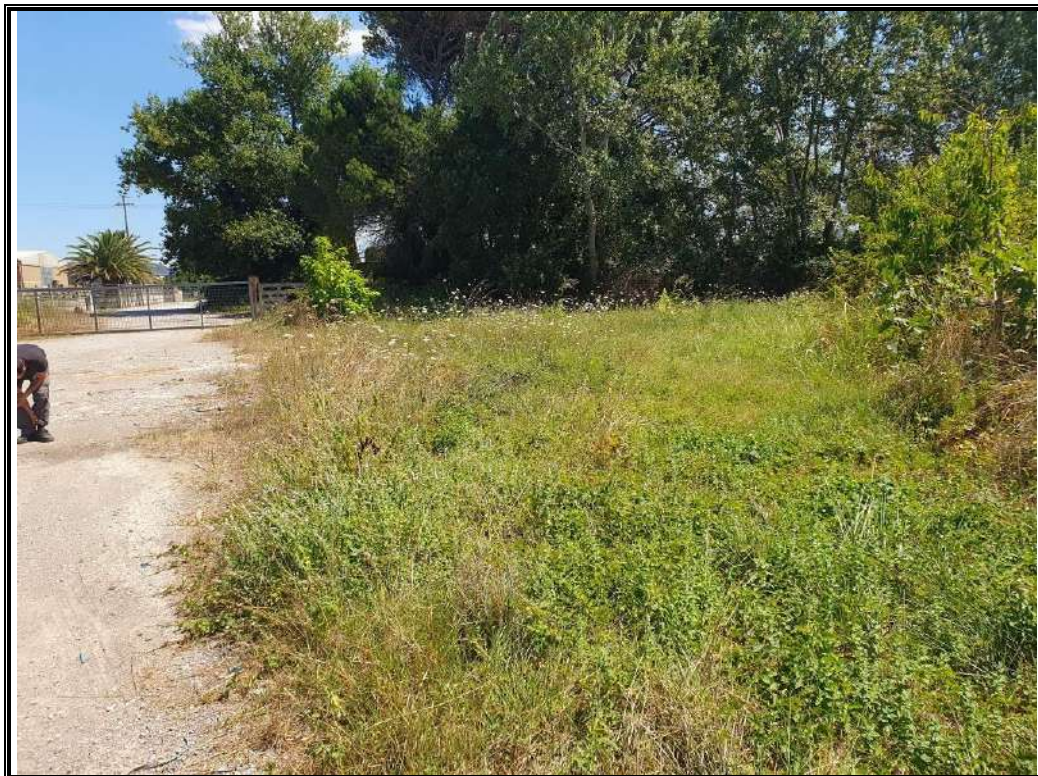
Foto n. 3 Vista di una porzione del terreno.