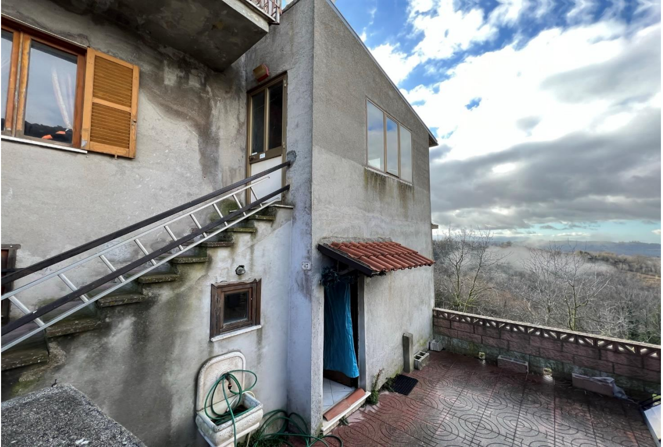
FOTO 13: Veduta esterna accesso vano letto piano S1 per il tramite dell'unità sub. 5