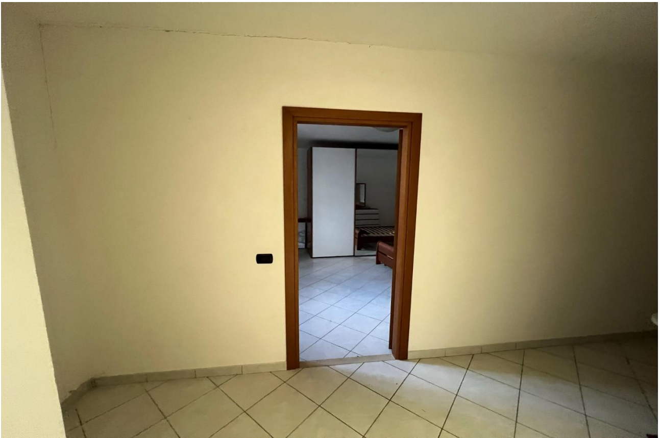
FOTO 11: Veduta interna disimpegno tra unità sub. 5 e vano letto piano S1