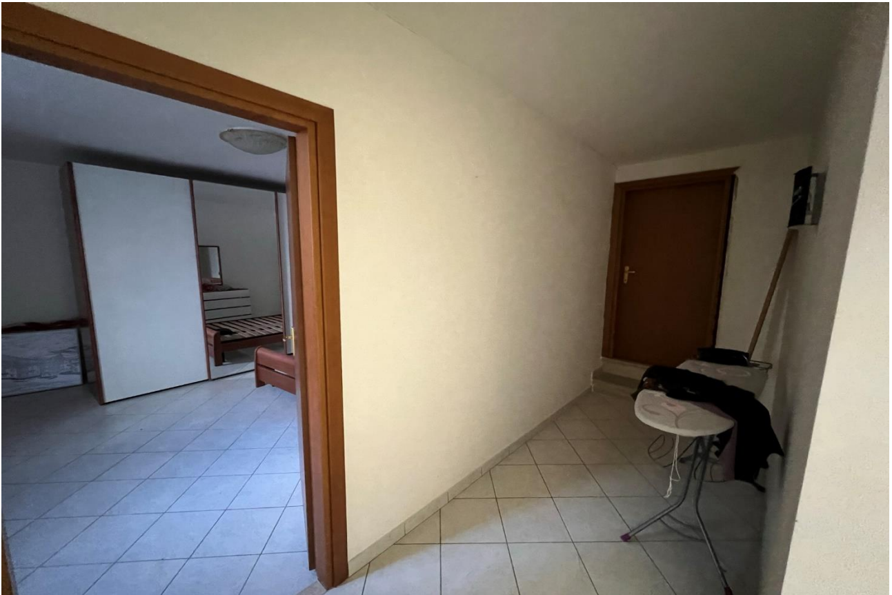
FOTO 14: Veduta interna disimpegno tra unità sub. 5 e vano letto piano S1