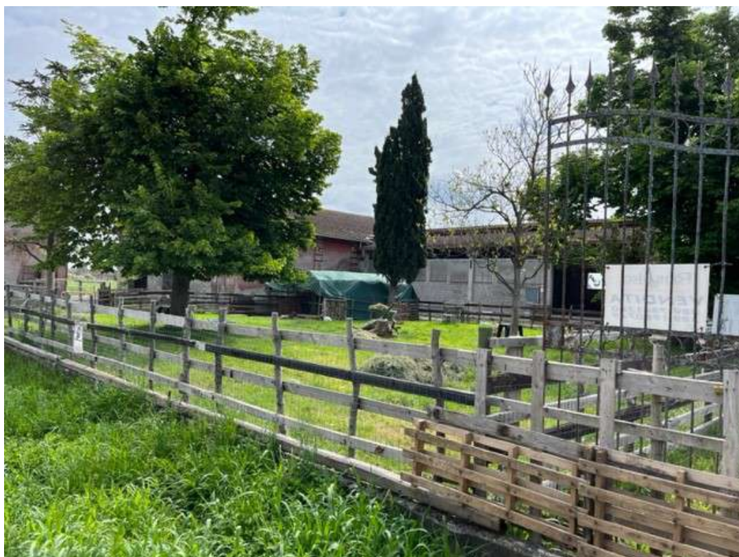
Fotografia 7– Vista del giardino antistante l'immobile dalla pubblica via