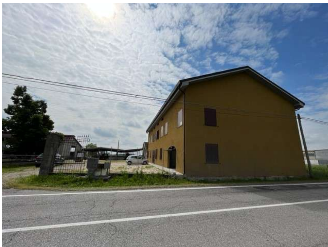
Fotografia 3 – Vista dalla pubblica via Zambone