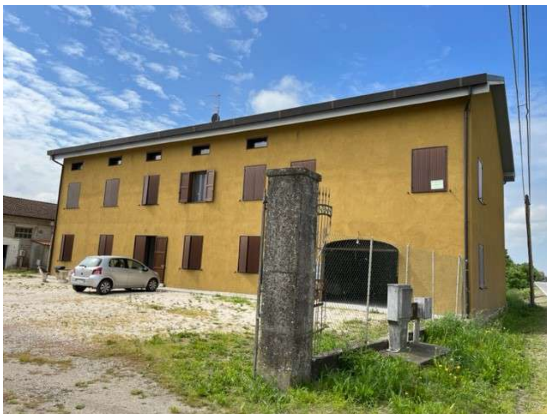
Fotografia 2 – Vista dell'ingresso sulla pubblica via Zambone