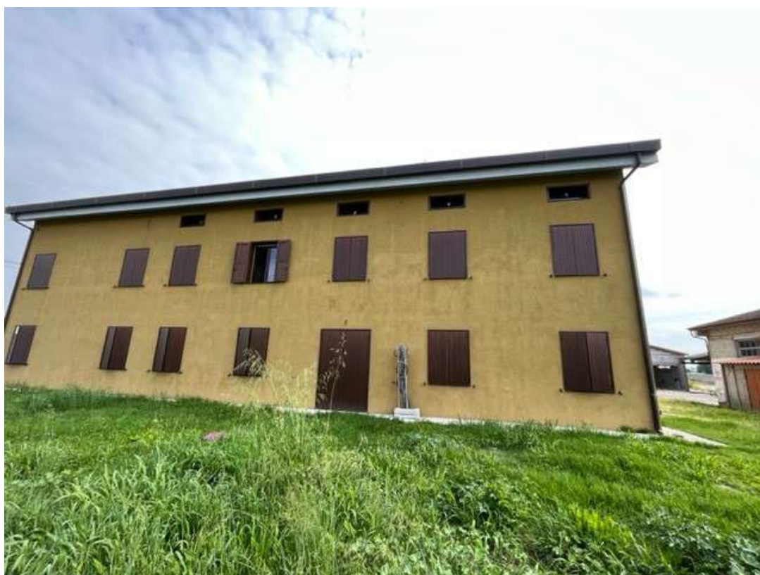
Fotografia 4 – Vista dal retro dell'immobile