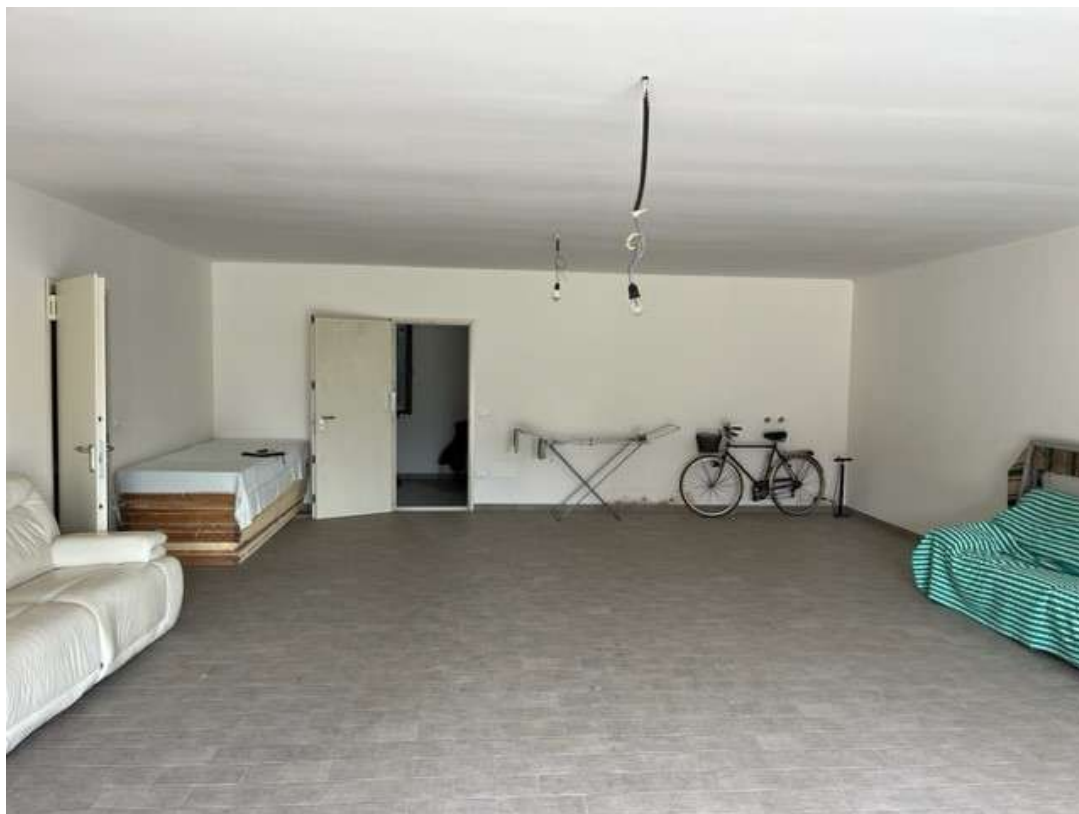
Fotografia 48- Vista del garage