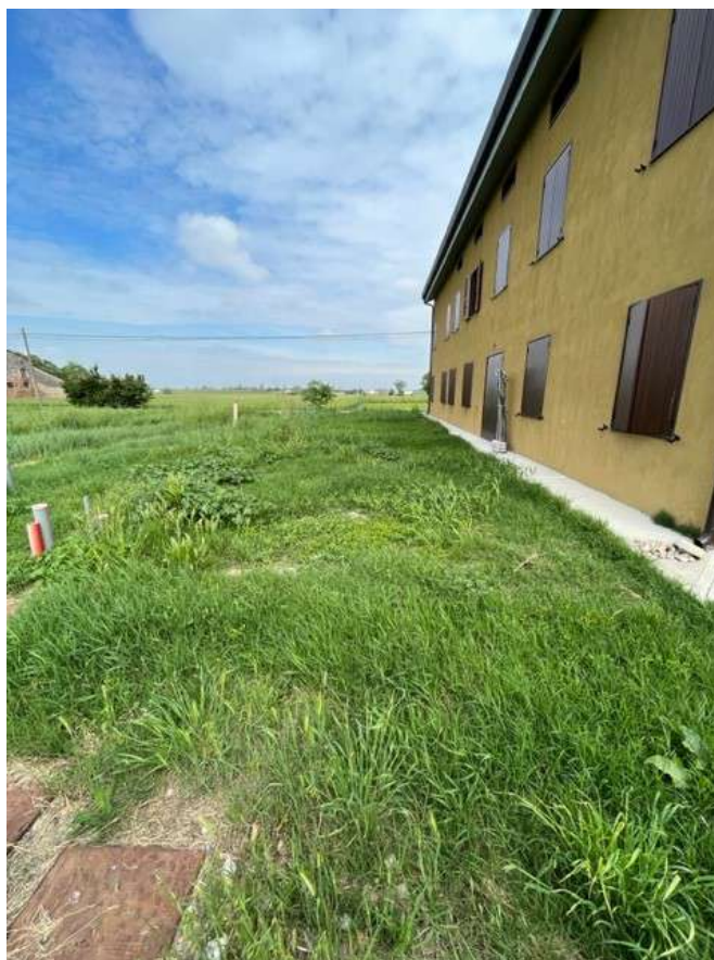
Fotografia 6– Vista del cortile retrostante