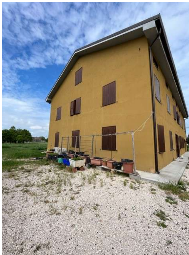
Fotografia 5 – Vista dell'immobile dal cortile