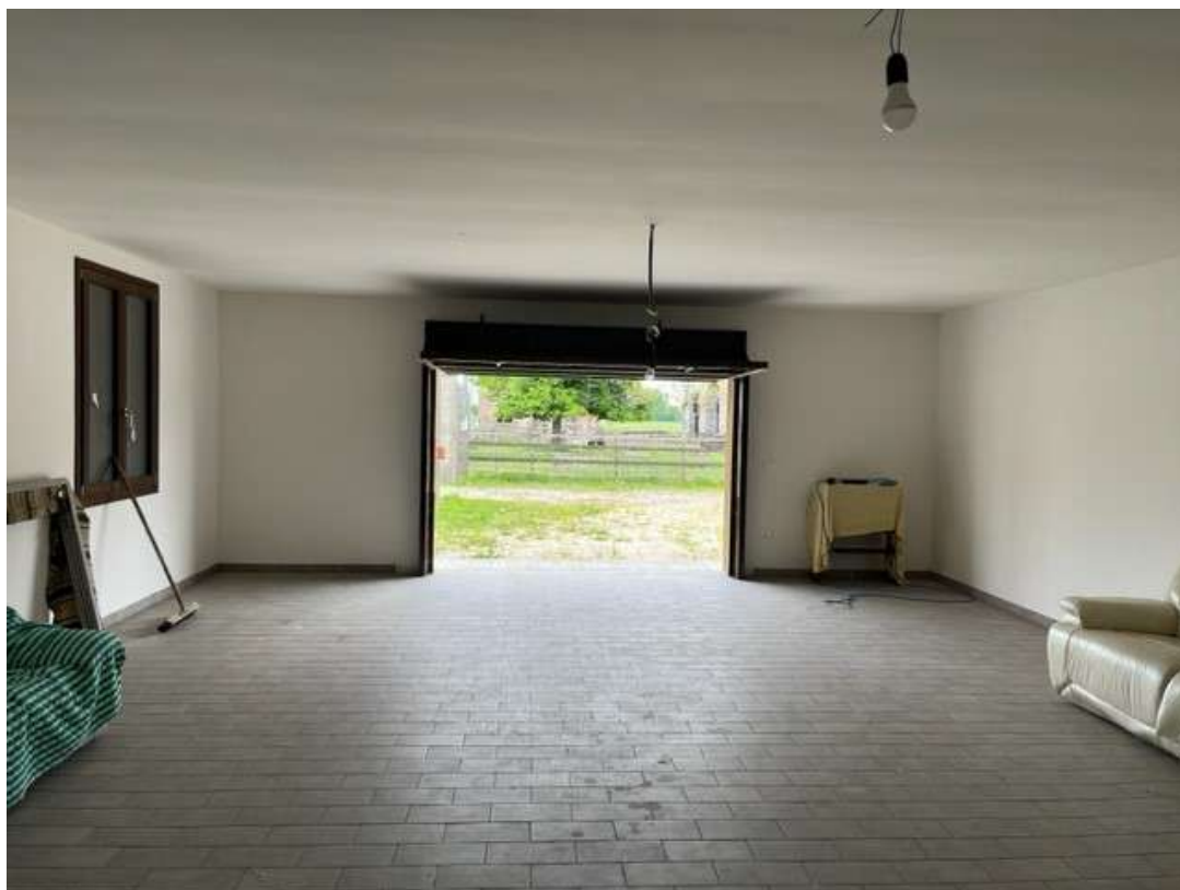
Fotografia 49 - Vista del garage