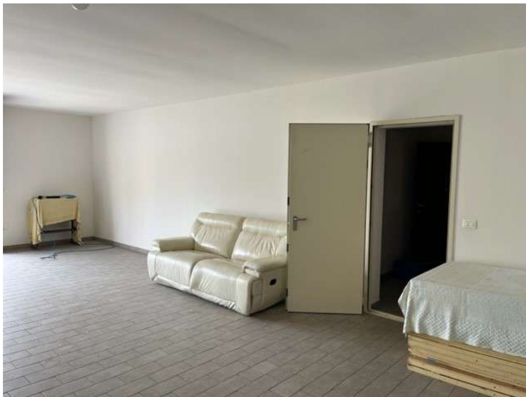
Fotografia 50 – Vista del garage