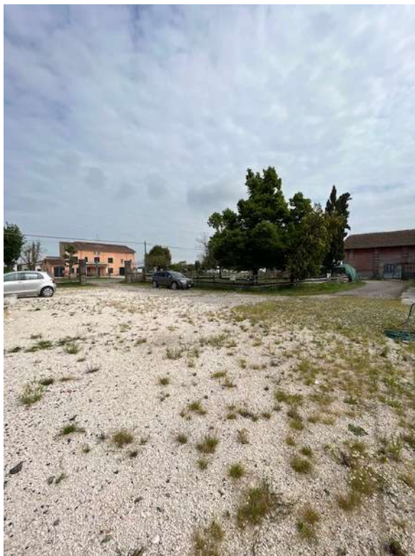
Fotografia 9 – Vista del cortile e giardino antistante l'immobile