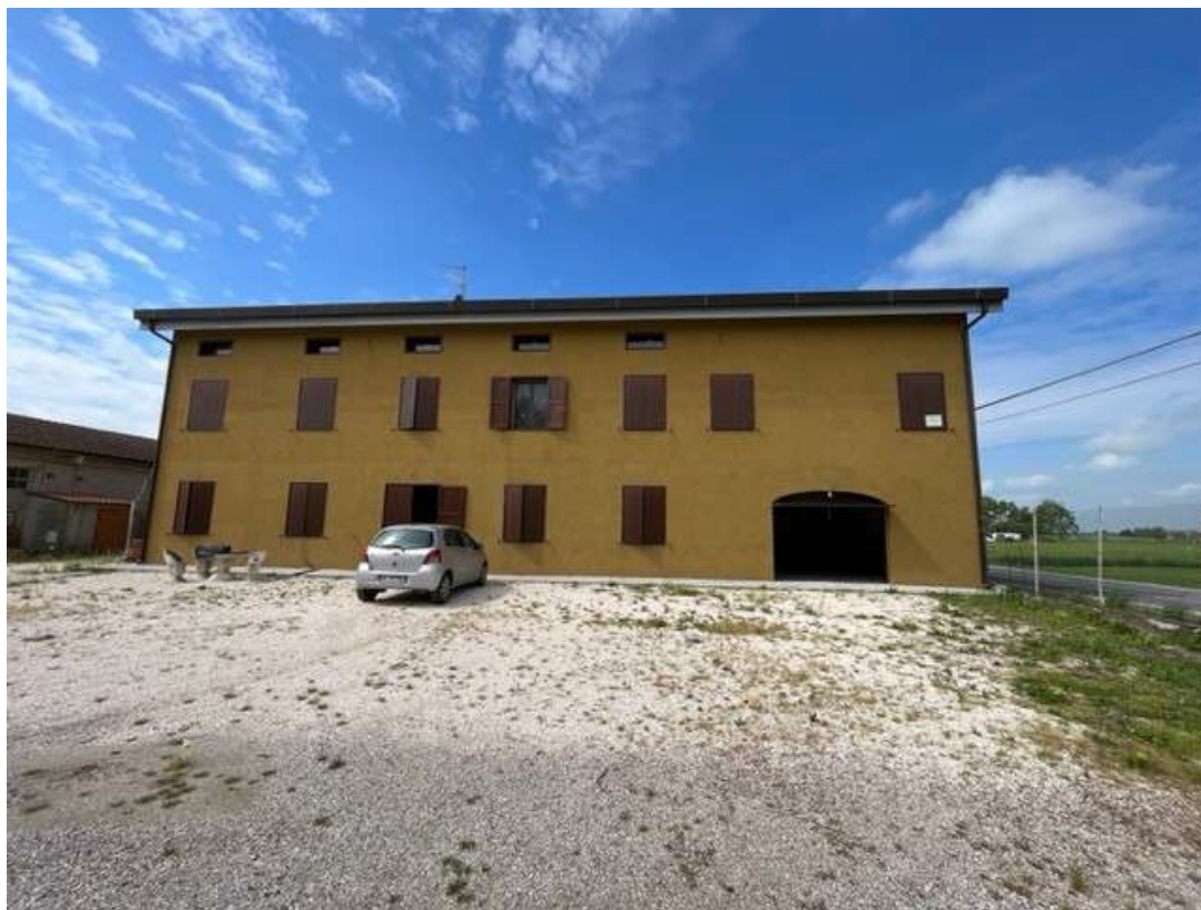
Fotografia 1 – Vista dal cortile di proprietà