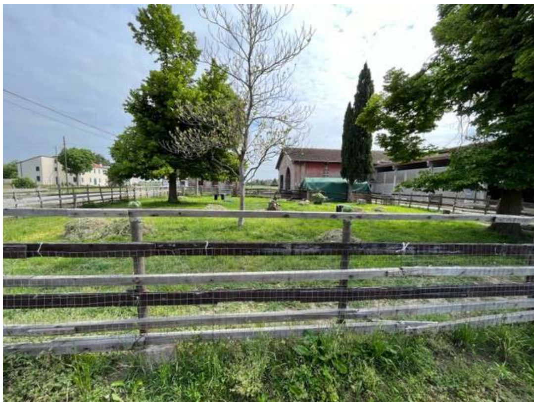
Fotografia 8 – Vista del giardino antistante