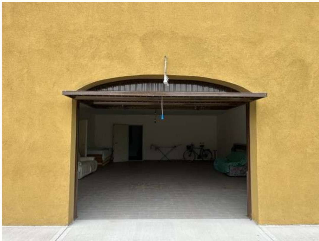
Fotografia 47 – Vista del garage