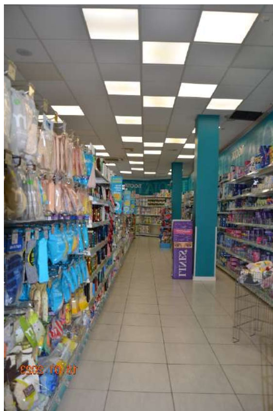
Corsie di vendita