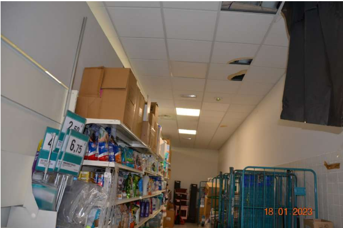
Ripostiglio, il controsoffitto risulta frantumato in alcuni punti per lavori di manutenzione degli impianti.