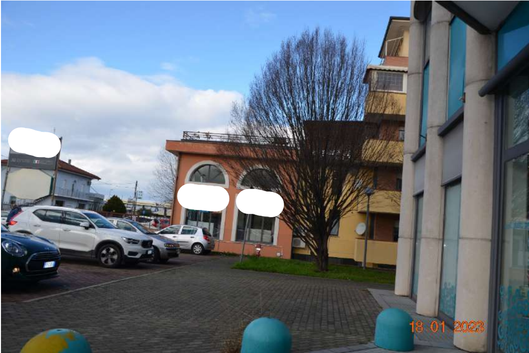
Parcheggio sul fronte, in prossimità dell'ingresso del negozio.