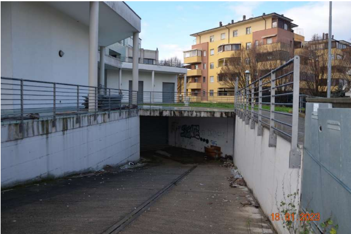
Rampa di accesso al piano interrato