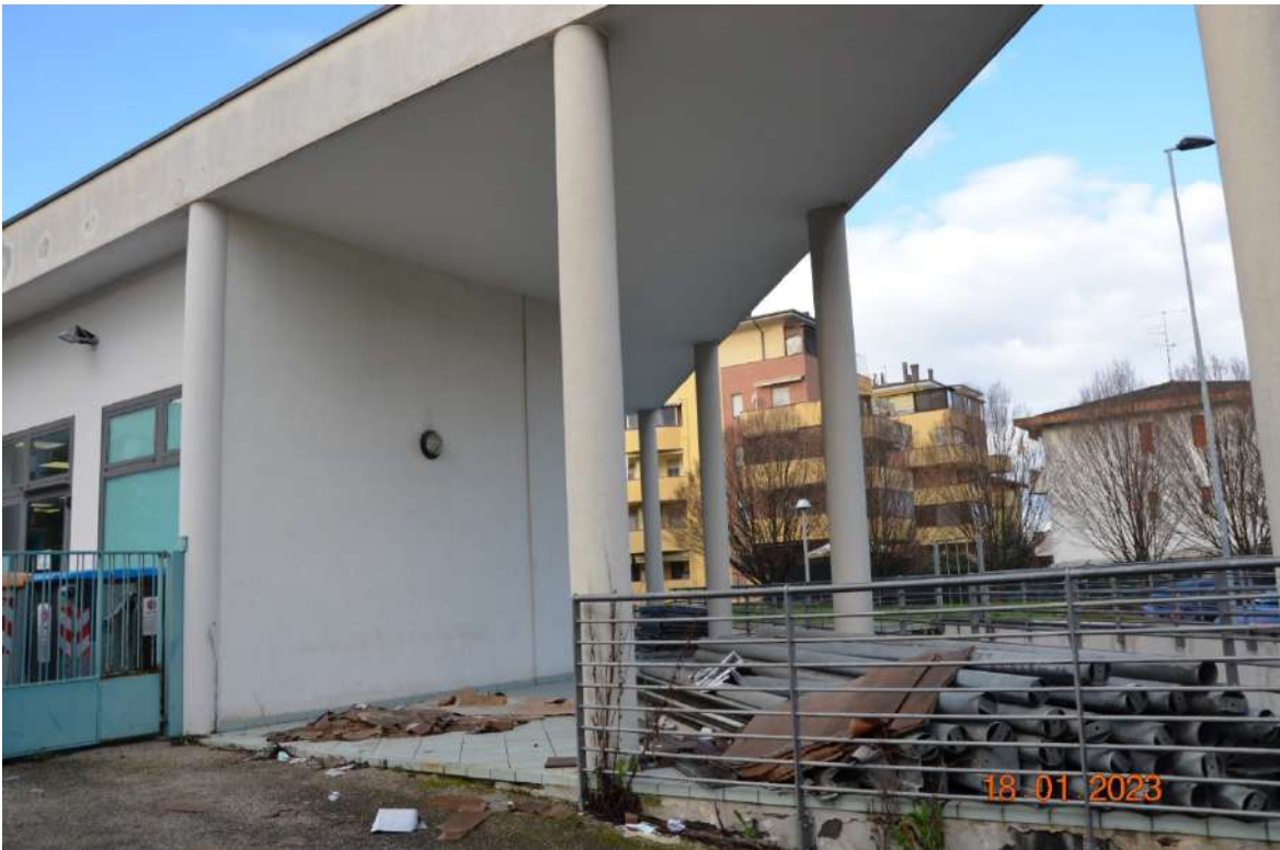
Sul retro un porticato, con materiali di risulta per recenti lavori di manutenzione degli impianti