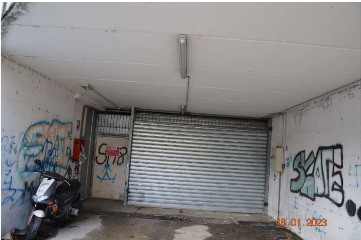
Ingresso al piano interrato