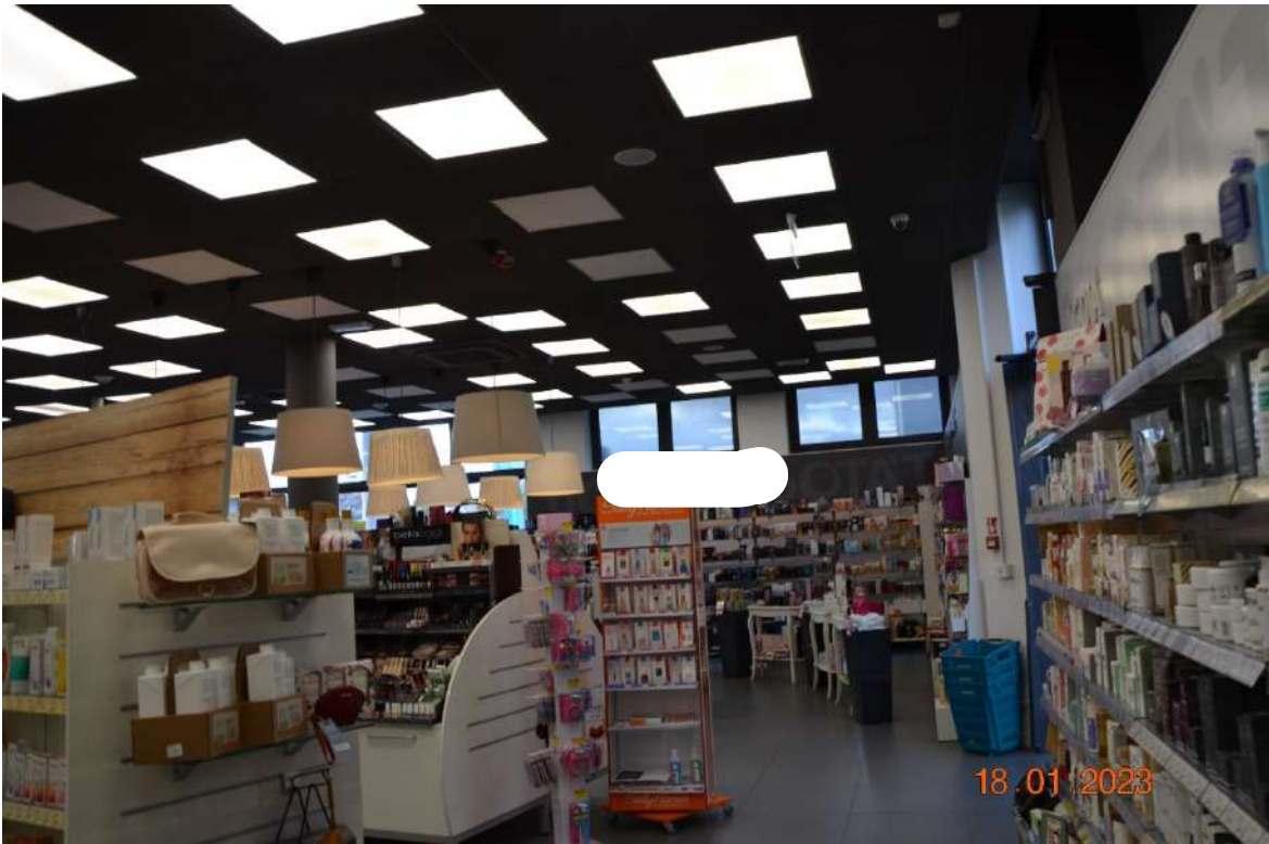
Porzione del negozio sul lato strada