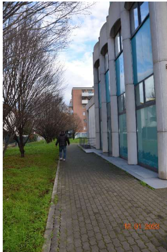
Lato Rimini dell'immobile la pavimentazione delimita la proprietà