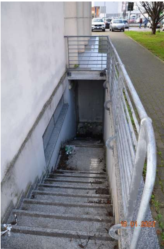
Scala d'emergenza antincendio