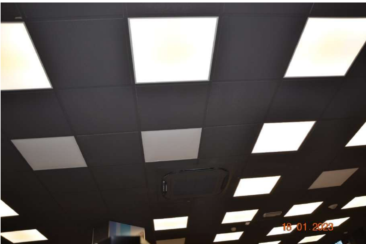
Particolare del controsoffitto con plafoniere luminose.