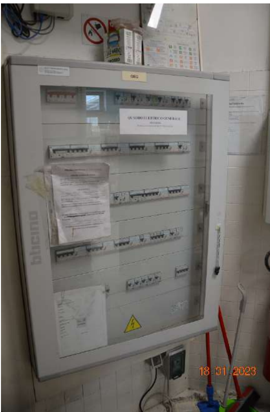
Quadro elettrico del negozio