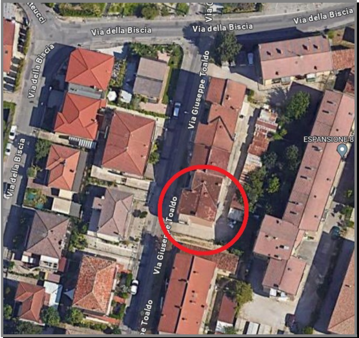
Vista aerea (via G. Toaldo, 34)