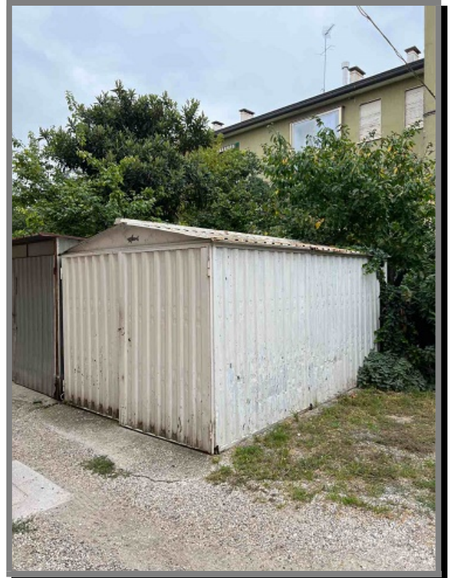
Vista GARAGE IN LAMIERA