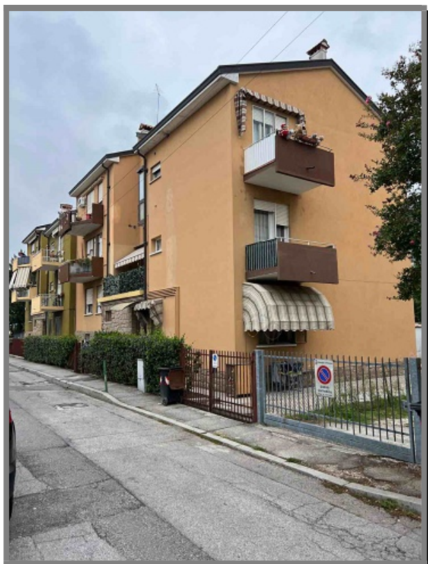
Vista EDIFICIO CIVICO 34