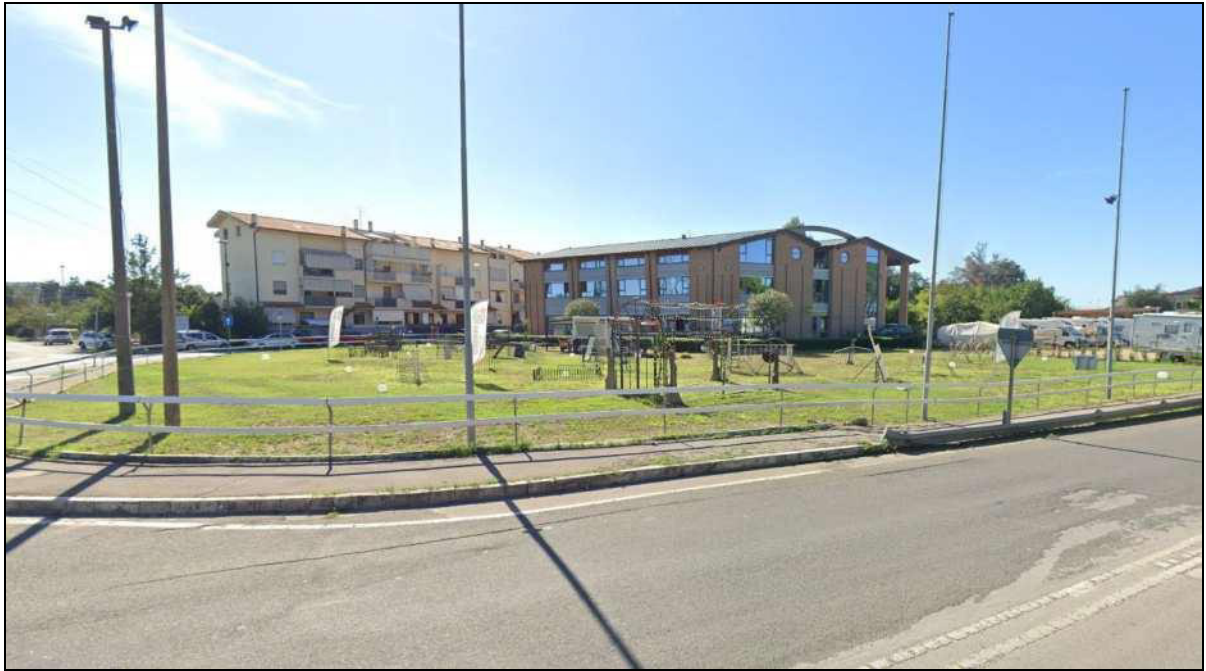
Vista da e via Aurelia Antica