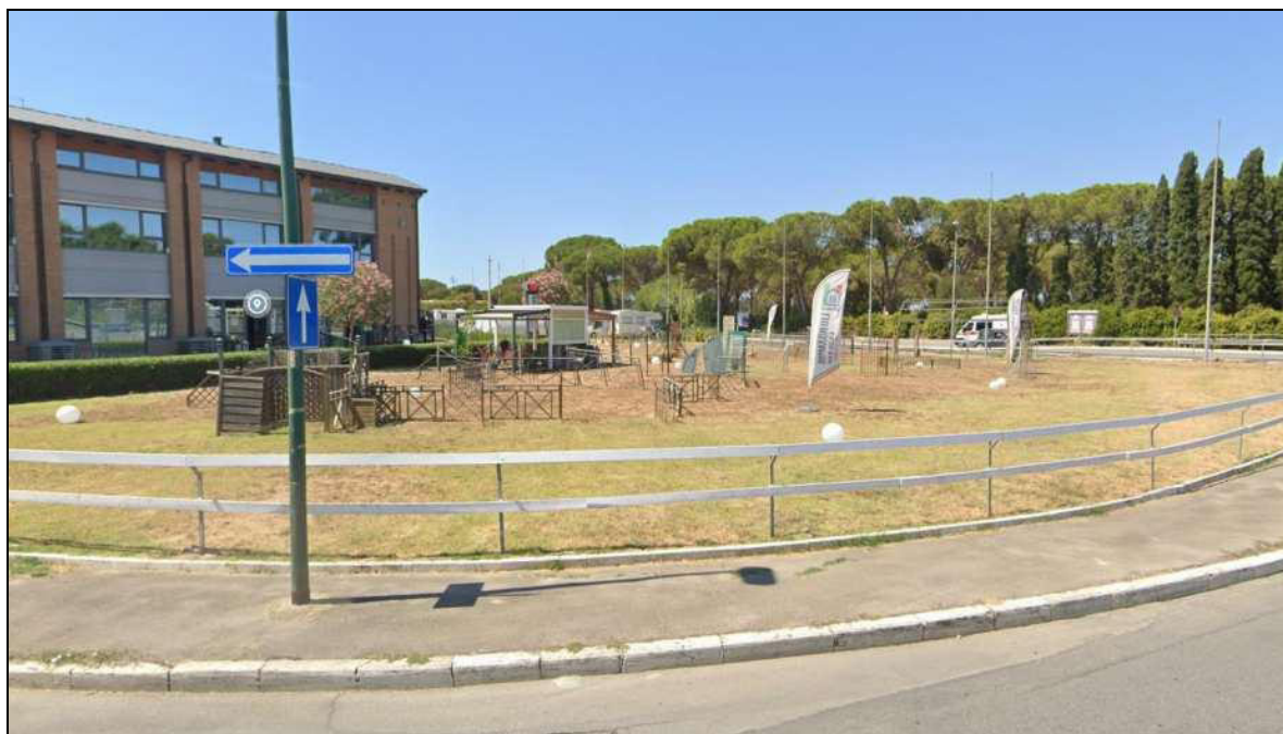
Vista da e via Davide Lazzaretti