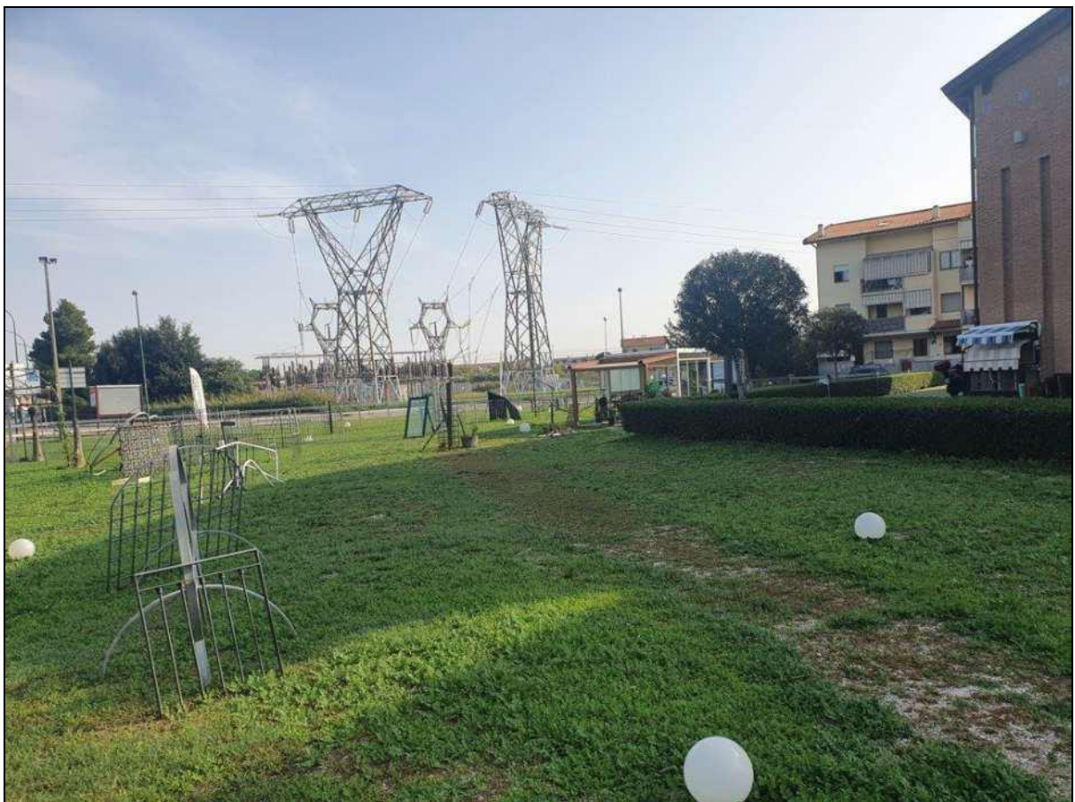
Vista dalla particella confinante (p.lla 93)