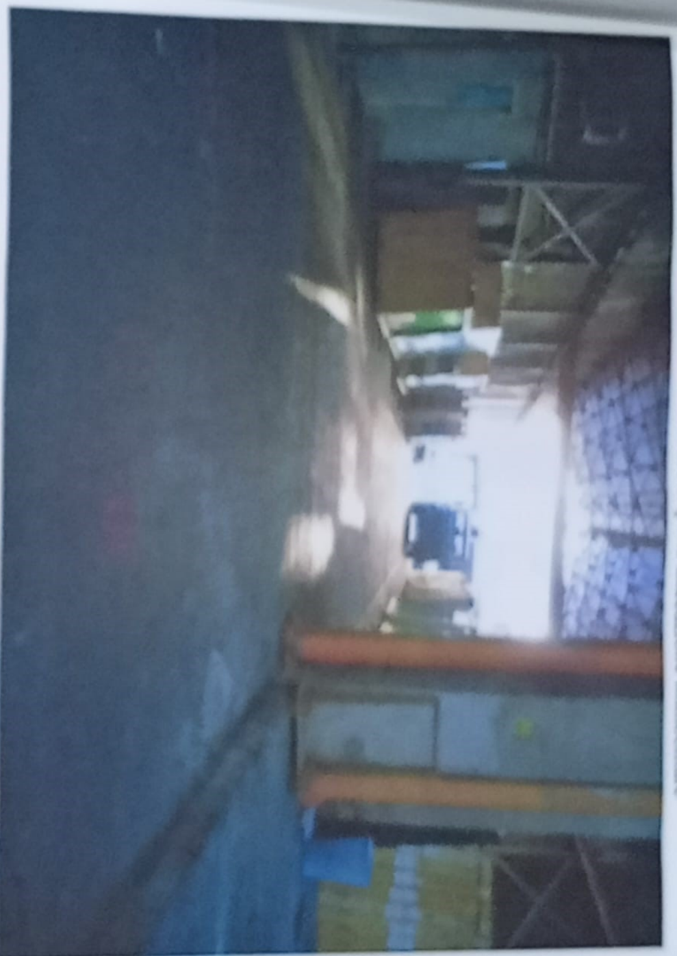
Foto n° 7 e 8 - Primo Capannone, vista B e particolare copertura e sist. illuminazione