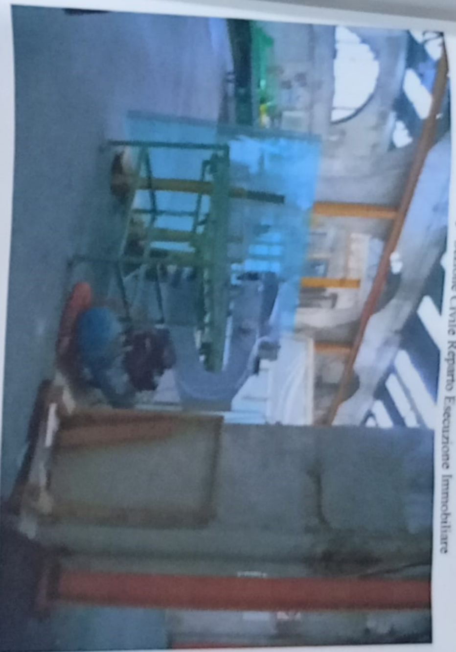
Foto n° 13 e 14 – secondo capannone con particolare sist. illuminazione naturale