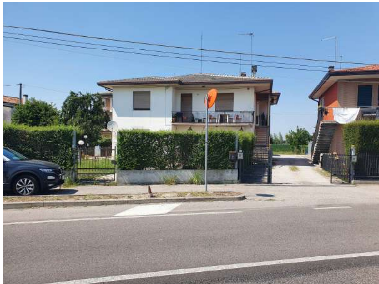
Foto n. 2: Lotto n.1 - Vista Sud del fabbricato del quale fa parte l'unità abitativa oggetto di pignoramento.