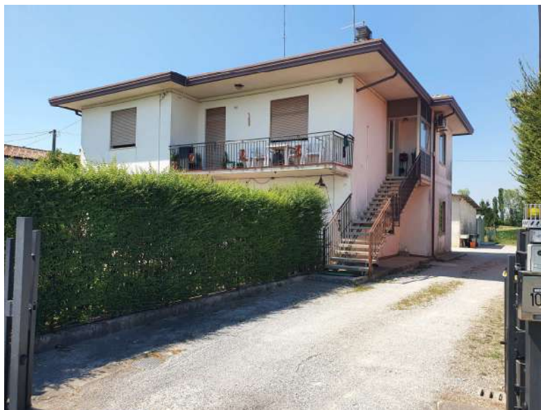
Foto n. 3: Lotto n.1 Vista Sud-Est del fabbricato del quale fa parte l'unità abitativa oggetto di pignoramento e dell'accesso carrajo in reciproca servitù di passaggio con terzi.