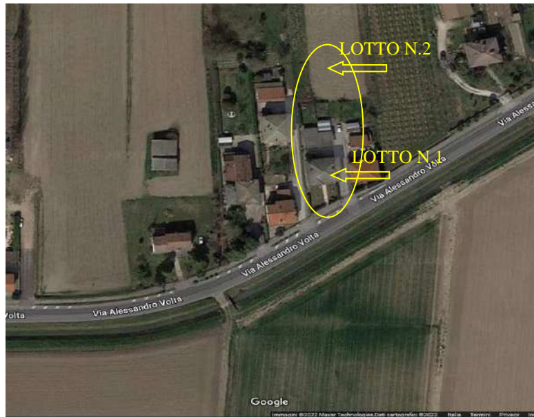
Foto n. 1: Vista dall'alto: Geolocalizzazione dei beni oggetto di pignoramento.