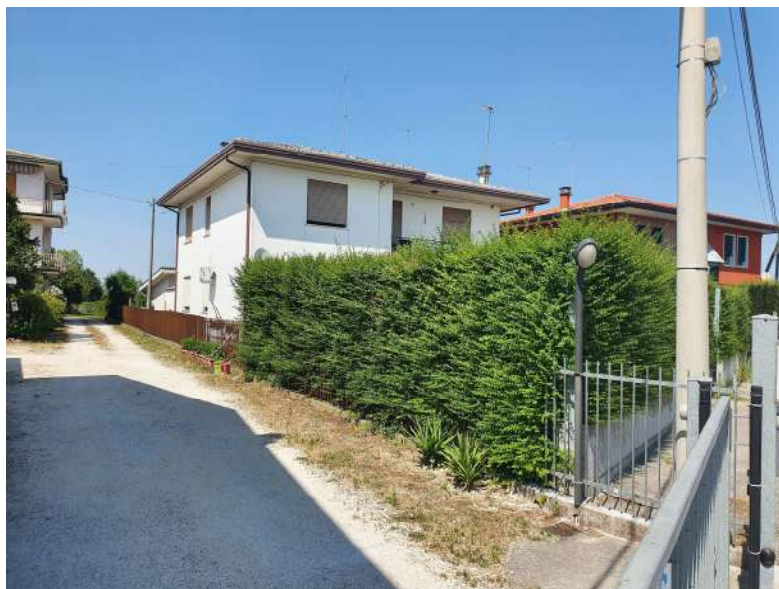
Foto n. 4: Lotto n.1 Vista Sud-Ovest del fabbricato del quale fa parte l'unità abitativa oggetto di pignoramento.