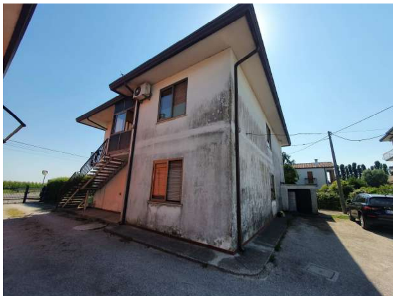
Foto n. 13: Lotto n.1 Vista Nord-Est del fabbricato del quale fa parte l'unità abitativa oggetto di pignoramento e dell'accesso carraio in reciproca servitù di passaggio con terzi.