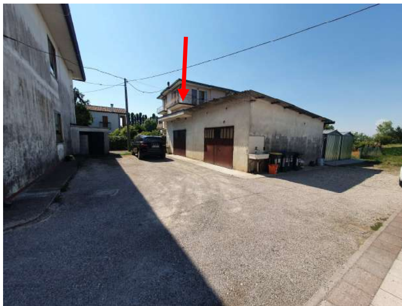
Foto n. 15: Lotto n.1 Vista Sud-Est del fabbricato ad uso garage del quale fa parte l'unità oggetto di pignoramento.