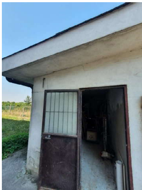
Foto n. 17: Vista del magazzino a Nord (non autorizzato) in aderenza al garage oggetto di pignoramento (lotto n.1) previsto in demolizione.