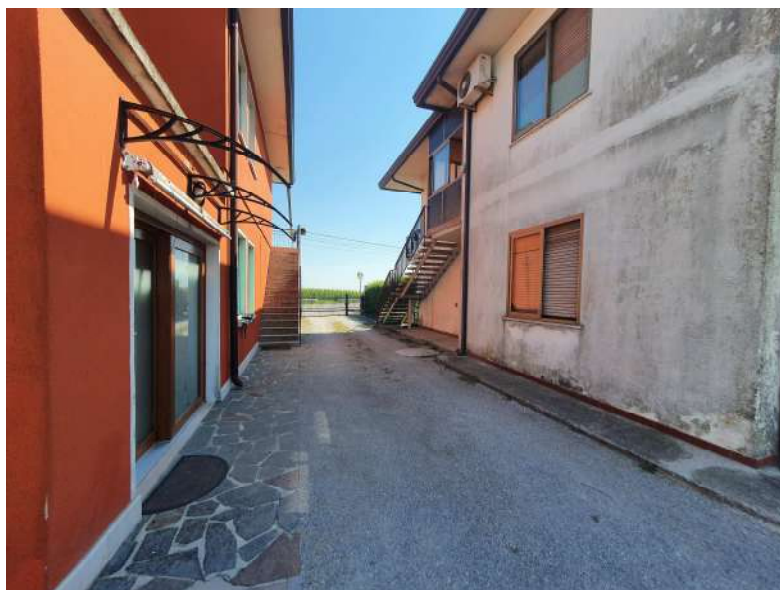
Foto n. 14: Vista dell'accesso carraio in reciproca servitù di passaggio con terzi.