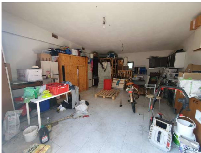
Foto n. 18: Lotto n.1 Vista interna del garage oggetto di pignoramento.