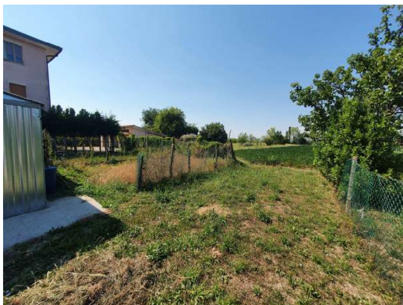
Foto n. 20: Lotto n.2 Vista da Sud-Est del terreno oggetto di pignoramento.