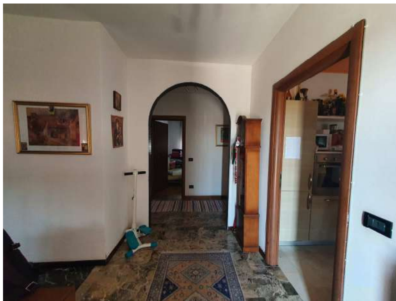
Foto n. 5: Lotto n.1 Vista interna dell'ingresso all'abitazione a piano terra oggetto di pignoramento.