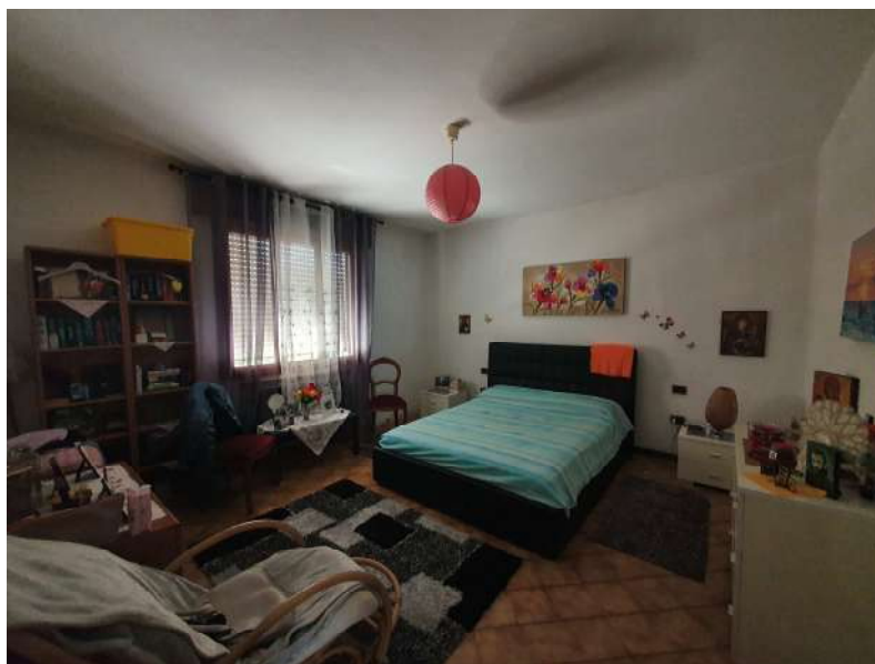
Foto n. 10: Lotto n.1 Vista interna della camera matrimoniale a Ovest.