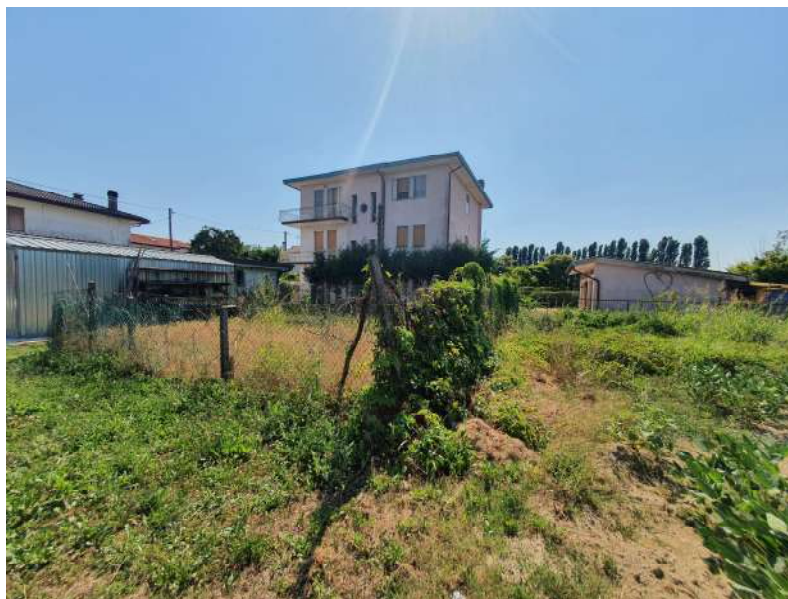
Foto n. 21: Lotto n.2 Vista da Est del terreno oggetto di pignoramento.