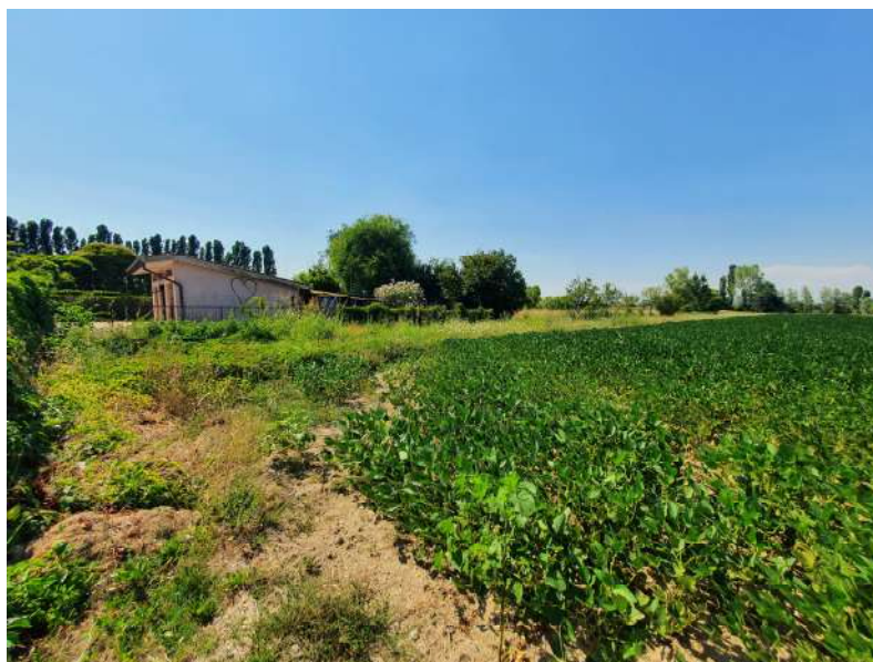
Foto n. 22: Lotto n.2 Vista da Est del terreno oggetto di pignoramento.