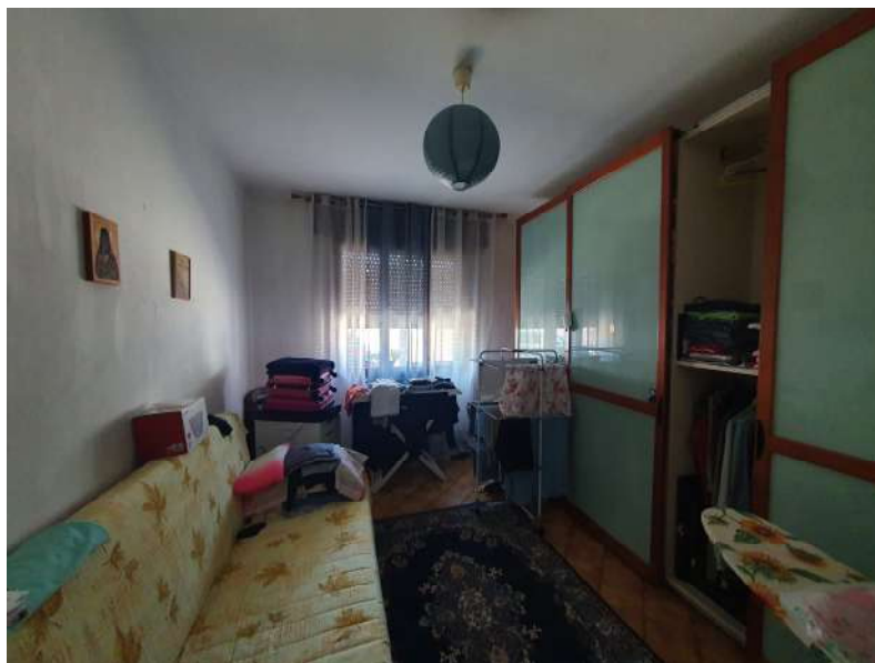
Foto n. 11: Lotto n.1 Vista interna della cameretta centrale a Nord.