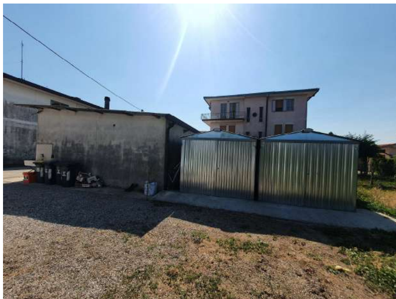
Foto n. 19: Vista Est dei box in lamiera eretti da terzi, su area comune (lotto n.1) e terreno (Lotto n.2) oggetto di pignoramento.