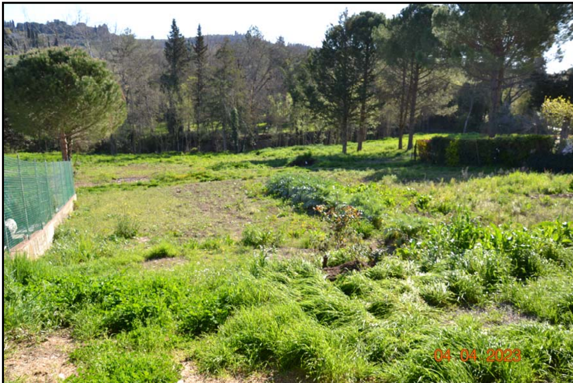
Fotografia n. 7 P.lle 450, 451, F. 123