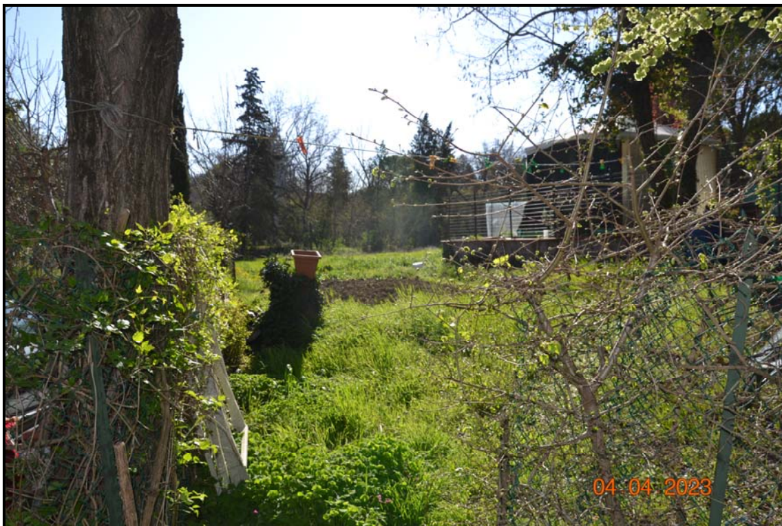
Fotografia n. 5 P.lla 461, F. 123