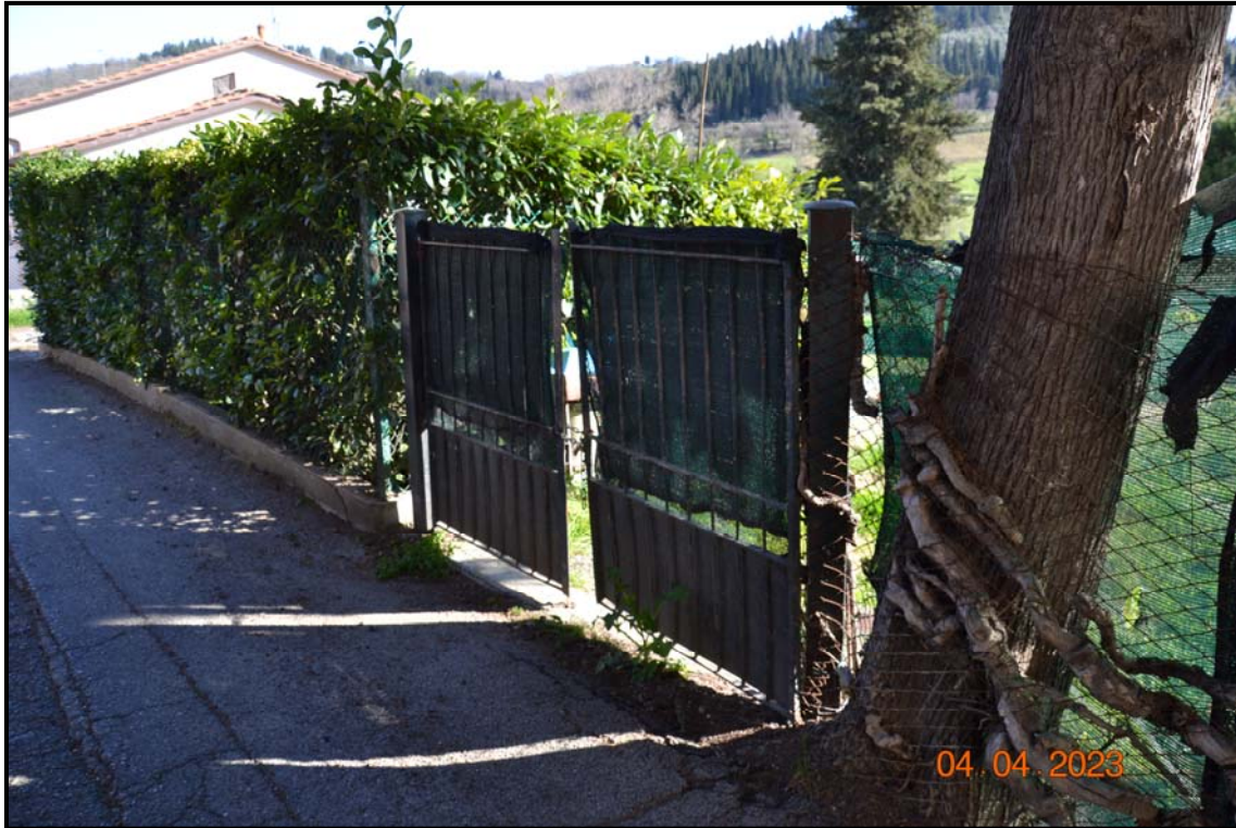
Fotografia n. 6 Accesso da via Polvereto alla p.lla 450, F. 123