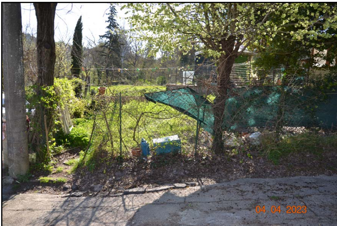
Fotografia n. 4 Accesso dalla SP93 alla p.lla 461, F. 123