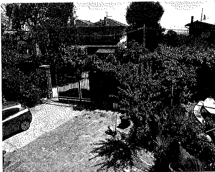
foto n.6-EsposizioneSud/Ovest- scala esterna con balastra in pietra