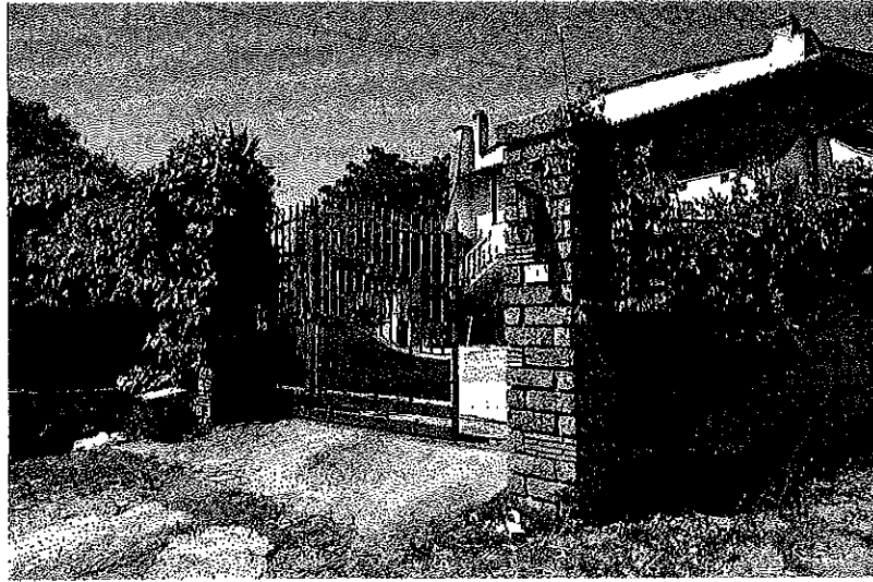
foto n.4- Esposizione Est- Muro di confine con cancello pedonale