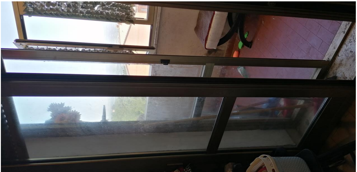
12) Particolare altro infisso