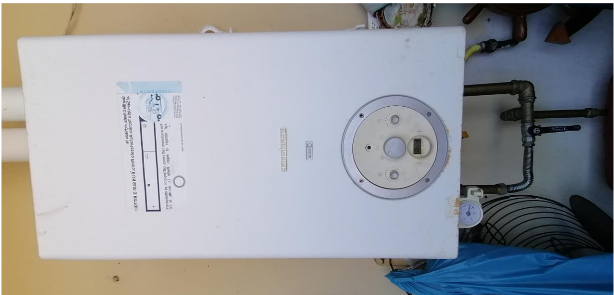
14) Caldaia murale