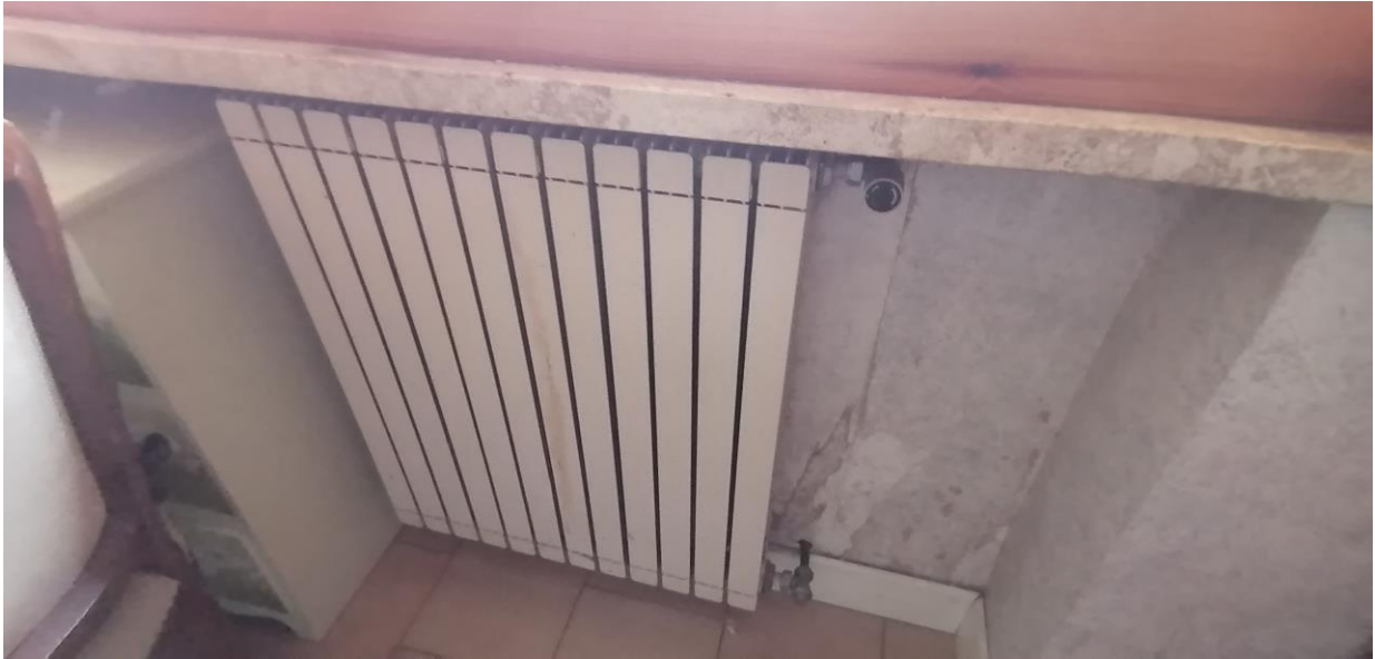
13) Elemento radiante