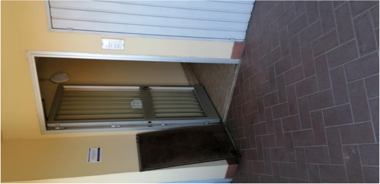
3) Ingresso scala "B"