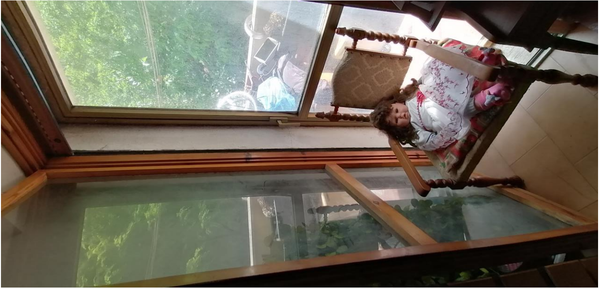
11) Particolare infisso balcone lato Est