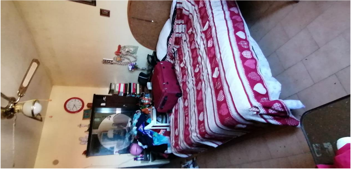
7) Vano letto