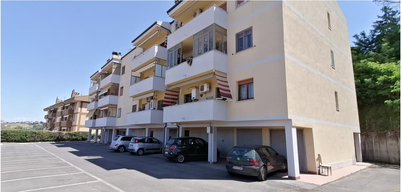
1) Vista prospetto principale del fabbricato. L'abitazione è sita a secondo piano lato destro con balcone finestrato