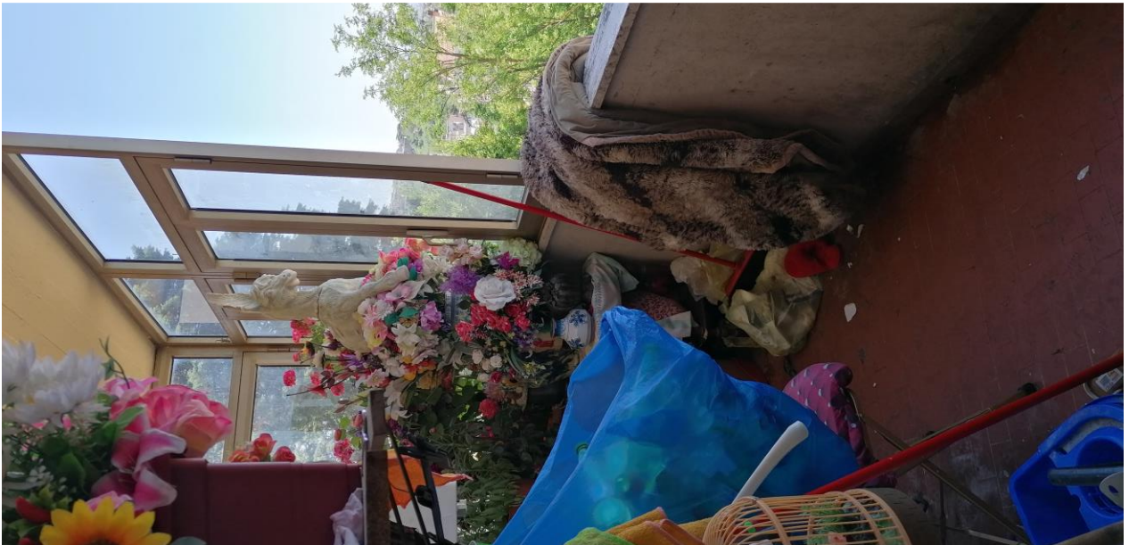
10) Balcone Ovest