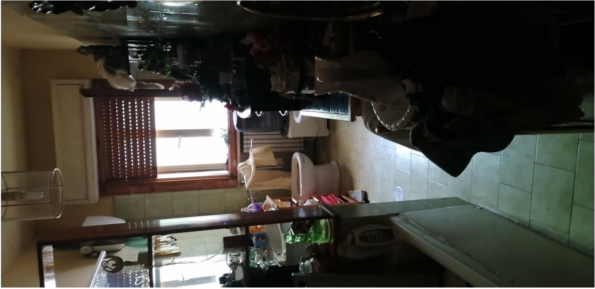
5) Corridoio con vista bagno