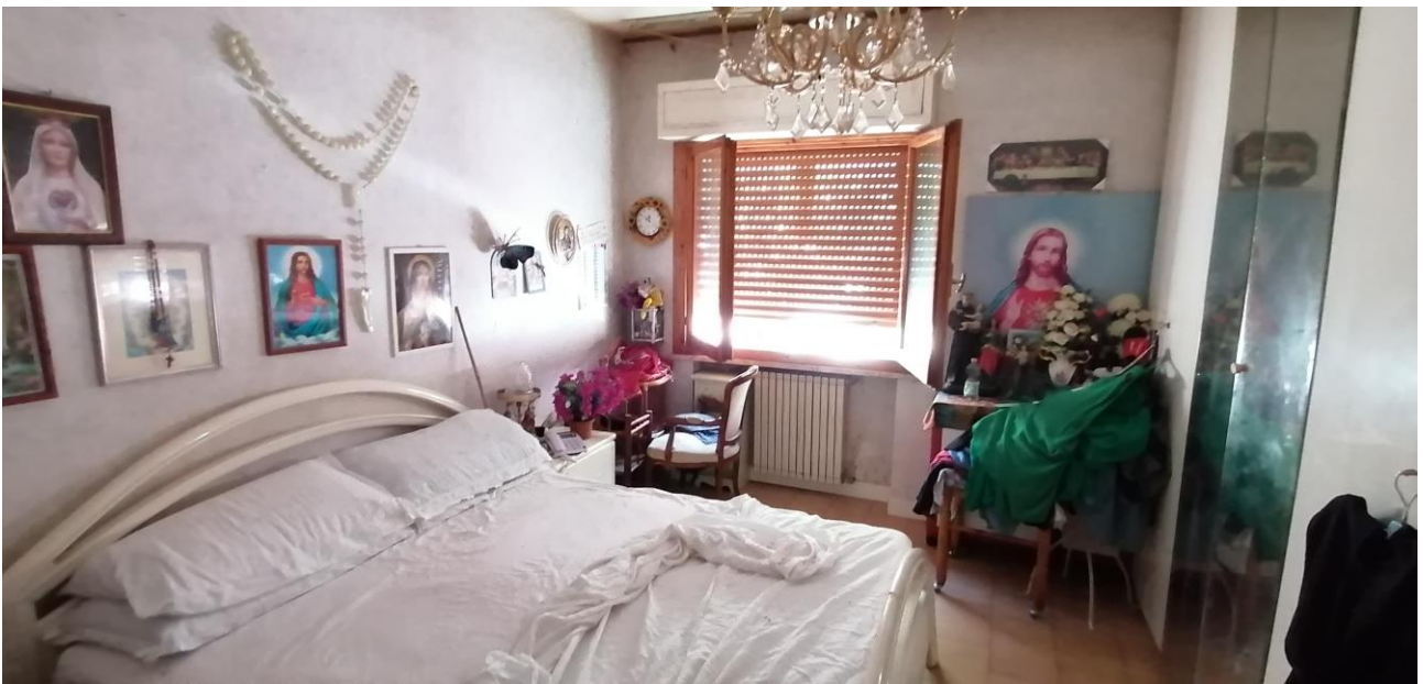
8) Vano letto