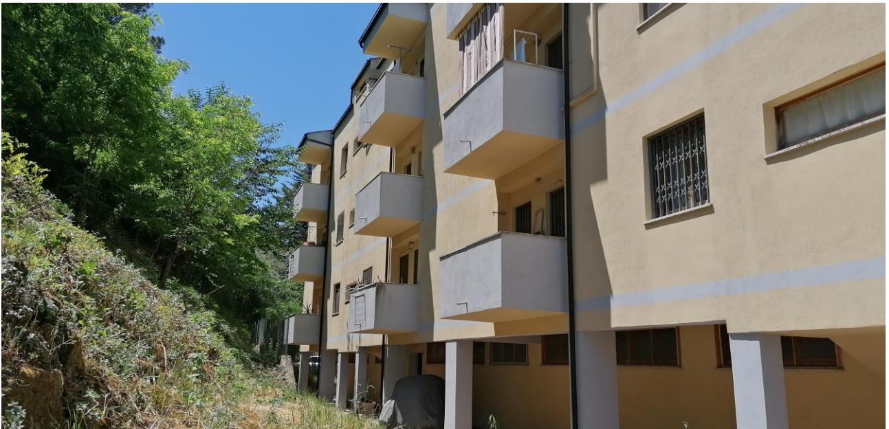
2) Prospetto posteriore del fabbricato