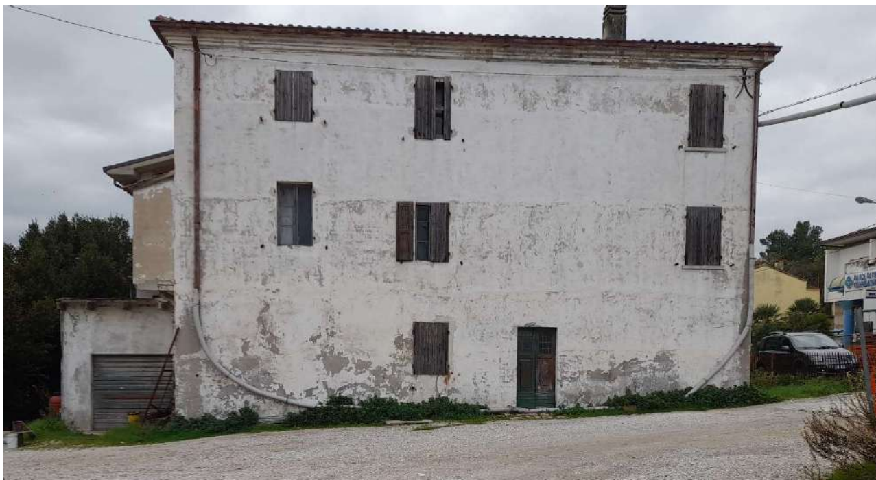
FOTO N°7 - Vista bene confinante particella 405 e particella 16 del Foglio 84 del Catasto Comune di Fano, ricadenti nel comparto edilizio.