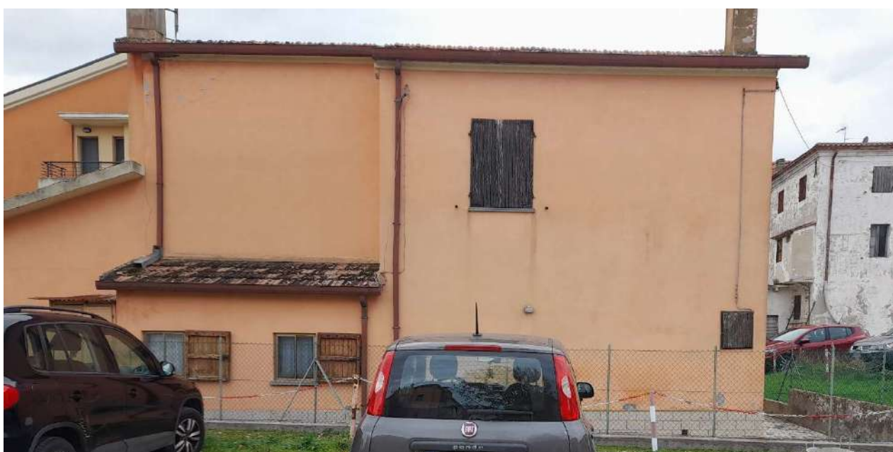
FOTO N°8 - Vista bene confinante particella 34 del Catasto Comune di Fano, ricadente nel comparto edilizio.