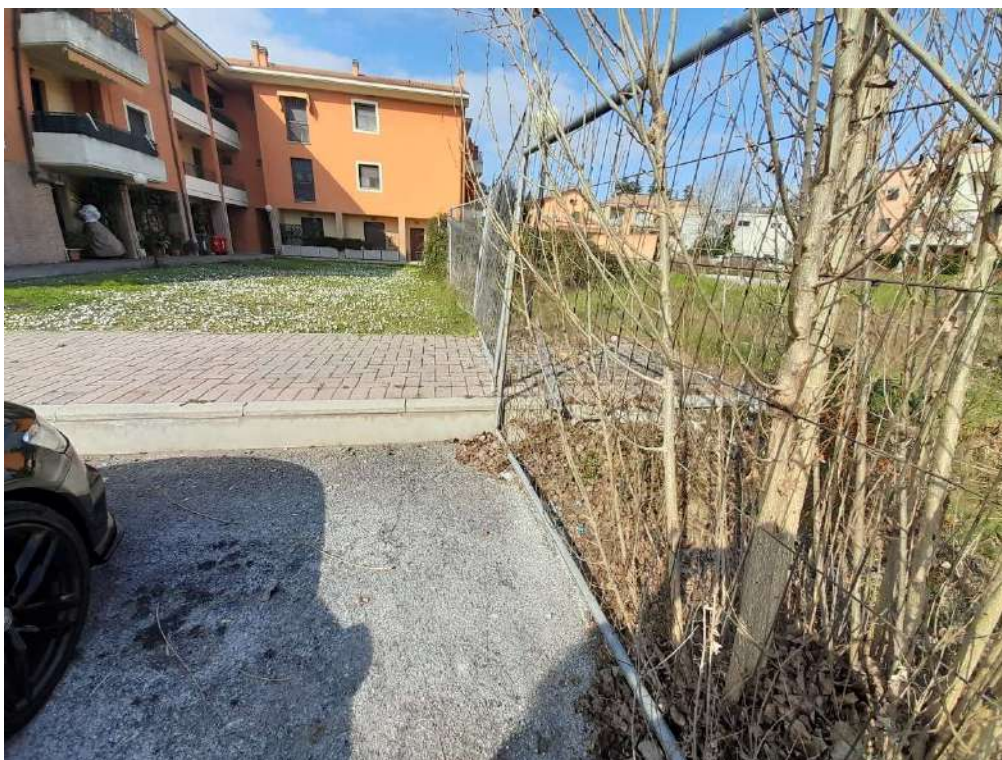
FOTO N°3 - Vista in direzione N/O dal confine posto sulla particella 400