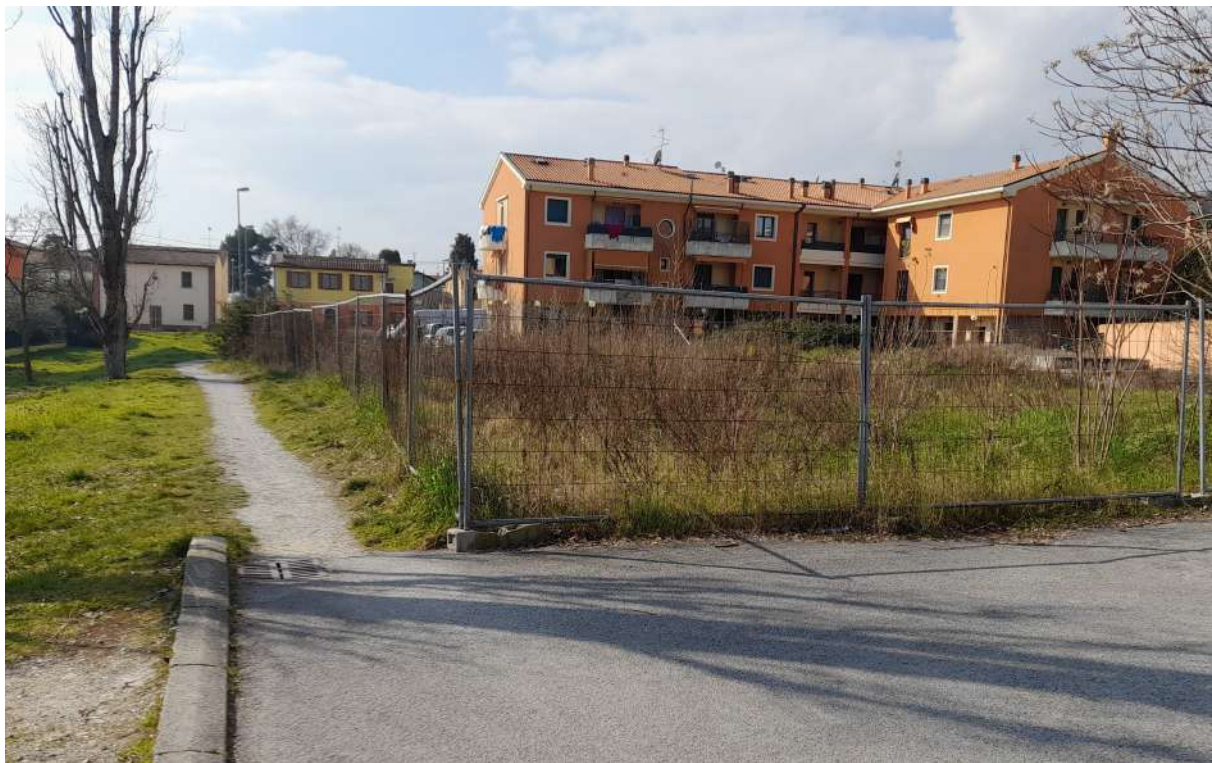
FOTO N°6 - Vista del confine in direzione Nord-Ovest in corrispondenza della particella 386.