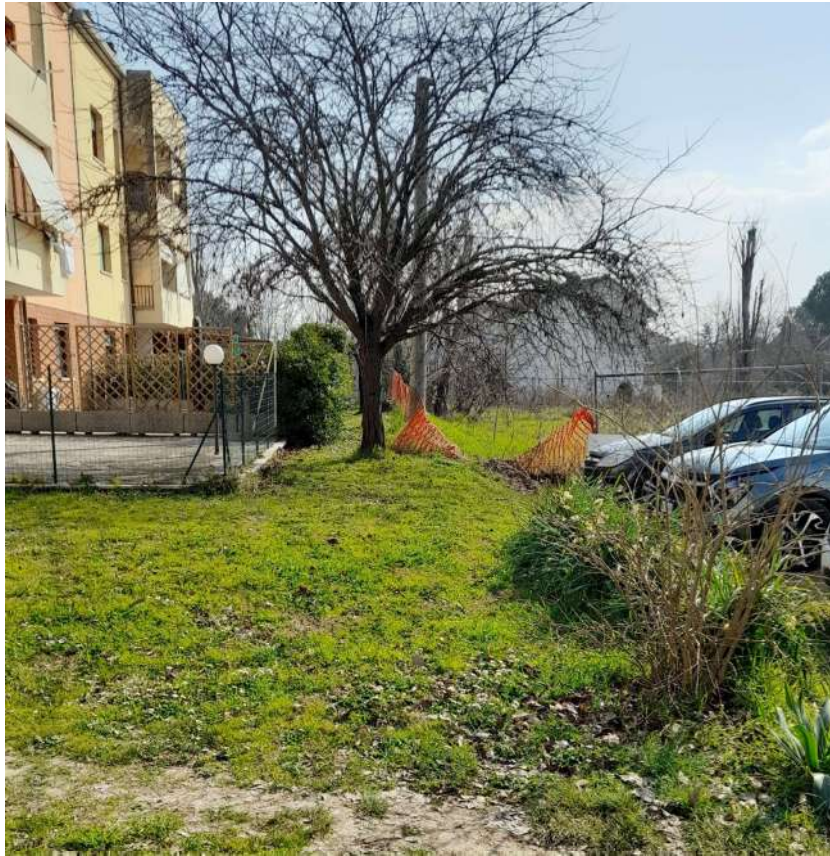
FOTO N°5 - Vista del confine del comparto con le particelle 360 e 383 in direzione Sud-Est