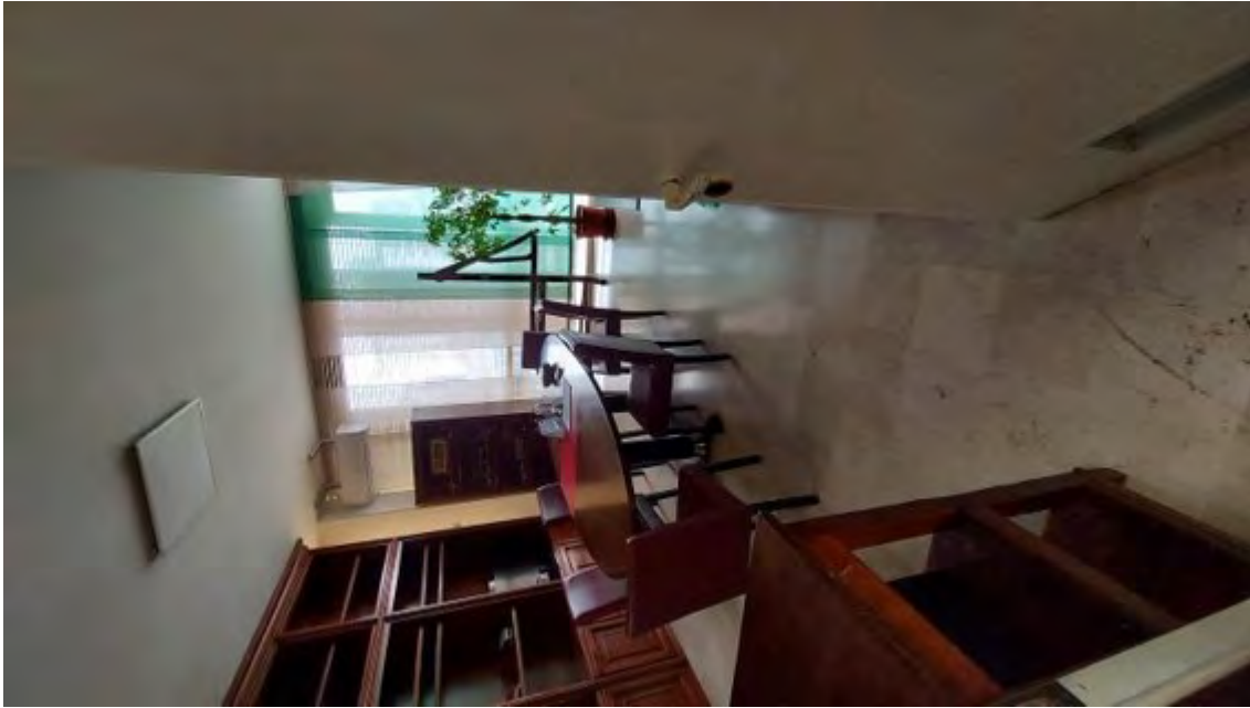
Fotografia C.9 - INTERNI