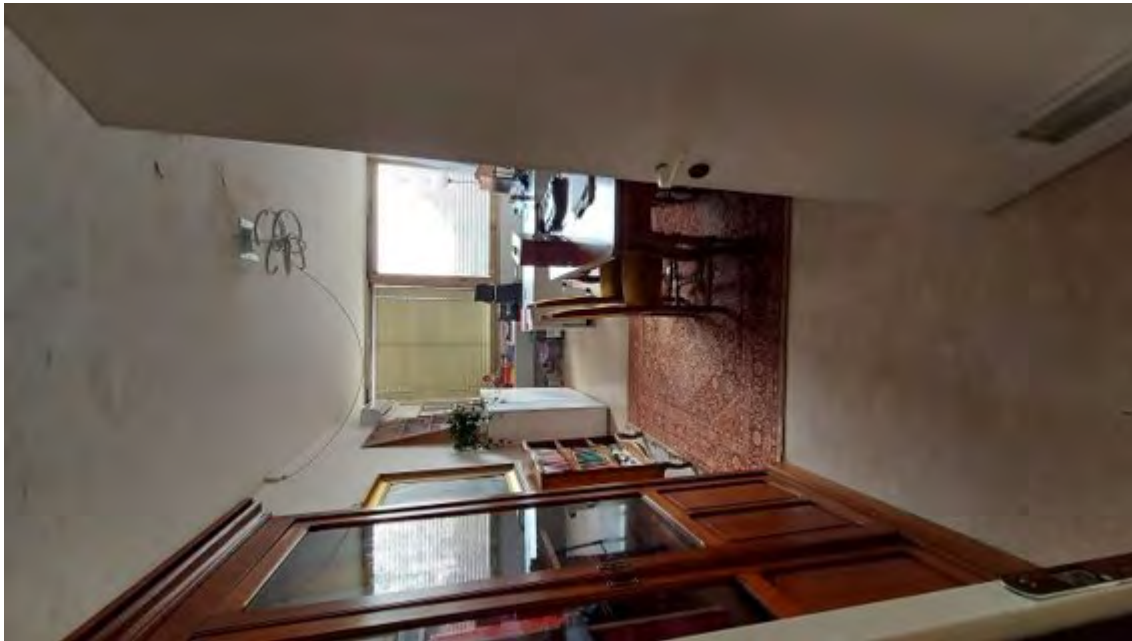
Fotografia C.17 - INTERNI