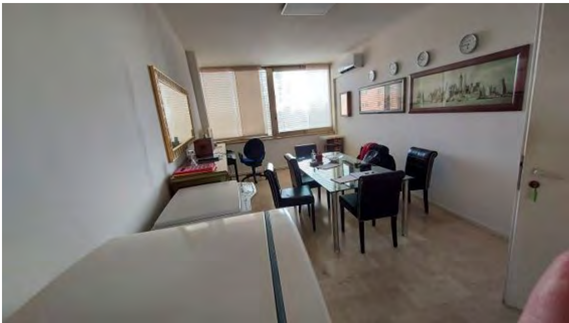
Fotografia C.18 - INTERNI