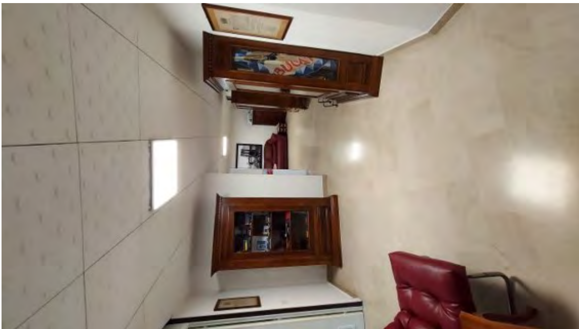
Fotografia C.14 - INTERNI