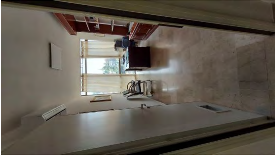
Fotografia C.7 - INTERNI