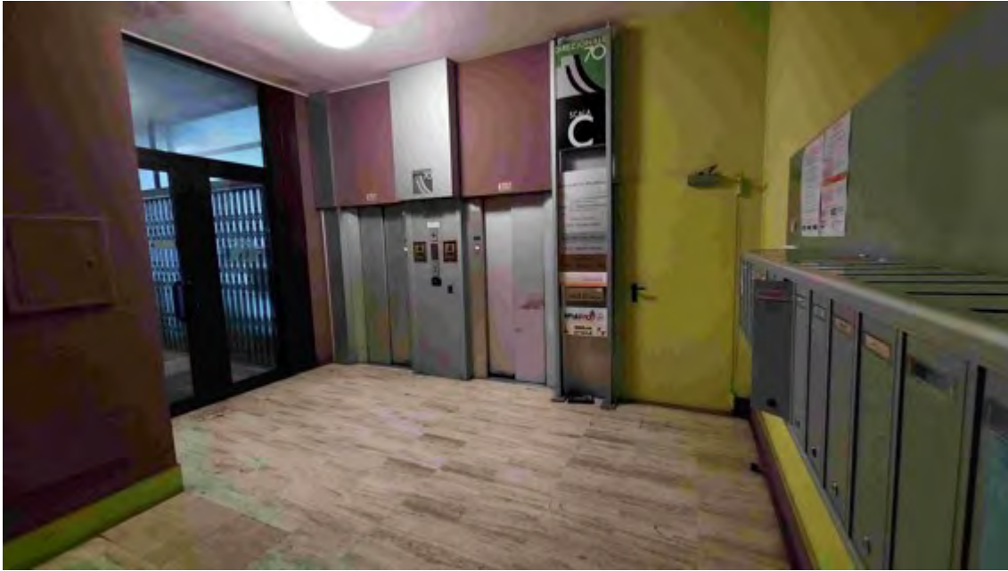
Fotografia C.3 - INGRESSO CONDOMINIALE VANO ASCENSORI PIANO TERRA