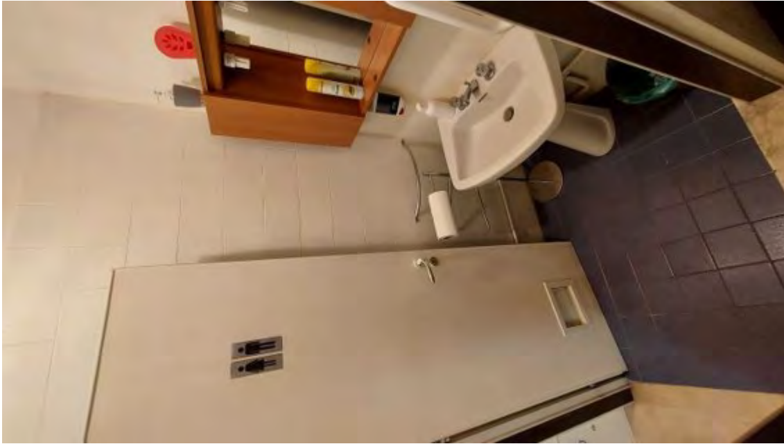
Fotografia C.23 - SERVIZI IGIENICI