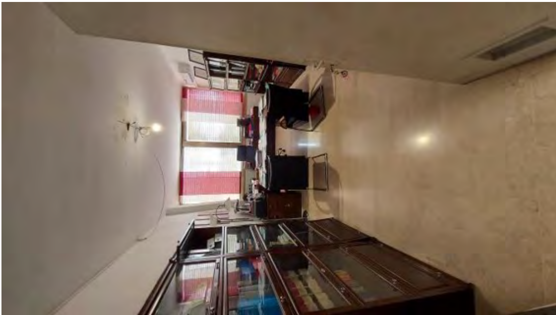
Fotografia C.16 - INTERNI