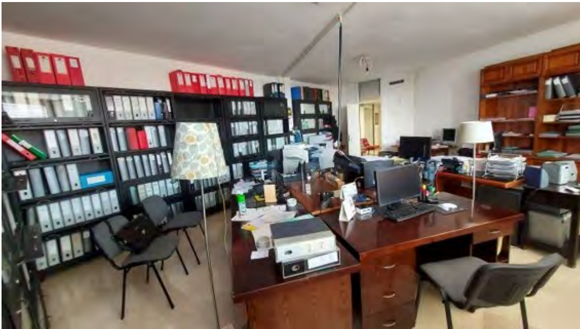
Fotografia C.20 - INTERNI