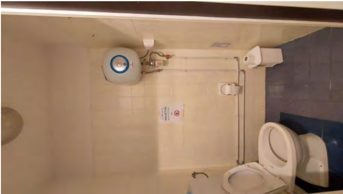
Fotografia C.22 - SERVIZI IGIENICI