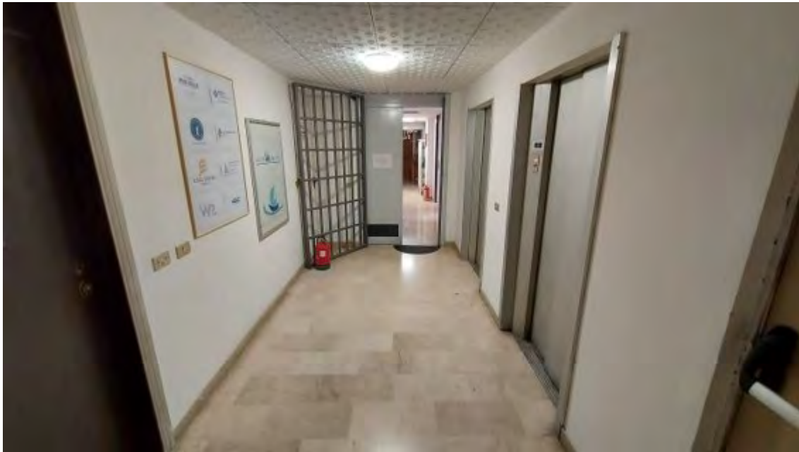
Fotografia C.5 - INGRESSO DA CORRIDOIO CONDOMINALE VANO ASCENSORI PIANO TERZO