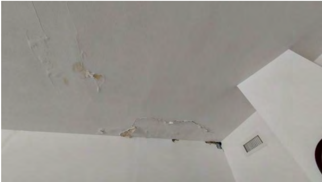
Fotografia C.27 - INFILTRAZIONI