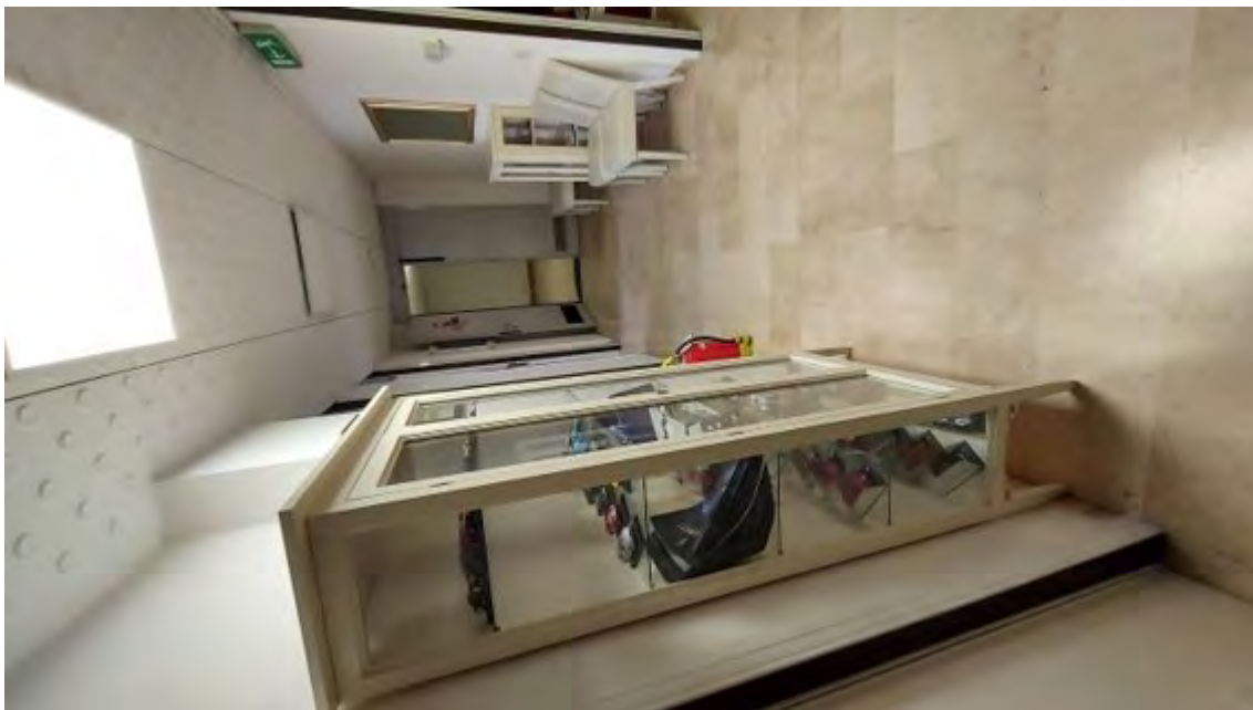
Fotografia C.6 - INTERNI