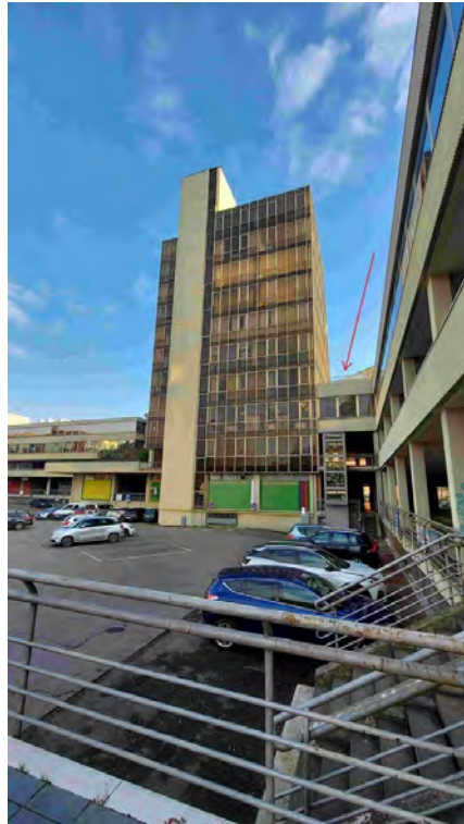
Fotografia C.1 - VISTA ESTERNA DA PARCHEGGIO LATO OVEST (VIA FLAIANI)