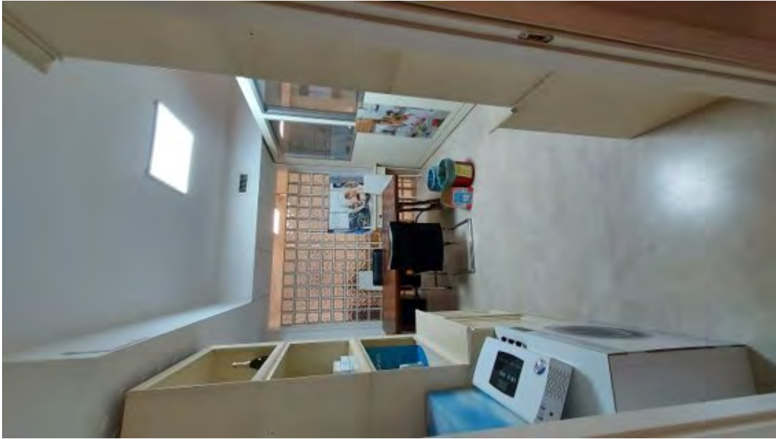
Fotografia C.13 - INTERNI