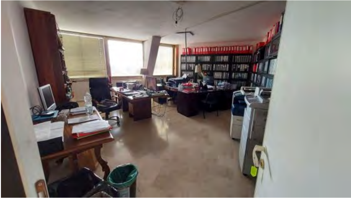
Fotografia C.19 - INTERNI