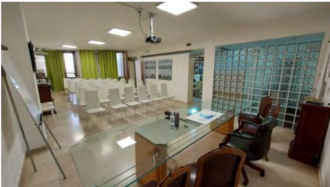
Fotografia C.12 - INTERNI