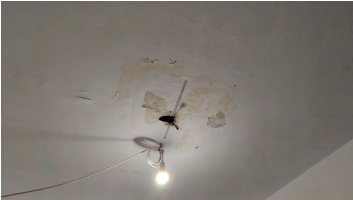
Fotografia C.24 - INFILTRAZIONI