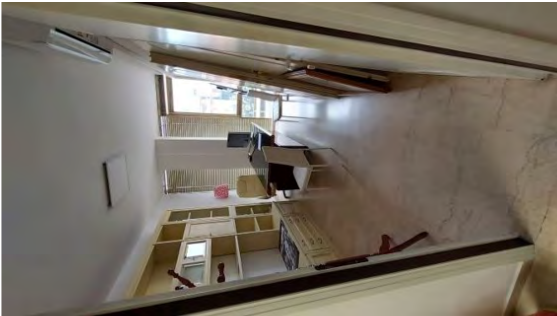
Fotografia C.8 - INTERNI