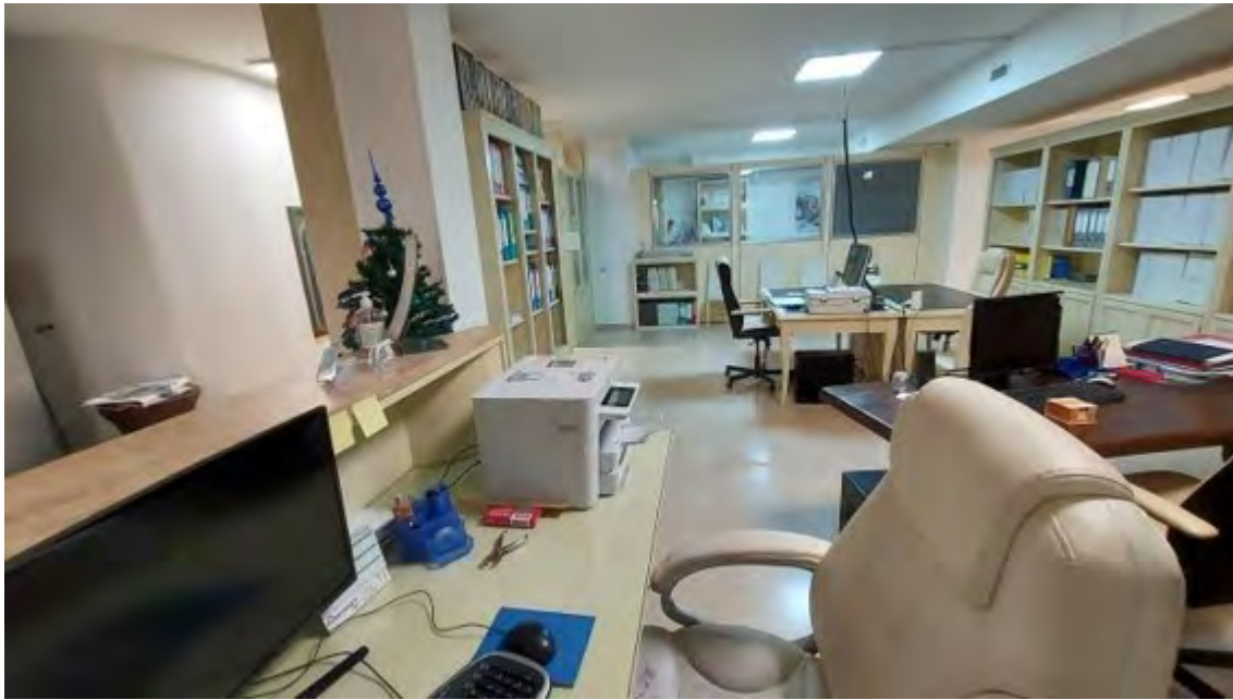
Fotografia C.11 - INTERNI