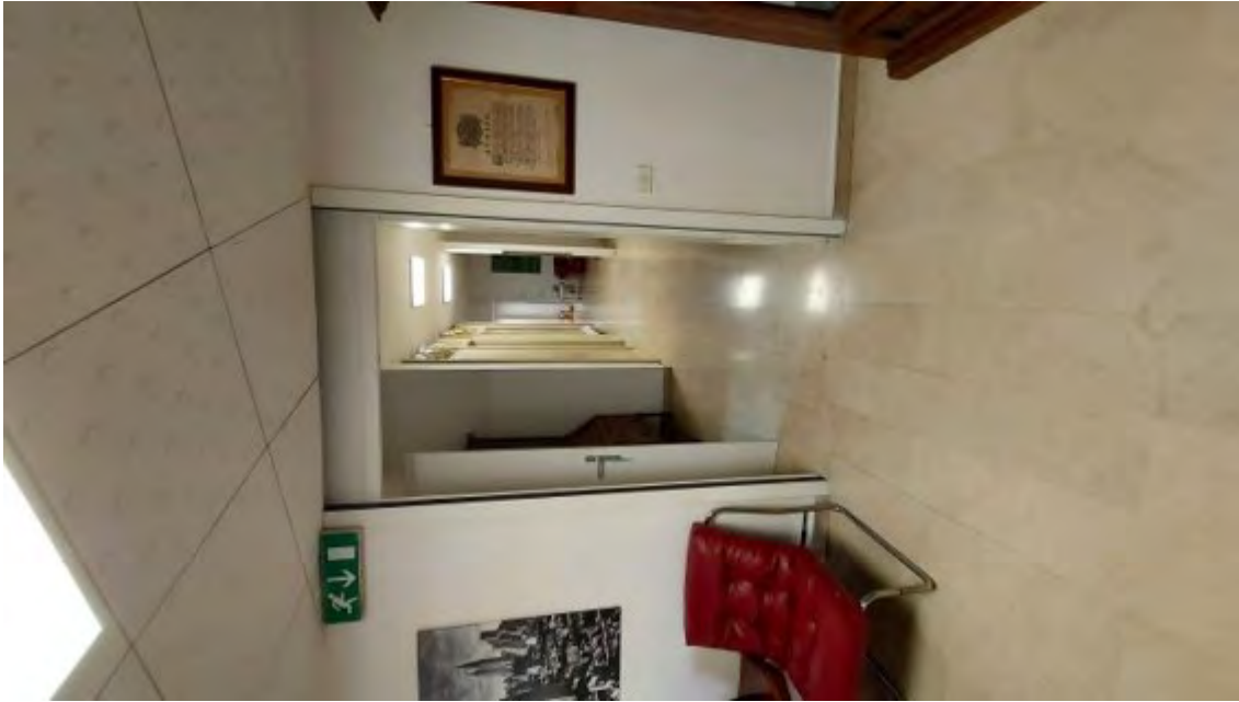
Fotografia C.15 - INTERNI