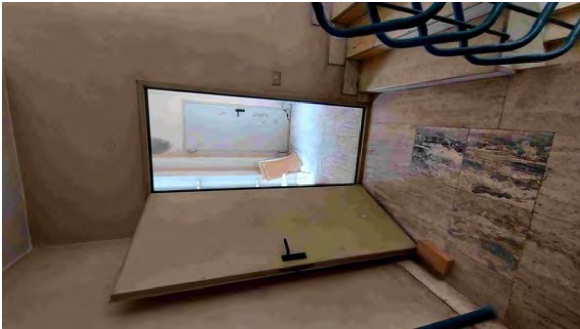
Fotografia C.4 - SCALA CONDOMINIALE