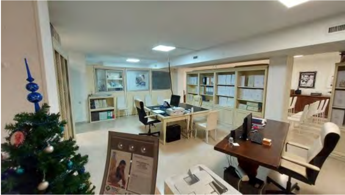
Fotografia C.21 - INTERNI