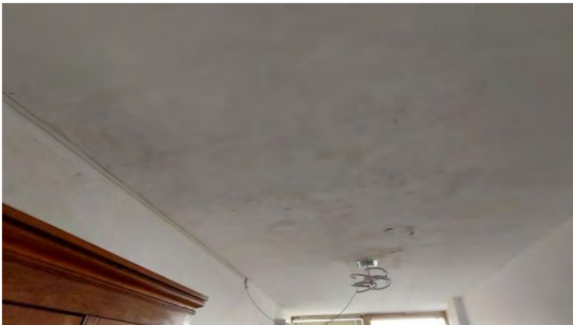
Fotografia C.26 - INFILTRAZIONI