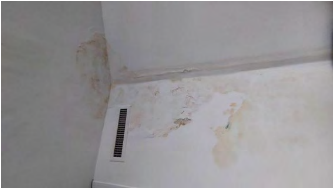
Fotografia C.25 - INFILTRAZIONI