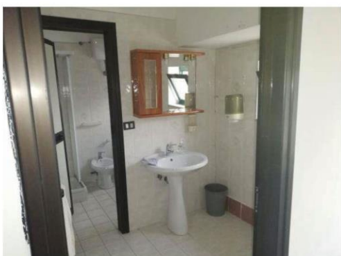
foto 37: ...Sala guardiania al 27.10.2022