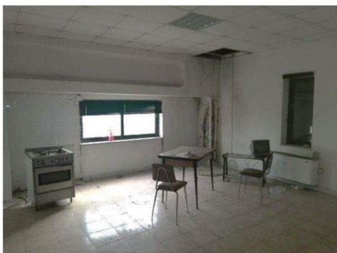
foto 35: ...Sala guardiania al 27.10.2022