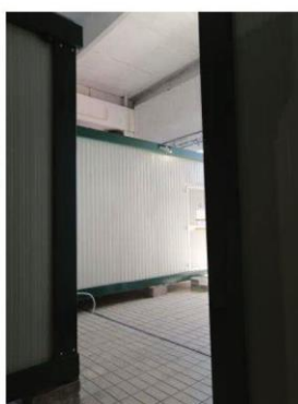
foto da 55 a 58: (ex sala lavorazione ora adibita ad attività di logistica) ....