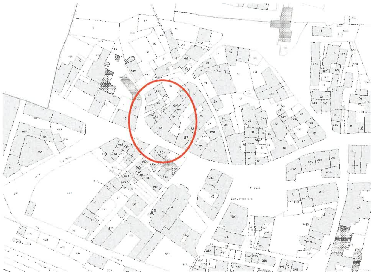
Fig. 3 particella 63 sub.7

Localizzazione fabbricato urbano comprendente le U.I.U. oggetto di stima