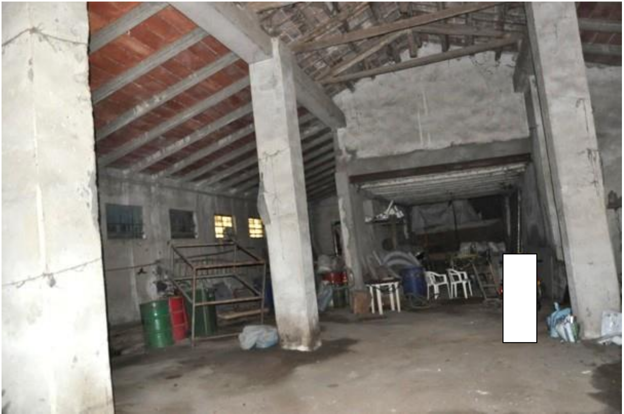
11. Porzione della struttura principale.