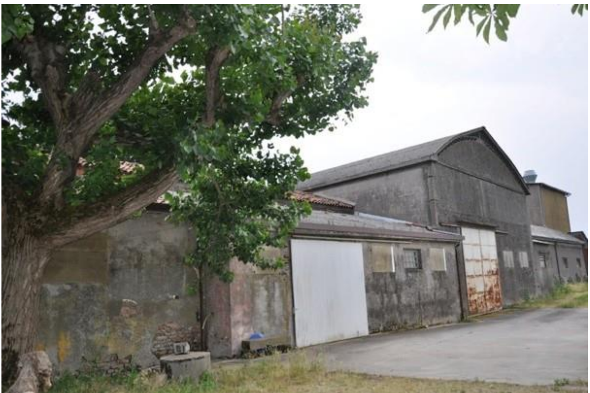
12. Retro della struttura principale.