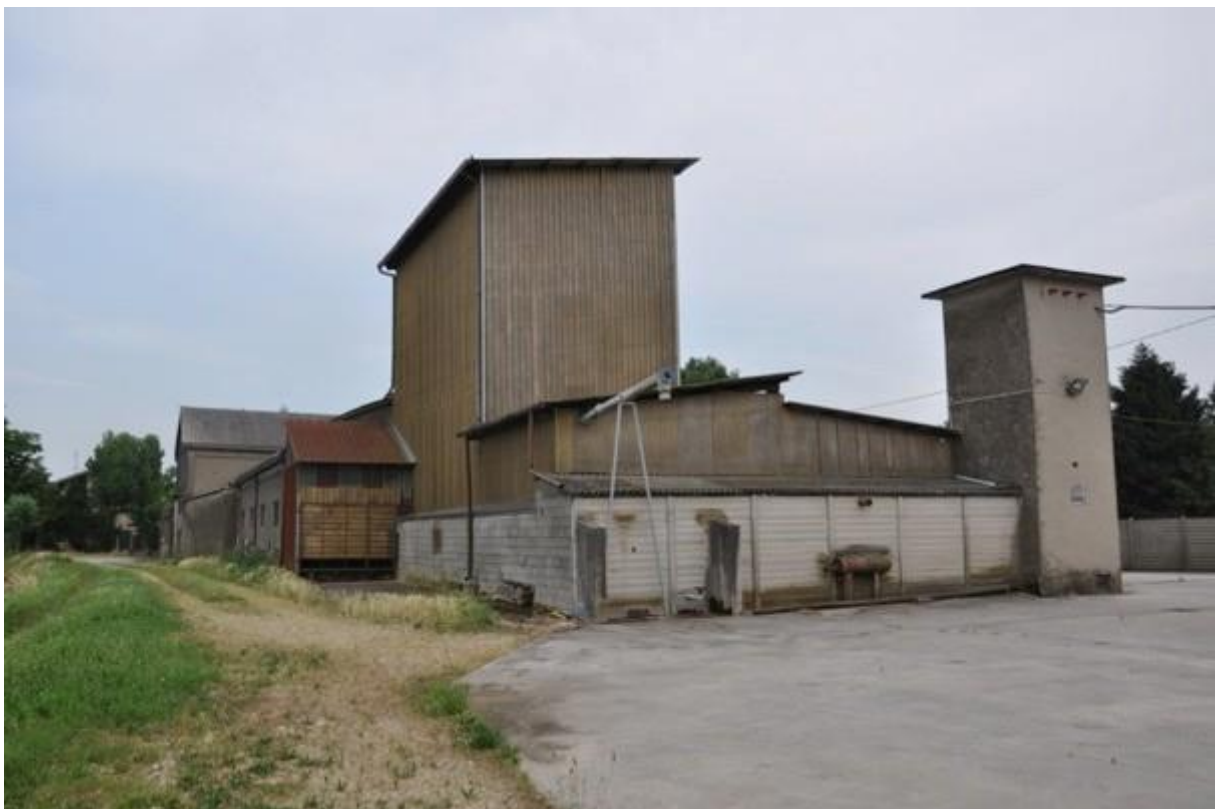
4. Prospetti ovest e nord della struttura principale.