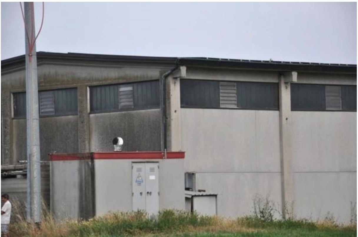
14. Particolare della cabina elettrica al servizio del pannello fotovoltaico installato sulla copertura (part. 306).