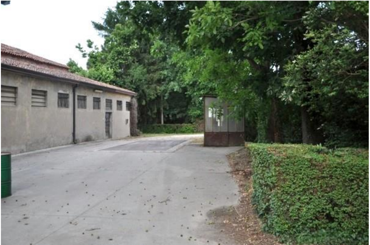
7. Piazzale antistante la struttura principale con pesa.