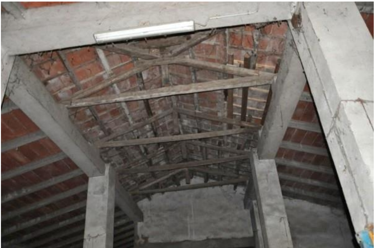
10. Porzione della struttura principale.