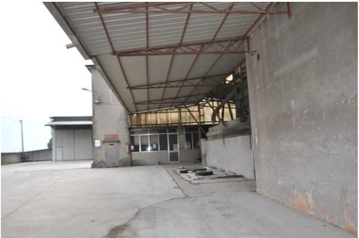
8. Struttura principale --- essiccatoio.