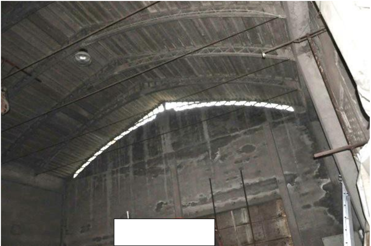
9. Porzione della struttura principale.