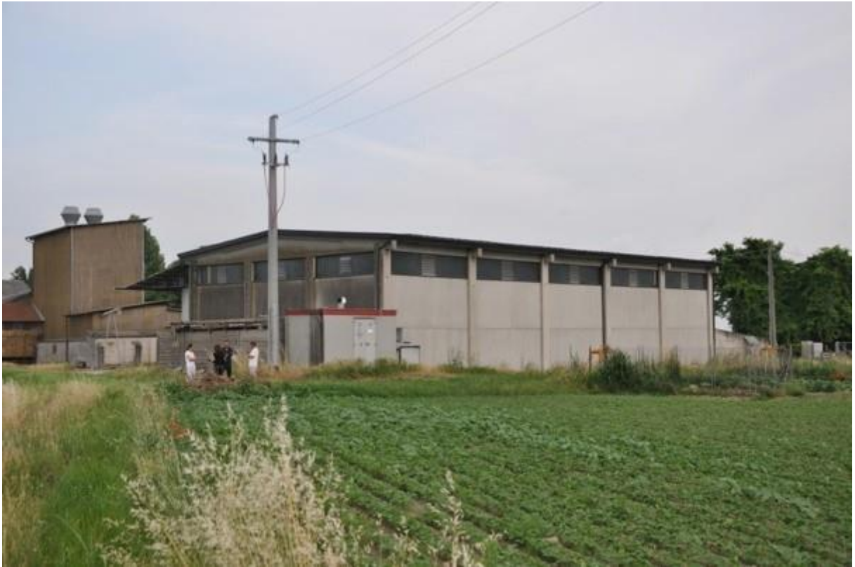
13. Ripresa del capannone nuovo dai terreni inclusi nel lotto.