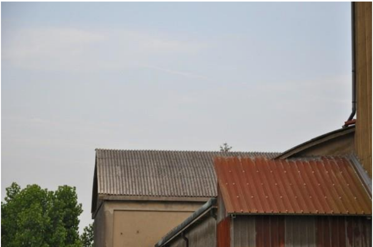
6. Particolare della copertura.