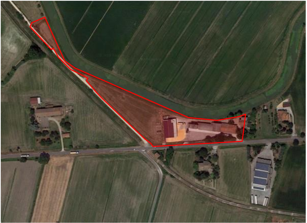
1. Individuazione approssimativa del lotto.