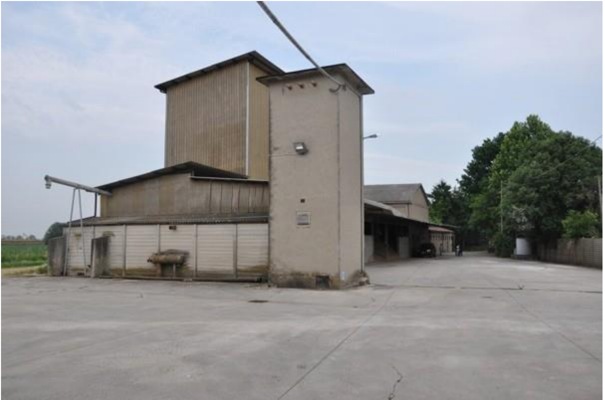
5. Prospetti ovest e sud della struttura principale.