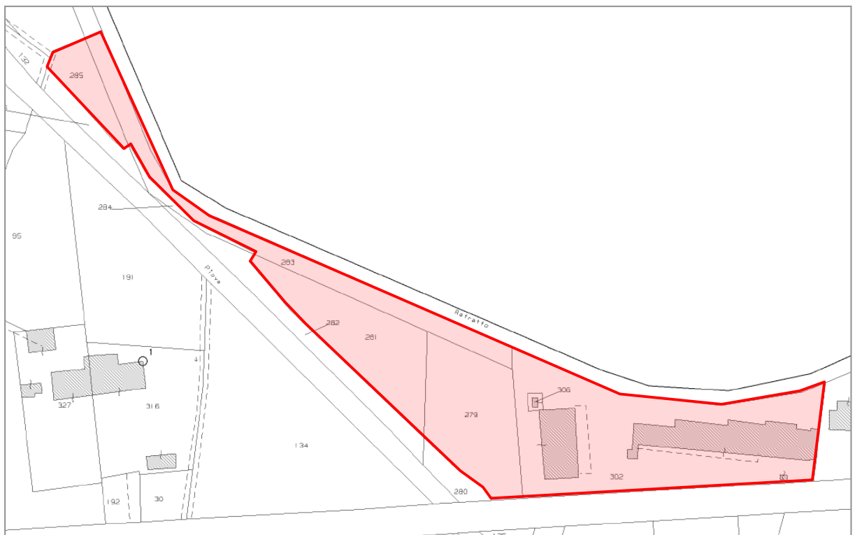
2. Estratto di mappa (non in scala).