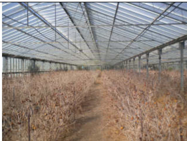
INTERNO SERRA IN FERRO-VETRO