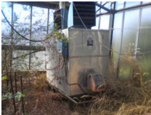
AEROTERMO 2 A GASOLIO