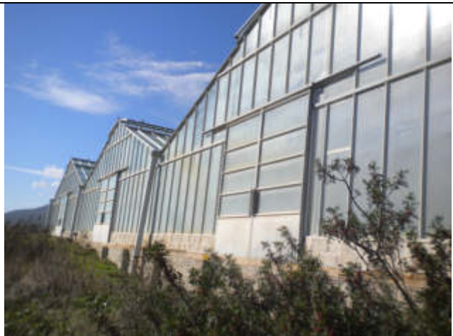
PROSPETTO SUD-EST SERRA