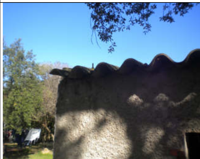
LOCALE TECNICO CON COPERTURA IN AMIANTO