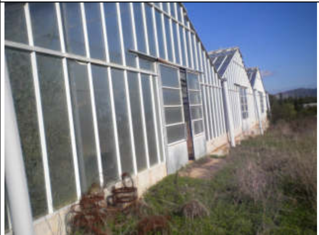
PROSPETTO SUD-EST SERRA