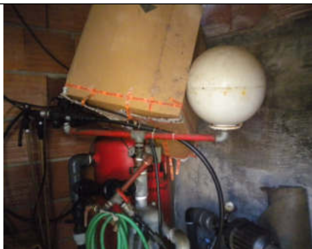
INTERNO LOCALE TECNICO