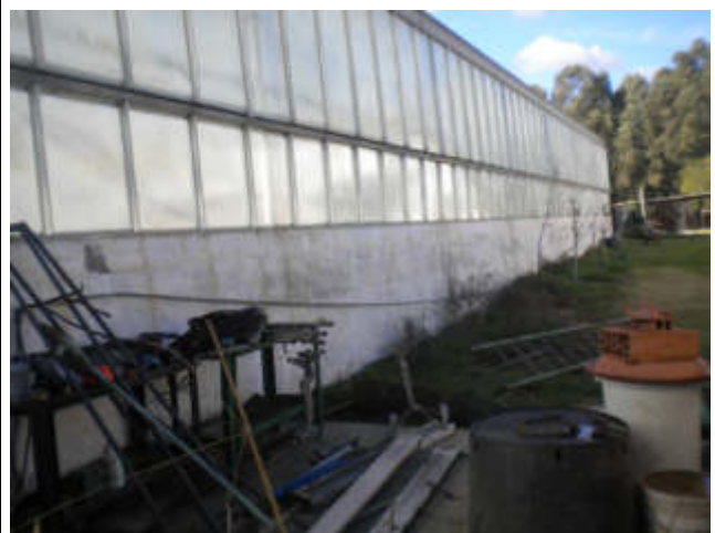
PROSPETTO NORD-OVEST SERRA