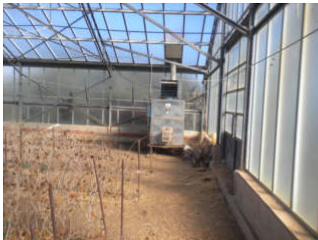
AEROTERMO 1 A GASOLIO