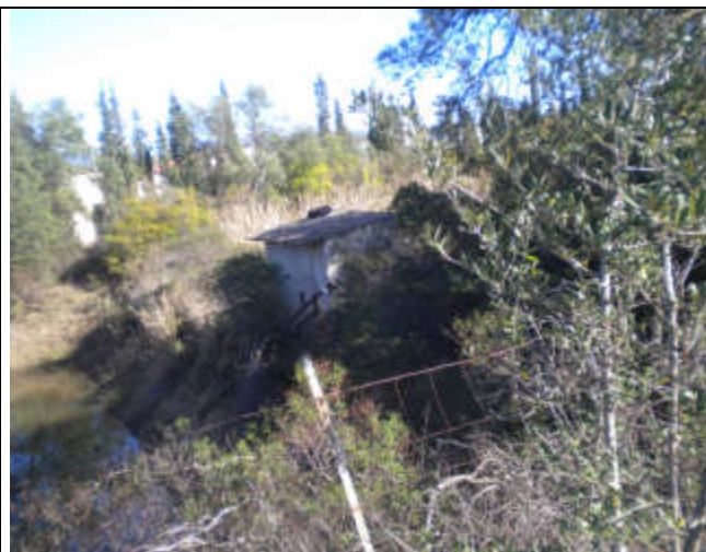
RUDERE CON COPERTURA IN AMIANTO