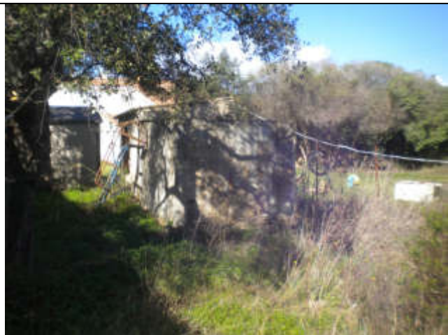
LOCALE TECNICO CON COPERTURA IN AMIANTO