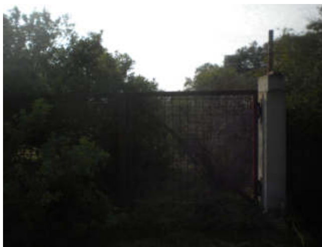
CANCELLO INGRESSO TERRENI