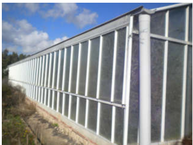
PROSPETTO SUD-OVEST SERRA