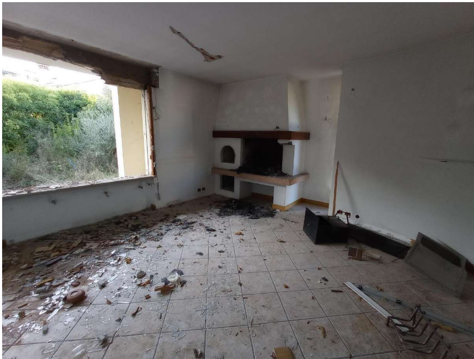
Foto 6 – Particolare dell'interno del fabbricato in fase di demolizione