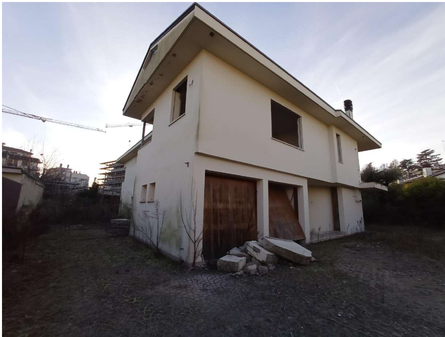
Foto 3 – Vista del fabbricato in fase di ristrutturazione – facciata principale lato est