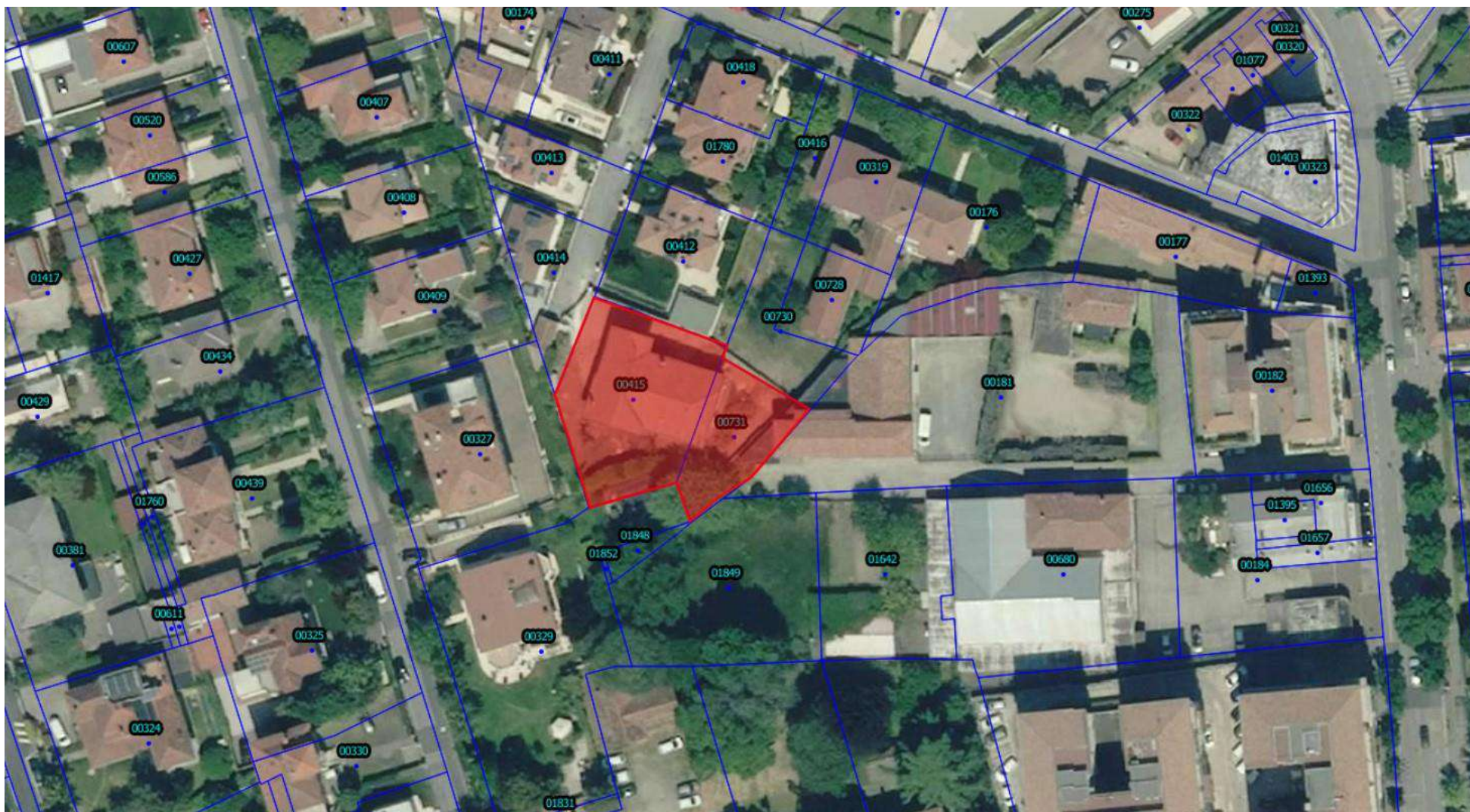
Foto 1 – Foto aerea del fabbricato nel quel insiste l'immobile oggetto di stima