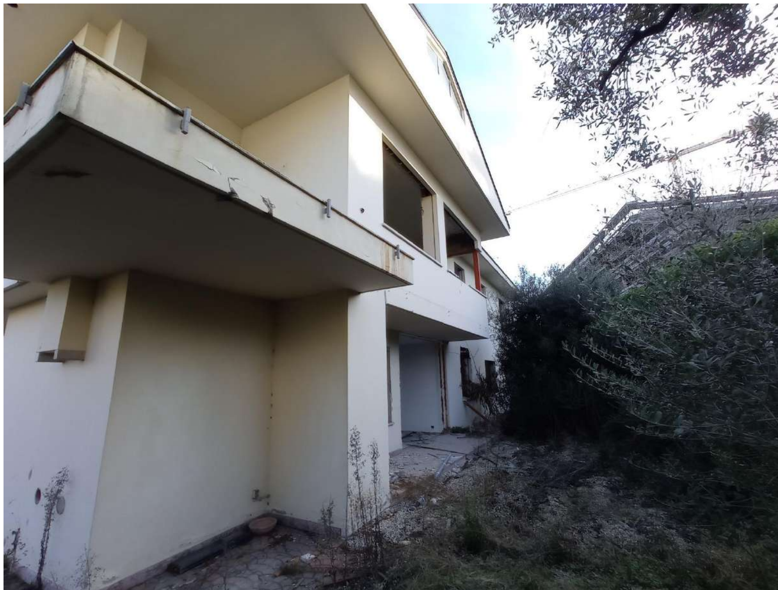
Foto 5 – Vista del fabbricato in fase di ristrutturazione – lato ovest