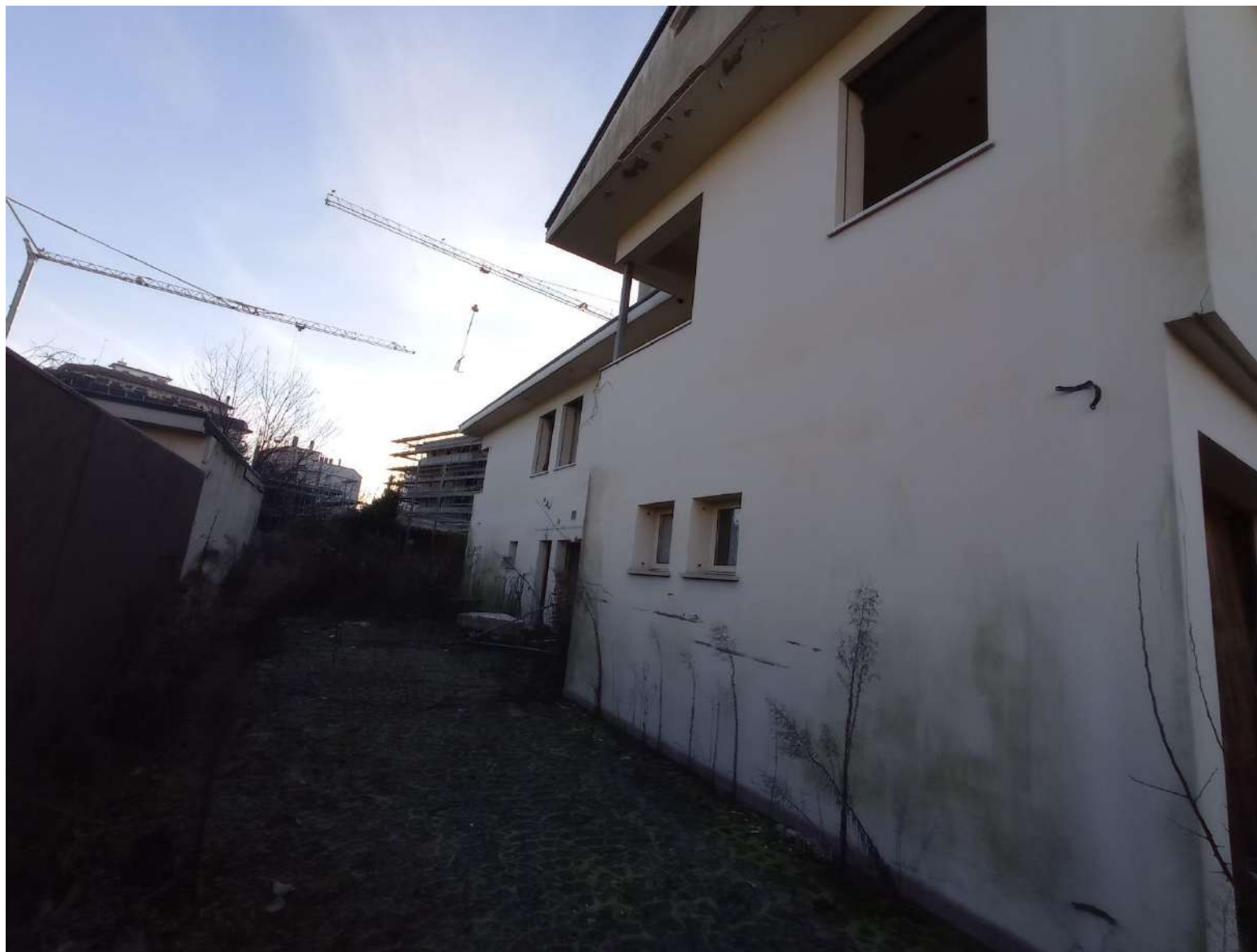
Foto 4 – Vista del fabbricato in fase di ristrutturazione – lato sud