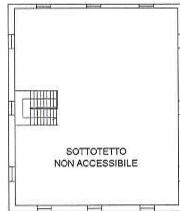
PIANO SECONDO (SOTTOTETTO)