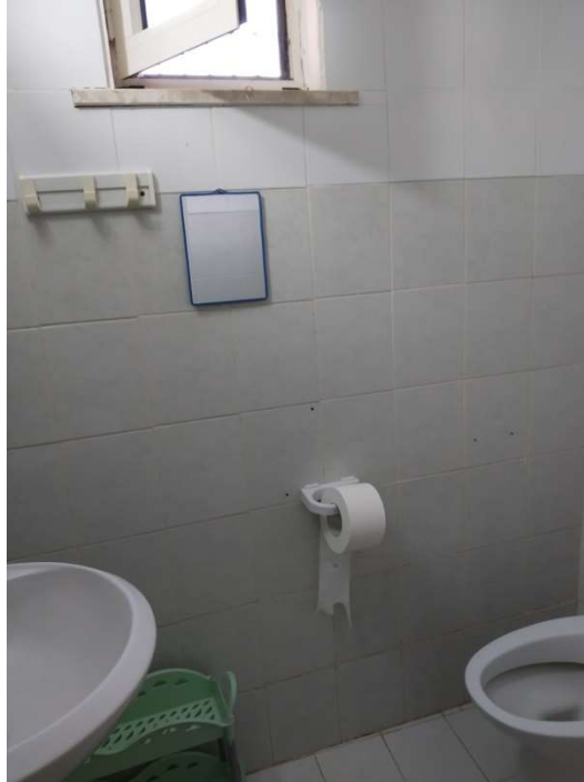
Foto 11 Particolare dell'ufficio