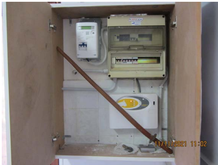
FOTO N° 77: VISTA PARTICOLAREGGIATA DEL MISURATORE ELETTRICO E DEL QUADRO DEGLI INTERRUPTORI DIFFERENZIALE.

L'ESPERTO STIMATORE: (ing. Michele FRADUSCO)