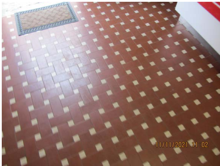
FOTO N° 75: VISTA TIPOLOGIA DELLA PAVIMENTAZIONE RILEVATA AL SUO INTERNO.

L'ESPERTO STIMATORE: (ing. Michele FRADUSCO)