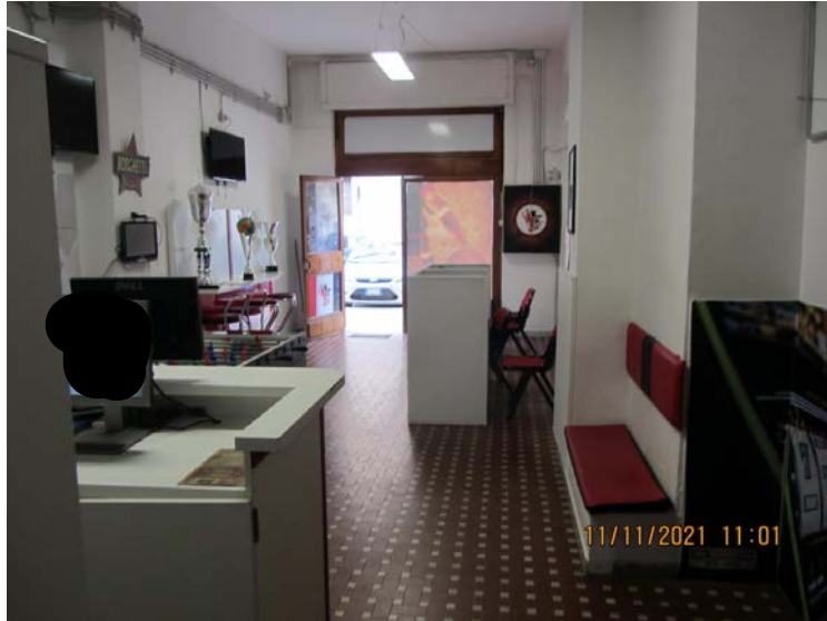
FOTO N° 74: VISTA FRONTALE PROSPETTICA DELL'INTERNO DEL LOCALE COMMERCIALE A PIANOTERRA DA PARTE OPPOSTA ALLA PRECEDENTE FOTO.