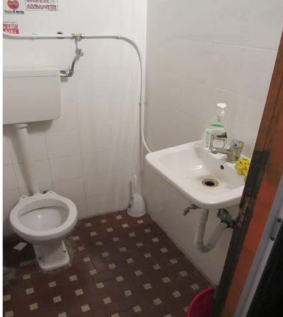
FOTO N° 80: ALTRA VISTA GENERALE DEL W.C. RILEVATO AL SUO INTERNO DI CUI ALLA PRECEDENTE FOTO.