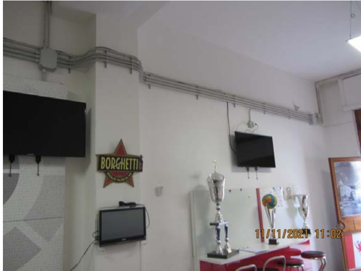
FOTO N° 78: VISTA GENERALE DELLA LINEA ELETTRICA A VISTA RILEVATA AL SUO INTERNO REALIZZATA DALL’AFFITTUARIO.