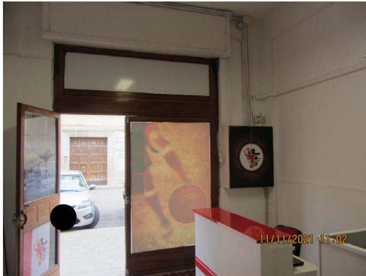
FOTO N° 76: VISTA INTERNA DELLA PORTA D'INGRESSO E DEL MISURATORE ELETTRICO DA CUI HA ORIGINE LA LINEA ELETTRICA A VISTA IN CANALINE.