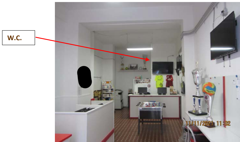
FOTO N° 73: VISTA FRONTALE PROSPETTICA DELL'INTERNO DEL LOCALE COMMERCIALE A PIANOTERRA.

L'ESPERTO STIMATORE: (ing. Michele FRADUSCO)