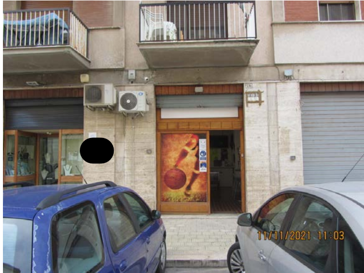
FOTO N° 72: VISTA FRONTALE DELLA PORTA D'INGRESSO NEL LOCALE COMMERCIALE A PIANTERRENO FACENTE PARTE DEL 2° LOTTO DI FABBRICA CONDOMINIALE.