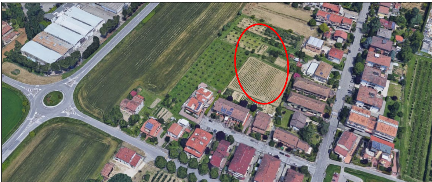
Forlì - via Bruciapecore

Comparto: Area Bruciapecore – Ex T4-10 – Tav. P29