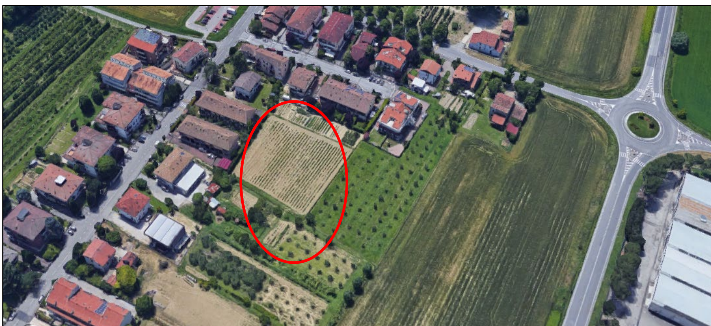
Forlì - via Bruciapecore