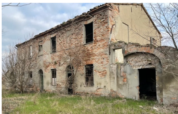
la casa - lato Nord