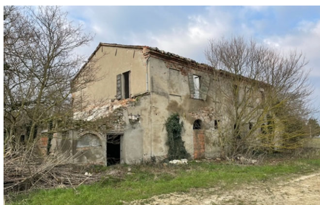
la casa - lato Sud