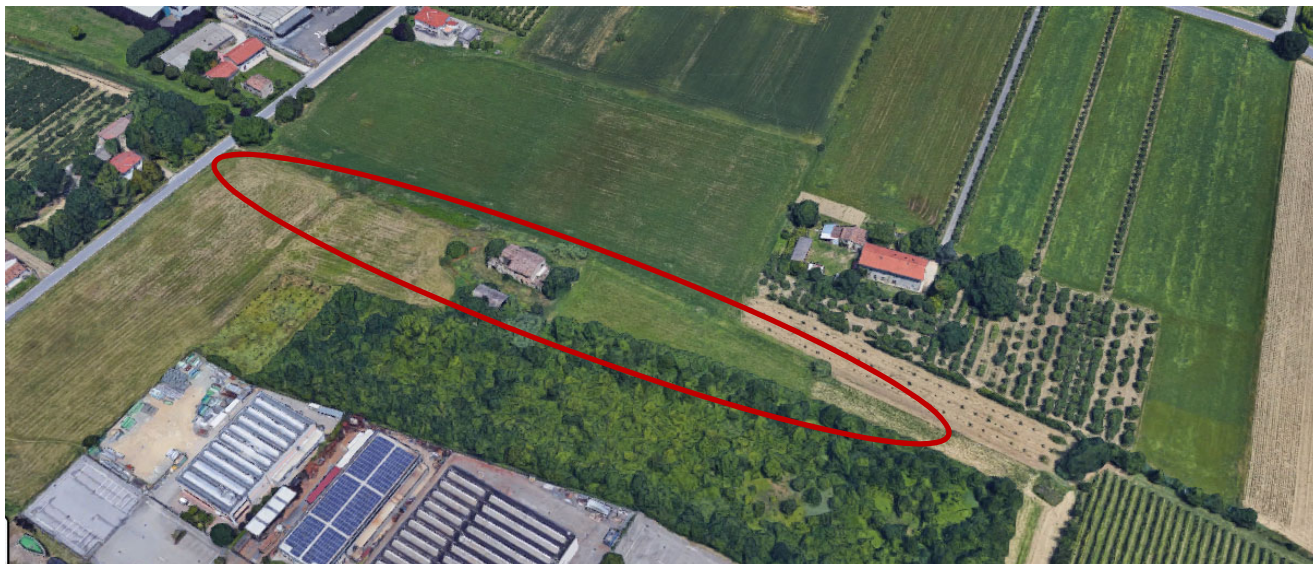
Forlì – vista satellitare “Villa Fronticelli”

Comparto: “Villa Fronticelli e Scolo Ausa” - Ampliamento Mattei 1 Ovest – Tav. P29