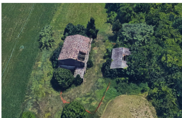
Villa Fronticelli – la casa e il fienile