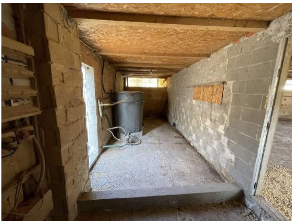
Capannone agricolo n. 4 - Vista interna (Foto 4)