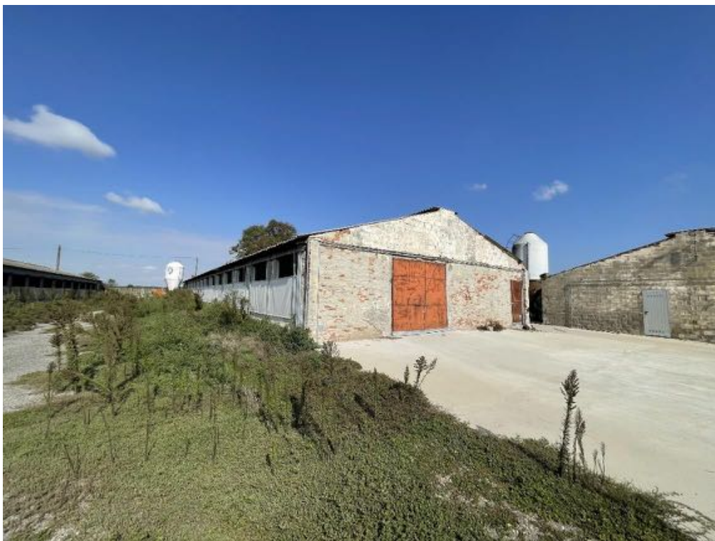
Capannone agricolo n. 1 (Foto 1)