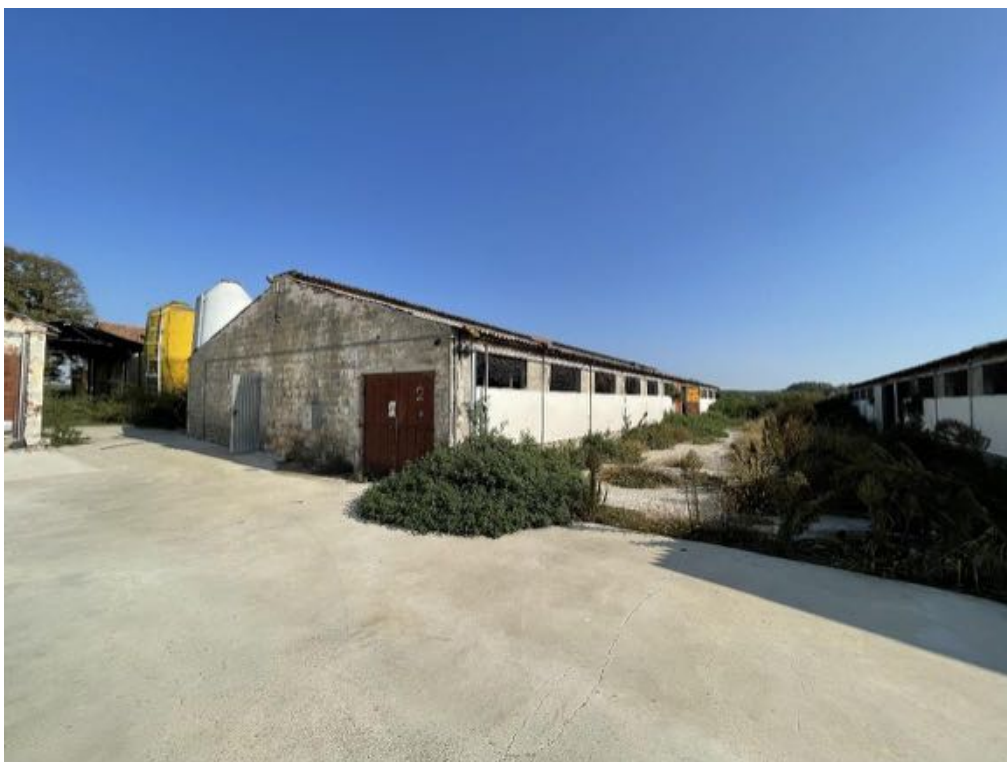
Capannone agricolo n. 2 (Foto 3)