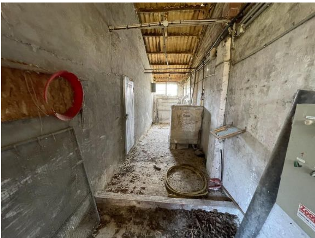
Capannone agricolo n. 1 - Vista interna (Foto 3)