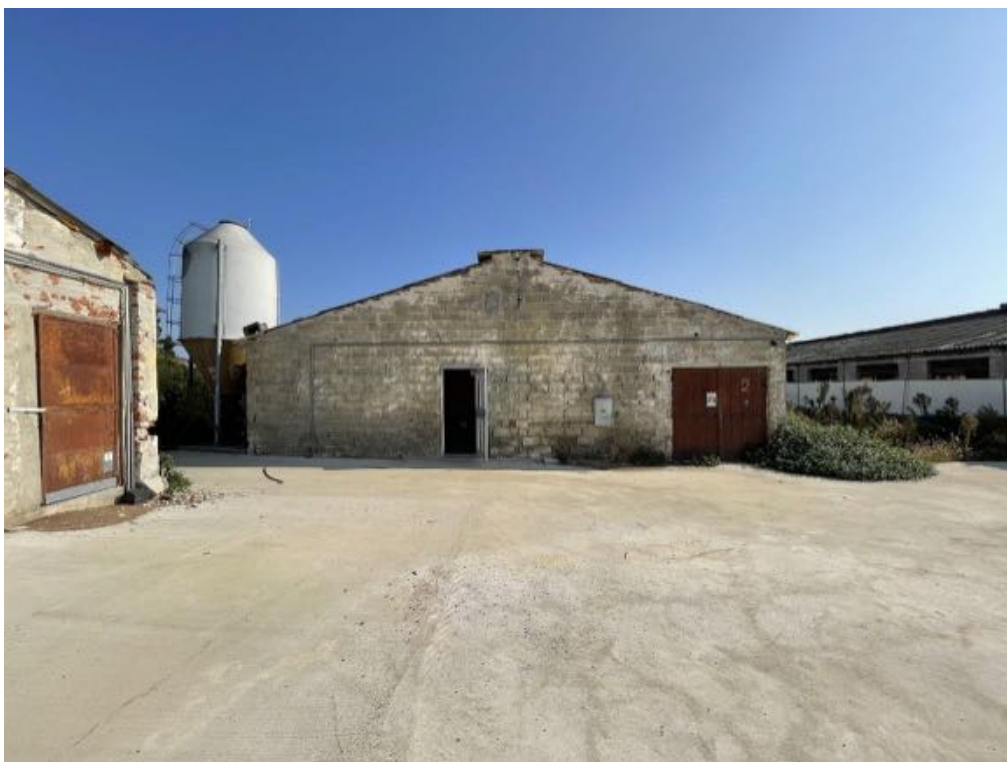
Capannone agricolo n. 2 (Foto 2)