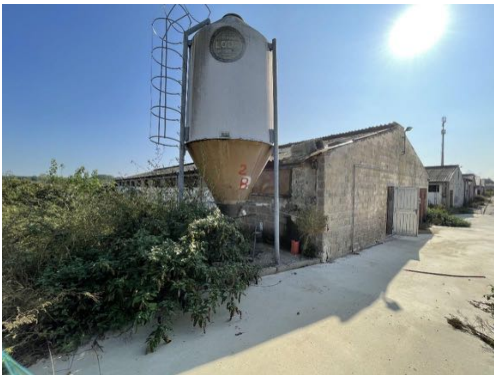
Capannone agricolo n. 2 (Foto 1)