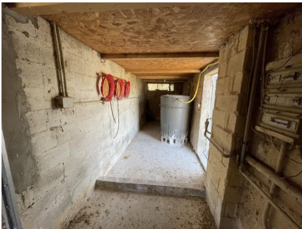
Capannone agricolo n. 3 - Vista interna (Foto 4)