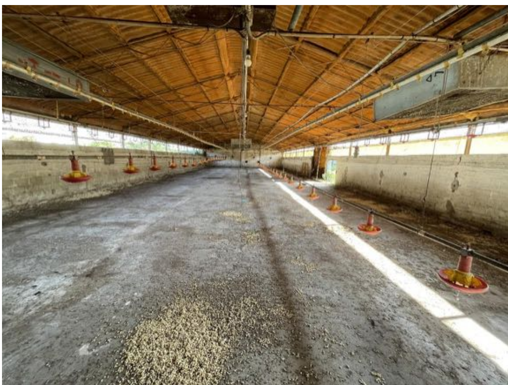
Capannone agricolo n. 4 - Vista interna (Foto 1)