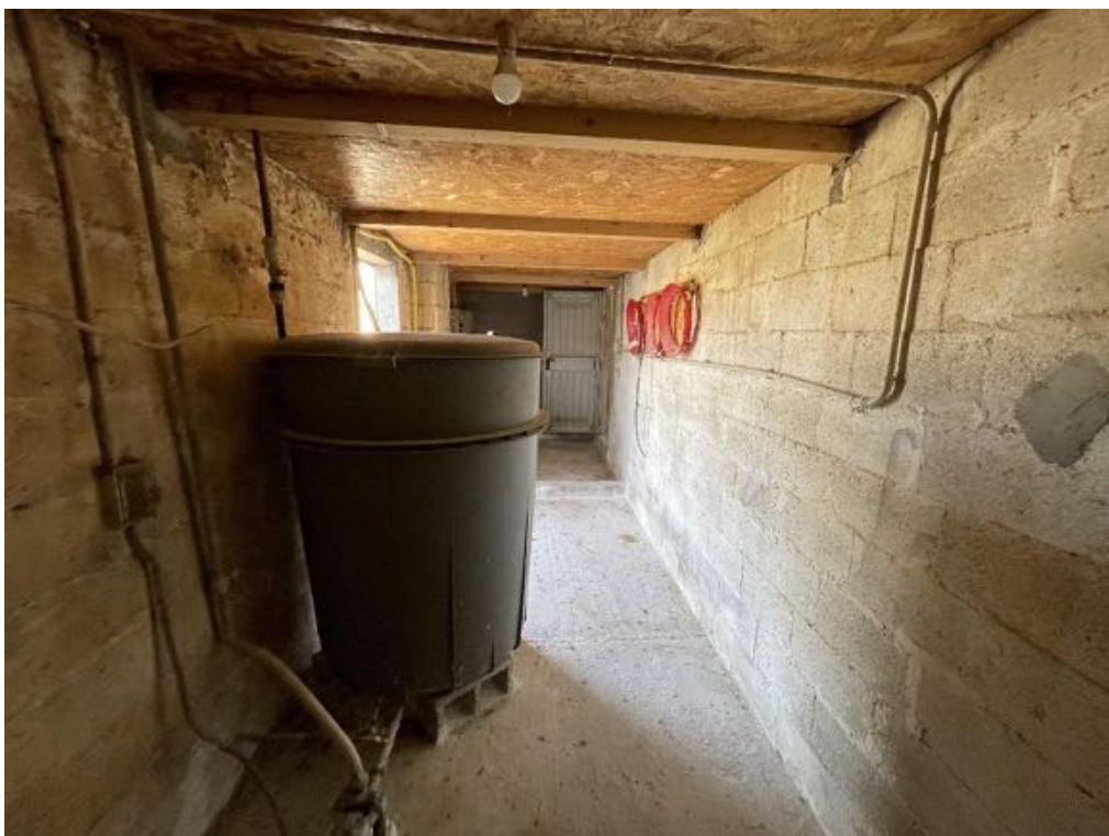
Capannone agricolo n. 3 - Vista interna (Foto 3)