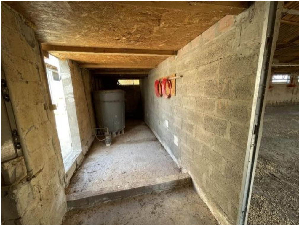
Capannone agricolo n. 2 - Vista interna (Foto 4)