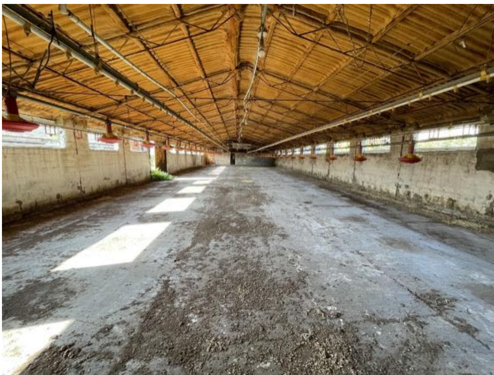
Capannone agricolo n. 2 - Vista interna (Foto 2)