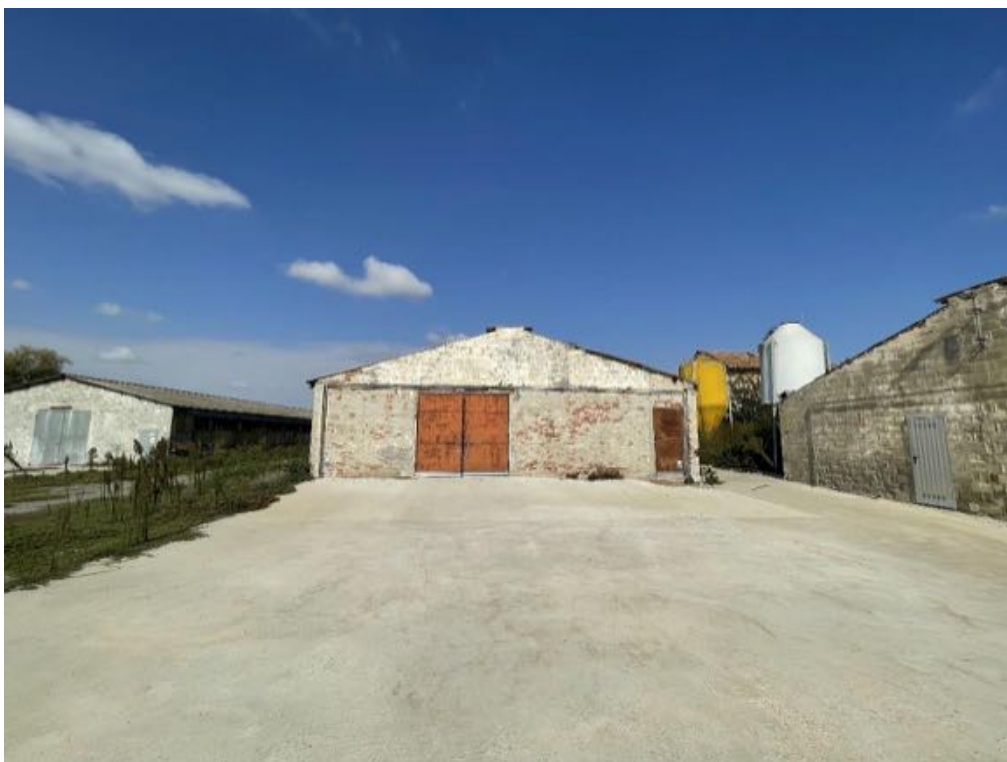
Capannone agricolo n. 1 (Foto 2)