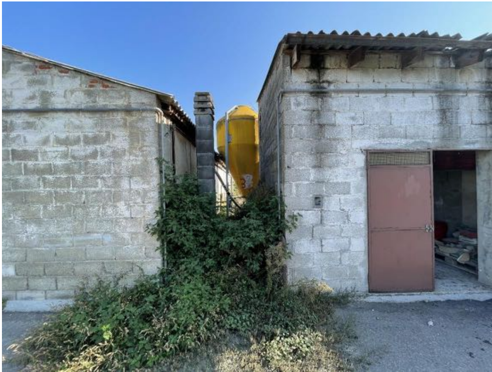
Capannone agricolo n. 3 (Foto 3)