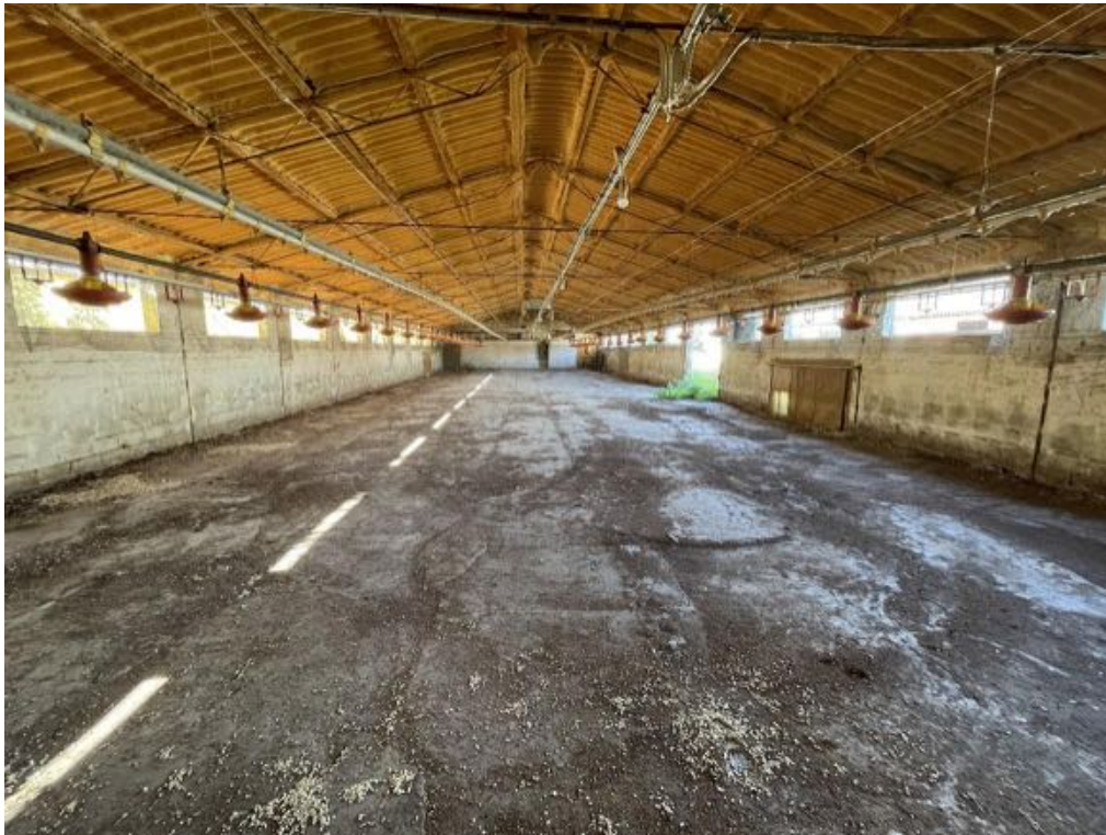
Capannone agricolo n. 3 - Vista interna (Foto 2)