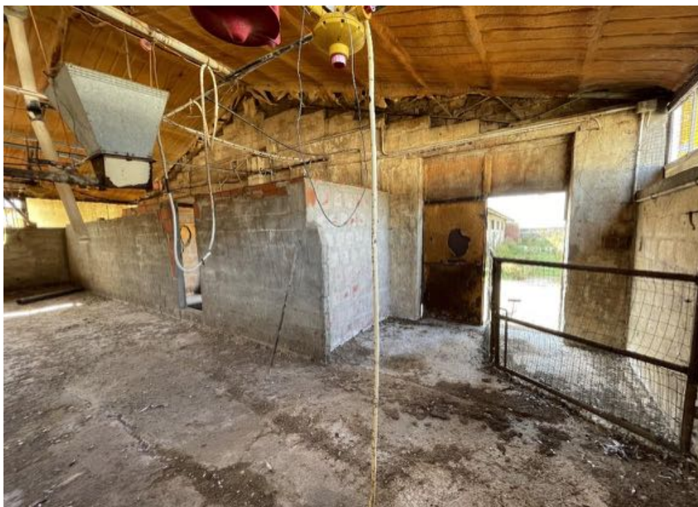
Capannone agricolo n. 5 - Vista interna (Foto 3)