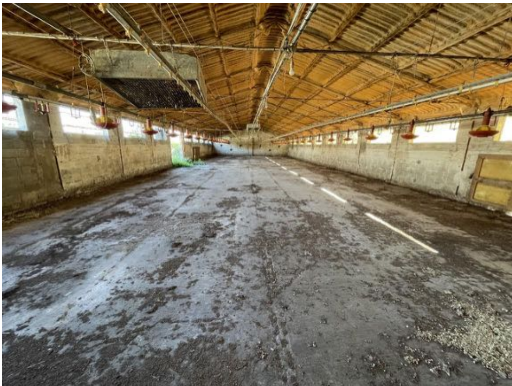
Capannone agricolo n. 3 - Vista interna (Foto 1)