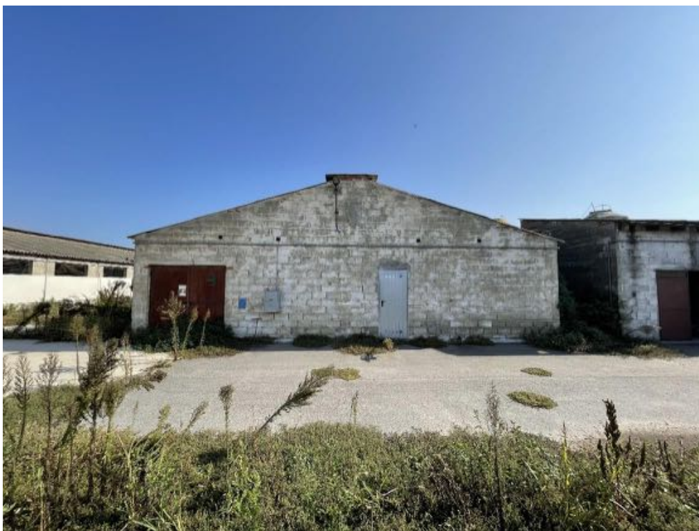
Capannone agricolo n. 3 (Foto 2)