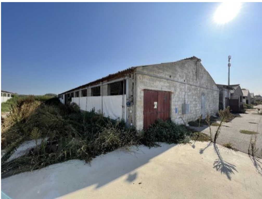
Capannone agricolo n. 3 (Foto 1)