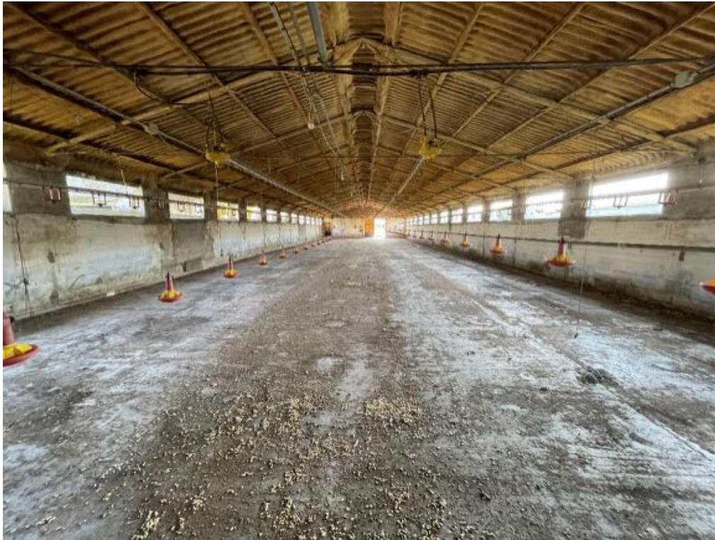
Capannone agricolo n. 1 - Vista interna (Foto 2)