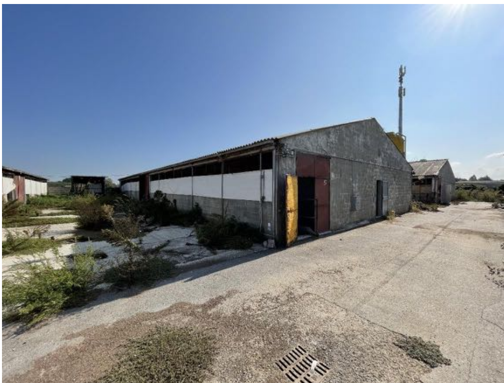
Capannone agricolo n. 5 (Foto 1)