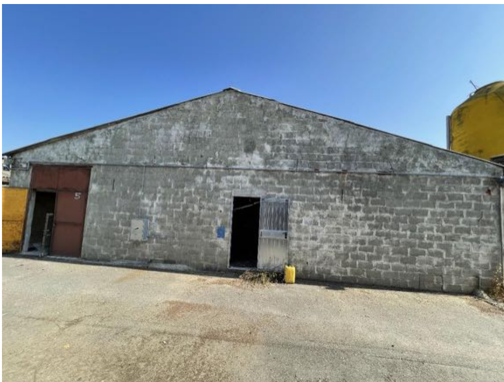
Capannone agricolo n. 5 (Foto 2)