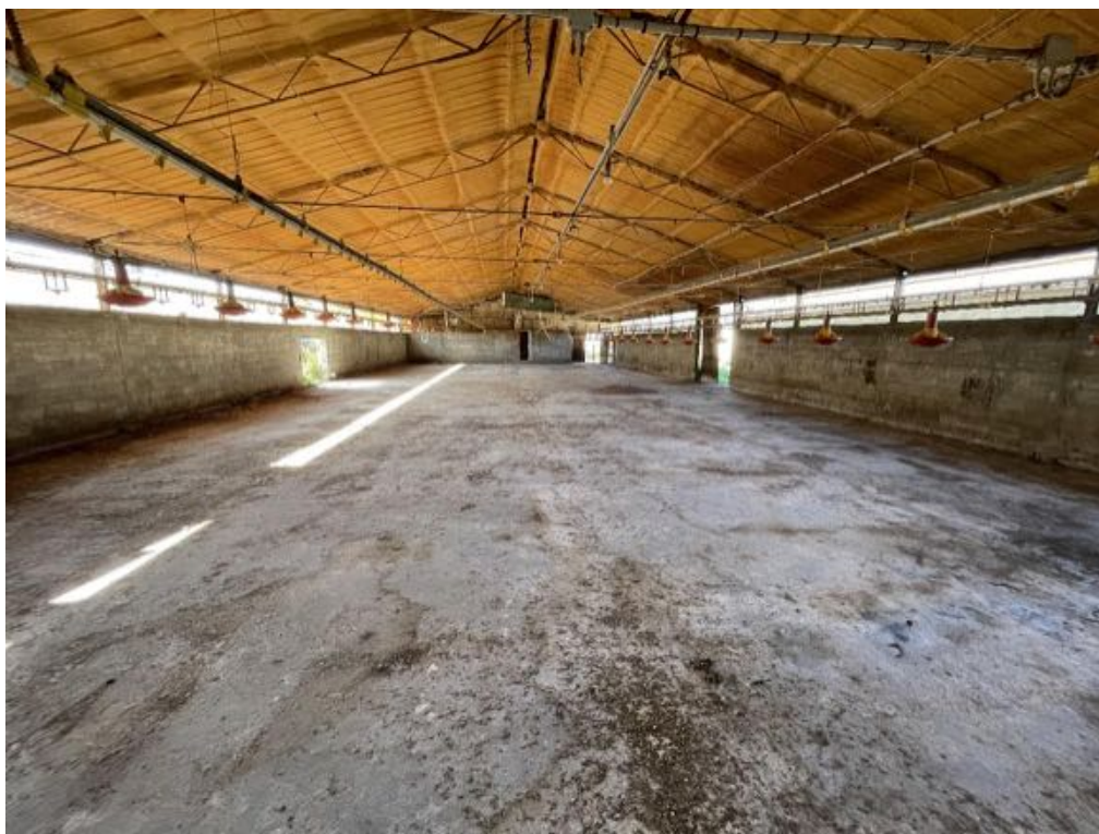
Capannone agricolo n. 5 - Vista interna (Foto 2)