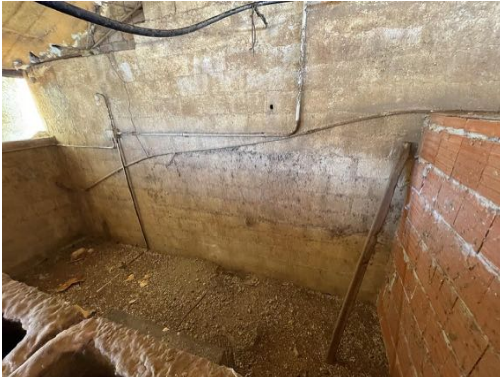
Capannone agricolo n. 5 - Vista interna (Foto 4)