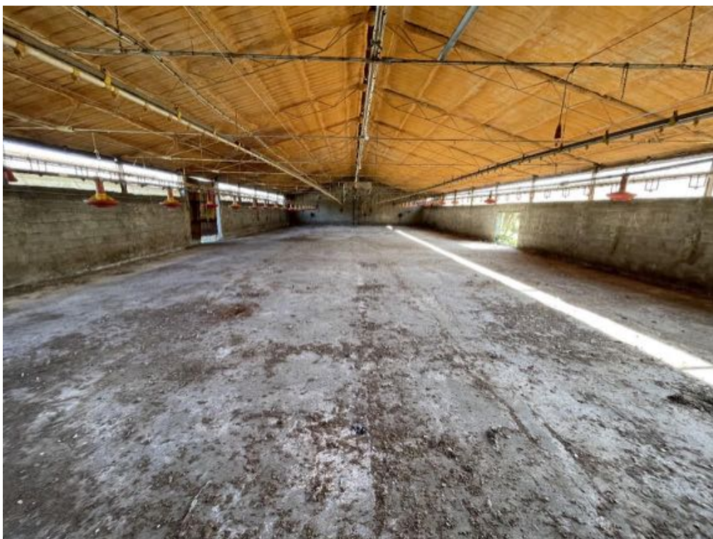
Capannone agricolo n. 5 - Vista interna (Foto 1)