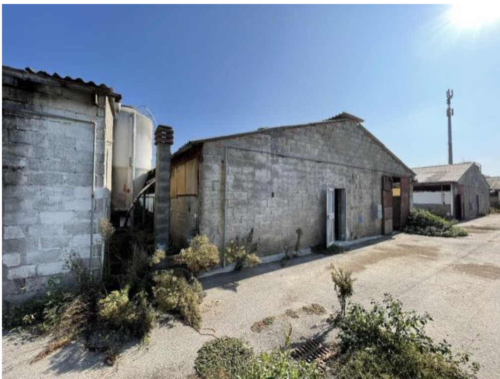
Capannone agricolo n. 4 (Foto 1)