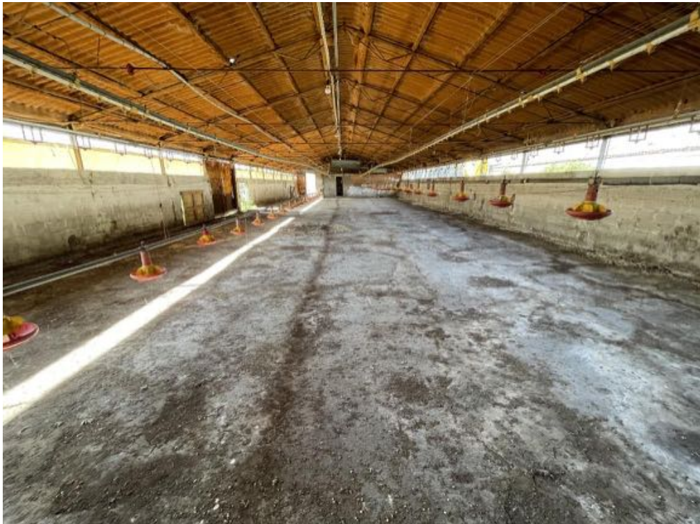
Capannone agricolo n. 4 - Vista interna (Foto 2)