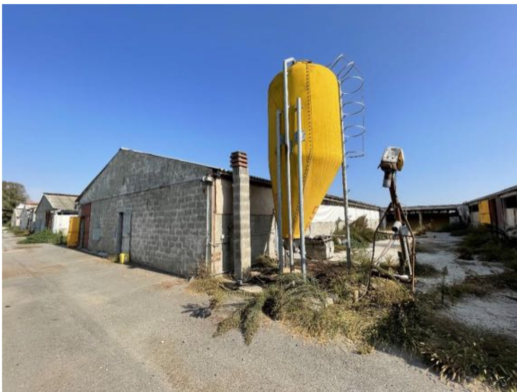
Capannone agricolo n. 5 (Foto 3)