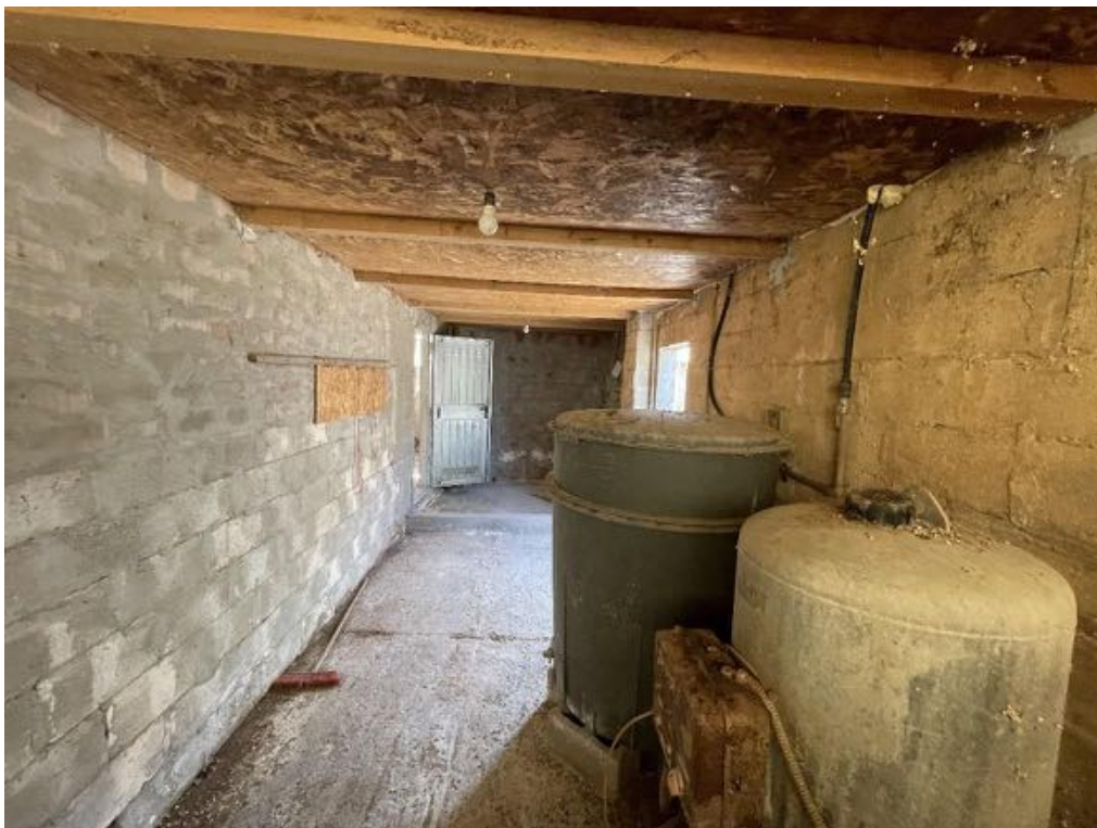
Capannone agricolo n. 4 - Vista interna (Foto 3)