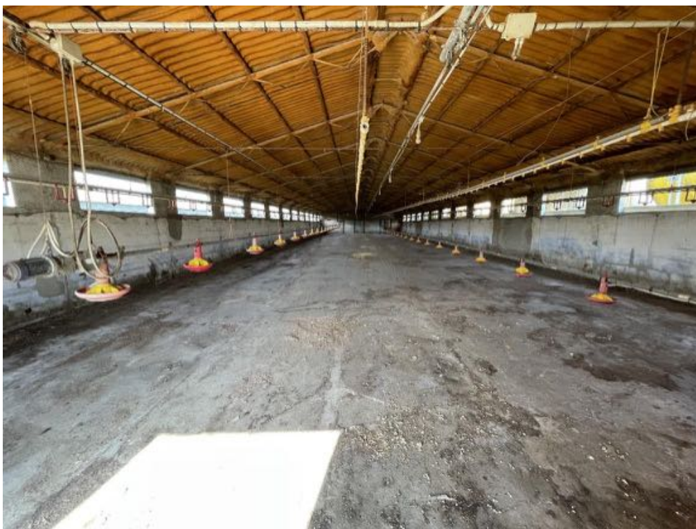
Capannone agricolo n. 1 - Vista interna (Foto 1)