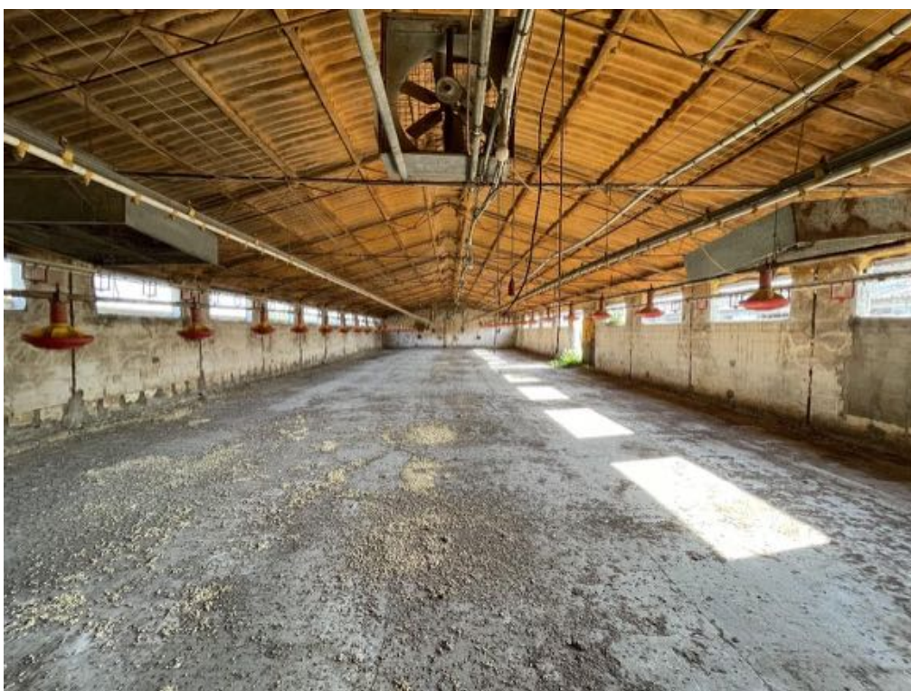
Capannone agricolo n. 2 - Vista interna (Foto 1)