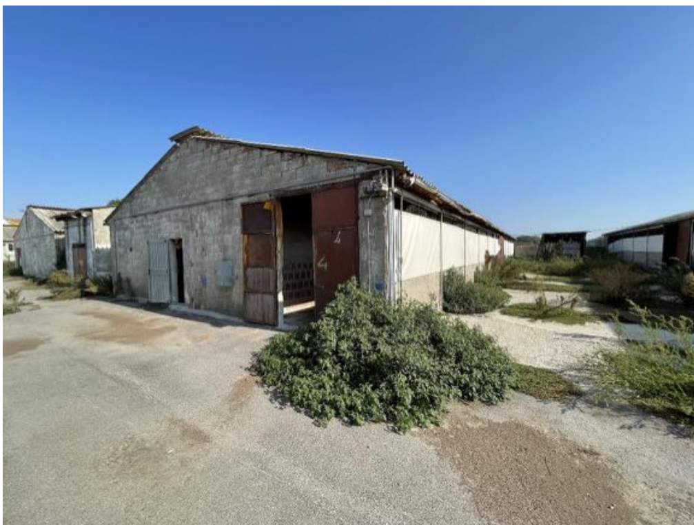
Capannone agricolo n. 4 (Foto 3)