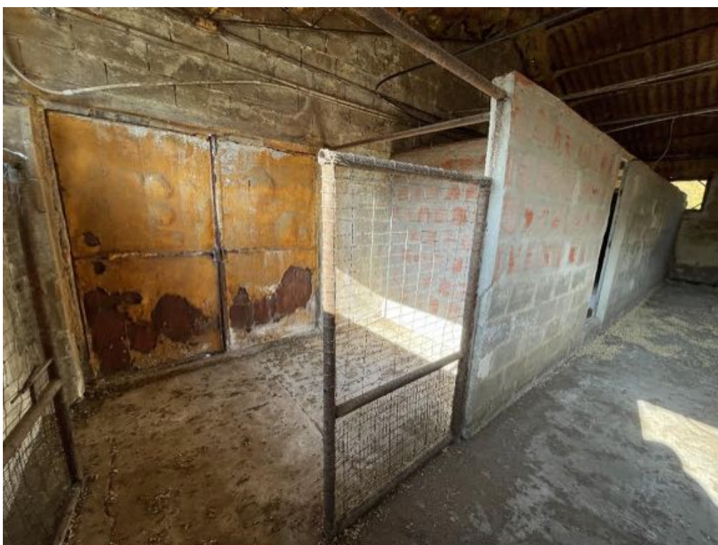
Capannone agricolo n. 2 - Vista interna (Foto 3)