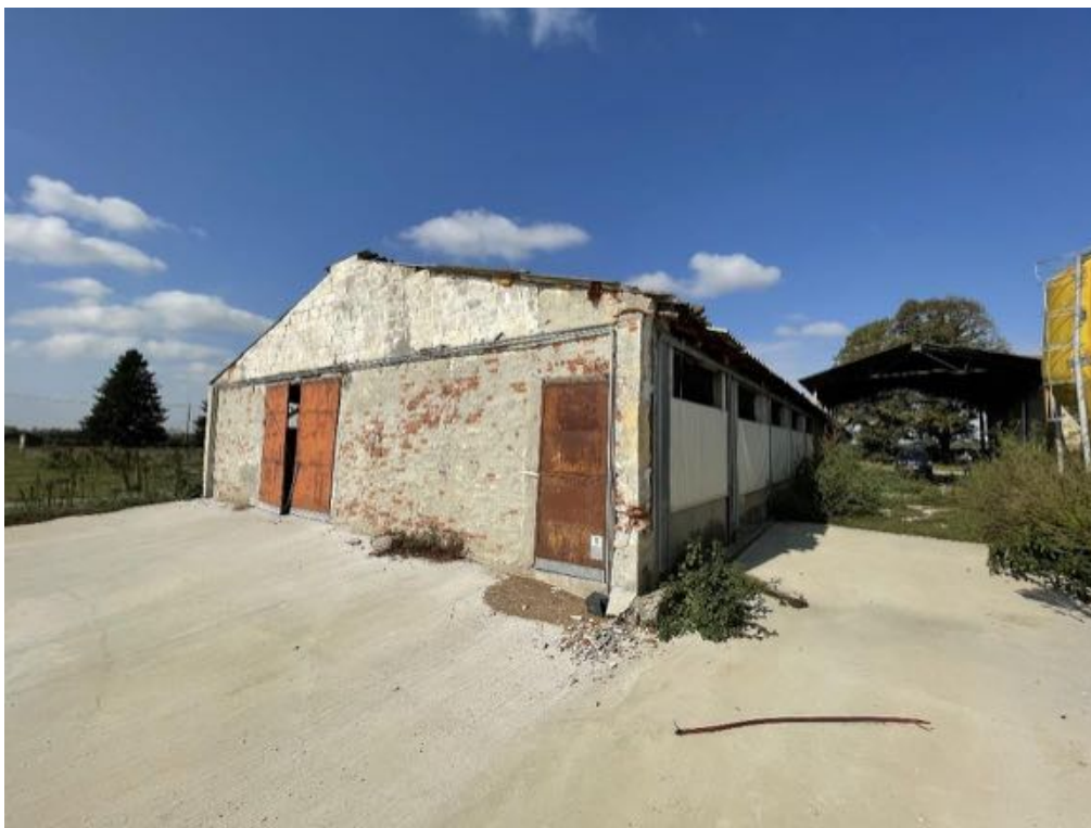
Capannone agricolo n. 1 (Foto 3)