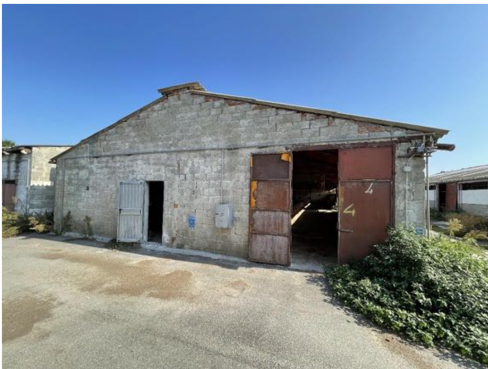
Capannone agricolo n. 4 (Foto 2)